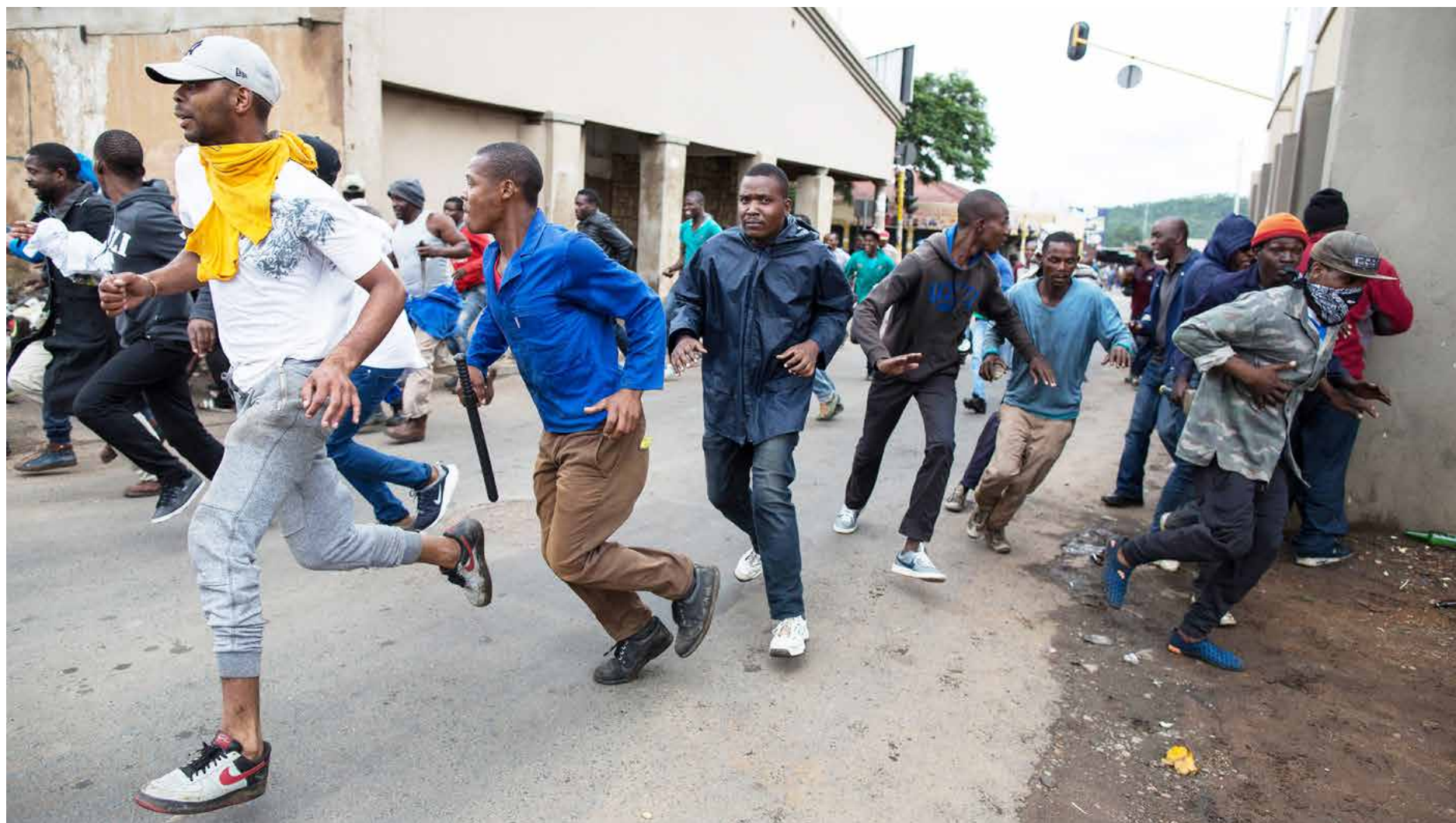
Sørafrikanere på krigsstien under en protestmarsj mot utlendinger. Flere forretninger ble plyndret i kaoset.