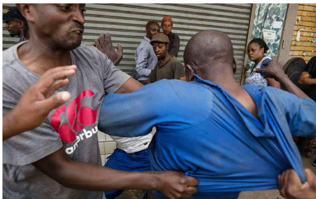
Sørafrikanere angriper en nigeriansk mann utenfor en kirke. Angrepet skjedde en uke før en varslet «protestmarsj mot ulovlige immigranter» i hovedstaden Pretoria.