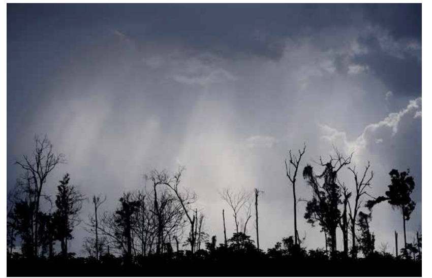
Organisasjonen Environment Defense Fund, der sju av åtte ledere tjente 2,5 millioner kroner eller mer, har som mål å bidra til økte private investeringer i skogbeskyttelse. Bildet er fra Amazonas.

→ bidra til økte private investeringer i skogbeskyttelse.