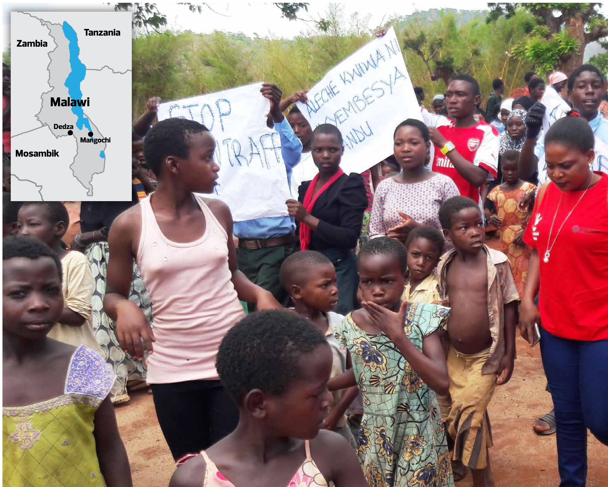
Demonstrasjon mot menneskehandel i den malawiske landsbyen Majuni, ved grensen til Mosambik. Mange fattige blir lurt til å tro at de skal tjene gode penger, men ender som tvangsarbeidere på store gårder i nabolandet, som ubetalte hushjelper eller som prostituerte.