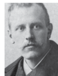
Fridtjof Nansen, havforsker, polarhelt og nødhjelpsarbeider.

Det aller første toktet for blir et sammenhengende maratontokt langs hele den vestlige afrikakysten, fra Marokko til Sør-Afrika. Vandrende fiskebestander av sardin, sardinella, ansjos og makrell, som gjerne smetter inn og ut av ulike lands økonomiske soner, skal måles.