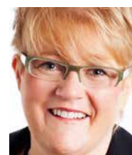
Trine Skei Grande, Venstre-leder.

– For eksempel ønsker vi at det nye regelverket åpner for å gi bistand til kvinnenettverk som vil forebygge at barn radikaliseres, og for at tiltak til utdanning og jobbskaping kan inngå i mer helhetlige tiltakspakker mot ekstremisme. Dette er det enighet om i DAC, skriver utenriksministeren i sitt svar. ■