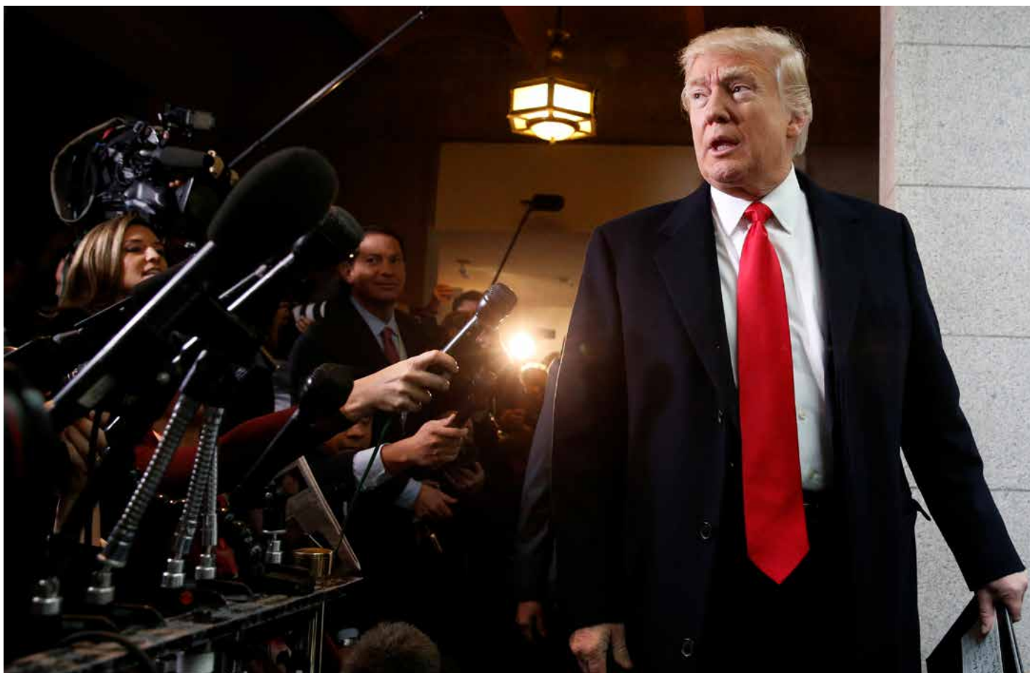
President Donald Trump mener USA bør gjennomføre kutt i landets bistand. De foreslåtte kuttene er på størrelse med to norske bistandsbudsjetter.