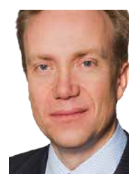
Børge Brende, utenriksminister.

«Komiteens flertall, (...), forutsetter at regjeringen følger opp en sterk norsk tradisjon om å gå imot utvanning og liberalisering av hva OECD skal godta bokført som offentlig utviklingshjelp (ODA).»