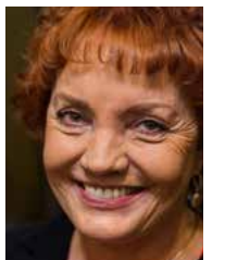
Marit Nybakk, utenriksminister.

Nybakk sier at hun trolig vil stille spørsmål om saken i spørretimen på Stortinget slik at hun kan få vite hva utenriksministeren mener om høye lederlønninger i organisasjoner Norge støtter.