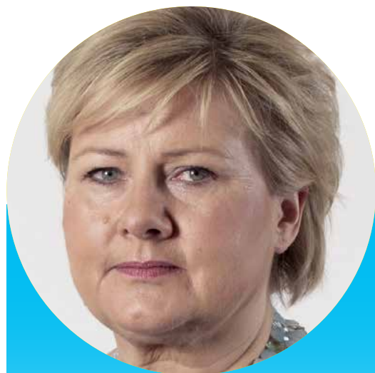
Statsminister Erna Solberg Lønn: 1,55 mill. kr

N orske bistandspenger går til et stort antall internasjonale ikke-statlige organisasjoner. Om lag 80 ulike organisasjoner får Norad-støtte, mens noen også får UD-støtte. Norad-bevilgningen utgjør til sammen rundt 500 millioner kroner årlig, blant annet fra budsjettposter som er øremerket kvinnevern, arbeid og klima/skog.