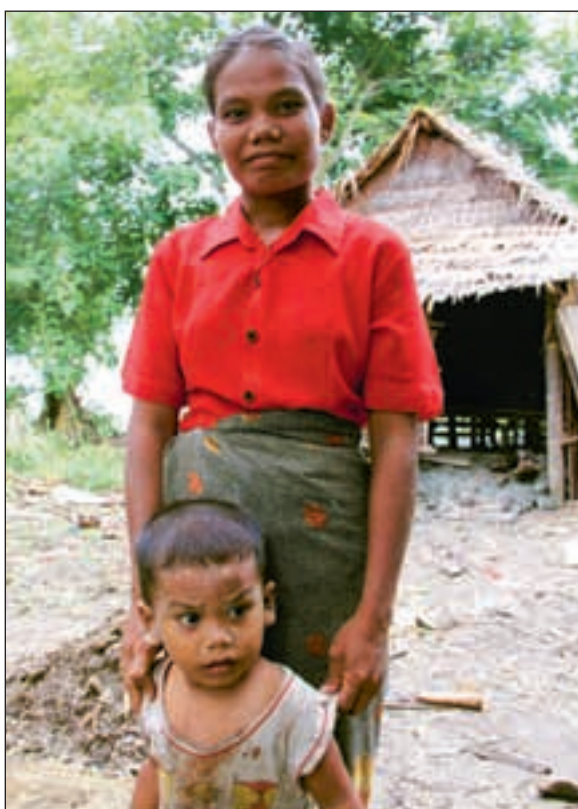
Ofrene etter syklonen Nargis i 2008 mistet alt de eide og lever fortsatt i den ytterste fattigdom.

Ved en feiltakelse får pressen være tilstede under Solheims møte med ministeren. Jeg slår meg ned med et Canon-kamera og notatblokk på en stol ved veggen i