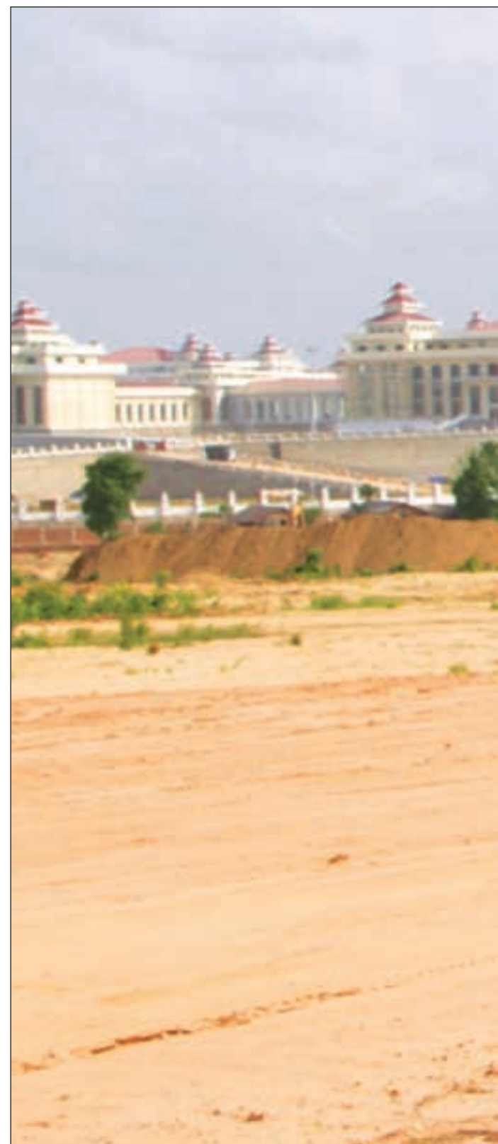
Utviklingsminister Erik Solheim foran det enorme bygningskomplekset som