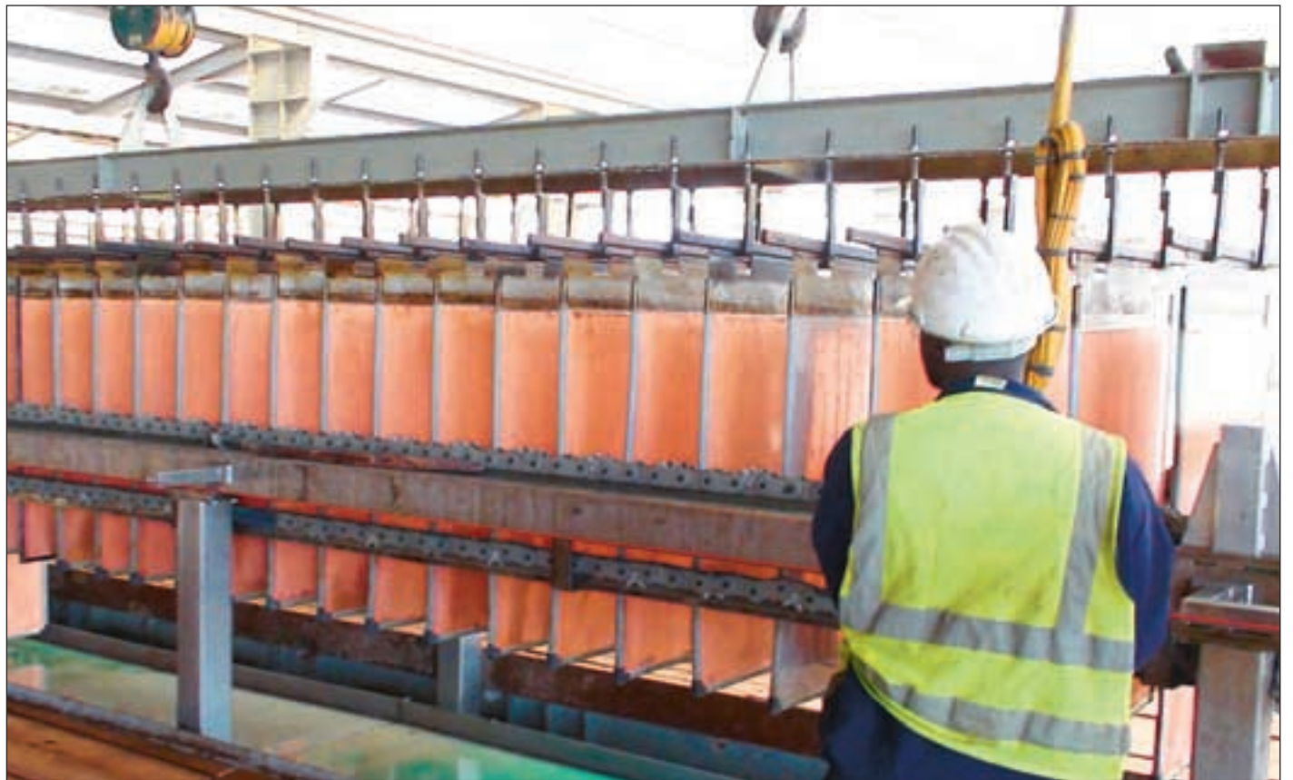
Zambia er en av verdens største kobberprodusenter. Nå ønsker landet å hente inn større skatteinntekter fra gruvesektoren.

Store volumer. - Med tiden vil nok alle selskapene betale skatt, og derfor er det klart at vi trenger mer