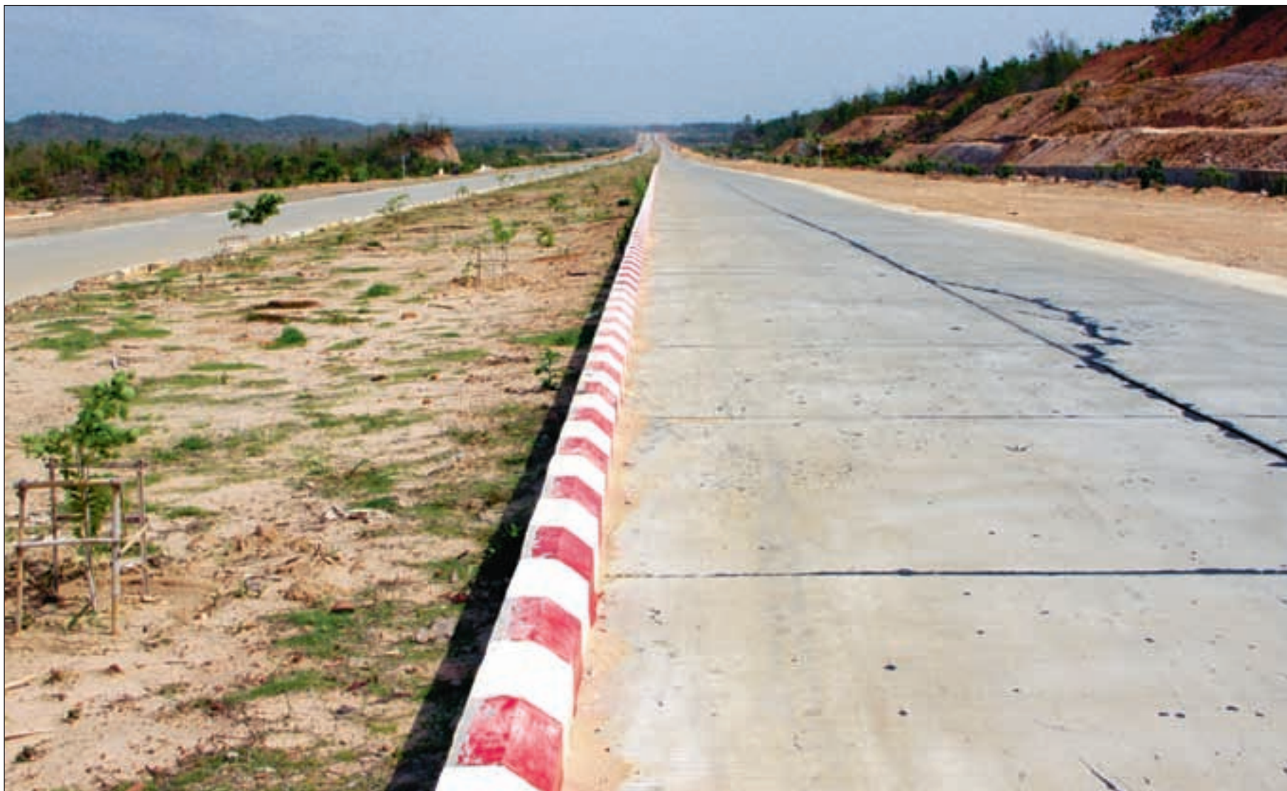
30 mil med kostbar tofelts motorvei forbinder Rangoon (Yangon) med den nye hovedstaden Naypyidaw, men det finnes knapt nok et kjøretøy på veien.