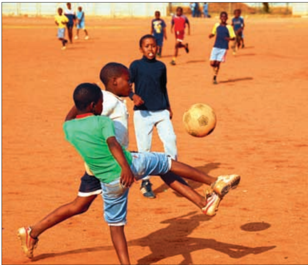
Fotball er en folkesport i hele Afrika, men de viktigste kampene har en tendens til å bli forlystelse for de rike. Heldigvis er det nok av plass til publikummere på de lokale kampene.

Brasil vant lett 5-1 over vårt landslag Taifa Stars, men det var bare de mest bemidlete som hadde råd til å kjøpe billett til kampen. Billettene kostet fra 300 kr til 2000 kr. Det er priser langt utenfor rekkevidde for den gjennomsnittlige tanzanier. I Zimbabwe var billettprisene nede i 60 kroner for de billigste billettene, og fotballinteresserte tanzanier raste over denne forskjellsbehandlingen. For mange kriserammede zimbabwere var nok sikkert også denne prisen i høyeste laget.