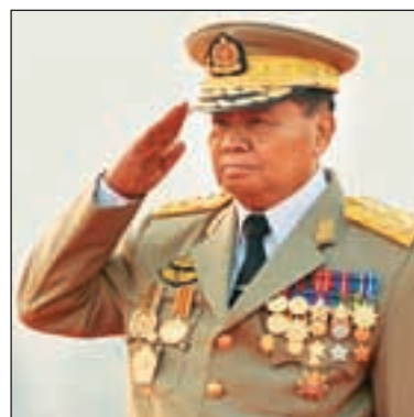
Burmas leder general Than Shwe er klar for å trekke seg tilbake etter 18 år, men har sikret de militære fortsatt dominans i landets politiske liv.

Burmas generaler bygger overgangen til «disiplinert demokrati»