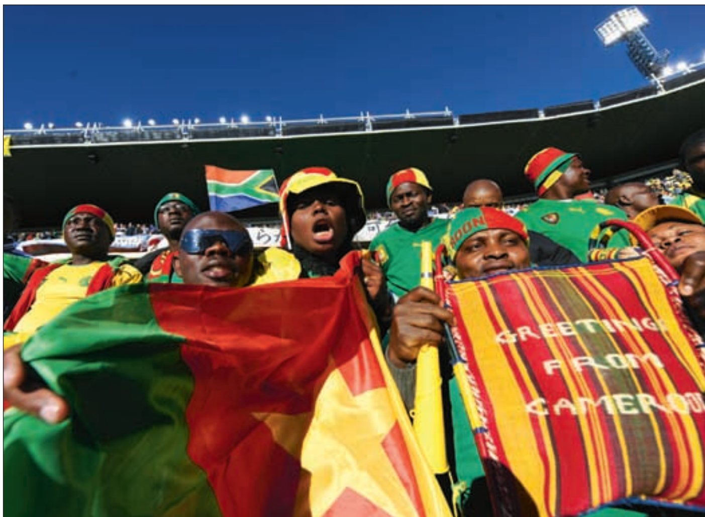
Afrikanske land som Kamerun har slitt med å bygge en nasjonalfølelse. Fotball er blitt viktig for å samle de nye nasjonene.

Afrikas etniske problem. Når Simensen konkluderer med at mange av de vanskelighetene som Afrika sliter med er som forventet, skyldes det en