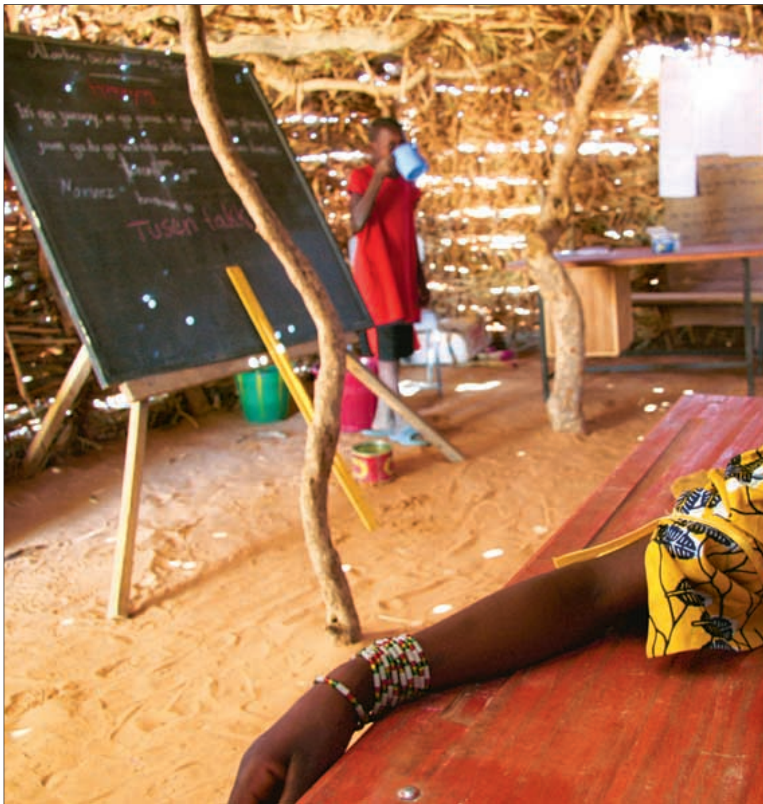
Tusenvis av barn som har falt ut av skolesystemet får nå nye muligheter gjennom Speed Schools. Bildet er fra en Speed School i Niger.