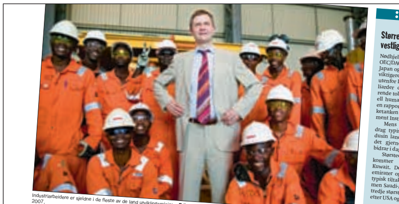
Industriarbeidere er sjeldne i de fleste av de land utviklingsminister Erik Solheim besøker. Her er han sammen med Akker Kværner-ansatte i Angola i 2007.

FOR DET FØRSTE har ikke alle land en middelklasse eller noe industri å snakke om. Nettopp dette kjenner ofte de fattigste landene. Vi kan ikke av den grunn slutte å gi bistand til et land som Niger, hvor flere millioner mennesker nå lever med akutt matmangel. De vet ikke om de vil ha nok mat til å overleve de nærmeste ukene og månedene. Vi har selv snakket med mange fattige kvinner og barn i Niger og andre fattige land som gjennom litt hjelp har fått et langt bedre og mer verdig liv. Det handler om tilgang til helse-tjenester, tilgang til utdanning, opp-