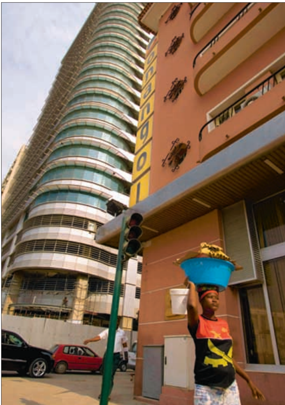
Angola har hatt en kraftig økonomisk vekst de siste årene og blitt viktig også for norske bedrifter. Norsk bistand og engasjement i landets utvikling bør økes, mener artikkelforfatteren. Bildet er fra hovedstaden Luanda.