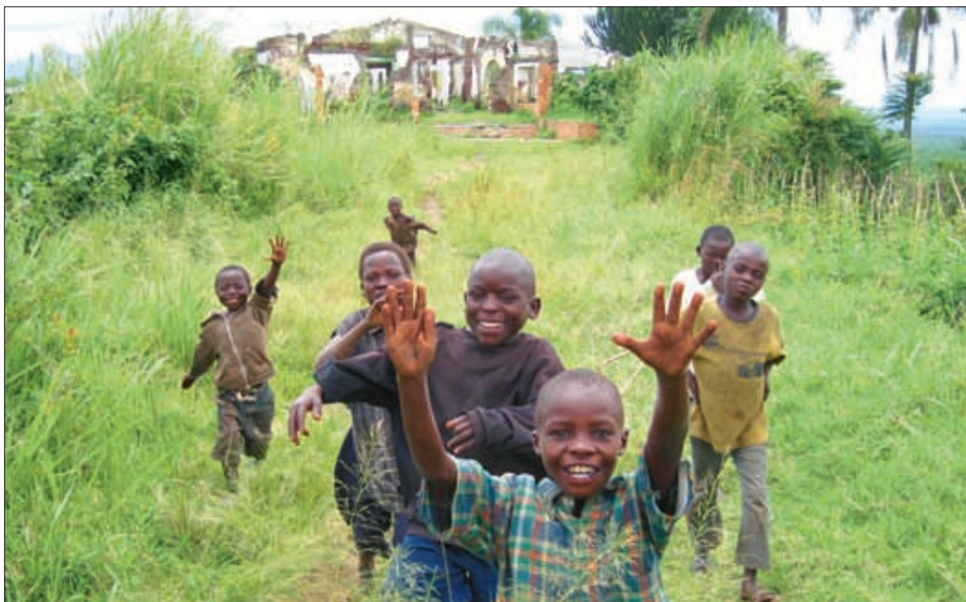
Barn leker foran villaruinene i Katalé.