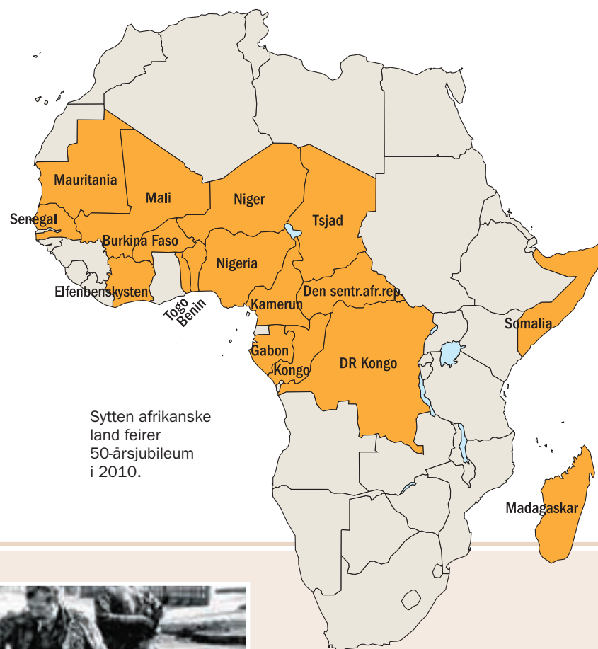
Sytten afrikanske land feirer 50-årsjubileum i 2010.

Belgisk Kongo og de fleste av de franske koloniene i Afrika fikk sin frihet på kort varsel i løpet av 1960. Tre år i forveien hadde britene gitt fra