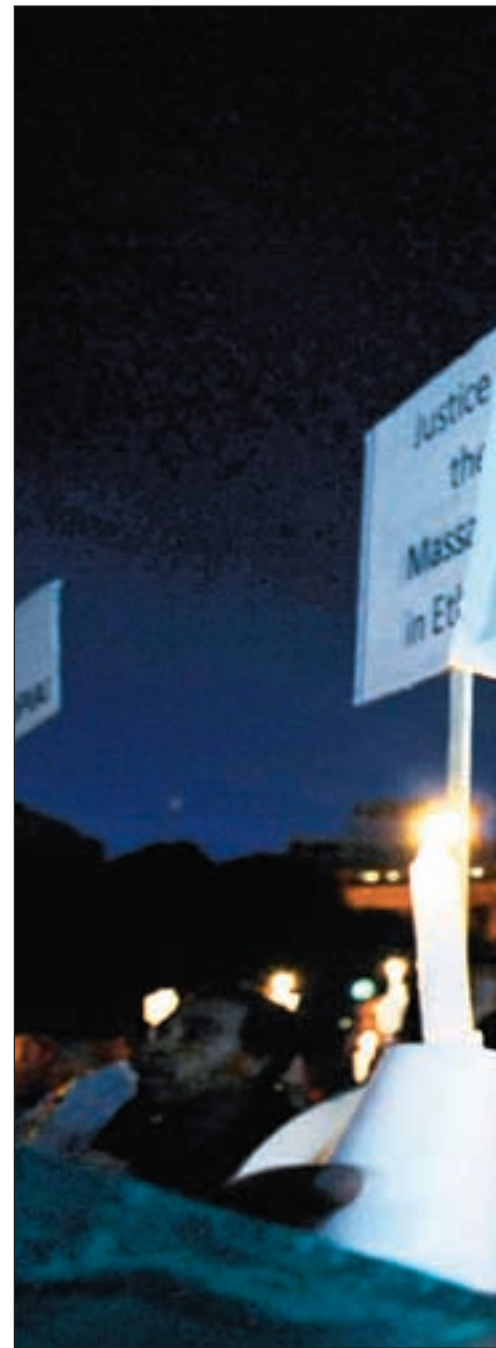
Eksil-etiopiere demonstrerer foran Det hvite hus i Washington.

Han viser til at det foregår brudd på menneskerettighetene i et flertall av verdens stater. – Dessverre skjer det også i utviklingsland vi samarbeider med i kampen mot fattigdom. Det handler ikke alltid bare om dårlig vilje. Like ofte handler det om manglende evne. Da blir det for lett å kreve at Norge skal trekke tilbake bistand til land som har utfordringer, sier Solheim. ■