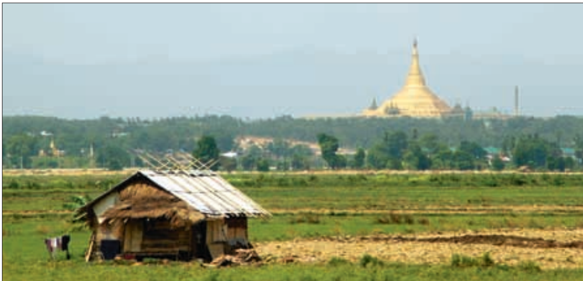
Kontrasten er stor mellom den nybygde gullbelagte pagoden og vanlige folks boligstandard.