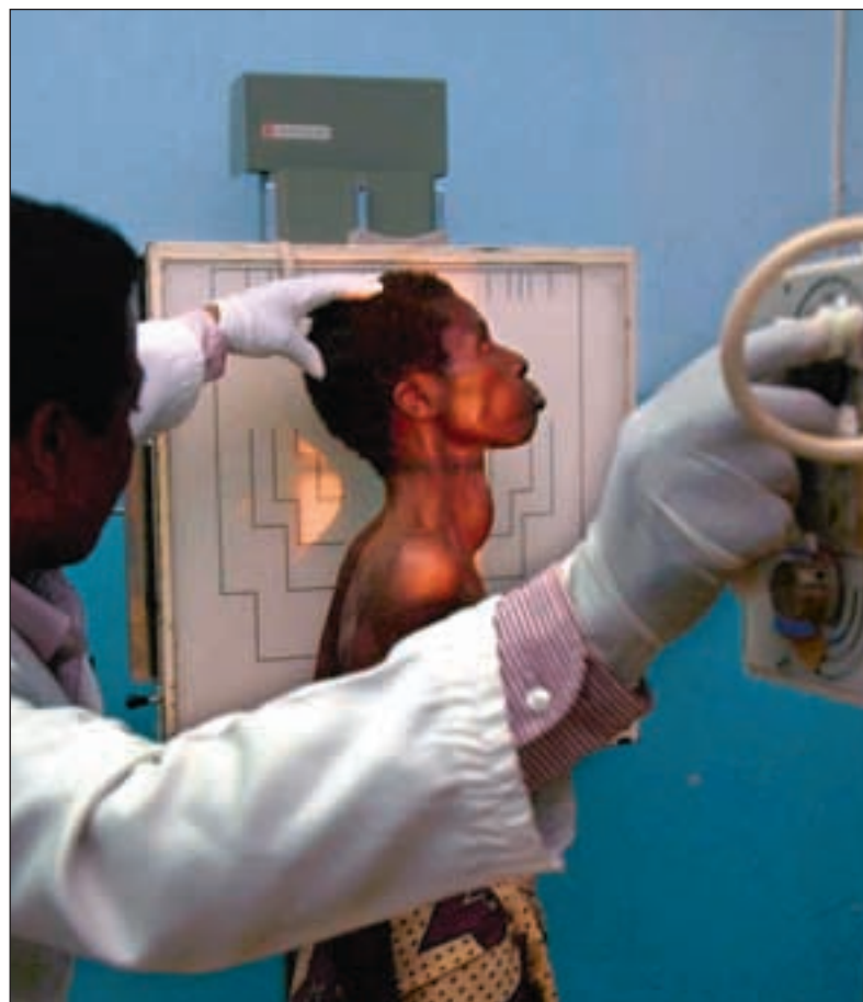
Radiografer fra Afrika er ettertraktet arbeidskraft i flere vestlige land.

WHO's generalsekretær, Margaret Chan, karakteriserte de nye retningslinjene som en «gave til offentlig helse». ■