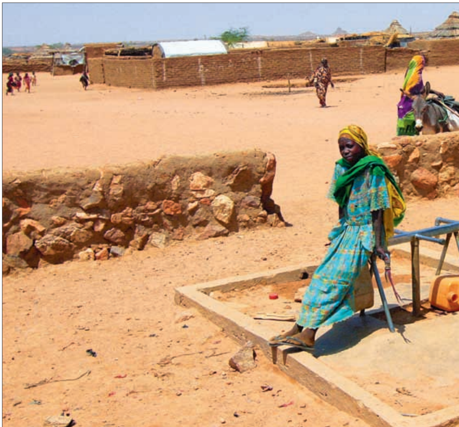
Disse to jentene er tidlig ute for å sikre seg vann, det er flere timer til det kommer vann i krana. Vannmangelen skaper konflikter mellom flyktningene og lokalbe-

Iridimi er en av tolv leire for flyktninger fra Darfur og fremstår på mange måter som en velholdt landsby midt ute i Tsjads karrige ørkenlandskap. Forholdet mellom de over 60.000 flyktningene i denne regionen øst i landet og de nesten like mange fastboende har stort sett vært godt, siden alle i hovedsak tilhører samme etniske gruppe. Men den langvarige tørken de siste årene har medført gnisninger mellom