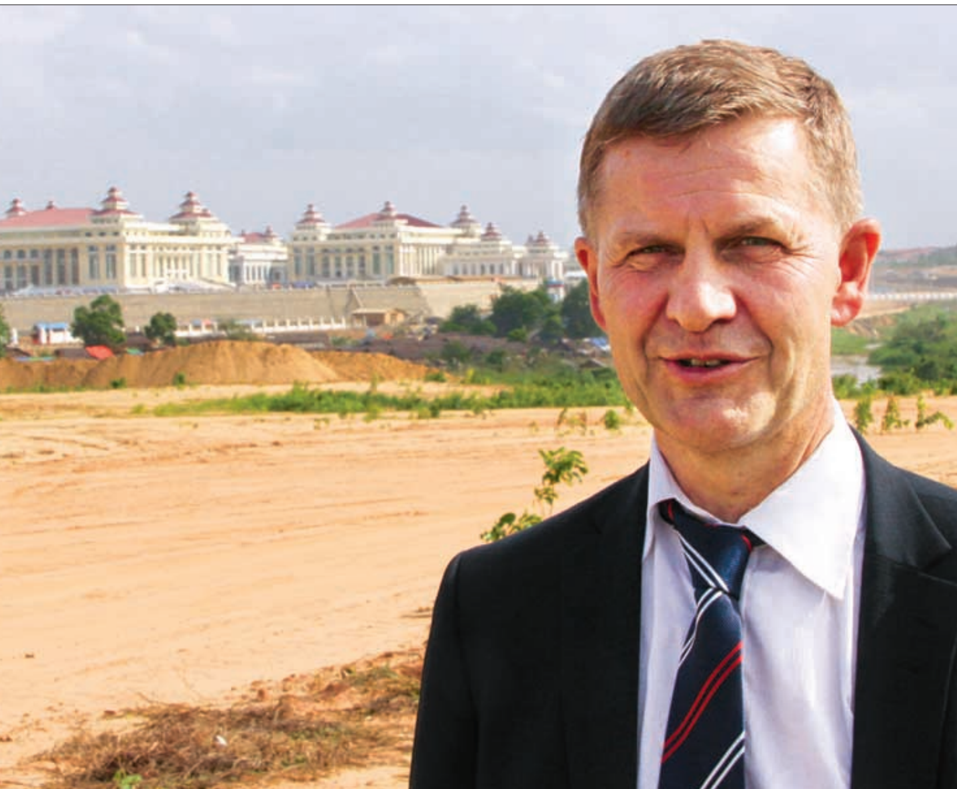
skal romme Burmas nye parlament etter valget til høsten.