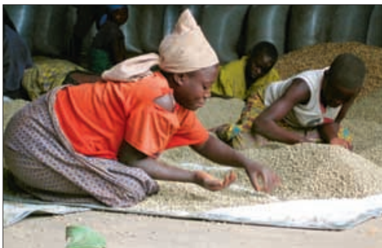
Kvinner sorterer kaffebønner. Kaffen selges til Belgia.