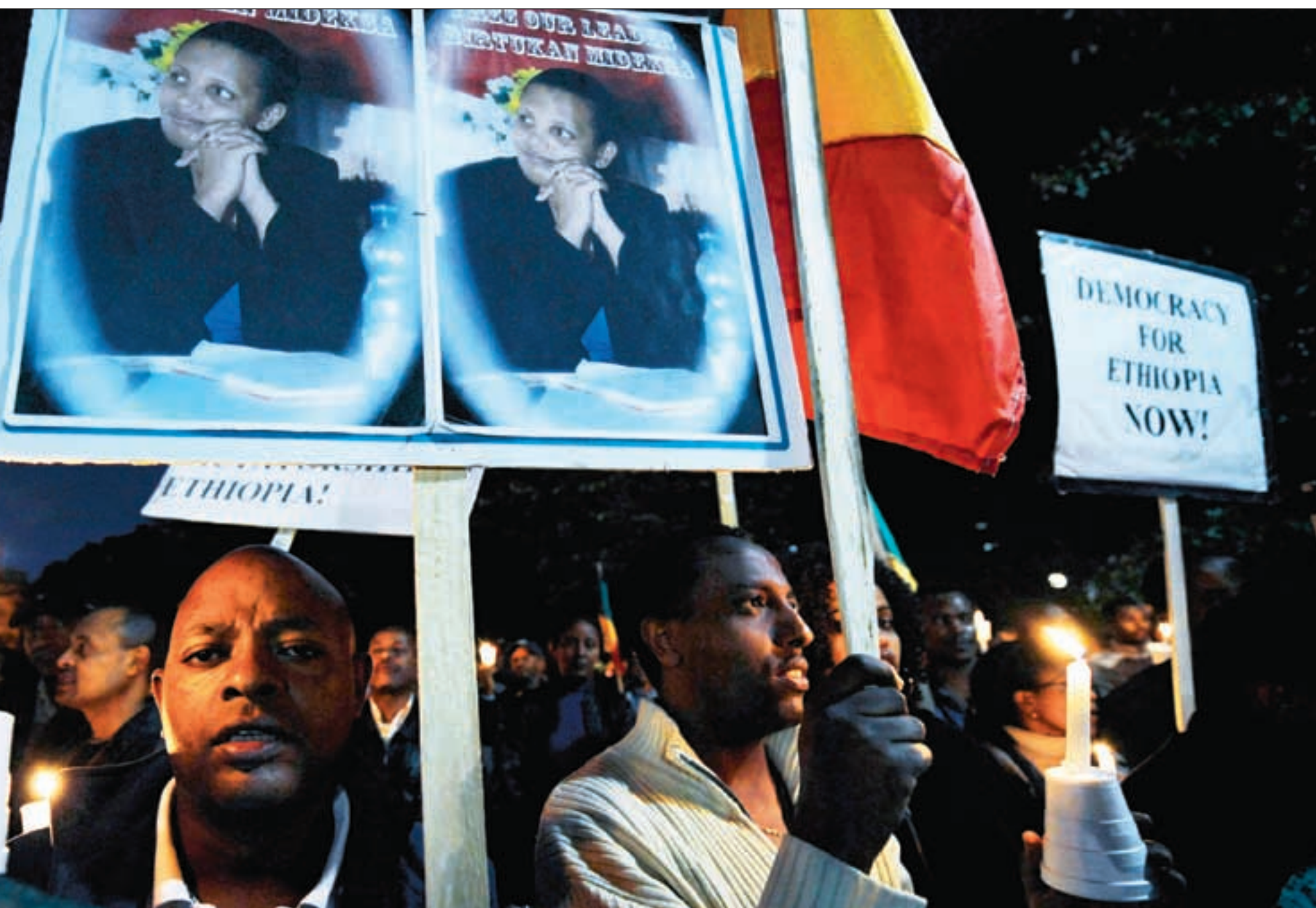
Washington i oktober 2009 med krav om å frigjøre landets politiske fanger.