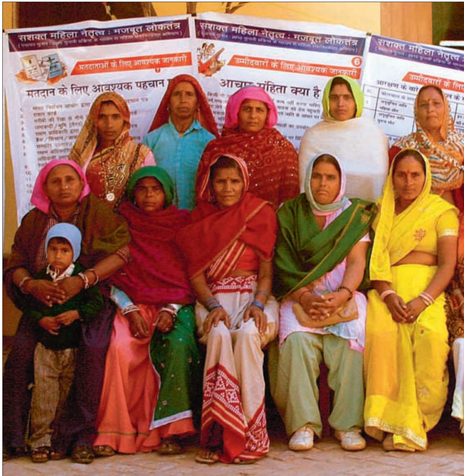
Det er bare to uker siden de ble valgt inn i kommunestyrene i landsbyene sine. Noen for første gang, andre med lang fartstid. Det er ingen enkel jobb, men stolte