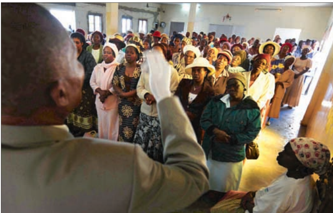
Vi vet for lite om hvilken rolle religion spiller i utviklingsprosesser, mener artikkelforfatteren. Bildet er fra en gudstjeneste i Mosambik.