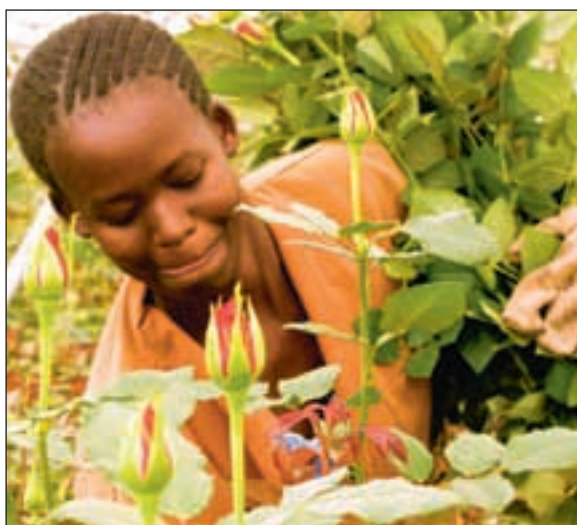
Tidligere hadde roser fra Kenya en toll på 249 prosent. Nå er det null, noe som gir fart i salget.

Nedgangen var større for varer fra Europa, Afrika og Oseania, mens importen fra Asia holdt seg på samme nivå som før, viser tall fra Statistisk sentralbyrå. ■