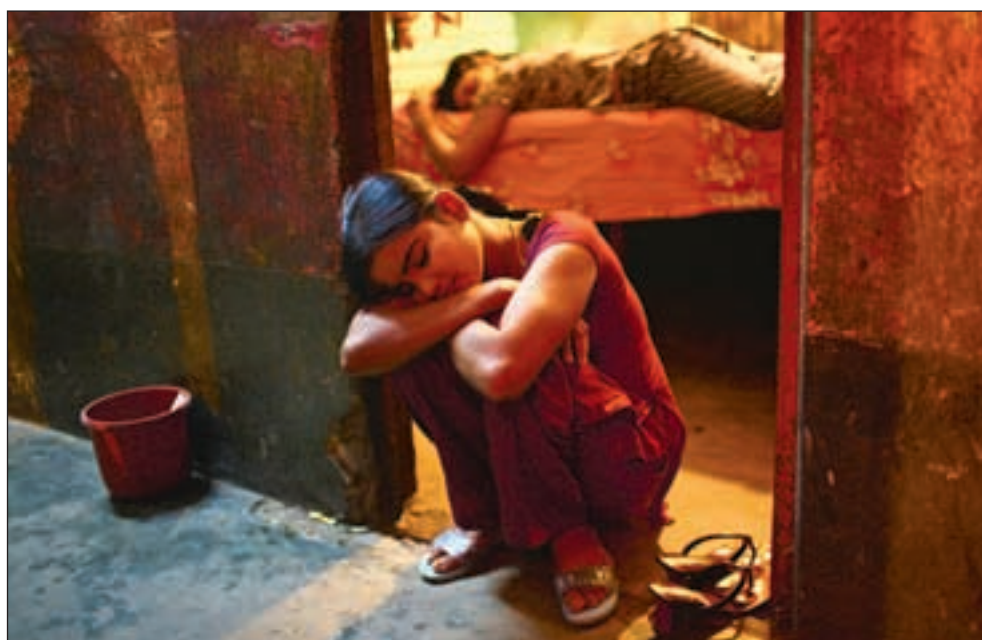
To av jentene på et bordell i byen Tangail tar seg en blund mens de venter på kunder.