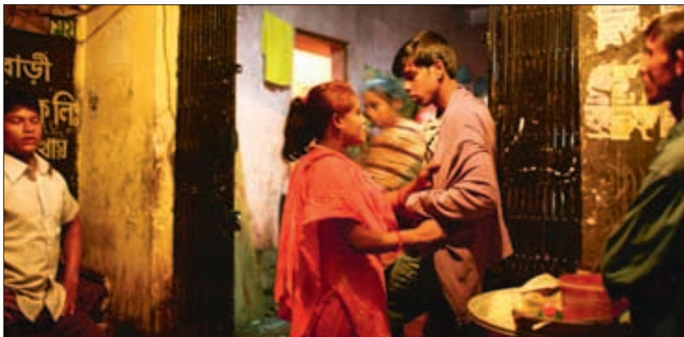
En prostituert prøver å overtale en mulig kunde.