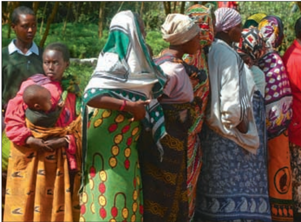
De østafrikanske kanga-tøyene har et rikt meningsinnhold i alle faser av livet.

Når ekteskap inngås er det viktig at kangaene til de to familiene som skal knyttes sammen gjennom ekteskapet kommuniserer noe positivt mot den andre part. Det er også viktig at kangaene til de to familiene «snakker samme språk». Kvinner i de to familiene bør i ukene før bryllupet ha på seg kangaer som sender positive og inkluderende signaler. Signalene tolkes ikke bare ut fra det