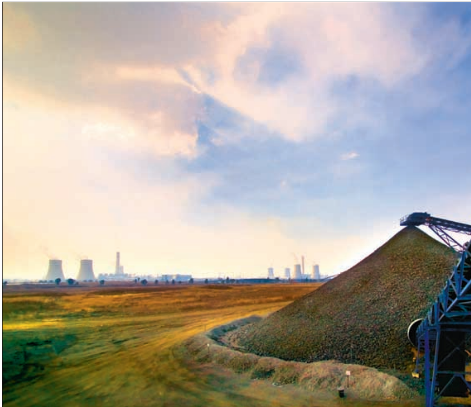
Secunda-anlegget i Sør-Afrika (bildet) er det kull-til-olje-anlegget i verden som forurenses mest. Løfter om bistand til reduksjoner ved dette anlegget kan bli en del av kraftanlegget Medupi.

– Her må det gjøres noe fundamentalt, og vi ber om at Norge stiller veldig klare krav til Verdensban-