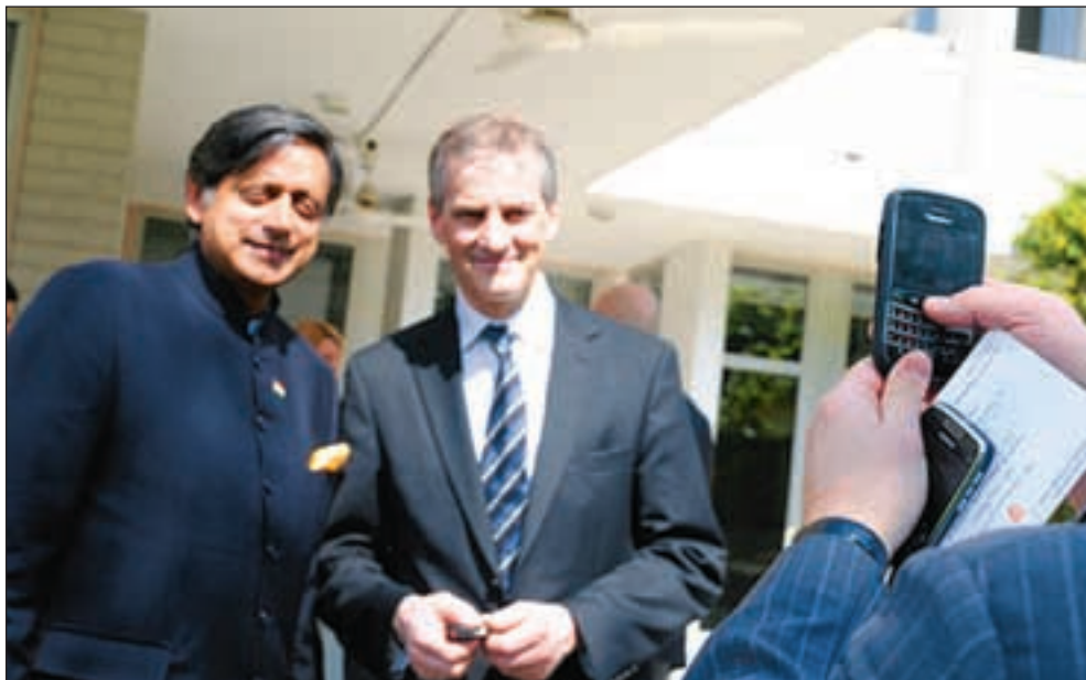
Utenriksminister Jonas Gahr Støre møtte nylig Indias viseutenriksminister Shashi Tharoor , for samtaler om sikkerhetspolitikk og regionale spørsmål i India.

Kinesisk forsker på ambassaden. Ett av de mange tiltakene på skissebordet i UD er å ha en kinesisk forsker på en norsk ambassade for å skrive rapport om forskjeller og lik-