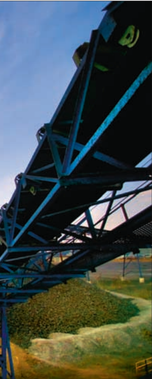
av argumentasjonen for norsk støtte til det nye kullkraftverket.

overføring av teknologi og økt utdanning. Derfor håper de – og ekspertpanelet – at Verdensbanken også vil forplikte seg til økt innsats for fornybar energi.