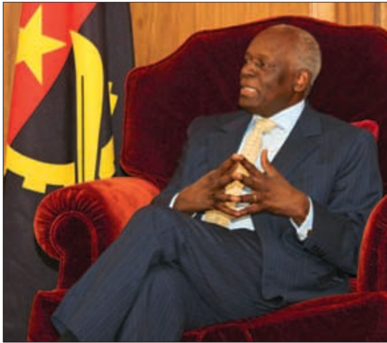
Norske selskaper i Angola bør være mer kritiske til president dos Santos og hans regjering, mener artikkelforfatteren.

I Angola er det ikke norske selskaper som «stiller krav». Det er det mektige regimet de handler med som definerer premissene for fordeling og utvikling. I virkeligheten vil bedriftenes «samfunnsansvar» (CSR) bare kunne gi et forsvinnende lite bidrag i den store sammenheng. Norsk næringsliv støtter sin tilstedeværelse i Angola på troen på konstruktivt engasjement, men det bur-