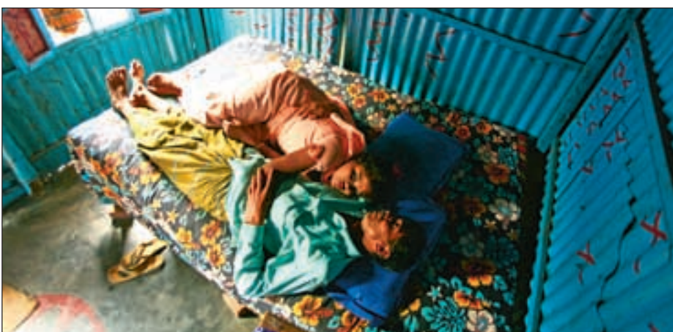
En prostituert sammen med kjæresten sin. Mange av jentene har kjærestere. Ofte er det tidligere kunder som jentene har utviklet et forhold til.