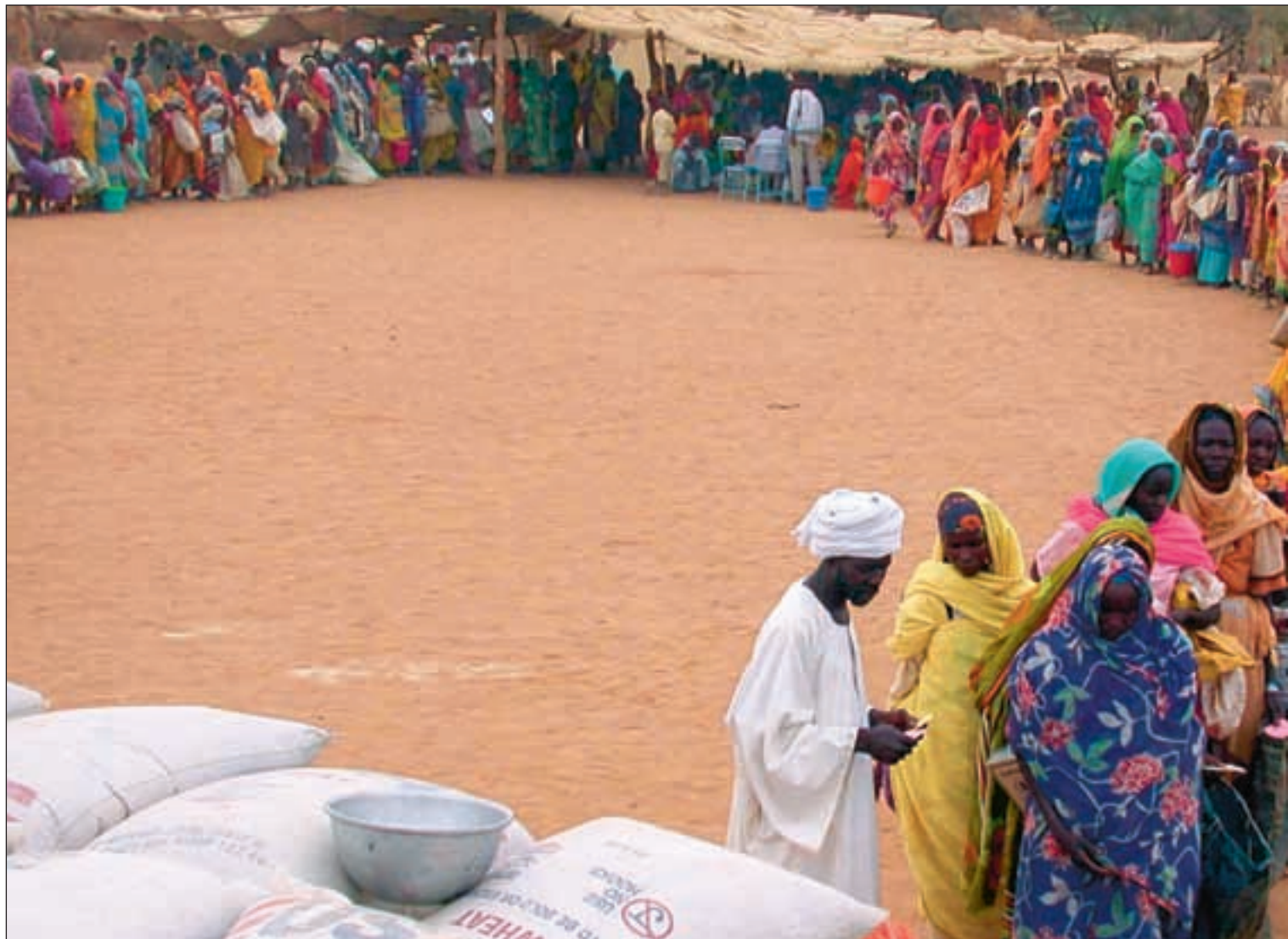
Kvinner i kø for å motta amerikansk matvarehjelp i det nordlige Darfur i Sudan.

Nøytralitet. I disse dager kommer hennes nye omtalte bok «War Games» på norsk under tittelen «Krisekaravanen», en beretning om skyggesidene ved internasjonal bistand i verdens konfliktområder. Det er også et grundig oppgjør med bistandsorganisasjoner som hevder at det er mulig å opptre som en nøytral instans i konfliktområder samtidig som de inngår avtaler med regjeringer, lokale krigsherrer og opp-