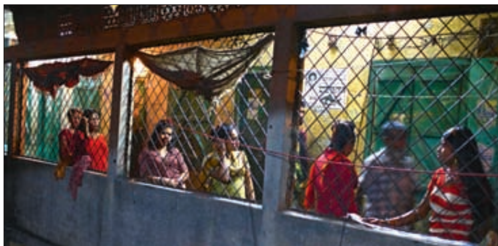
Mange av jentene får ikke lov til å bevege seg fritt, av frykt for at de skal stikke av. Disse jentene får ikke lov til å forlate denne etasjen.