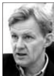
Jan Egeland, NUPI-direktør.

Vi må forberede oss på flere og større katastrofer.