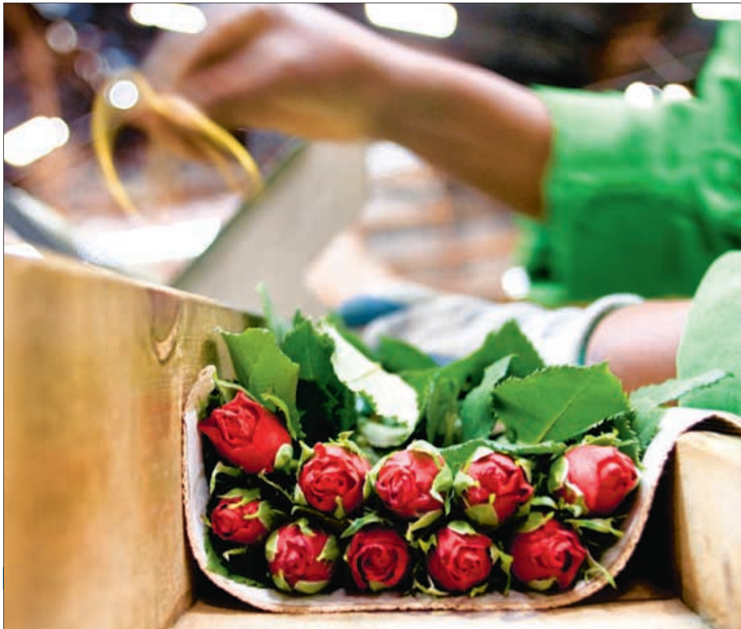
De langstilkede rosene fra kenyanske plantasjer er populære hos norske forbrukere.