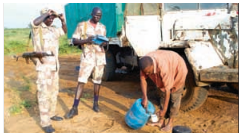
Folk er vant til å ha nærkontakt med SPLAs soldater.

– Giversamfunnet kan bli bedre, blant annet på effektivitet. Men givnerne alene kan ikke skape utvikling her hvis ikke de ansvarlige i Sør-Sudan selv vil, sier Ofstad. ■