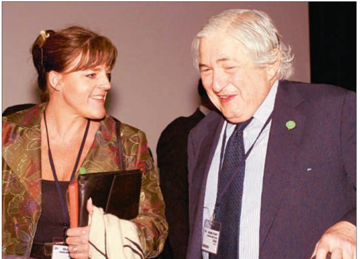
Tidligere utviklingsminister Hilde Frafjord Johnson og Verdensbankens daværende leder James Wolfensohn var blant de som jublet over Paris-erklæringen. Fem år etter er den nesten glemt.

Han mener at det er mange eksempler på land som har tenkt slik