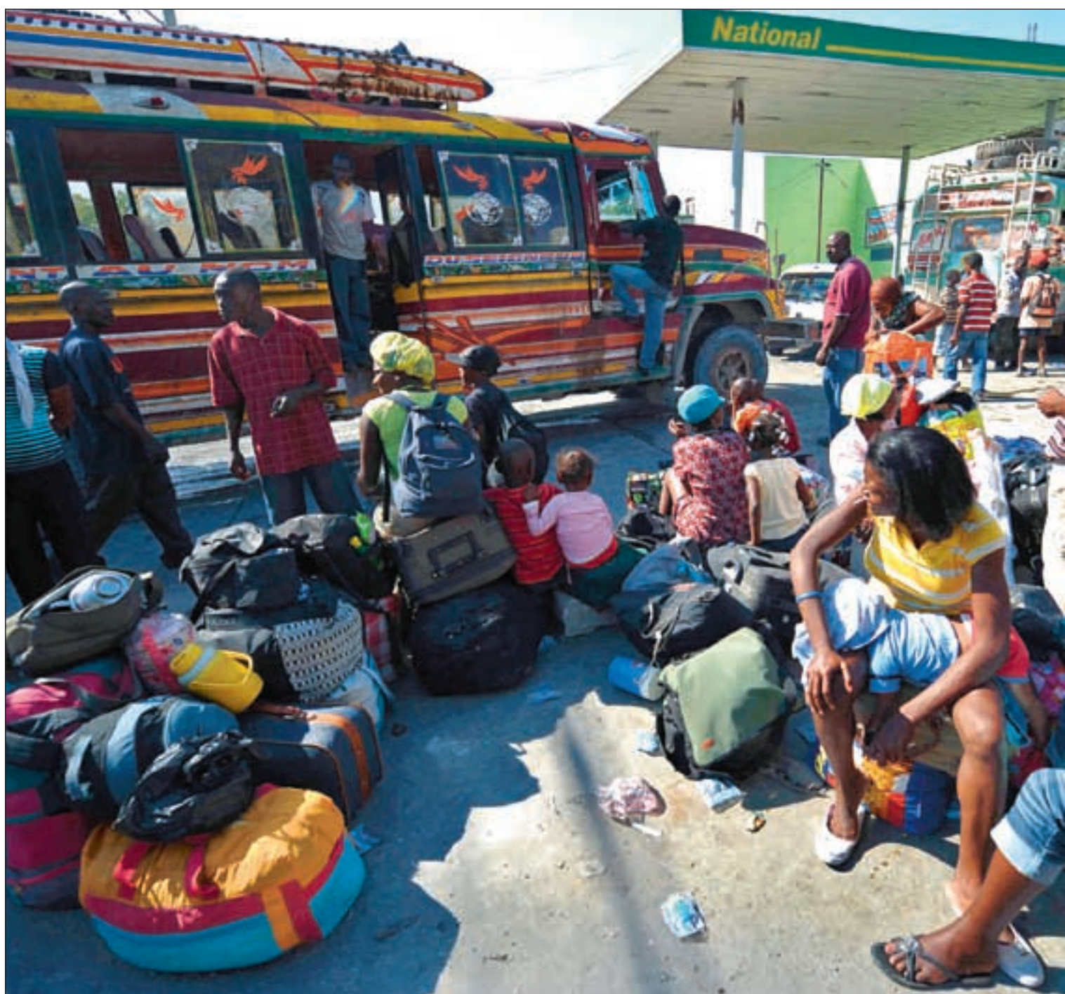
Myndighetene tilbyr gratis transport til folk som vil forlate det jordskjelvrammede hovedstadsområdet.

Jordbruket rasert. Myndighetene og FN har anslått at så mange som 600 000 mennesker har reist fra hovedstaden Port-au-Prince og ut på landsbygda etter skjelvet. Tallet kan