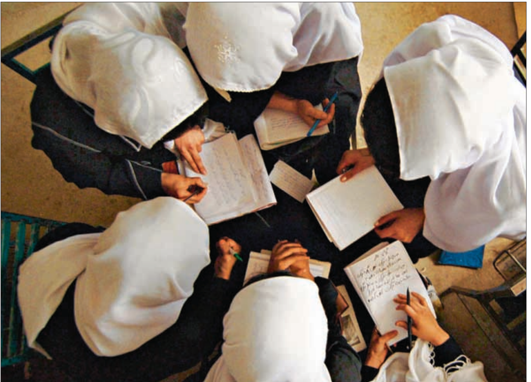
Det norskstøttede utdanningspartnerskapet «Education for All» får kritikk for å ikke nå ut til sårbare stater. Men nå lover leder Carol Bellamy reformer. Bildet er fra en skole i Meymaneh nord i Afghanistan.