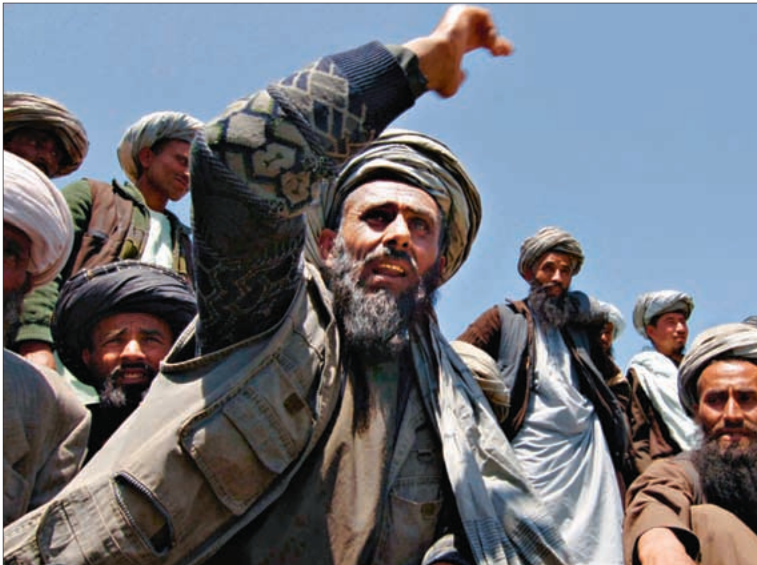
Engasjert diskusjon på en jirga, et meklingsmøte i Faryab-provinsen nord i Afghanistan. Den afghanske regjeringen og USA åpner nå for å inkludere Taliban i poli

Afghanerne gikk lenger enn sine internasjonale allierte i ønsket om å komme Taliban i møte. Men i forkant av konferansen hadde flere internasjonale toppfolk tenkt høyt om mulighetene for å inngå et politisk forlik med Taliban. General Stanley McCrystal, øverstkommanderende for NATOs styrker i Afghanistan (ISAF), uttalte i et intervju med Financial Times at en politisk løsning er «det uunnngåelige resultatet av alle konflikter». På spørsmål om han kunne tenke seg Taliban i en fremtidig regjering i Kabul, svarte han: