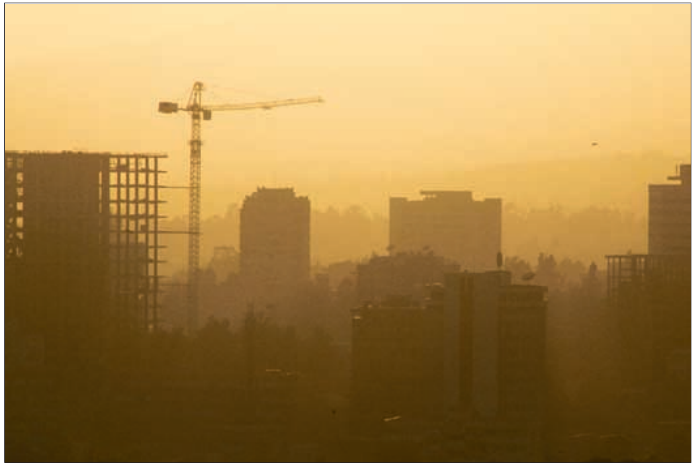
Stillaser og heisekraner preger bybildet i hovedstaden Addis Abeba.

BNP-vekst: 7,0 prosent (estimat) BNP: 31 mrd. dollar (kjøpekraftkorrigert: 71 mrd. dollar) Inflasjon: 15,0 prosent Befolkning: 87 mrd. BNP per person: 350 dollar (kjøpekraftkorrigert: 810 dollar)