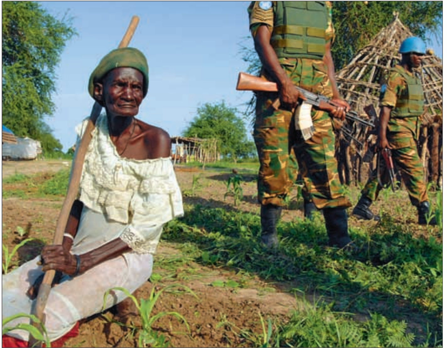
Kvinner er de som rammes hardest av væpnede konflikter. Men selv når FN står sentralt i fredsarbeidet blir deres interesser oftest ikke ivarett.

Mer seksuell vold. – Når kvinner ikke tas med i fredsforhandlinger, viser det seg at forhandlere mangler ekspertise i forhold til å adressere kvinners perspektiver. Kun fem fredsprosesser har referert til bruk av seksuell vold som en militær og politisk taktikk, selv om hyppighe-