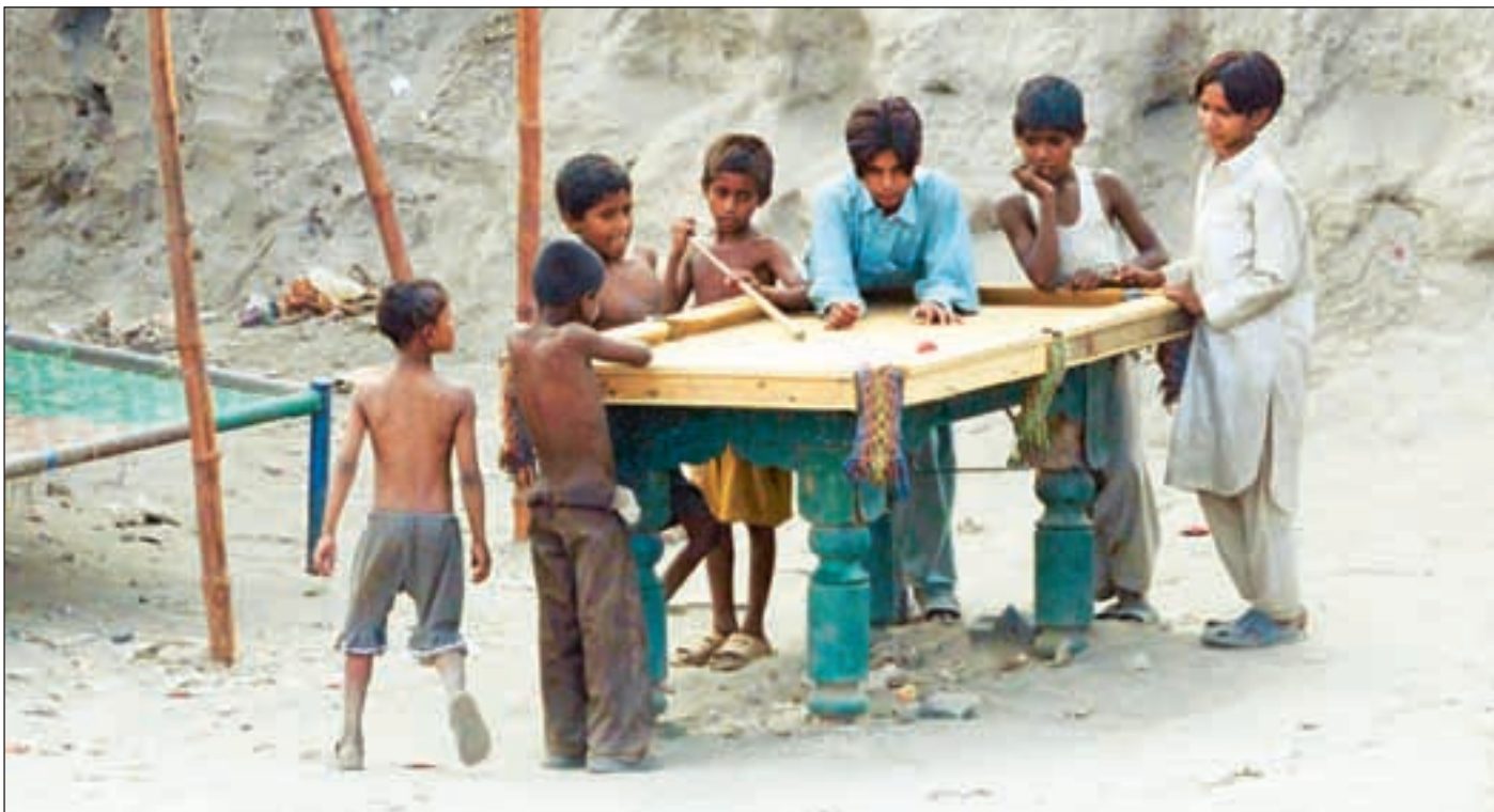
Rangert som nummer 139 av totalt 179 er Pakistan ifølge FN fortsatt ett av verdens fattigste land.