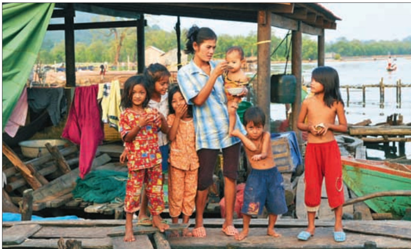
Fattige kår er blant grunnene til at mange kvinner i Kambodsja jobber som øl selgere. Her fra en landsby i nærheten av Sihanoukville.