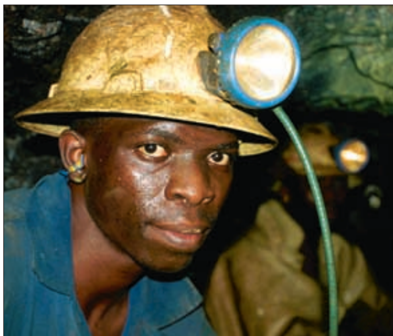
Arbeiderne ved koppergruvene i Zambia vet at mye av inntektene fra industrien havner i utlandet.