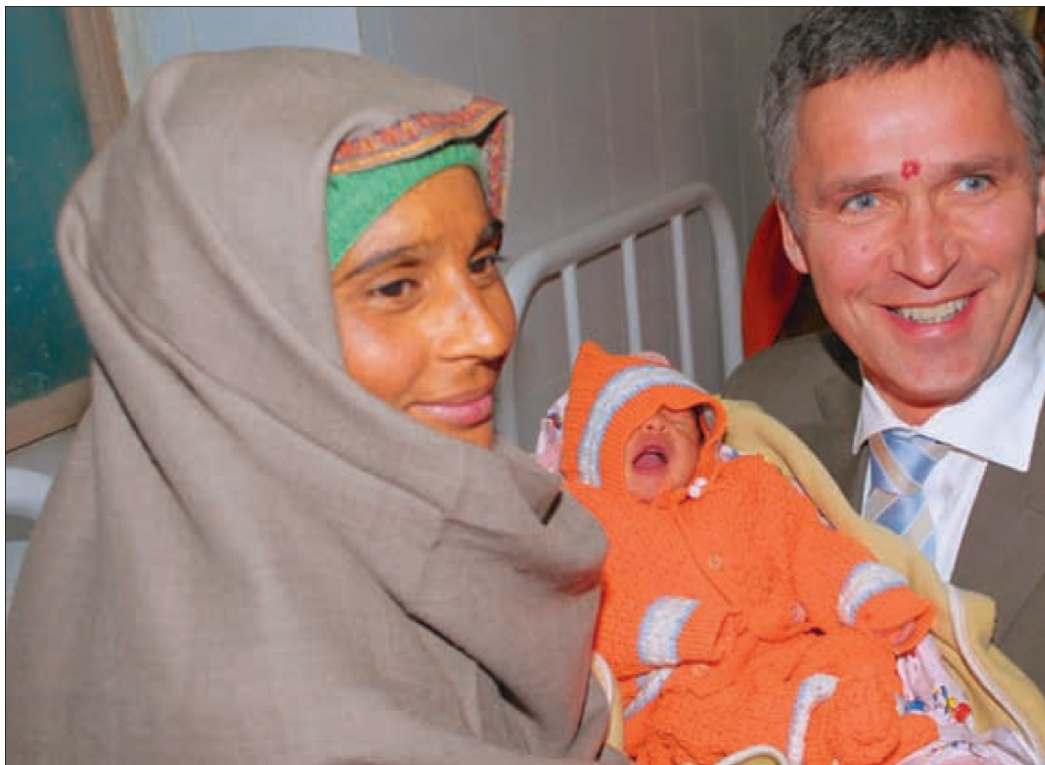
Statsminister Jens Stoltenberg, her på besøk i India, har frontet store, globale helseinitiativ. Nå sås det tvil om effekten av initiativene.

- Skal vi oppnå gode resultater med de pengene vi setter inn, er det avgjørende at vi investerer mye i bygging av lokal kompetanse. Slike investeringer må særlig rettes inn