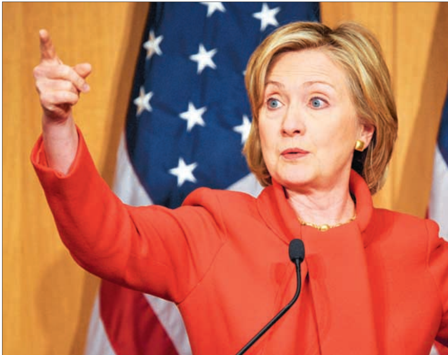
Utenriksminister Hillary Clinton presenterte sin utviklingspolitikk under et møte i Washington i januar.

Nye aktører. I talen sin gjorde hun en ny vri på det kjente ordtaket: «hvis du gir en mann en fisk har han