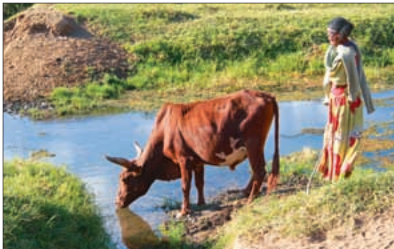
Etiopias småbrukere utgjør omlag 80 prosent av arbeidsstyrken, og er utropt til «motoren» i økonomien.