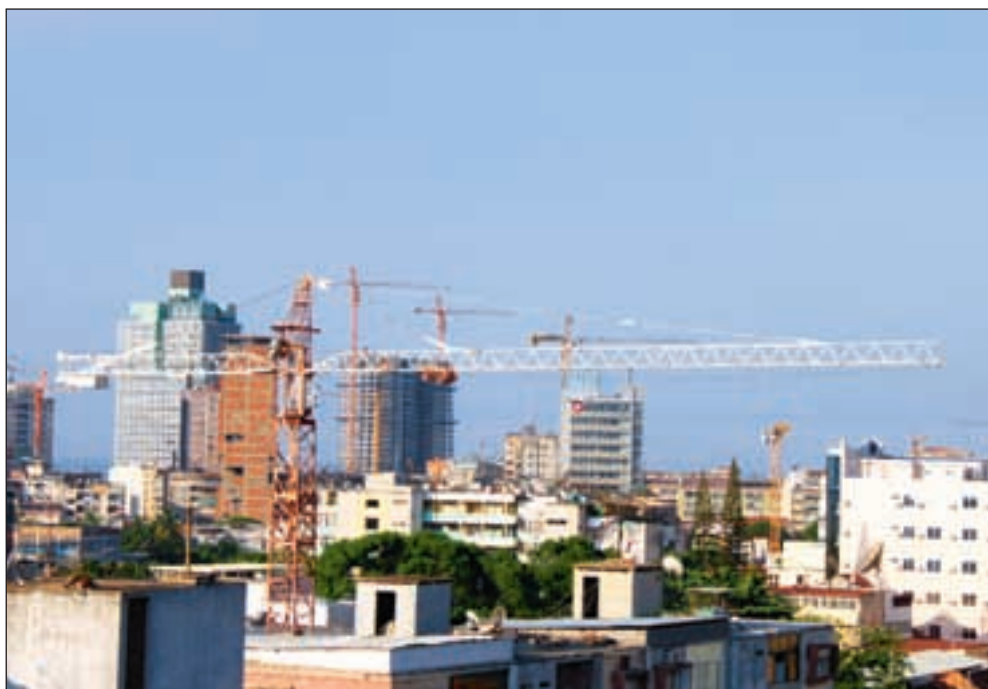
Luksushoteller og næringsbygg skyter til værs i Angola i takt med stadig nye gass- og oljefunn. Foreløpig har ikke inntektene kommet vanlige angolanere til gode.

Angola vil trolig neste år etablere en børs i Luanda. Lokalene og utstyret er kjøpt inn. Det vil kunne føre til større åpenhet i et næringsliv som i stor grad er preget av dekkelskaper og uklare eierforhold. ■