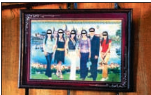
Foreldrene til Vansan med sine eldste døtre. To av dem vet ikke moren hvor er.

ter som har vært offer for tvang og frihetsberøvelse i et arbeidsforhold. Mange er blitt tvunget til prostitusjon.