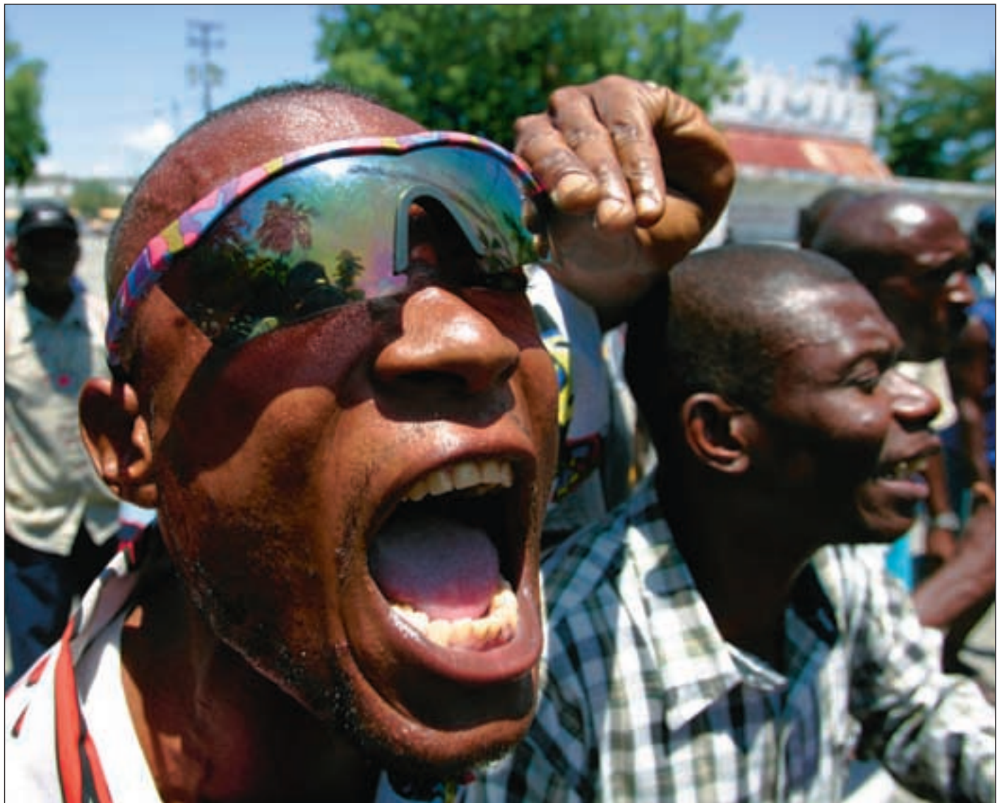
Den norske støtten til Haiti har hatt som mål å bygge tillit og forståelse mellom politiske og sivile aktører. Bildet er fra en demonstrasjon mot regjeringen i april 2008.

I Utenriksdepartementet hadde det imidlertid lenge vært en skepsis til det høye kostnadsnivået som ISPOS opererte med. Dette ble ytterligere forsterket da varselet om mulig korrupsjon dukket opp.