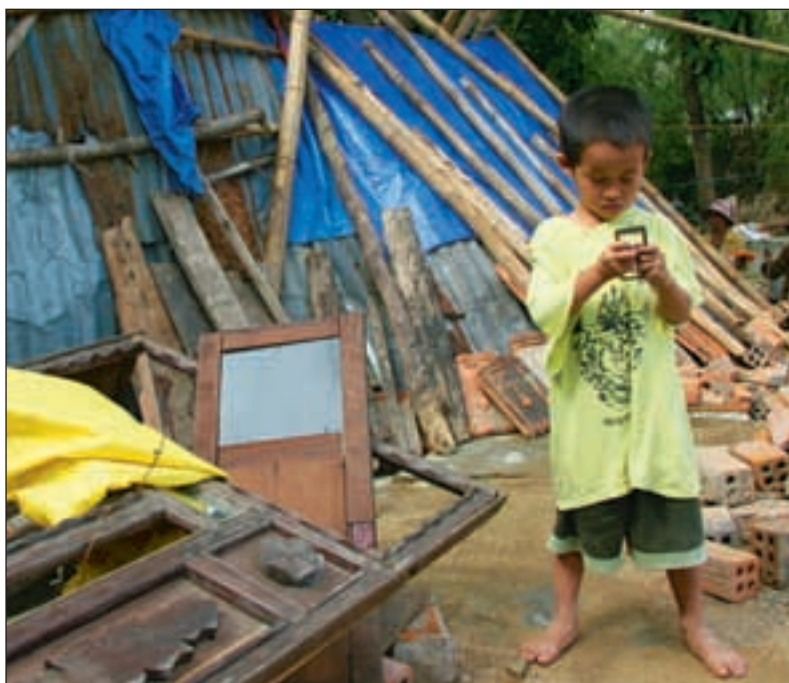
Mange har laget midlertidige boliger i ruinhaugene av sine gamle hjem.

ke annerledes og øke satsingen på forebygging og minimering av skader som oppstår på grunn av voldsomme naturkrefter.