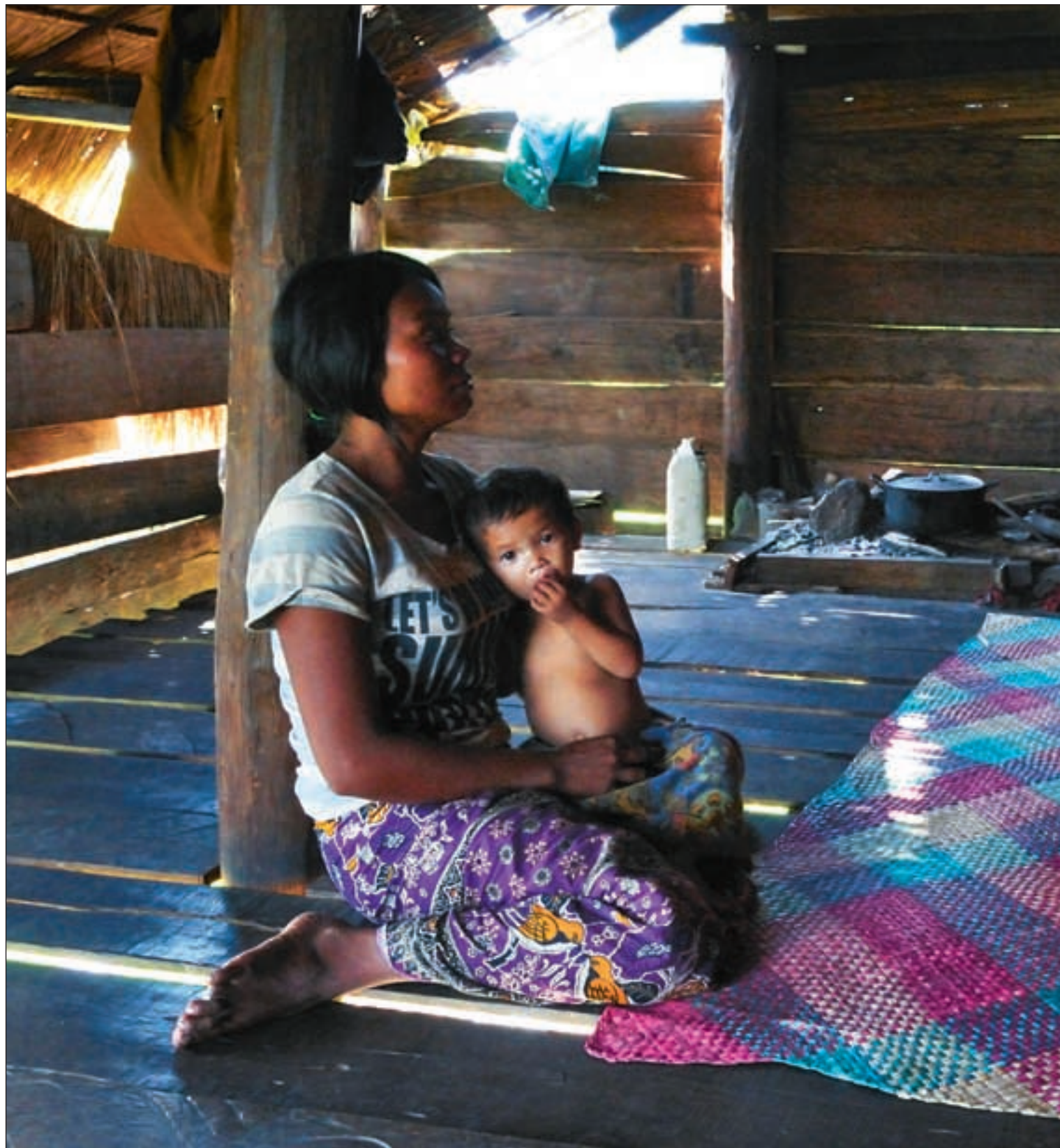
Empo (17) ble lurt av en nabo og holdt innelåst sammen med over 200 andre unge hushjelpere. Hun får samtalerapi av en buddhistmunk gjennom organisasjonen.

-Jeg unngikk det, fordi jeg slapp å servere på rommene. Jeg var redd