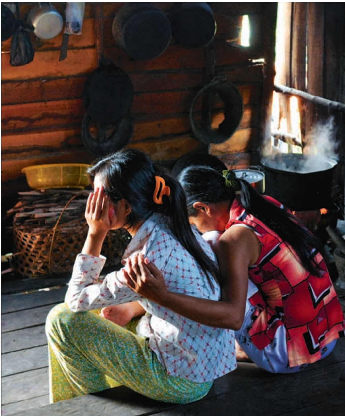
Vansan (18) hadde egentlig jobb som servitør men ble tvunget til prostitusjon og holdt innelåst av arbeidsgiveren i en måned.

Under jorden. Vansan (18) er en blant tusenvis av sørøstasiatiske jent-