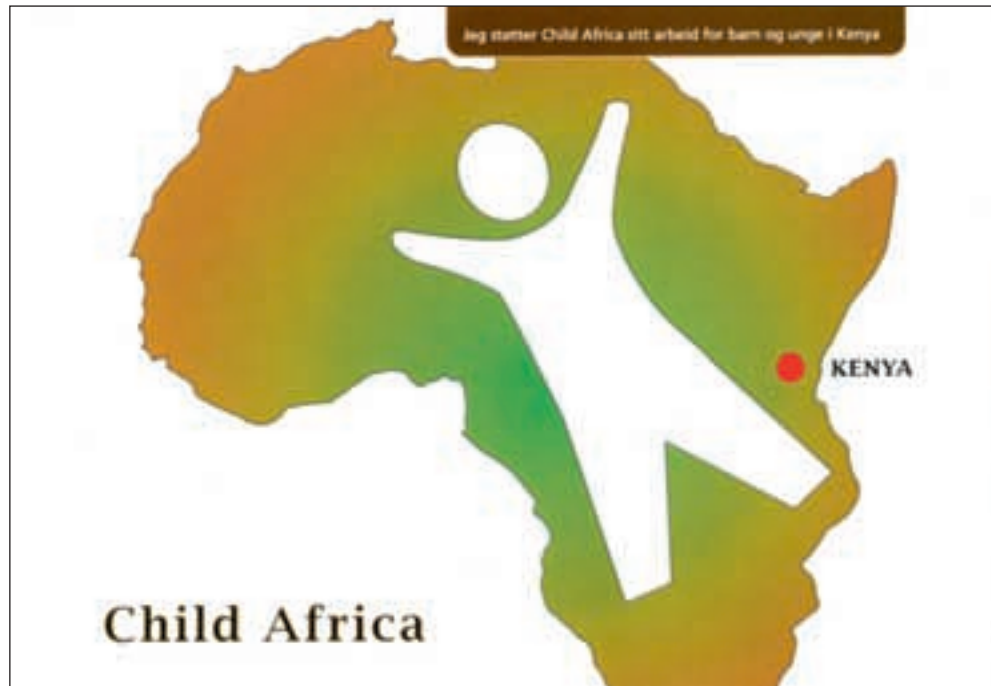
Slike kort selger selskapet Fulfilment for Child Africa. Den eldre kvinnen som fikk tilsendt dette kortet fikk også en regning på drøyt ett tusen kroner. Child Africa var ikke registrert som en hjelpeorganisasjon i Kenya da hun fikk regningen.

Ok å bløffe. Bistandsaktuelt har intervjuet en ung kvinne som i 2008 jobbet som telefonselger for Fulfilment. Hun ønsker ikke å stå fram fordi hun fortsatt har venner som jobber for Fulfilment og fordi det vil