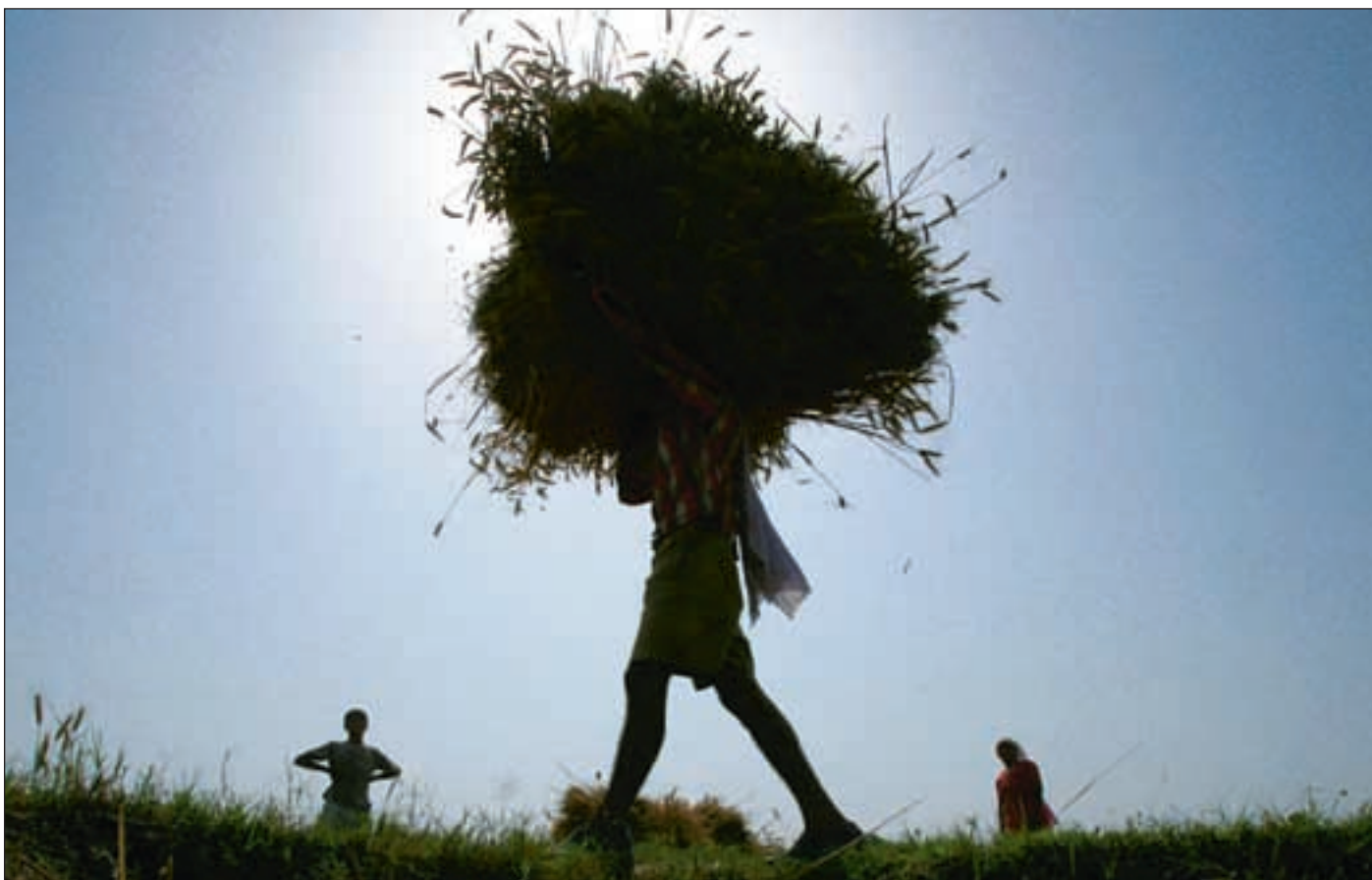
En lokal bonde utenfor Jammu i India, bærer hvete til overskuddslagre. Artikkelforfatteren mener at sultproblemerne i verden skyldes både manglende forståelse for problematikken og manglende politisk vilje til å løse den.