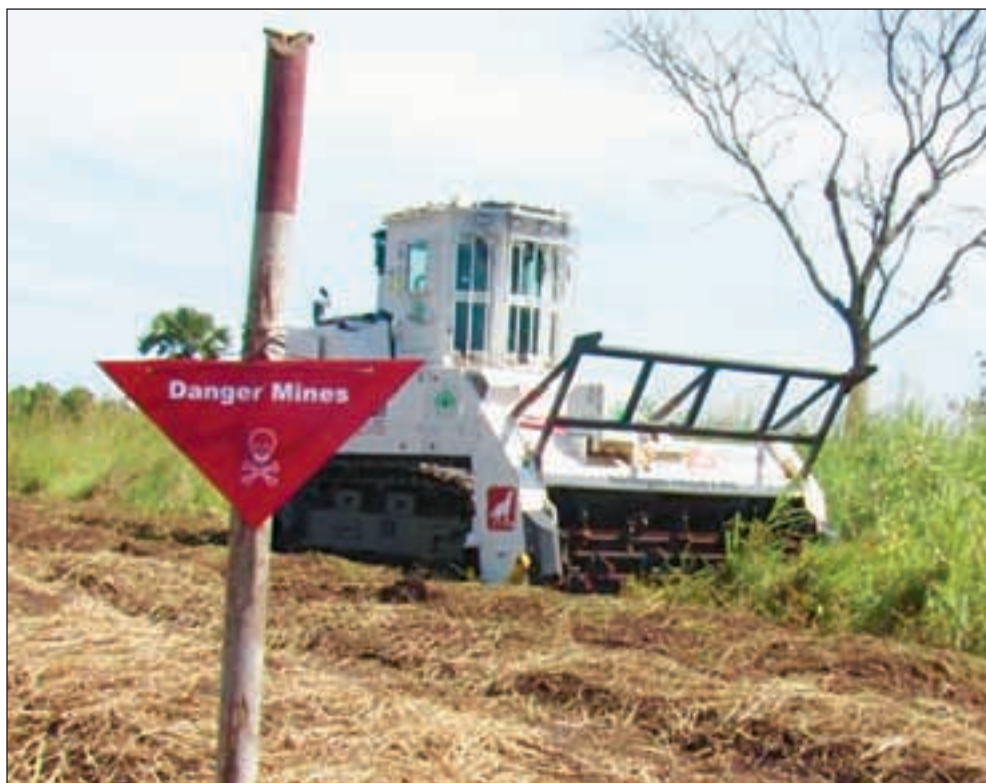
«Mine-treskeren» er blant utstyret Norsk Folkehjelp benytter i sine operasjoner.