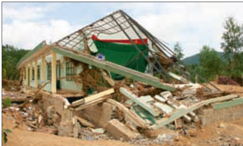
En av skolene i Phueyen-provinsen som ble rasert da flommen kom. Nå vil regjeringen flytte mange skoler.