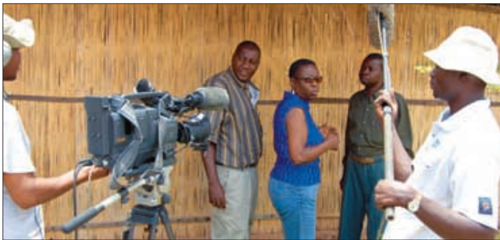
Korrupsjonen blomstrer både i Kenya og Tanzania, men oppfattes som verst i Kenya fordi media der er flinkere til å avsløre utro tjenere, skriver Christine Agalomba.

Konsekvensene ved å havne på lista over de mest korrupte land i verden er at Kenya mister bistandspenger og private investeringer fra hele verden. Bistand er jo også en slags investering og ingen vil risikere at investeringene spises