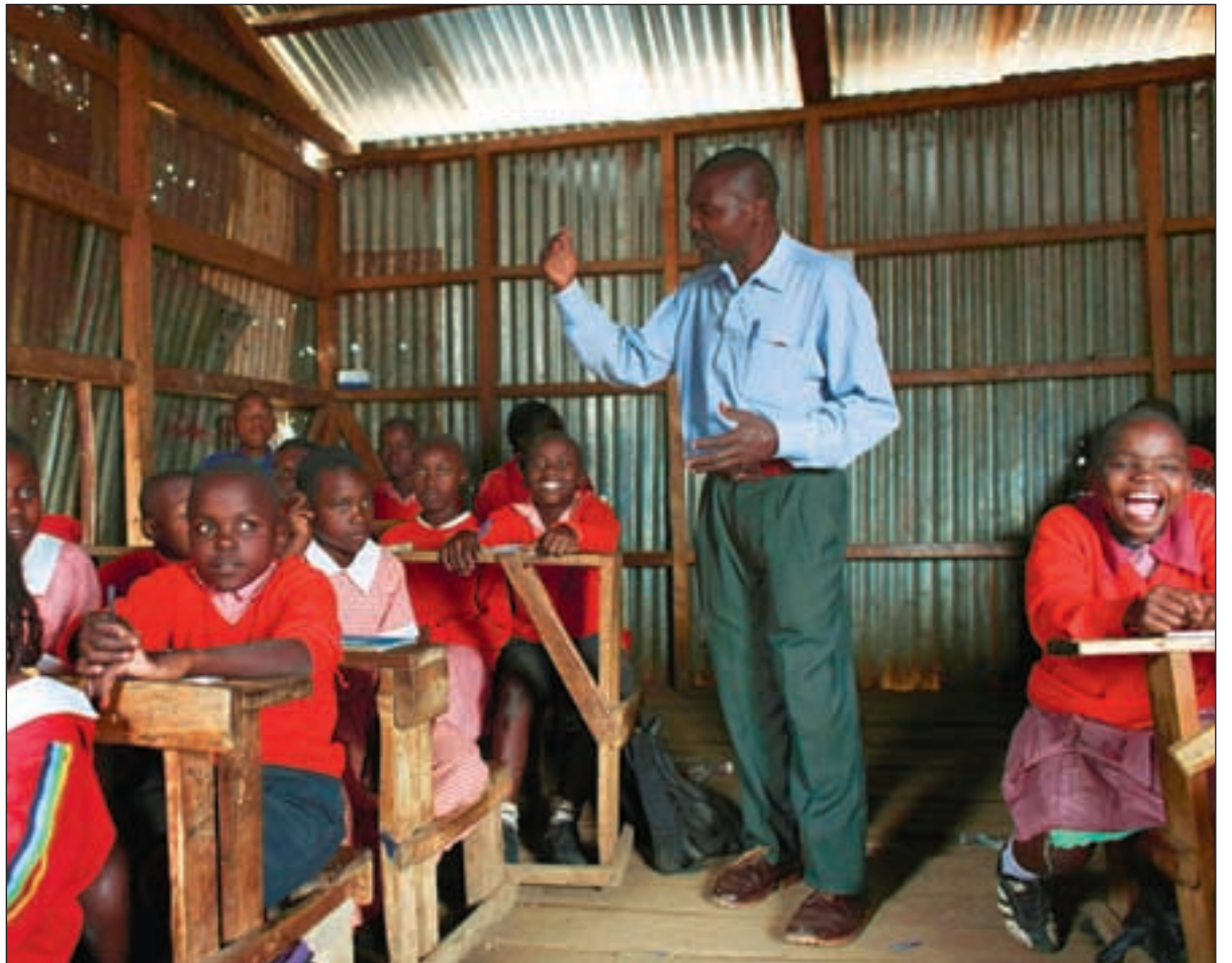
En vanlig lærer i de fleste afrikanske land kan tjene ti ganger så mye hvis han får seg jobb som bistandsarbeider. Kan dette forsvares, spør artikkelforfatterne. Bildet er fra en skole i Kenya.

TILBAKE TIL VÅRT EKSEMPEL fra Tanzania: Det er akutt behov for lærere i hele landet, og lønnsnivået er så lavt at man faktisk ikke kan brødfø en familie på det en lærer tjener, det vil si godt under kr 1000,- per måned som minstelønn. Det er derfor ikke uvanlig at lærere tar seg annet arbeid ved siden av undervis-