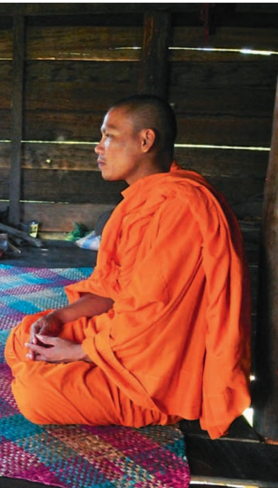
en PADV, som PLAN Norge samarbeider med.