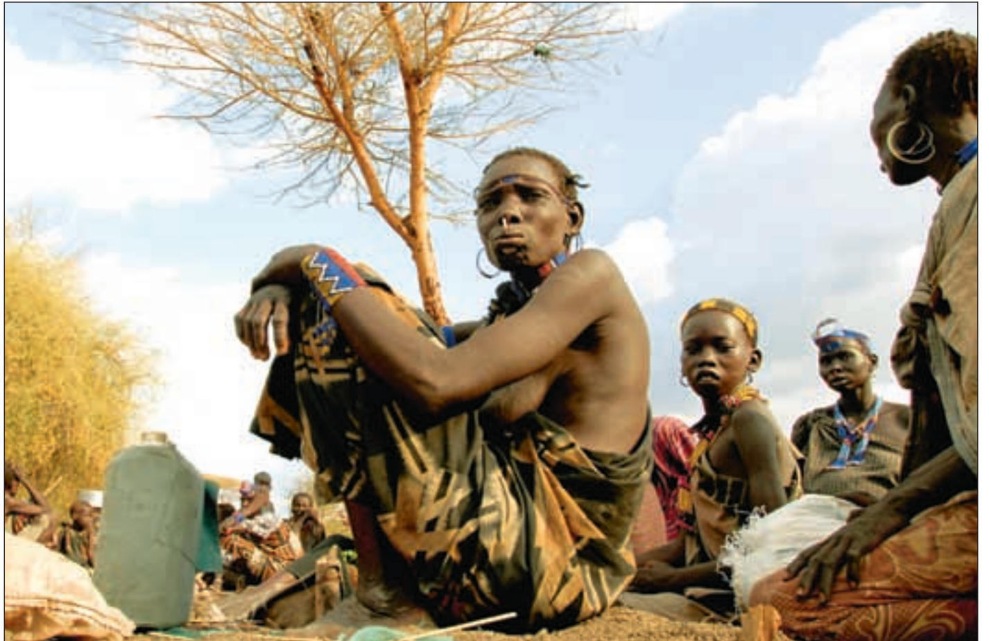
Internflyktninger i Jonglei, Sør-Sudan. Situasjonen er svært spent i deler av Sør-Sudan. Den siste tiden har det vært en rekke sammenstøt mellom ulike etniske grupper.

Raskt problemer. Det viste seg raskt at å dele ut penger på et givermøte i