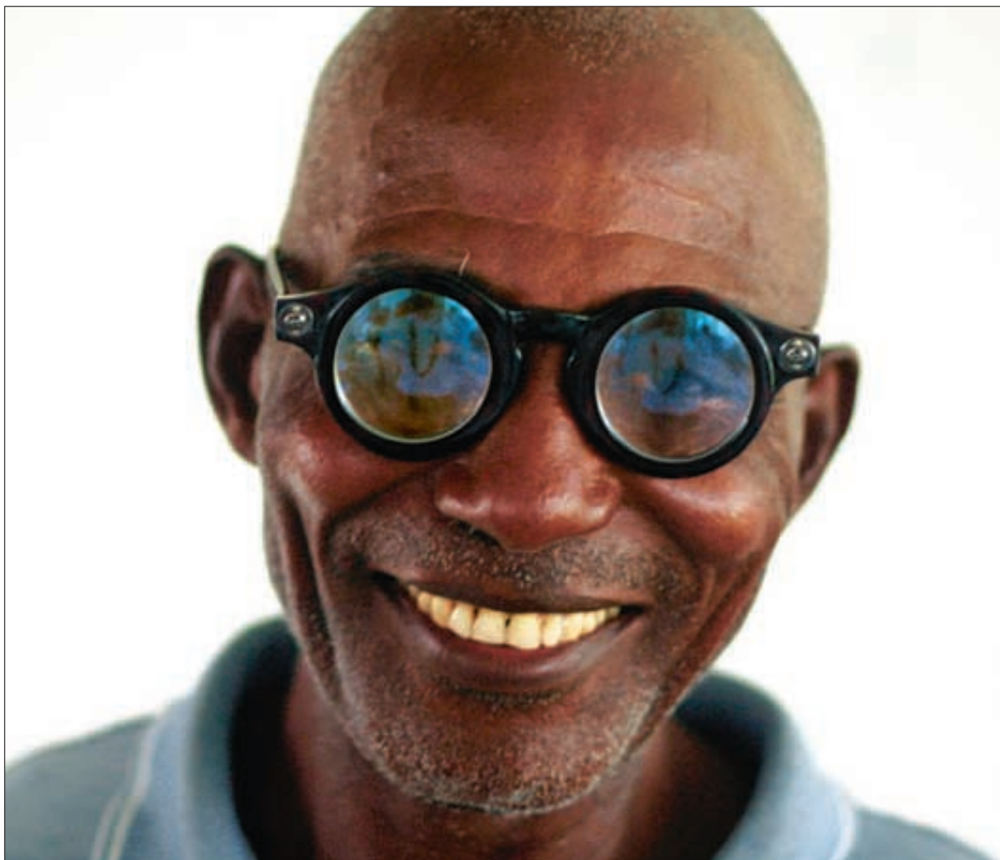
Pene er de kanskje ikke, men de kan hjelpe svaksynte til å få et nytt og bedre liv, mener oppfinneren.

Så enkelt at... Metoden er, ifølge Silver, så lett å få til at man kun trenger enkle instruksjoner for å tilpasse brillene til den enkeltes syn. Silikonolje injiseres med en sprøyte i et mellomrom mellom to plastplater til man ser tydelig, og deretter forsegles hvert «glass» med en liten