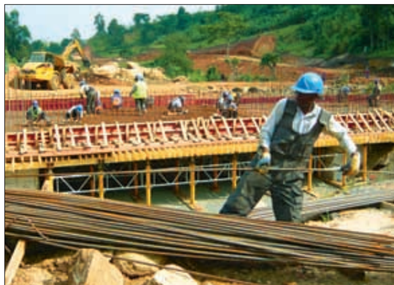
Over 500 mennesker har vært sysselsatt under byggingen av kraftverket i Bugoye i vest-Uganda.

■ Årlig produksjon på 82 GWh, som er om lag 7 prosent av Ugandas strømbehov. Vil gi en vesentlig forbedring av strømtilgang i vestlige Uganda.