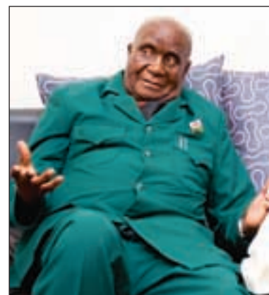
Tidligere president Kenneth Kaunda innledet Zambias kjærlighetsforhold til Kina.

Statlige selskaper som Cnmc er enkle for Beijing å kontrollere og holder høy standard til og med i Kina. Men den største delen av handelen med Kina skjer i regi av private og halvprivate selskaper. Og overalt hvor kinesiske entreprenører kommer i Afrika, blir de anklaget for å betale sultelønner og for å ødelegge miljøet.