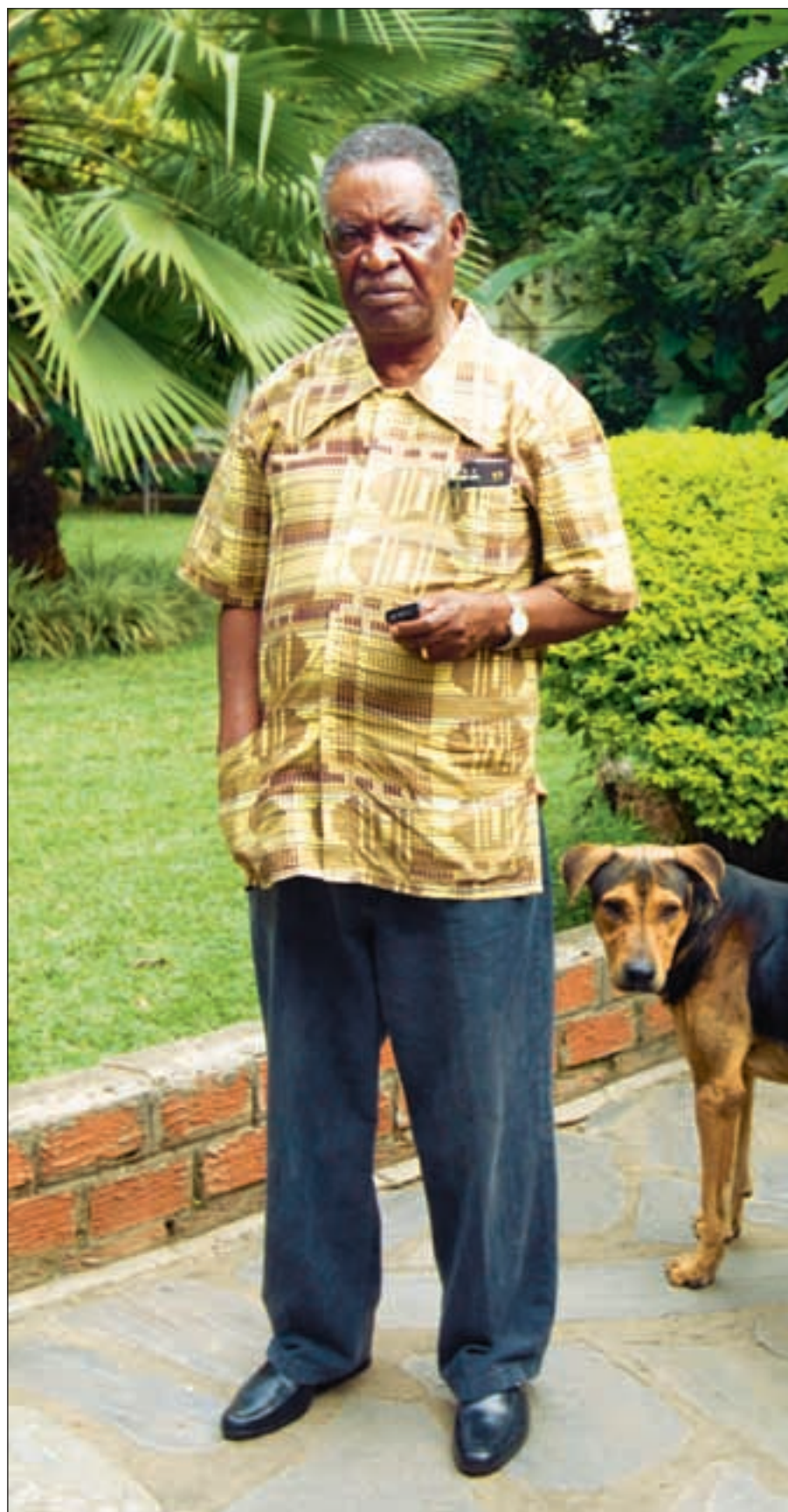
Opposisjonspolitikeren Michael Sata måtte så vidt se seg slått av Rupiah Banda under presidentterningene i Zambia.

vanskjøttet at gruveselskapene ikke lenger tør bruke den. Den gikk aldri med overskudd. Men Zambia skylder fortsatt Kina 500 millioner dollar, som Kaunda lånte til prosjektet.