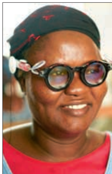
Ved hjelp av en sprøyte justerer brukerne brillene til riktig nivå.

– De tenker ikke på synsproblemer som et utviklingsproblem på linje med hiv/aids for eksempel, sier han.