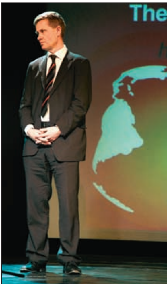
Miljø- og utviklingsminister Erik Solheim deltok på lanseringen av Human Development Report i 2007 – en rapport som la stor vekt på at rike land måtte bidra med midler til klimatilpasning i utviklingsland.

– Uten utslippskutt vil vi komme i en situasjon der vi ikke lenger kan