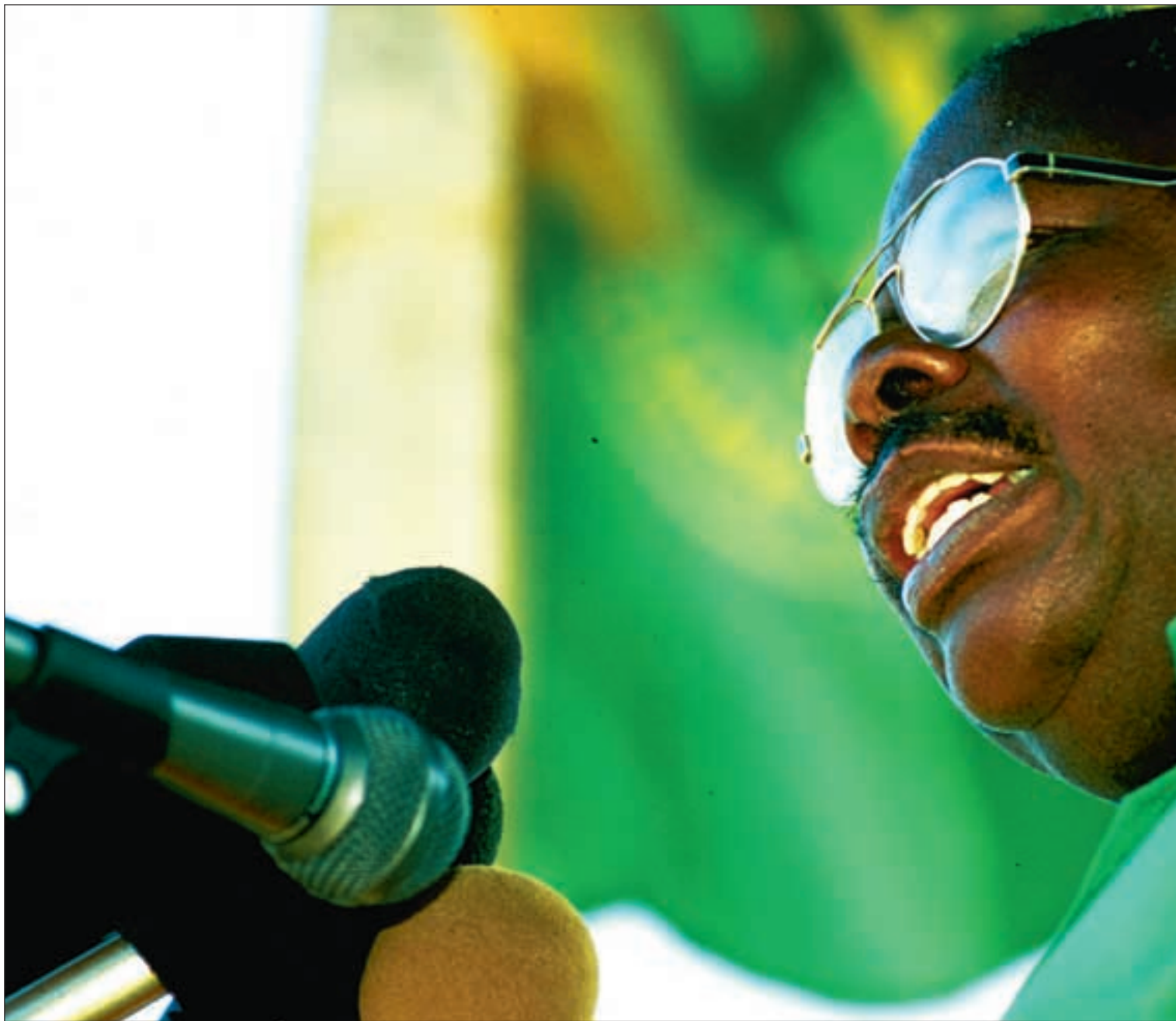
Tidligere president Benjamin Mkapa er blant de politikere som beskyldes for korrupsjon.

Lover fortsatt kamp. I et eksklusivt intervju med Bistandsaktuelt lover nasjonalforsamlingens president Samwel Sitta å fortsette kampen mot korrupsjon. Det skal gjøres gjennom å sikre større åpenhet og ansvarlighet i styre og stell.