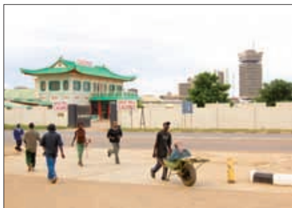
The Great Wall Casino er et populært sted for gambling-glade kinesere i Zambia.

– Zambias fattigdom beror i stor grad på at de har mislykkes i å beskatte sine naturressurser. De har ekstremt stort rom for å øke statens andel, men i stedet har de lovet skattefritak. Om de hadde beskattet gruveværingen hadde ikke Norge trengt å gi så mye bistand til Zam-