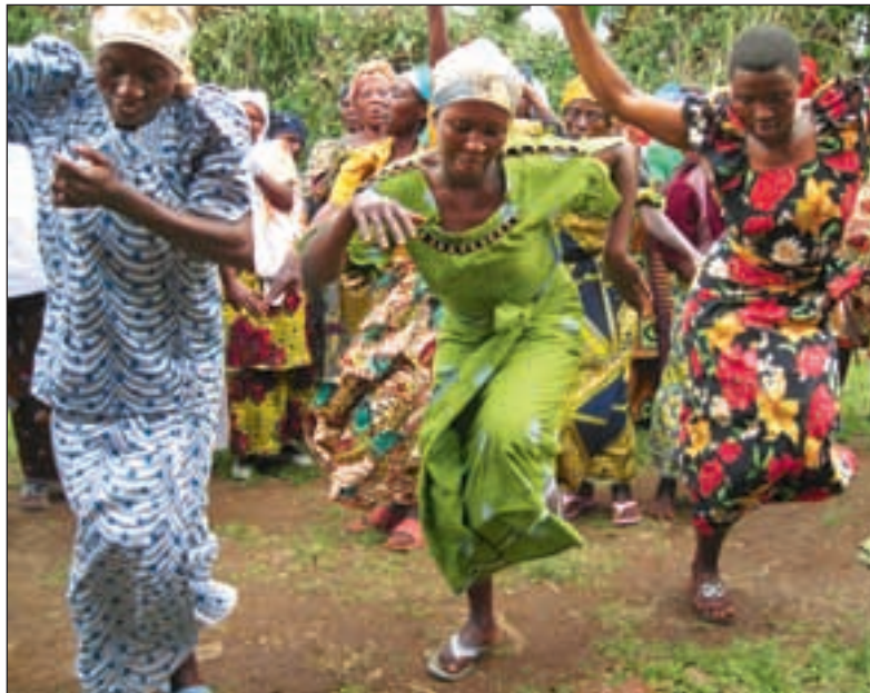
I FOKUS er man opptatt av maktrelasjoner mellom kjønnene og prioriterer derfor tiltak rettet mot kvinner. Men det er også nødvendig å ansvarliggjøre og involvere menn, skriver artikkelforfatteren.

Målet for all prosjektstøtte fra FOKUS er at kvinner skal få spillerom og muligheter til å utvikle sine ressurser og at dette vil føre til positive endringer, både i forhold til samfunnet og på individnivå. Støtten skal gis på kvinnes egne premisser, de skal være aktive deltakere, selv definere sine behov og styre utviklingen i prosjektene. Men for å få til en reell bedring av kvinners situasjon, er det også nødvendig å involvere og ansvarliggjøre