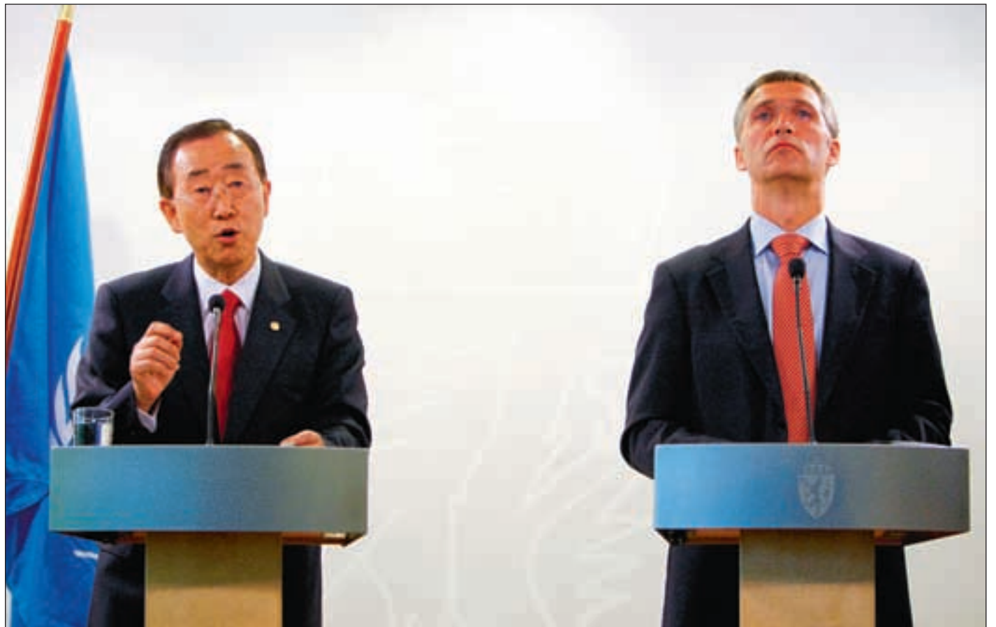
Både FNs generalsekretær Ban Ki-moon og Norges statsminister Jens Stoltenberg jobber med å reformere FN. Foreløpig uten særlig hell.

Flere av FNs pilotland, som Rwanda, Tanzania og Mosambik, har på sin side vært positive til en ny