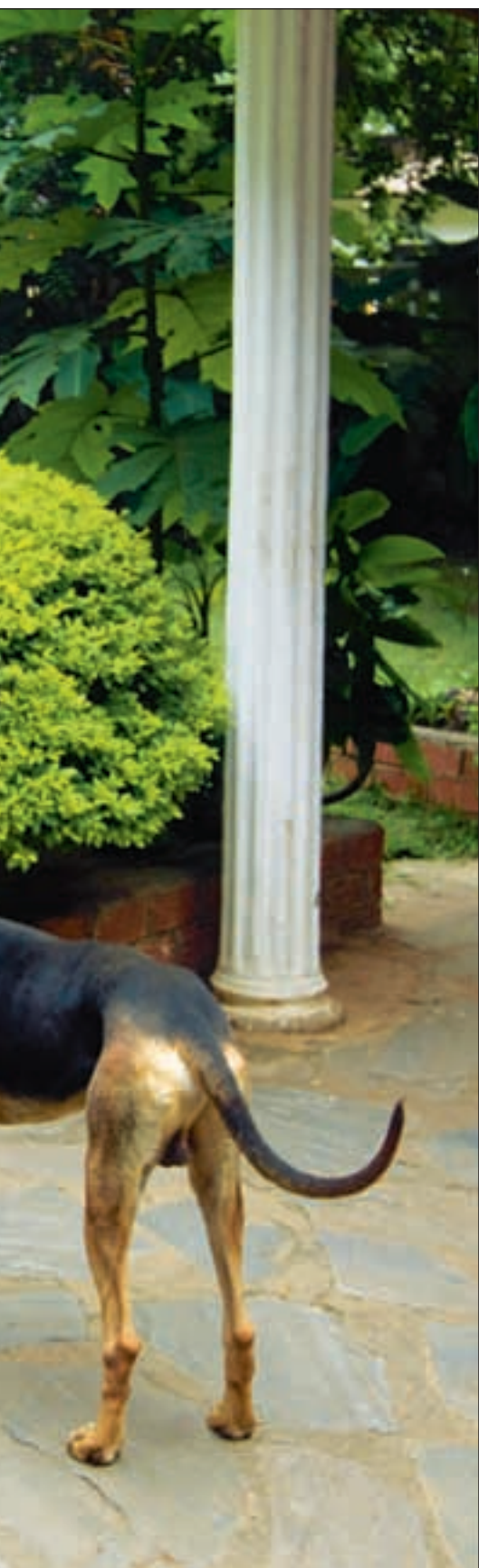
valget i 2008. Han er svært kritisk til de kinesiske investeringer i Zambia.

Beholder én til to prosent. Mwale ser den nye sonen som en mulighet for Zambia til å få ferdigvareindustri. Men kritikere mener Zambia i sin iver etter å lokke til seg utenlandske investeringer har gått glipp av de siste årenes boom i råvarepriser. Fra 2001 til 2008 ble kobberprisene seksdoblet. Men bare en til to prosent av eksportverdien havnet i Zambia. Da regner man heller ikke med biproduksjon av kobolt og eventuelt gull, noe gruveselskapene mistenkes for å hemmeligholde.