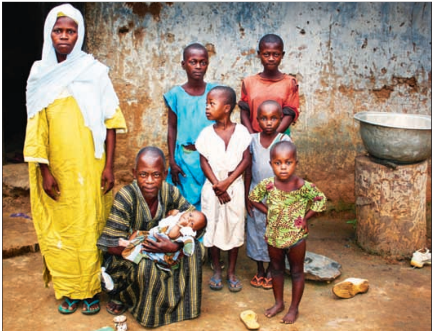
Arbeidet for likestilling og kvinners rettigheter har høy prioritet blant målsettingene for norsk bistand. Et virkemiddel har vært å integrere kjønnspektivet i alle typer bistand. (Bildet viser en migrantfamilie i Ghana.)