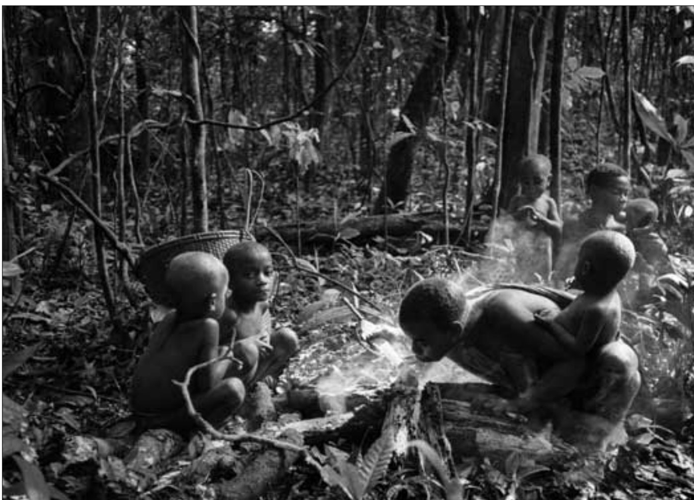
Gruppe av Efe (Mbuti-pygmeer) hviler under flytting mellom skogsleire, Ituri, Oriental 1983.