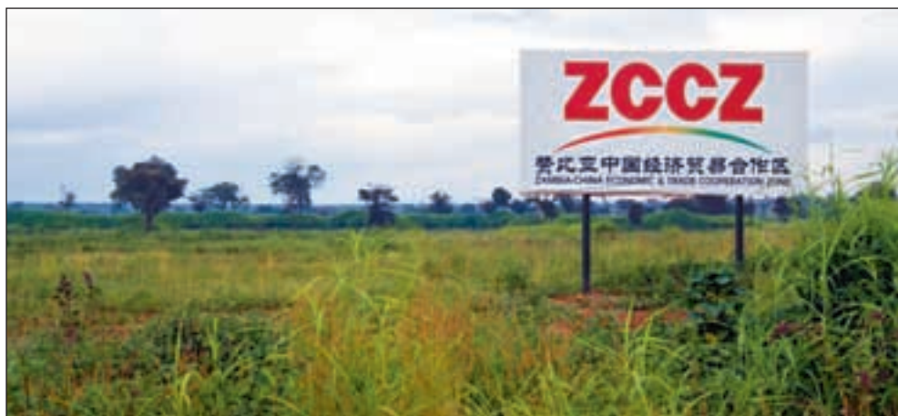
Bistandsaktuelt journalist ble holdt tilbake av Zambias hemmelige politi etter å ha fotografert skiltet som viser hvor Zambia China Economic and Trade Cooperation Zone skal ligge.

Zambia er et demokrati med ytringsfrihet. Men i sonen oppfører politiet seg slik de bruker å gjøre i