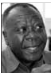
Samwel Sitta , president i Tanzanias nasjonalforsamling.

– Det er ikke et fnugg av tvil om at korrupsjonsproblemet er utbredt i Tanzania. Alle organer er forpliktet til å bekjempe dette ondet, for det gir ikke et godt inntrykk av landet utad, sier han.