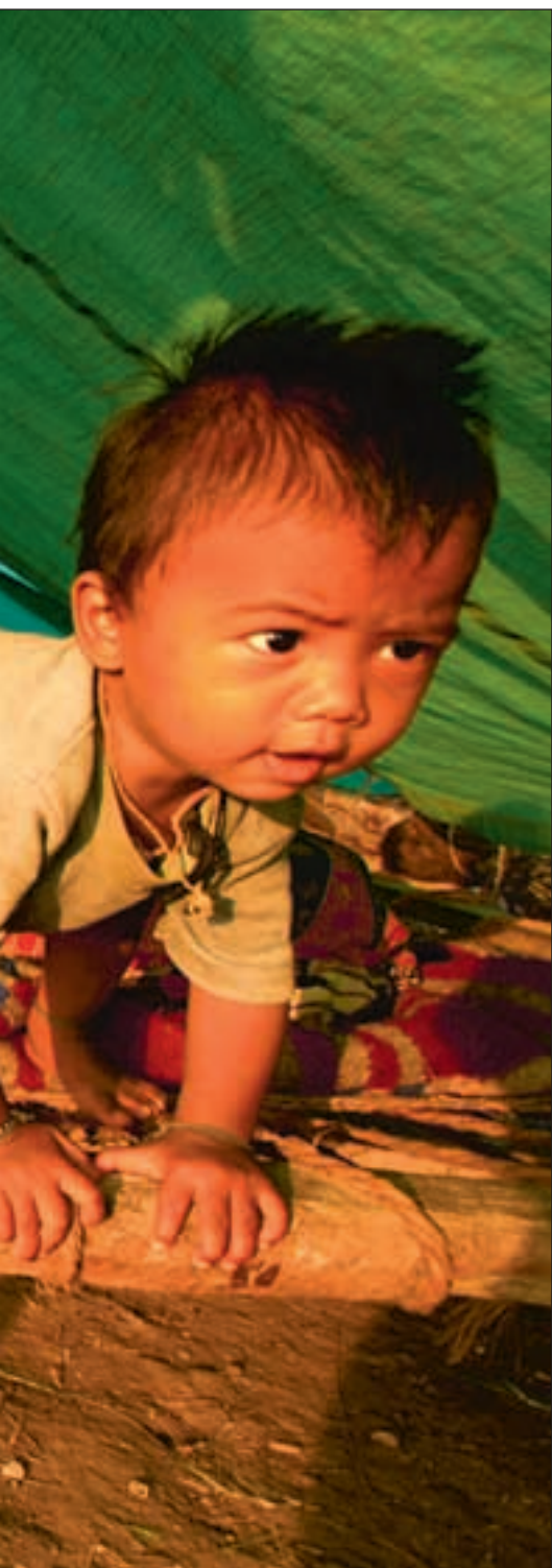
tilflukt under en presenning.