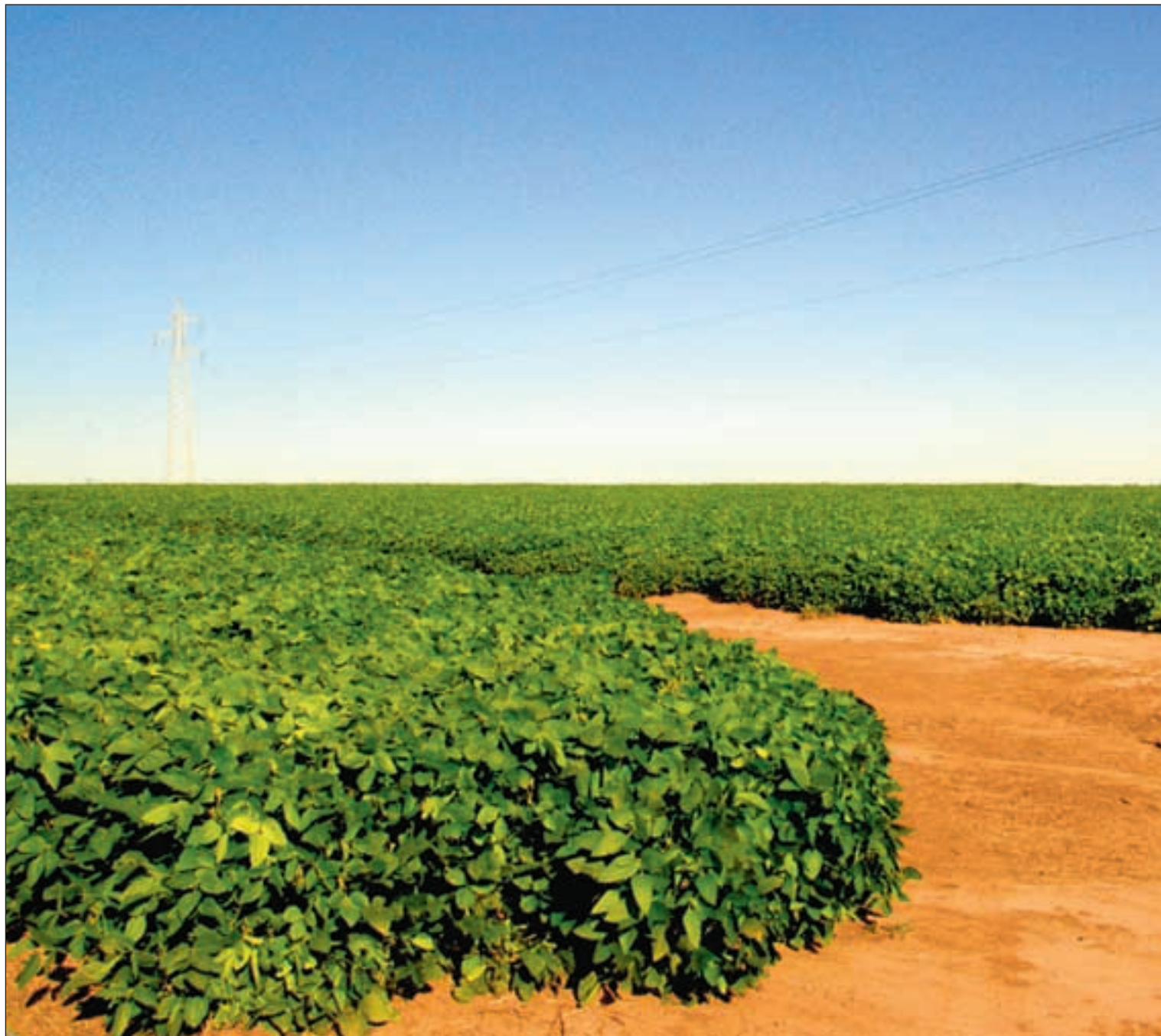
Mellom 2003 og 2007 ble soya-produksjonen i Uruguay firedoblet. Landet er i dag verdens niende største produsentland av soya.

Monokultur. India driver 90 prosent av all jordbruksforskning i Uruguay, og har blant annet ansvar for godkjenning av GMOer. Sawchik forteller at det totale jordbrukslandet i