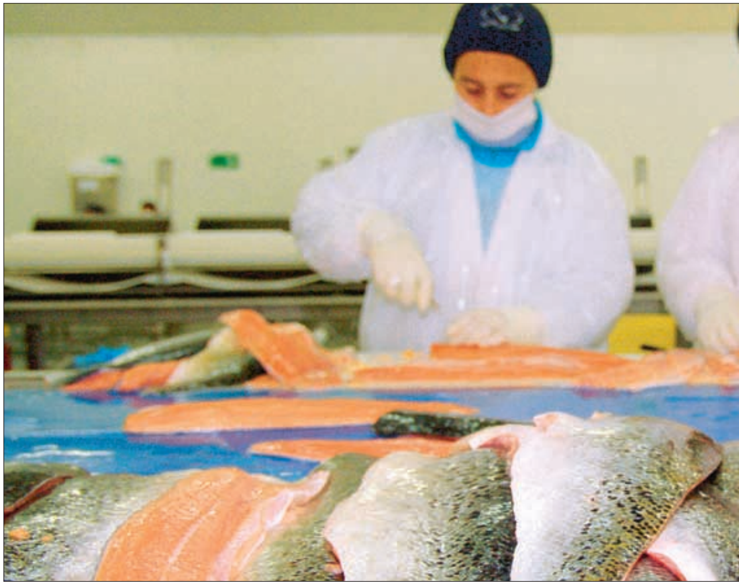
Filetering på anlegget i Quemchi.

Bruk av enorme mengder antibiotika er et annet ankepunkt. Ifølge LO opplyser det chilenske forskningsinstituttet Canelo de nos at det brukes omtrent 1000 ganger mer antibiotika i Chile enn i Norge for å produsere omtrent like mye fisk (600 tonn antibiotika for å produsere 600.000 tonn laks i Chile mot 750 kilo i Norge for å produsere