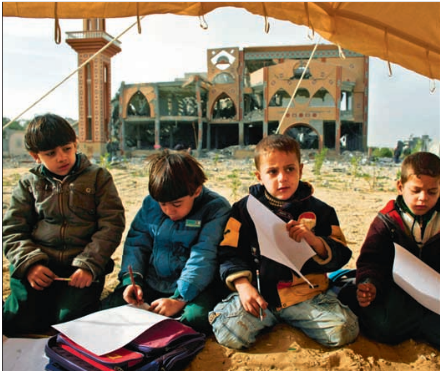
Israels militære offensiv ødela skolen til disse palestinske elevene i Rafah sør på Gaza-stripen. Undervisningen skjer nå under en teltduk.

Evalueringene har tatt for seg ni år med norsk støtte til frivillige organisasjoner. I alt har 37 norske organisasjoner arbeidet for folk i Det palestinske området. I hovedsak har organisasjonene bidratt positivt til demokratiutvikling, helse og beskyttelse, og styrking av menneskerettigheter. Humanitær hjelp og opprettholdelse av lov og orden har vært andre viktige bidrag fra de nor-