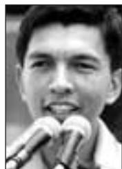
Madagaskars nye leder Andry Rajoelina .

Statsrådene Erik Solheim og Bård Vegar Solhjell sitt besøk på Madagaskar i 2008 synliggjorde den norske støtten i et bistands- og utdanningsfaglig perspektiv.