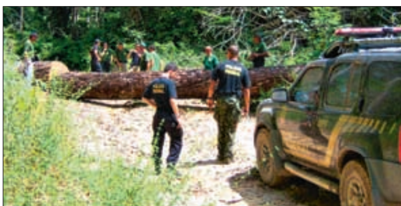
De illegale tømmerhuggerne bruker en rekke triks for å hindre politiet og miljømyndighetene i sitt arbeid. Her har de felt et tre over veien, slik at patruljene ikke skal komme frem.