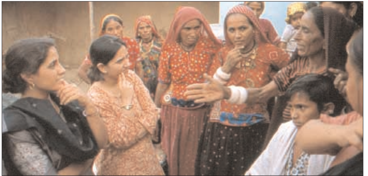
Både det sivile samfunn og kvinner har fått for liten plass i den nye stortingsmeldingen, mener artikkelforfatterne. Bildet er fra India.

Legitimiteten til Norges utviklingspolitikk hviler på konkret innsats. Mister vi grasrota, mister vi også folkelig oppslutning. De norske frivillige bistandsorganisasjonene har gjort viktige erfaringer med at