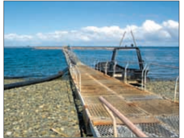
Oppdrettsfarmene ligger nær land og tett ved kysten i Calbuco-området.