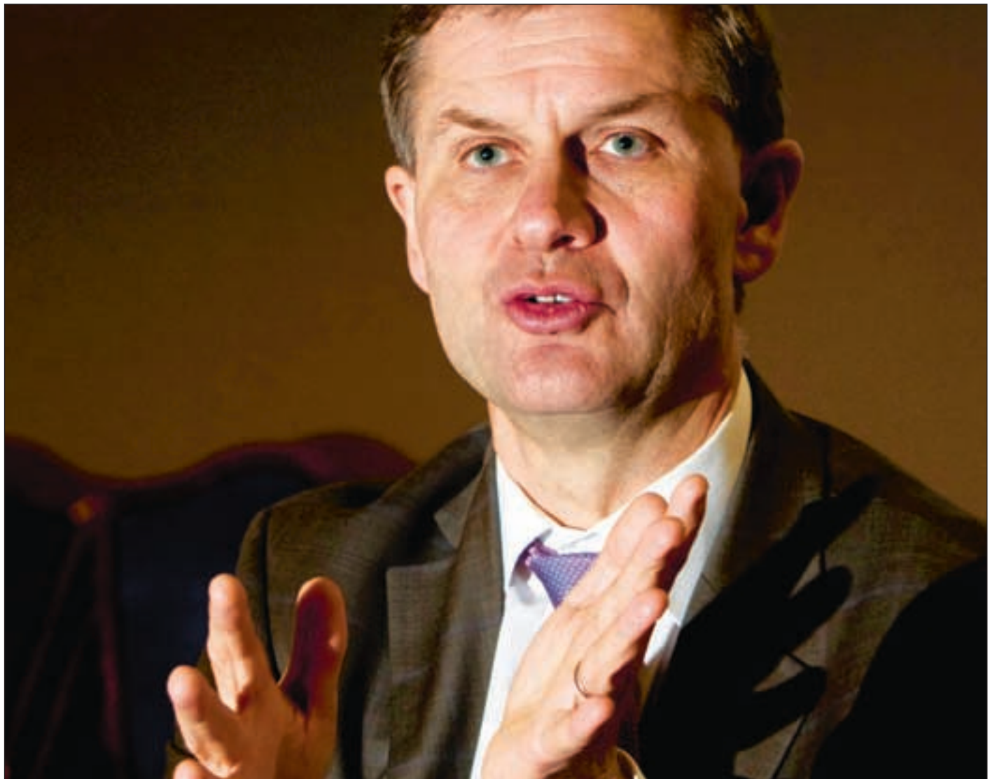
Et drøyt år etter at Erik Solheim lanserte en ny varslingskanal for tips om økonomisk mislighold og korrupsjon har UD registrert 83 saker. Solheim velger å se positivt på det høye antallet saker og tolker det som et tegn på at systemet fungerer.