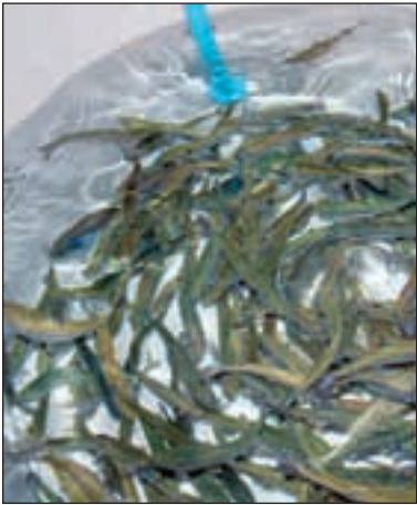
Slik ser laksen ut før den flyttes ut i sjøanleggene.