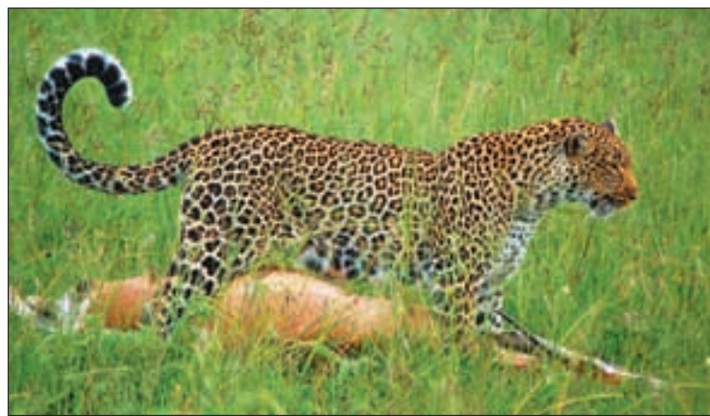
Ønsket om å bevare et rikt dyreliv var en av intensjonene bak støtten til naturressursprogrammet i Tanzania. Men deler av støtten ble trolig spist av andre enn rovdyrene.

– Norge har to hovedkrav for å gjenoppta programsamarbeidet med naturressursdepartementet: opprydding i det gamle programmet, herunder tilbakebetaling, og etablering av bedre systemer for økonomiforvaltning ved et eventu-