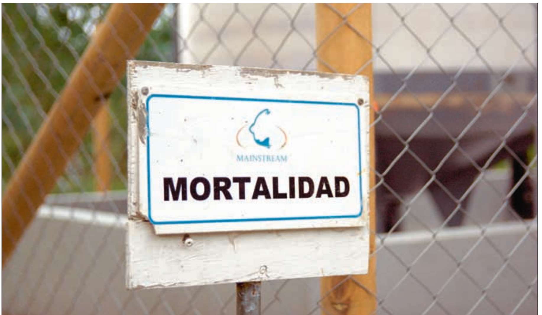
Dødeligheten – «La Mortalidad» – har vært høy hos oppdrettslaksen i Chile