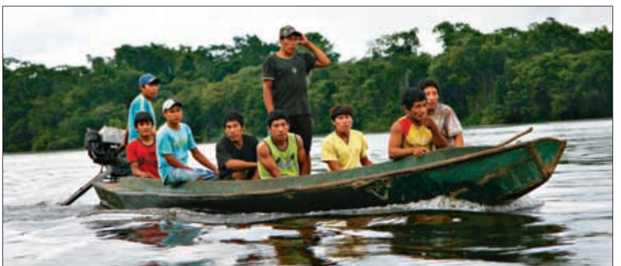
Arara-indianerne er dyktige fiskere, enten de drar ut i de tradisjonelle kanoene eller i denne båten laget av et kastanjetre. Piraya og andre elvefisker står på menyen etter endt fiske.