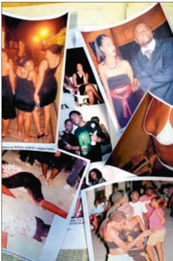
Nettstedet Zeutamu legger ut bilder for hele verden. Jo mer kompromitterende, jo bedre. Men til forferdelse for de som avfotograferes.

En tanzaniansk forretningsmann, som ble hengt ut å ha sam-