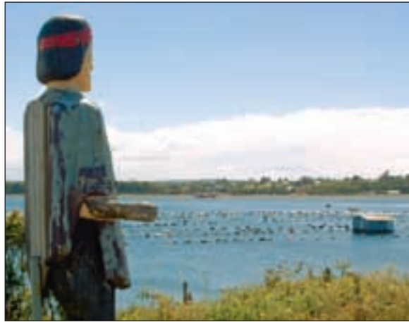
En mapucheindianer-statue ser utover sjøen som tidligere var lokalbefolkningens næringsvei.