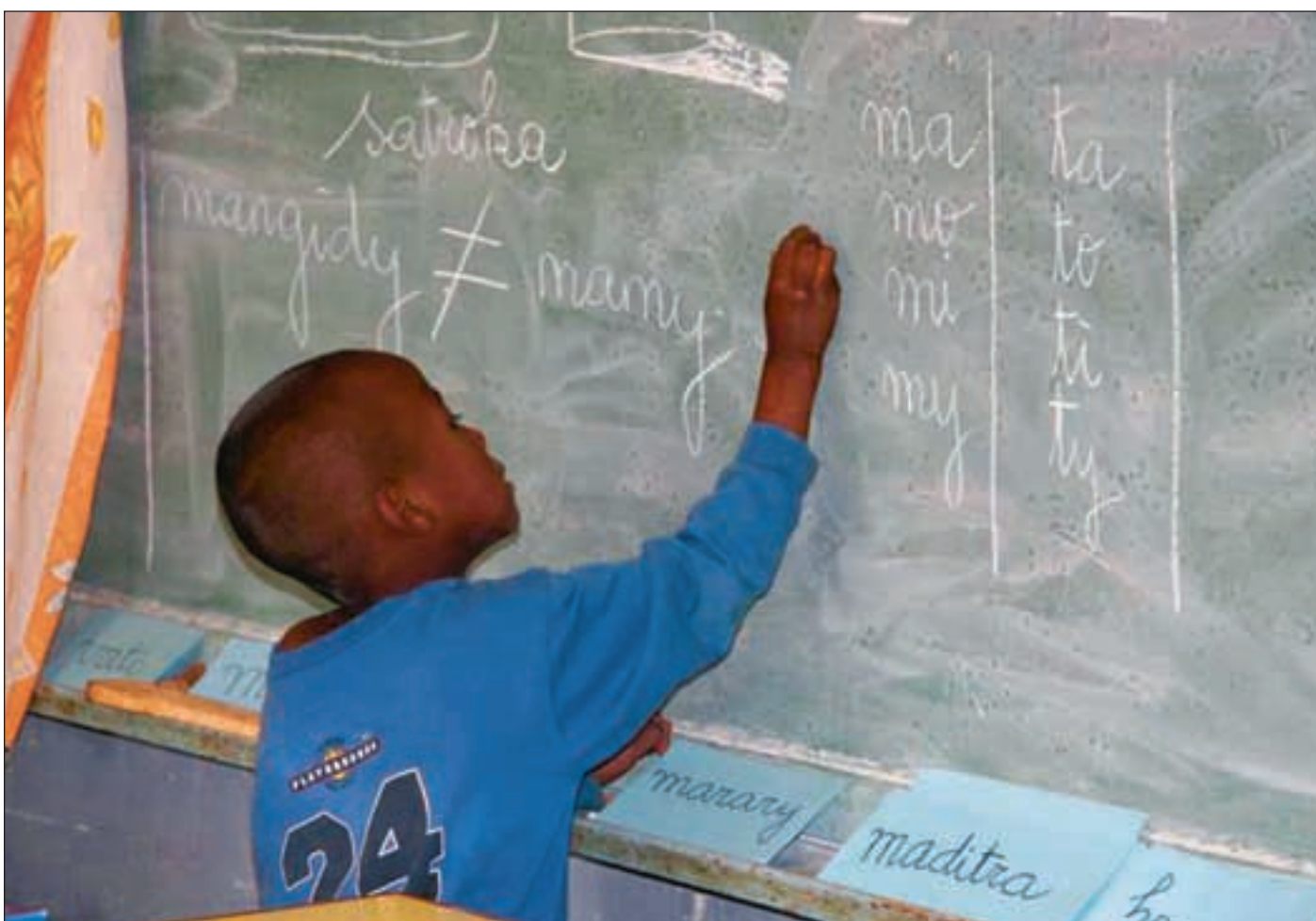
Undervisning i gassisk ved døveskole på Madagaskar. Den nye lederen på Madagaskar, Andry Rajoelina, har bestemt at gassiske barn skal undervises på fransk og ikke på morsmålet sitt. Et skritt i feil retning mener artikkelforfatteren.