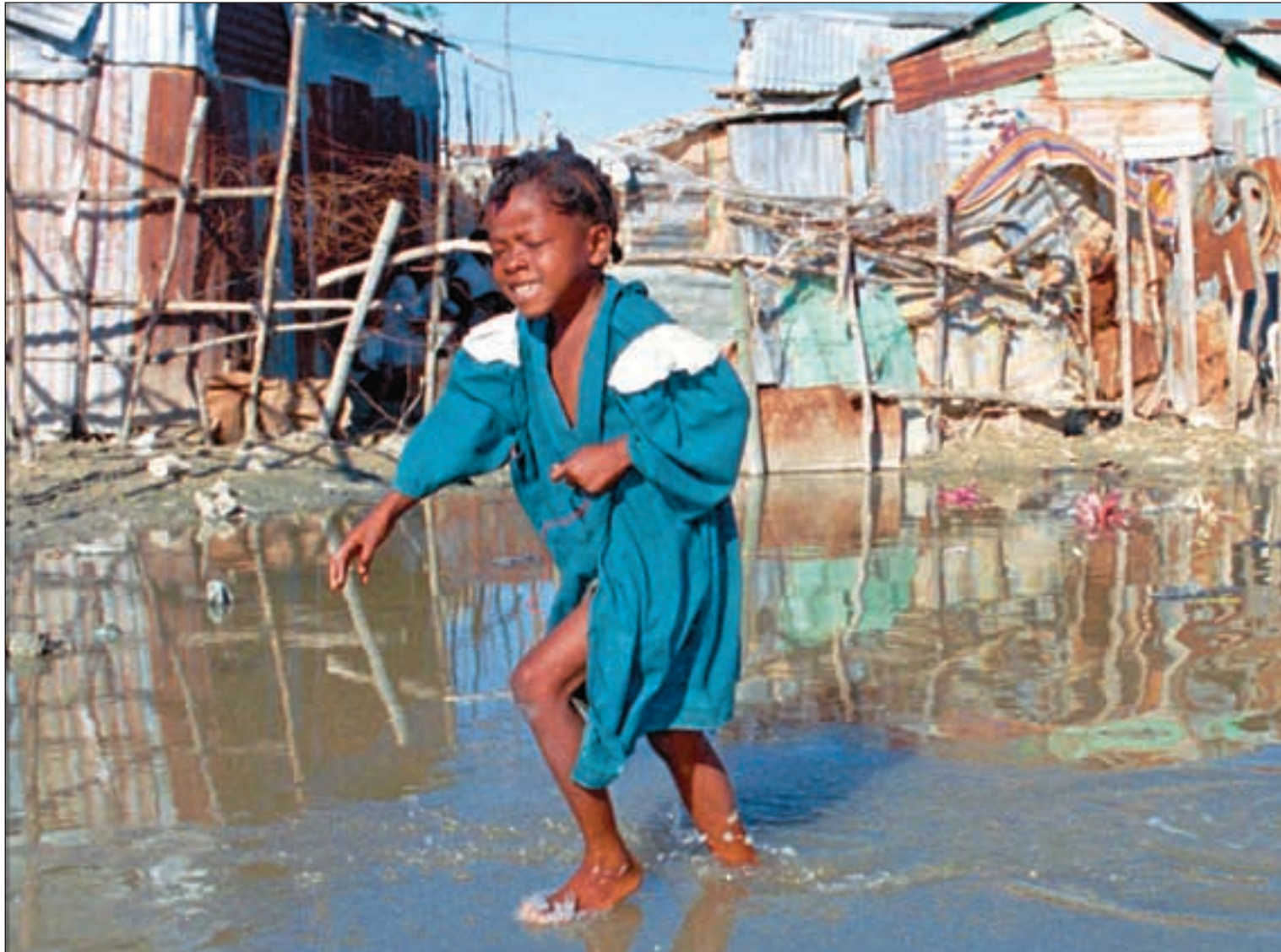
Millionene tidligere diktator på Haiti, Baby Doc Duvalier, stakk av med kunne gjort nytte for seg i slummen i Port-au-Prince. Samtidig som presset øker mot skatte millioner kroner som står på den tidligere diktatorens kontoer.

Noen av de grelleste eksemplene på bankhemmelighold har dreid