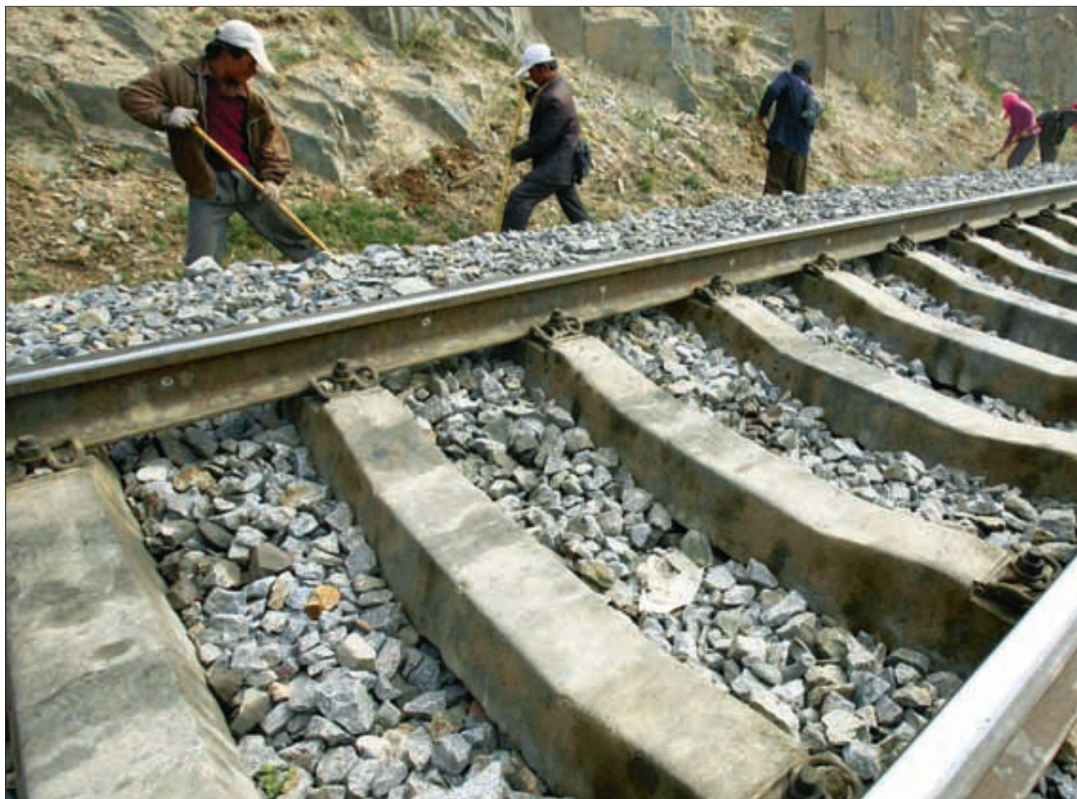
Arbeidere jobber på jernbanen mellom Qinghai og Tibet, et av mange gigantiske infrastrukturprosjekter Kina som har satt ytterligere fart i den kinesiske økonomi.

Krevende jobb. Bare få måneder etter at den kinesiske professoren ble Verdensbankens første ikke-vestlige