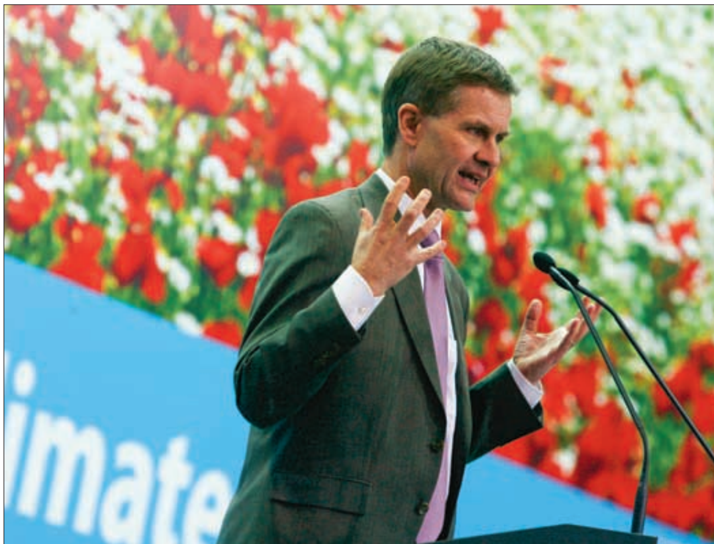
Utviklingsminister Erik Solheim under FN's klimakonferanse i Polen i desember. Klima blir en av de tre viktige satsingsområdene i den nye utviklingspolitikken.