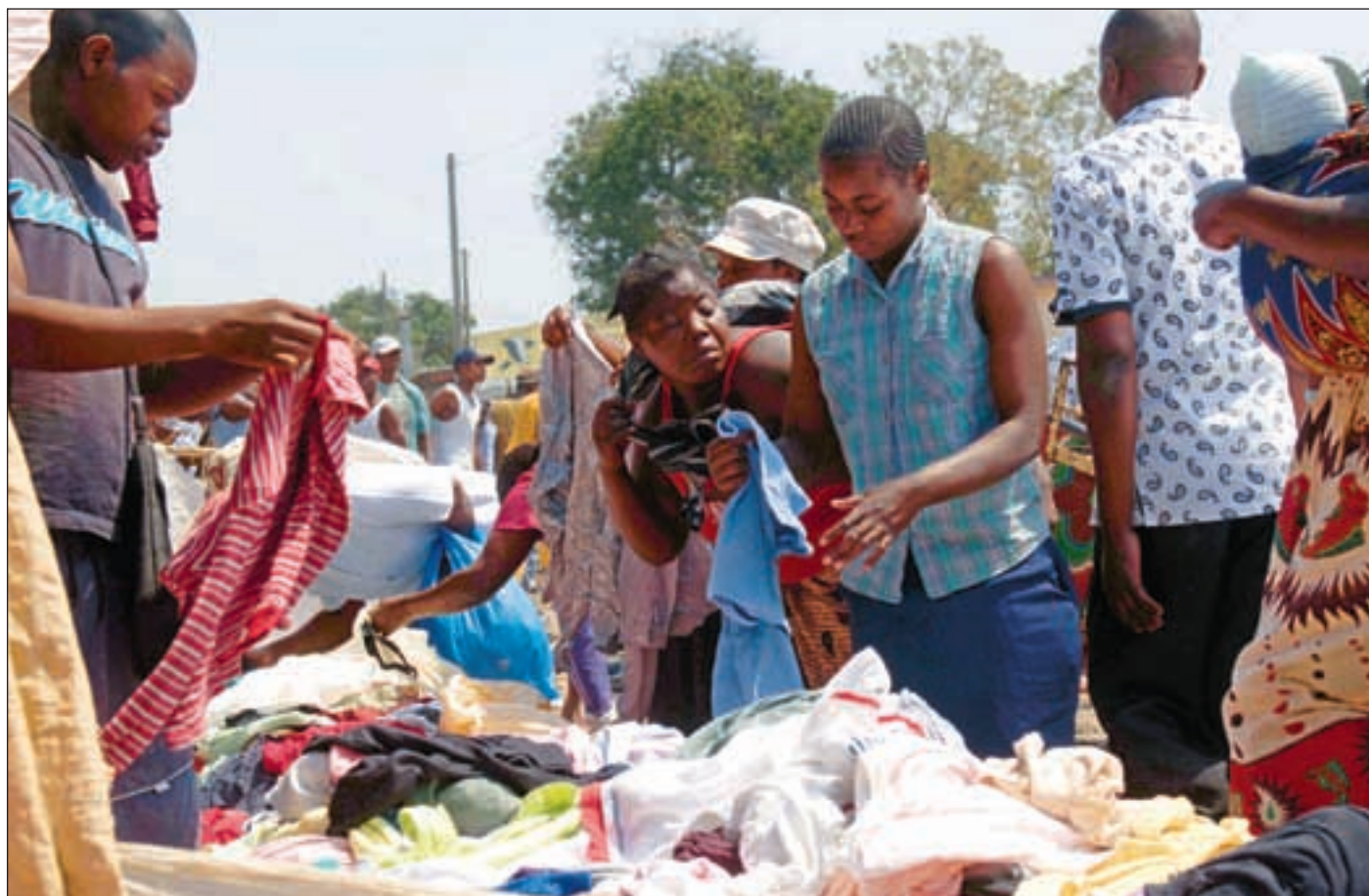
På markedet finner klærne sine nye eiere.

- Alle klær og sko vi kjøper i familien, kjøper vi brukt. For det første er det utrolig mye billigere. For det andre kan man ofte finne skikkelige merkevarer, og ikke bare de