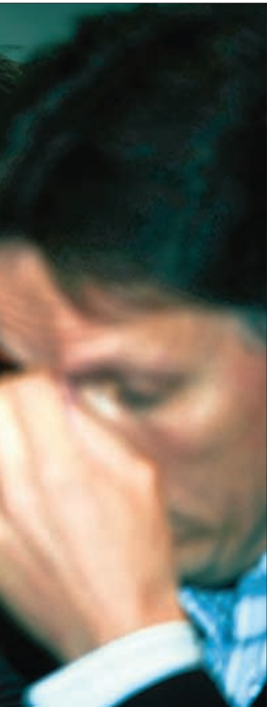
arbeidsforholdene hos telegigantens underleverandører

lig for norske bedrifter i et konkurranseutsatt marked, sier han.