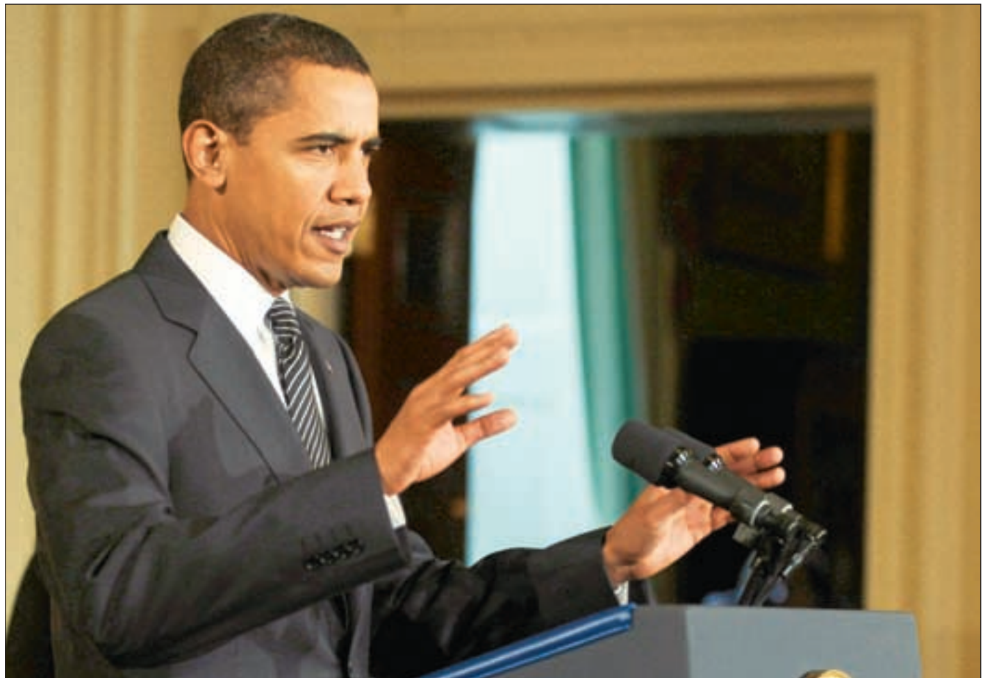
Allerede på sin andre dag som president avsluttet Barack Obama sin forgjengers politikk om å ikke gi amerikanske bistandspenger til organisasjoner som jobber med abortspørsmål.