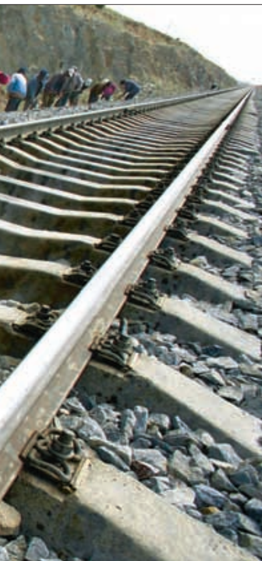
en de siste tiårene.