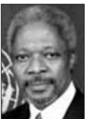
Kofi Annan , tidligere generalsekretær i FN, besøkte nylig Oslo.

- Dersom vi ikke er forsiktige, kan vi oppleve at store mengder dyrkbar jord overtas av utlendinger for at de skal produsere for egne markeder. Men hva skjer da med behovene til lokalbefolkningen? sier Kofi Annan til Bistandsaktuelt.