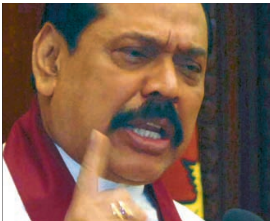
Sri Lankas president Mahinda Rajapaksa har hatt framgang i kampen mot LTTE. Dette gjør han populær blant det singalesiske flertallet, til tross for anklager om nepotisme og overgrep mot pressen.

Lederartikkel i siste utgave av UD-posten.