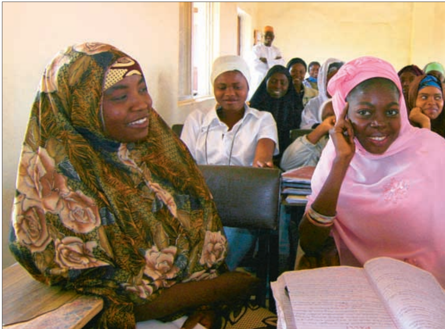
Jordmor- og sykepleierskolen i Gusau tar sikte på å utdanne 30 jordmødre årlig. Disse studentene tilhører det første kullet, og vil være ferdig utdannet i 2010.