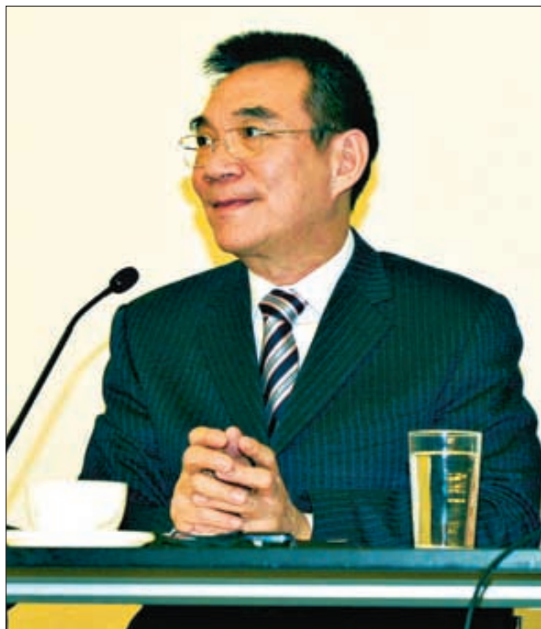
Justin Lin er den første sjefen i Verdensbanken som ikke er fra et vestlig land.