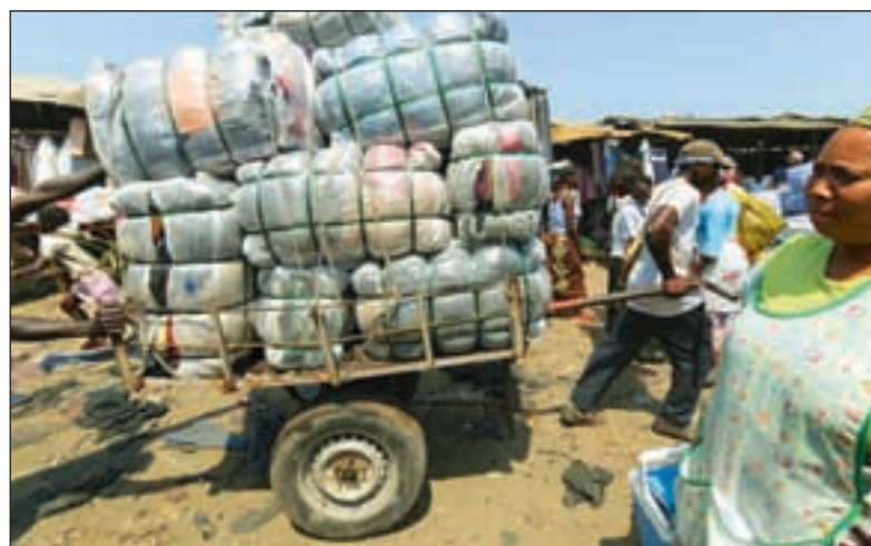
Klærne blir fraktet i kjerrer fra lagrene til det store Xipimanini-markedet.

Handelen innebærer store fordeler for de fattigste forbrukerne.