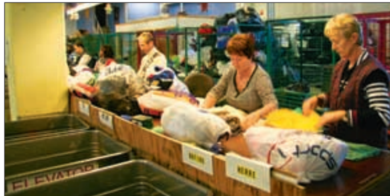
På Fretex' lager på Alna i Oslo sorteres tonnevis med norske brukte klær. En del av dem ender opp i Afrika.