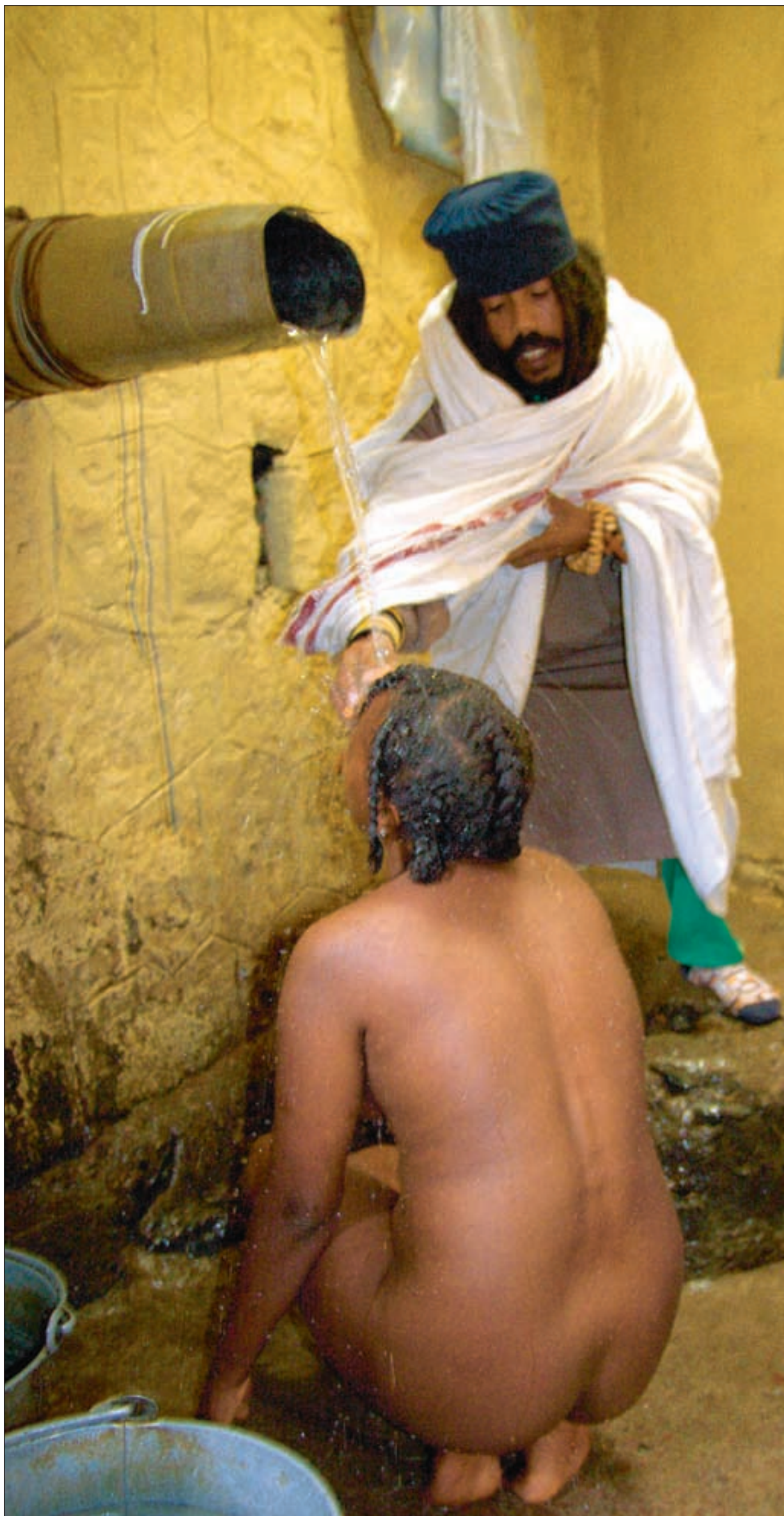
En munk ber for en kvinne som søker helbredelse ved hjelp av hellig vann.