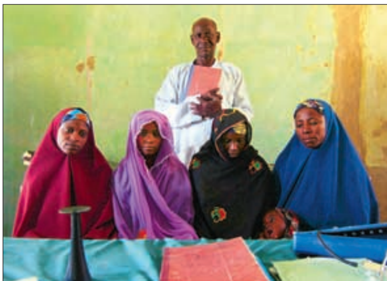
Helsestasjonen i landsbyen Nahuche. Disse kvinnene går til ukentlig svangerskapskontroll, men et flertall av befolkningen på landsbygda har svært begrenset tilgang og kjennskap til det som finnes av primærhelsetjeneste.