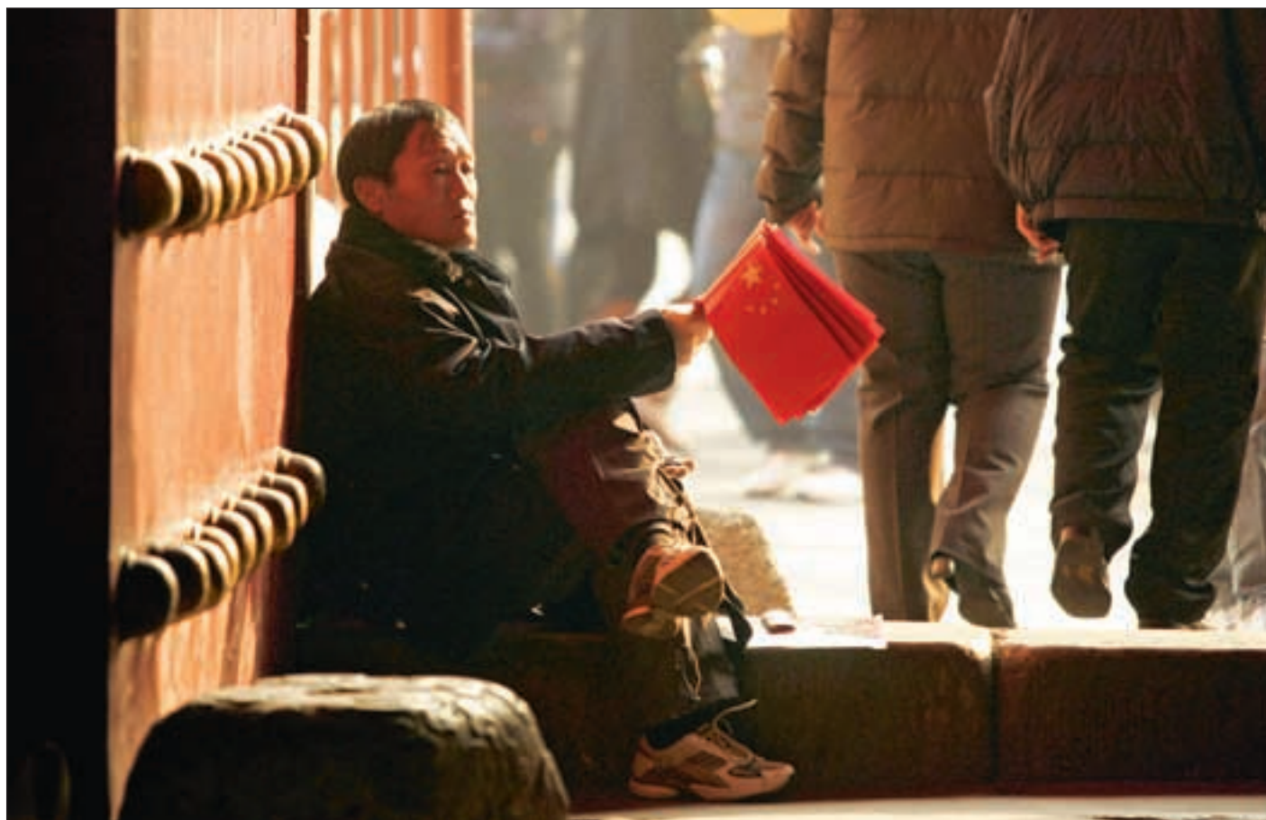
UNDP frykter at de voksende forskjellene i Kina kan true den videre utviklingen i Kina.

Ifølge nye og oppjusterte tall fra Verdensbanken er det om lag 210 millioner kinesere som lever under