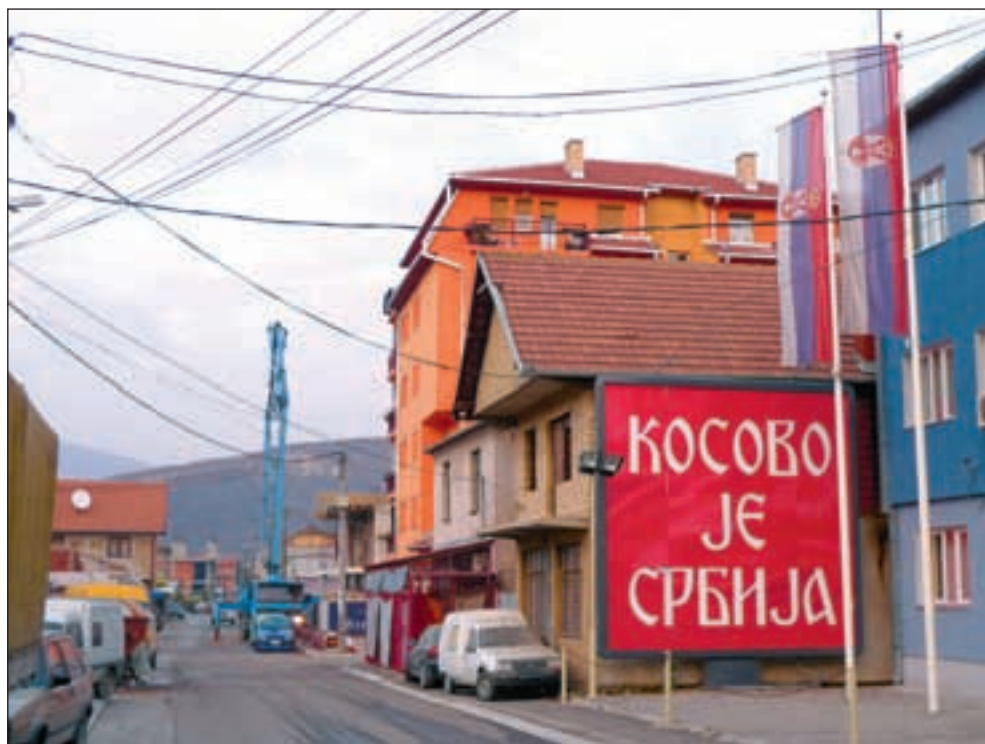
Storpolitikken er til stede i gatene i Mitrovica. På skiltet står det: «Kosovo er Serbia».

– Dette er helt i startfasen, og det er uklart hvilken modell som vil bli