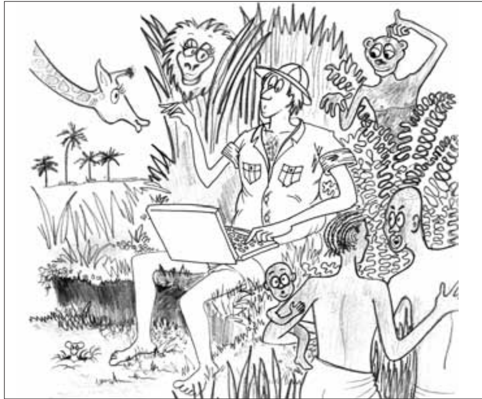
TEGNING: ARVE NORHEIM

Broughton ønsker seg flere lokale stemmer inn i nyhetsformidlingen. En viktig hensikt er å åpne for ulike kulturelle og nasjonale måter