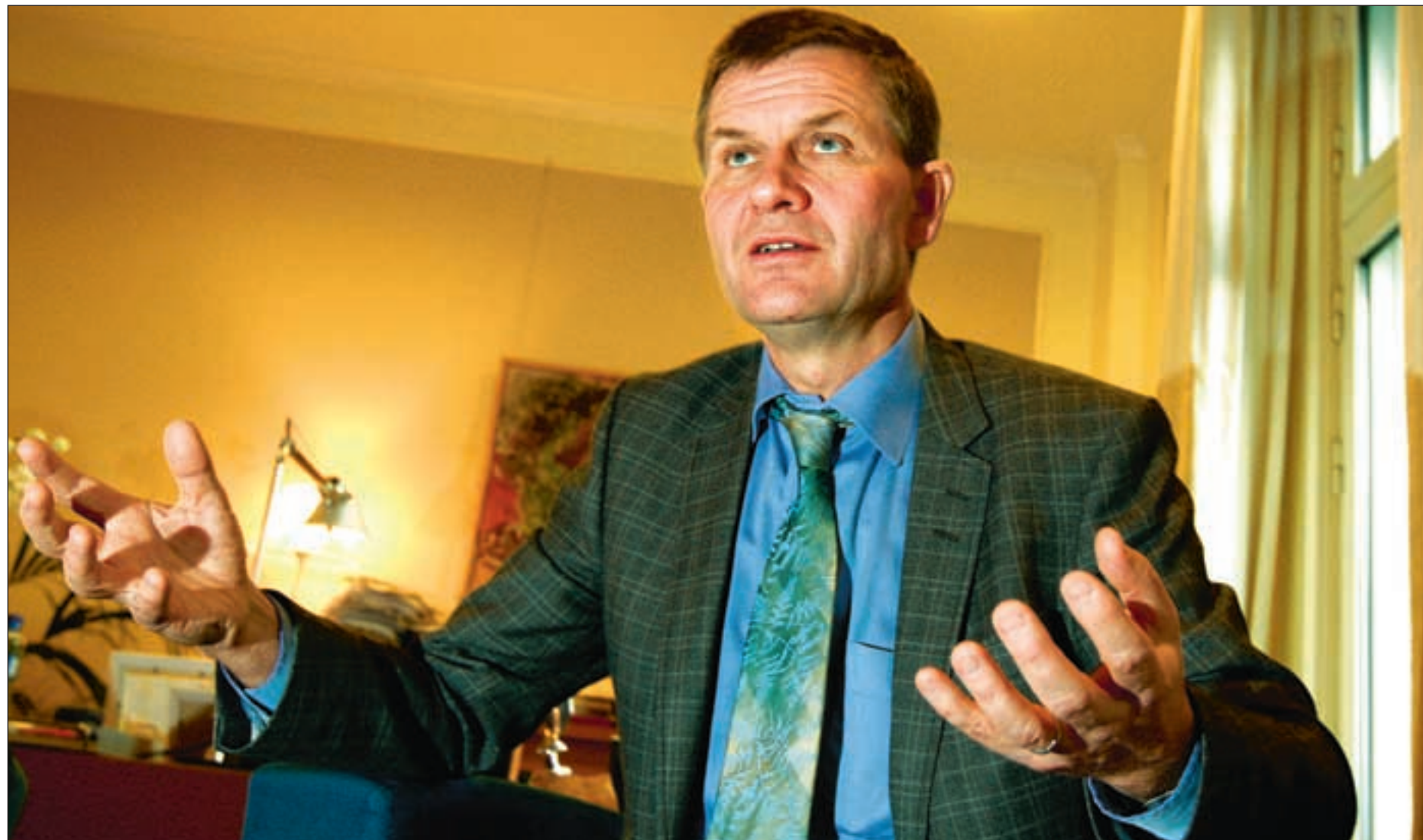
I Tanzania mangler det dokumentasjon for bruken av 150 av 300 millioner kroner i norsk støtte til et miljøprogram. – Helt uakseptabelt, sier utviklingsminister Erik Solheim.