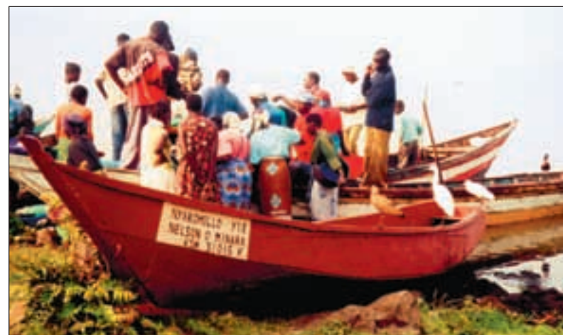
Når båtene ankommer er det kamp om de små fangstene.

Færre fiskeboder. Fiskemarkeder som Dunga, som en gang var fylt med fargerike klær og lystig kjekling idet fisk ble kjøpt og solgt under den blå himmelen, er ikke lenger så yrende. Der det for sto fiskeselgere, dukker det nå opp hånd-