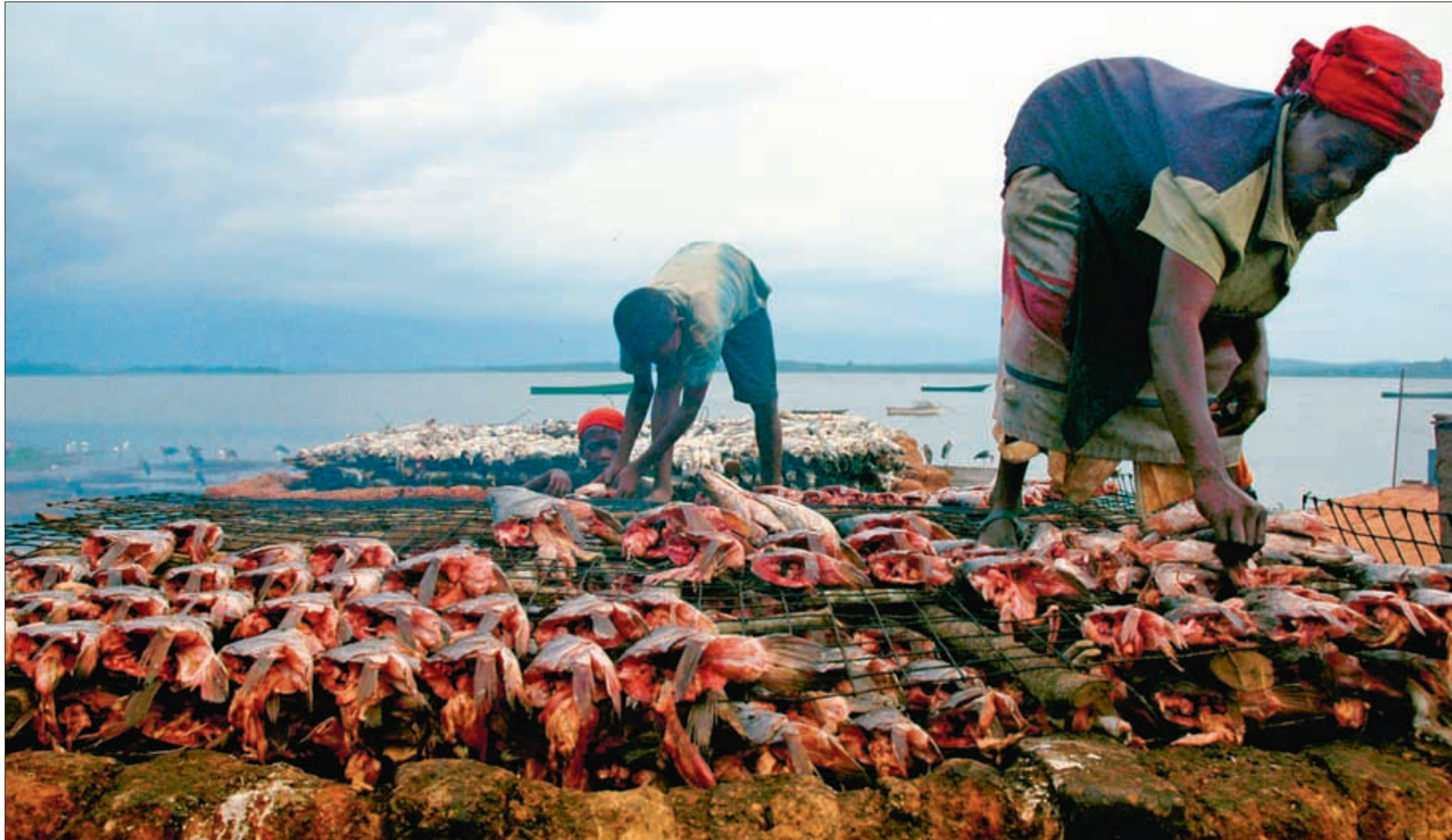
Victoriasjøen er av stor økonomisk betydning både for land og innbyggere, men de siste årene har fangstene sunket i takt med at det har blitt mindre og mindre vann i innsjøen.

Under møtet vårt en overskyet formiddag i Dunga klarer hun ikke å skjule sin frustrasjon. En etter en er båtene kommet til land med lite fisk. Kampen om fisken er intens og kvinnene slår etter hverandre med