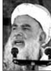
Abdul Rasoul Sayaf.