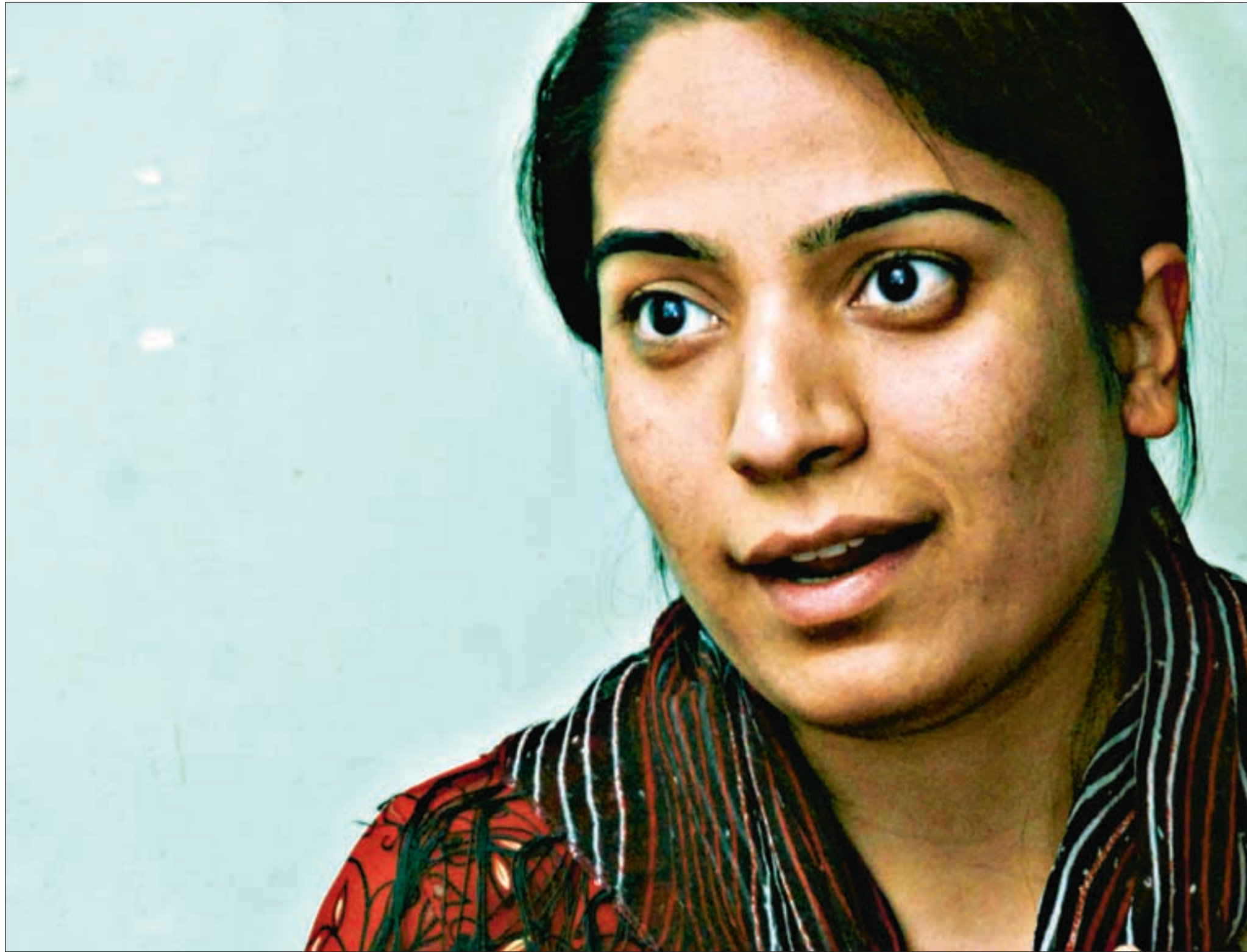
Malalai Joya s angrep på det hun mener er korrupte maktmennesker og krigsforbrytere i Afghanistans regjering har gitt henne mange og farlige fiender.

Og hennes kamp mot korrupsjon og krigsforbrytere og for kvinners rettigheter, åpenhet og demokrati har gjort henne populær, særlig blant fattige folk. Hun deltar i radioprogrammer og blir tiljublet