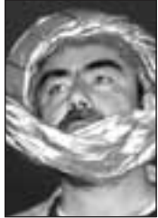
Abdul Rashid Dostum.