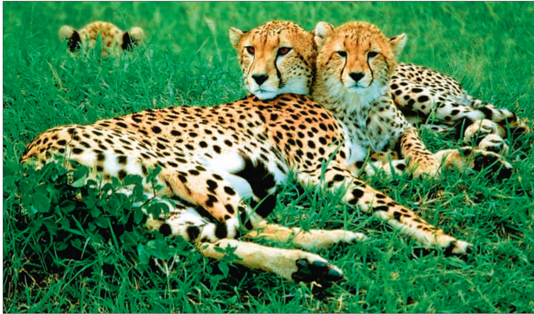
Gepardene i Masai Mara opplever stadig oftere å bli «skutt» av europeiske turister på fotojakt. For Kenya betyr det viktige økte inntekter.