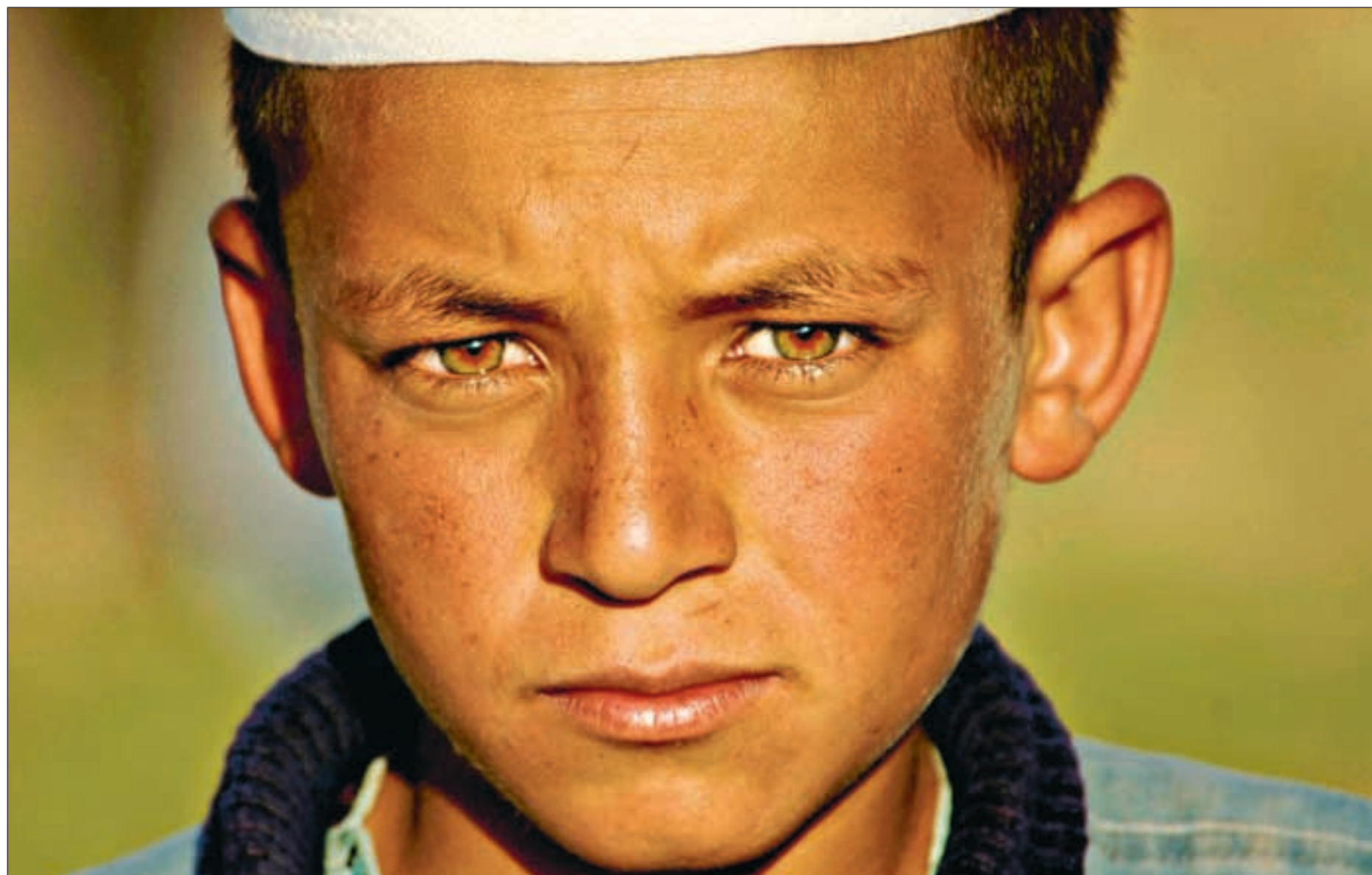
Er det flere vestlige militære eller er det skole, vei og mat som skal til for å trygge framtida til denne gutten i en fattig landsby i Afghanistan?