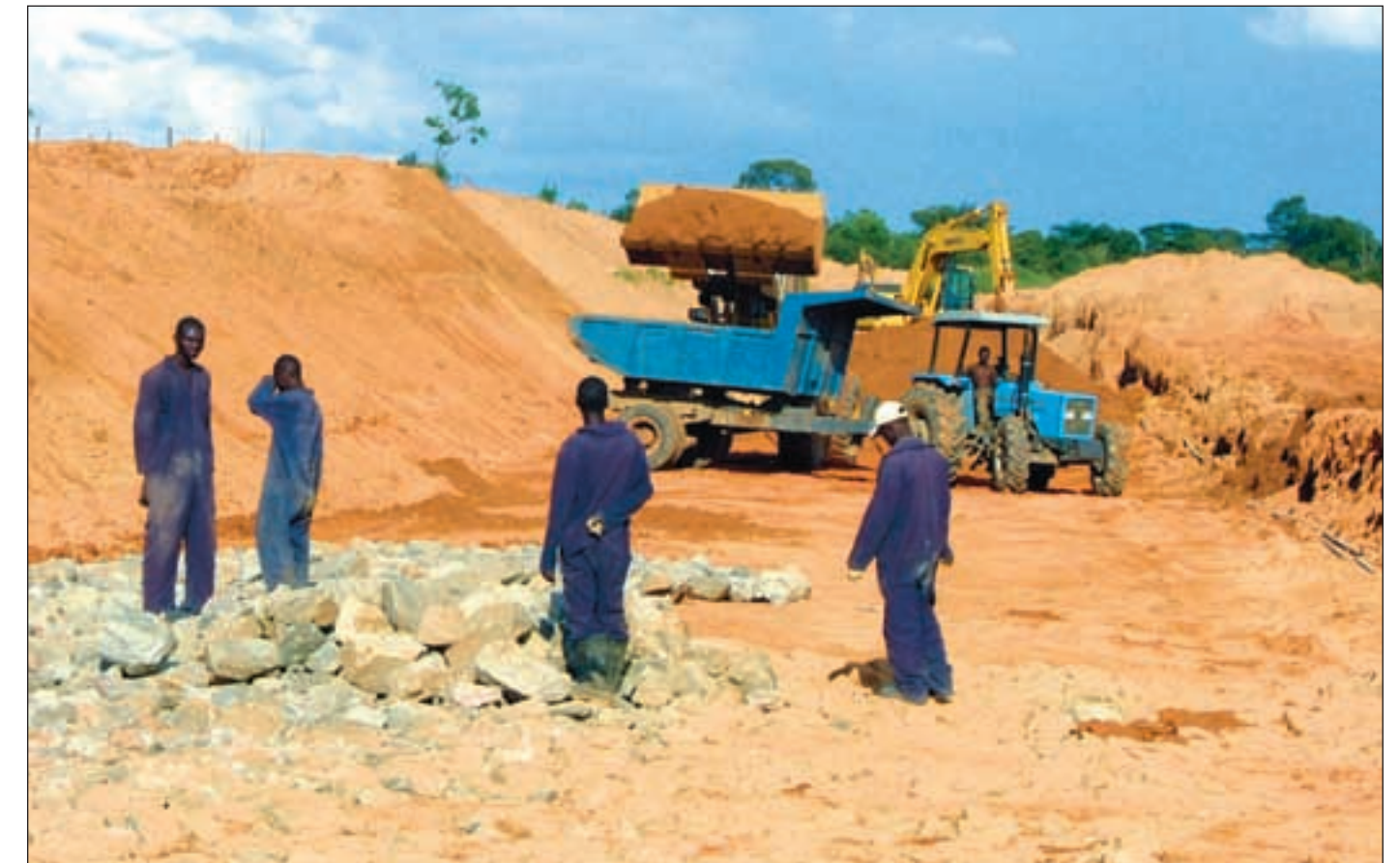
Arbeidsforholdene er tøffe for zambiske ansatte i kinesiske selskaper.

I andre gruveselskaper får arbeidere som mister jobben en godtgjørelse, men noe slikt finnes ikke ved Sino-Metals. Arbeidere som utsettes