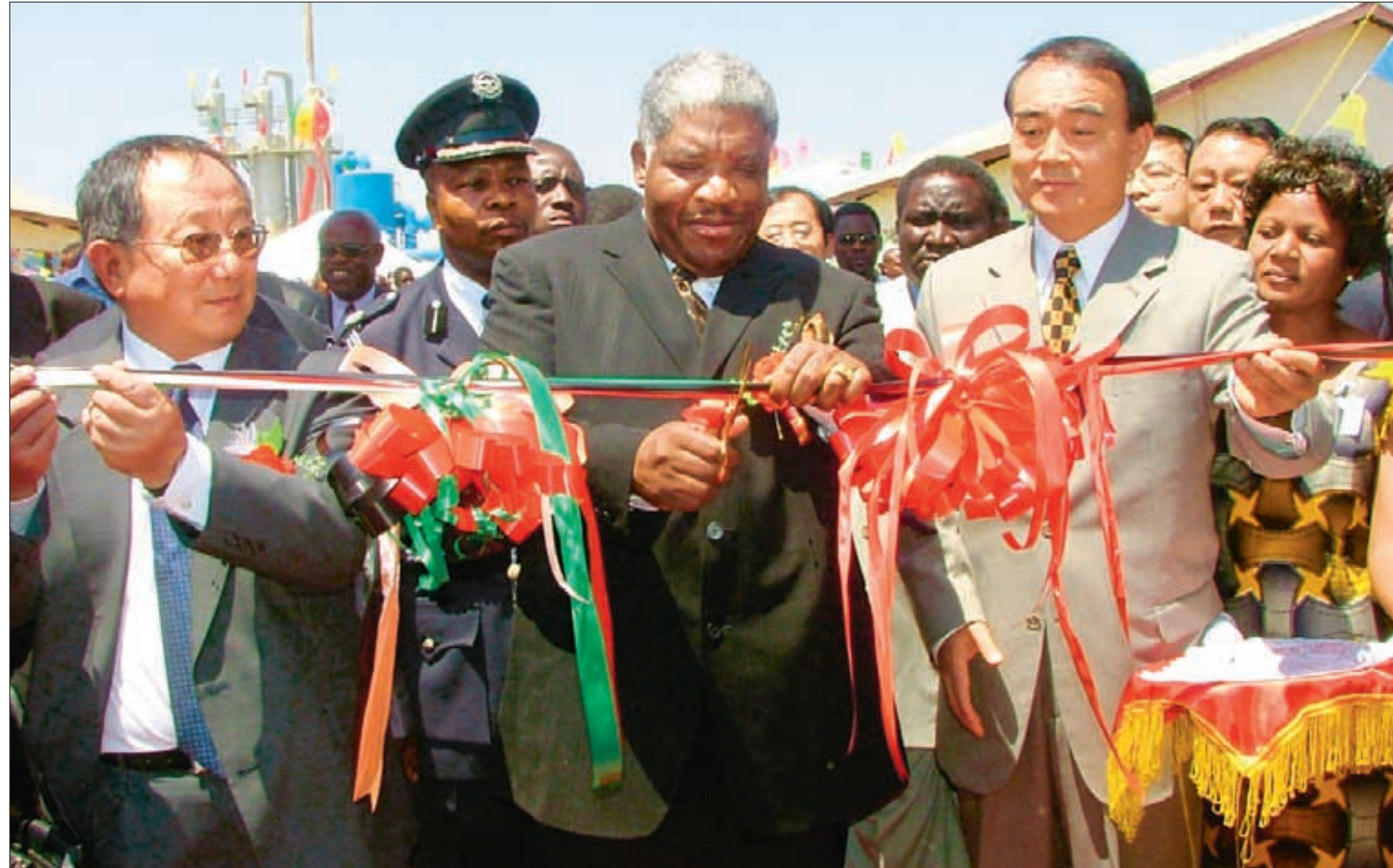
Med Kinas ambassadør Li Baodong som tilskuer forer Zambias president Levy Mwanawasa den offisielle åpning av lut- og syreanlegget ved Sino Metals i september 2006. Anlegget har kapasitet til å produsere 8000 tonn kobber per år.

Mens den best betalte arbeideren i Sino-Metals tjener 1,5 millioner kwacha (om lag 2200 kroner), er topplønnen i søsterselskapet Sino-Acid bare 300.000. Arbeidskontrak-