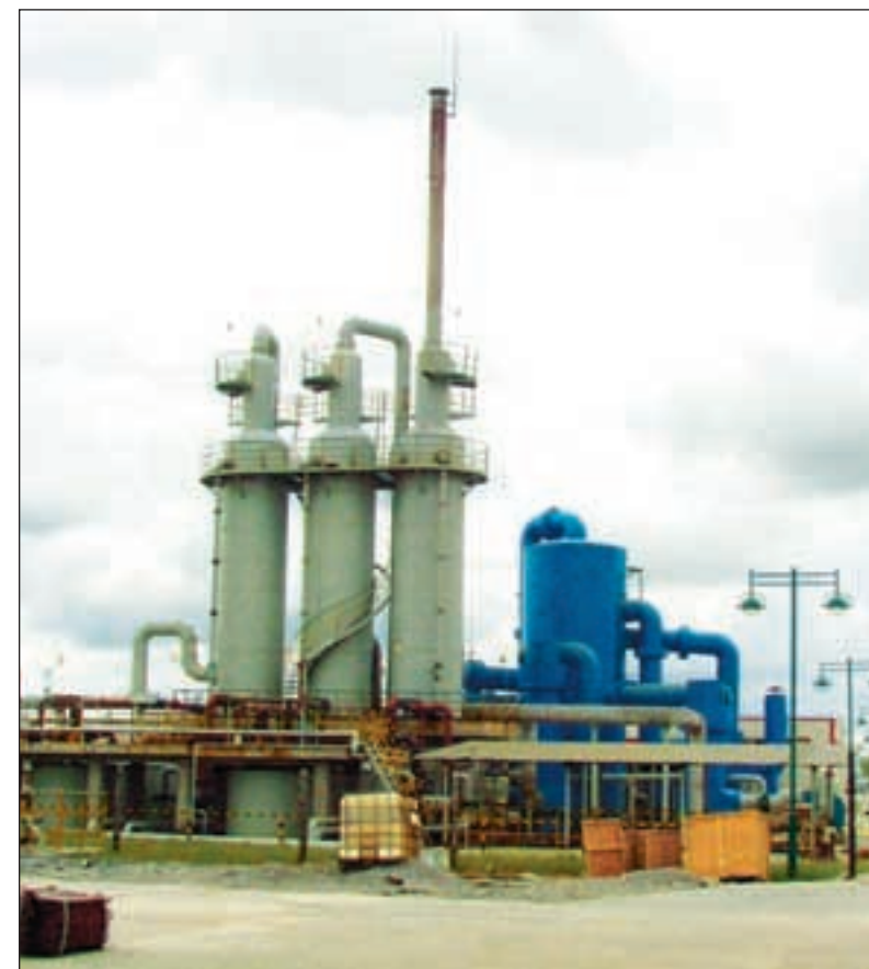
Det nye syreanlegget ved Sino-Acid i Chambishi.

Fagforeningslederen er selv blant de arbeiderne som blir utsatt for gass og syre fra kobber. Av helsemessige årsaker mener han at arbeidere burde ha rett til en kartong melk daglig – noe kineserne sjelden