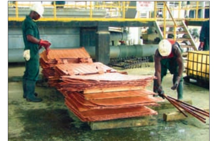
Arbeidere ved Sino Acid klargjør kobberplater som skal eksporteres til Sør-Afrika.

opptil ett år før arbeidere får erstatning etter ulykker.