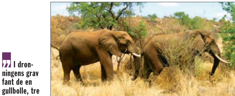
Elefanter, bavianer og antiloper vandrer mellom hyttene på de tre leirene i Mapungubwe-parken. Området er nylig innviet som naturreservat og kulturpark.

et område på 30.000 kvadratkilometer. Befolkningen drev handel, jakt, jordbruk og kvegdrift. Handelsvirksomhet i området ved elvenes møtepunkt begynte allerede på 900-tallet.