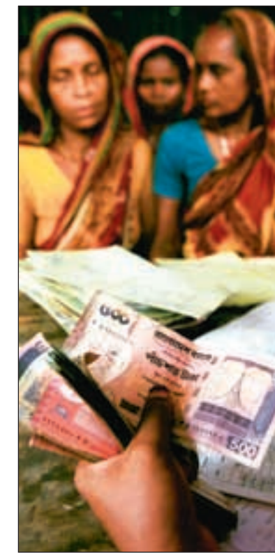
Gruppens koordinatør har i oppgave å holde orden på regnskapene over tilbakebetaling.

antakelig mer oppfinnsomme enn andre, har Yunus alltid sagt.