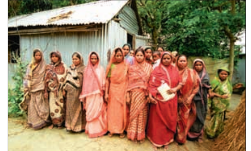
Medlemmer av lånergruppe står utenfor kontoret sitt etter det ukentlige møtet.