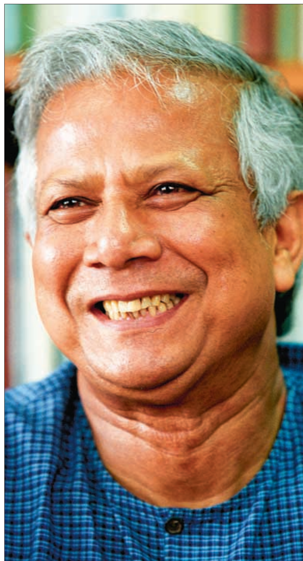
Økonomen Muhammad Yunus har en helt særegen status i Bangladesh.