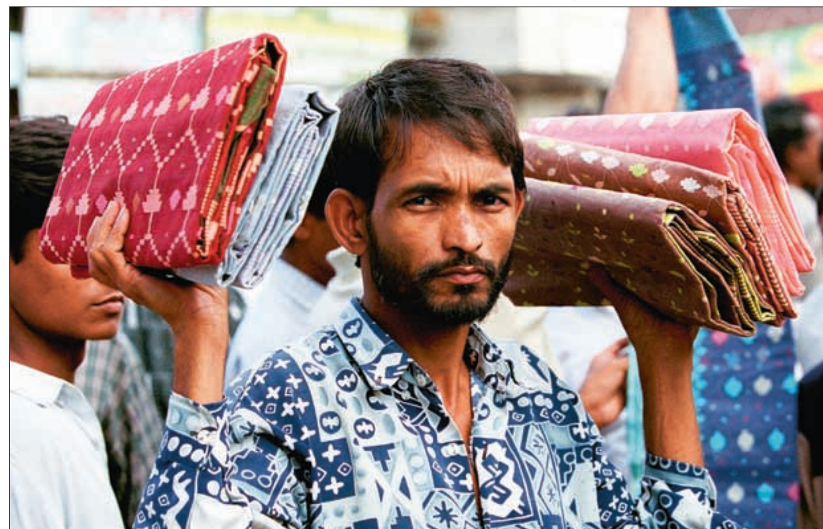
Mikrokreditt benyttes av millioner av næringsdrivende i småforetak i Sør-Asia.