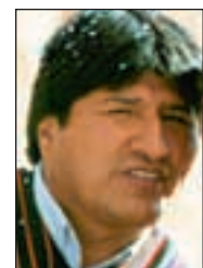
Evo Morales, Bolivias nye leder.