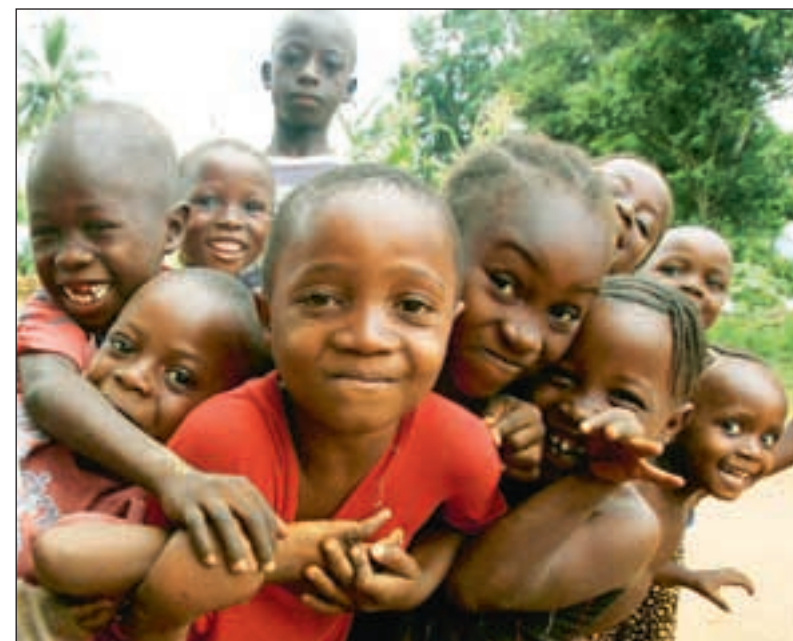
De to nordmennene er innstilt på et møte både med elendighet og smil og glede – som denne muntre gjengen fra Kailahun i Sierra Leone.