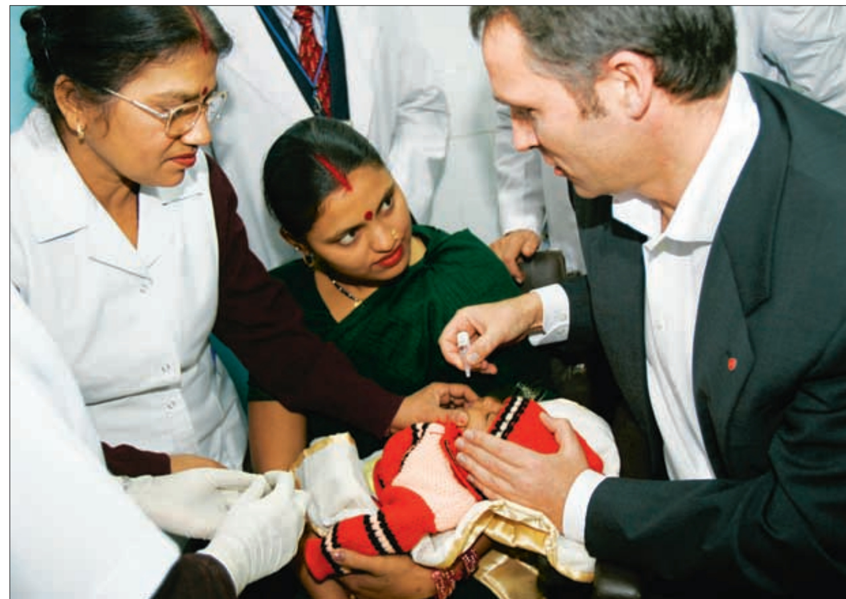
Statsminister Jens Stoltenberg poserte villig for fotografene under sitt besøk på et barnesykehus i New Delhi i desember i fjor.