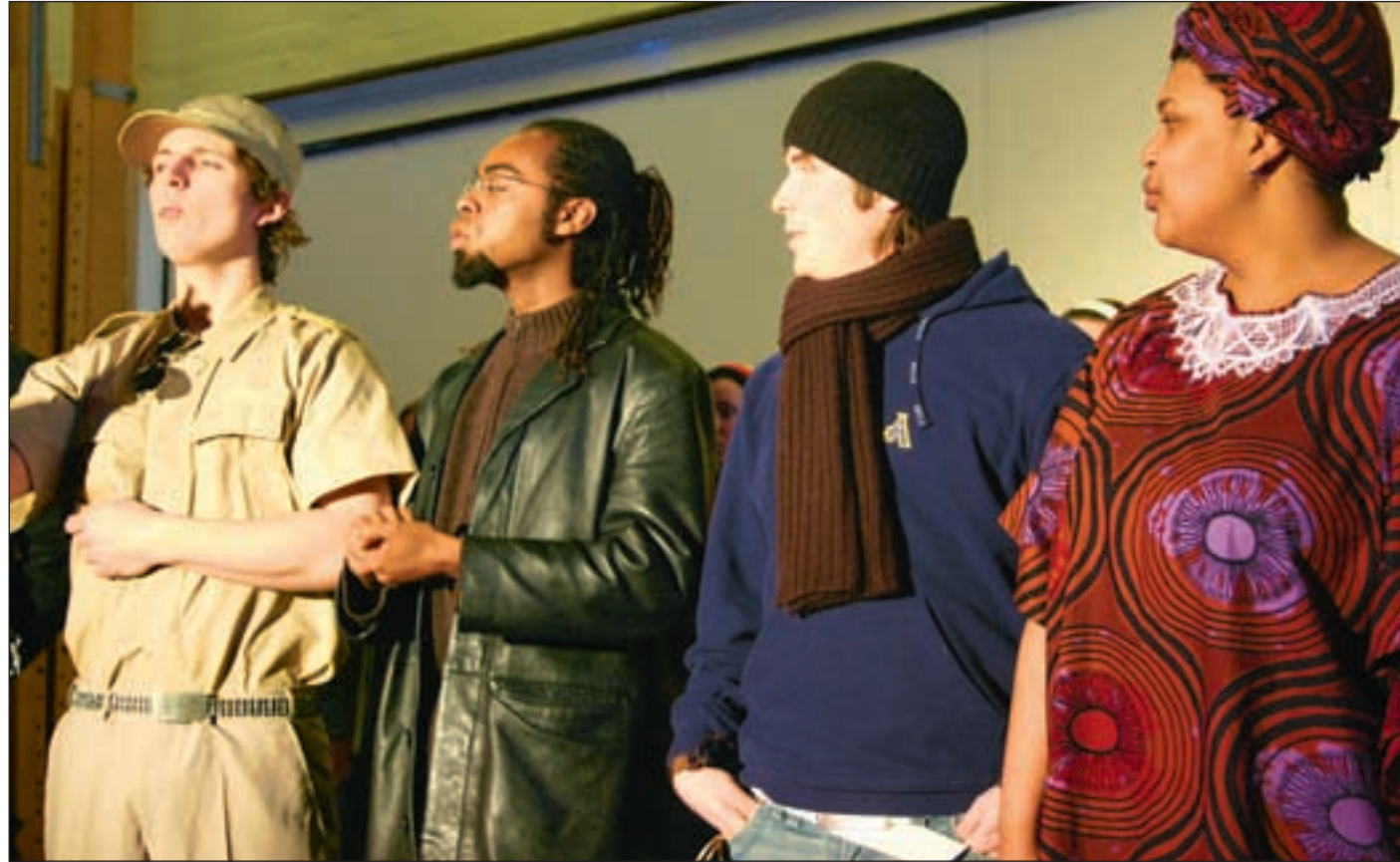
Studentene synger om Sør-Afrikas kamp mot raseskille.

- Jeg er stolt over å være sørafrikaner i Norge og representere landet mitt. Nå gleder jeg meg til pre-