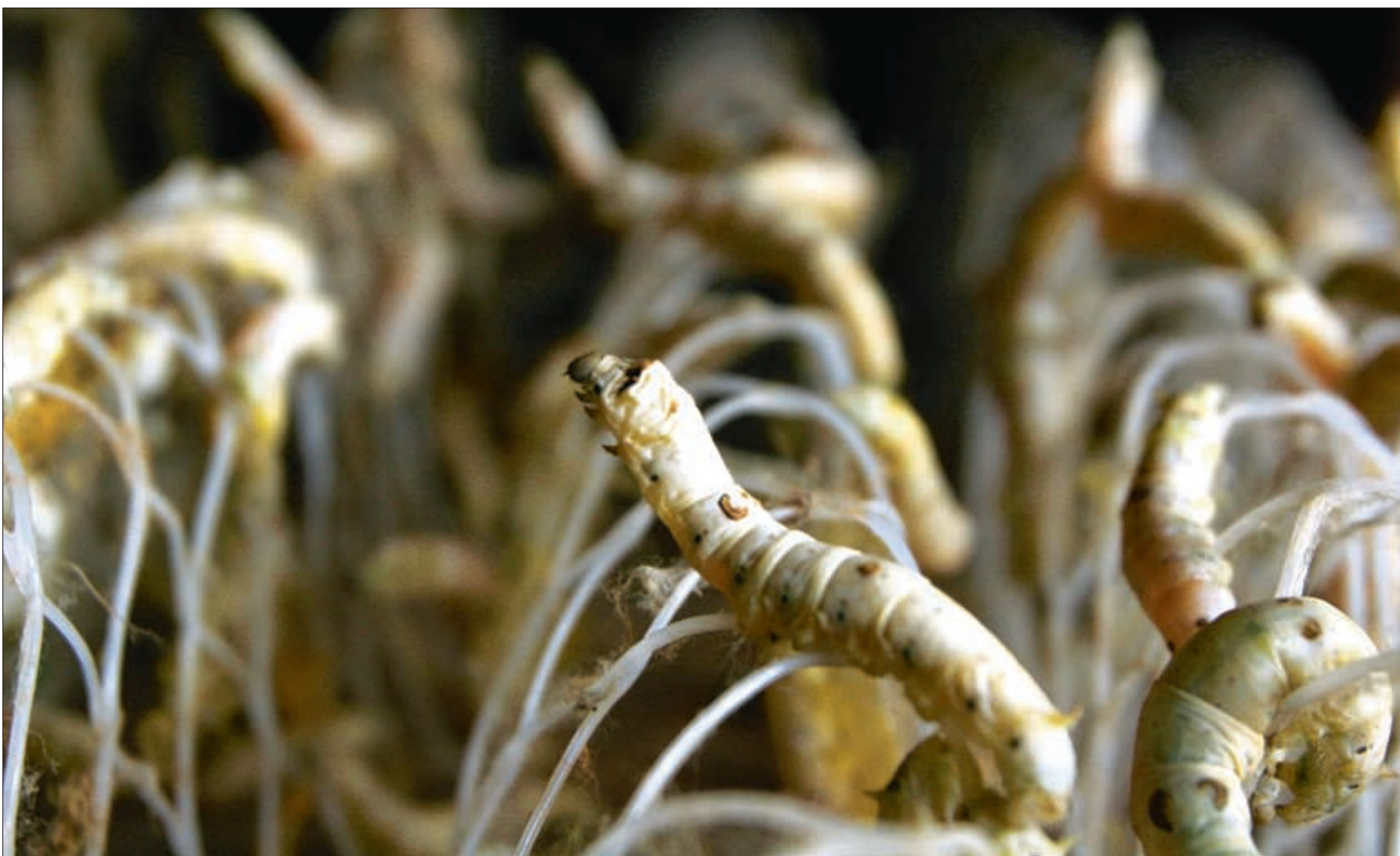
Hver dag snor silkeormene seg i et åttetall over 300.000 ganger. Slik bygges kokongene.