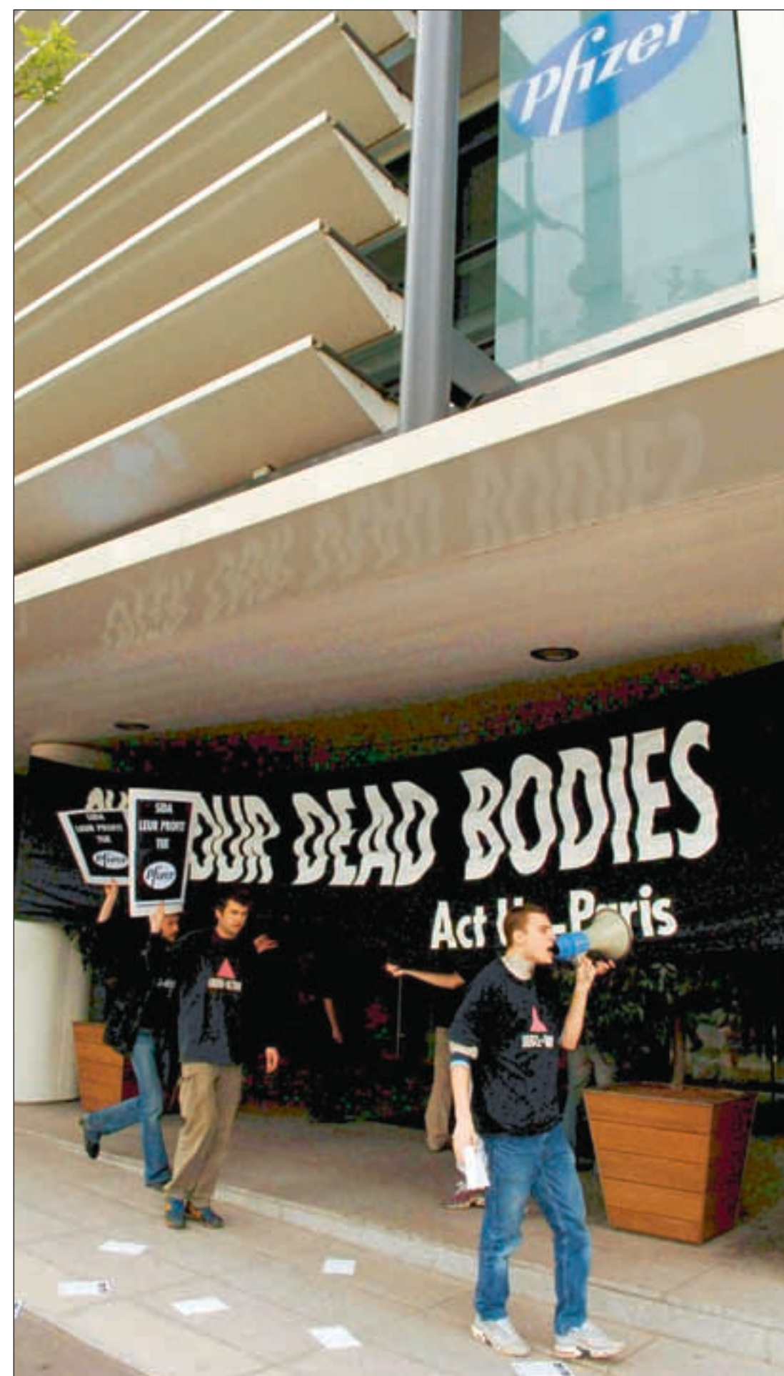
«Pfizers grådighet dreper – aidsmedisiner til Afrika!» ropte aktivister som protesterte utenfor selskapets hovedkontor i Paris i april 2005.