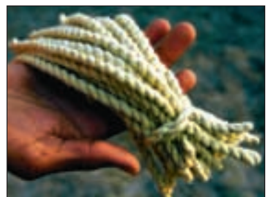
Bunter av silkestråd.

telige låntagere enn menn. De er fremtidsrettede og lite risikoorienterte. Dette underbygges av det faktum at over 99 prosent av BRACs låntagere er kvinner, og at 99,23 prosent av de 2,95 milliarder dollar BRAC har lånt ut er blitt tilbakebetalt i tide. Med renter. Selv om man skulle sammenligne med noen av de mest suksessrike bankene i verden, er dette en usedvanlig god statistikk.