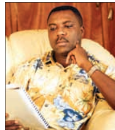
– Fokuset på familien og de personlige historiene gjør Nollywood-filmene så populære, sier regissør Adim .

Hjemmesnekret søppel? De fleste Nollywood-filmene spilles inn i løpet av et par uker og koster rundt 100.000 norske kroner. Og utstyret er enkelt – med bare ett kamera må Adim filme den samme scenen mange ganger for å få det hele fra ulike vinkler. Også kulisene er «low budget».