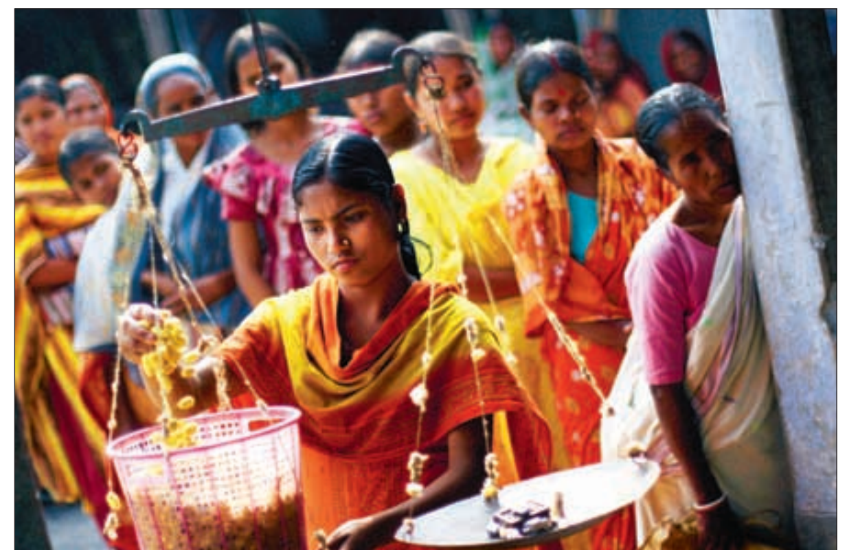
Kvinner i kø for å kjøpe kokonger på et BRAC-senter.