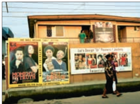
I Nigerias «filmhovedstad» Lagos lanseres det rundt ti nye filmer hver uke.