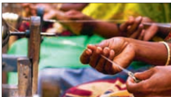
Først kokes kokongene, så spinnes de på en «charka» eller et spinnehjul for å få fram den fine, tynne tråden.

og har nå et jordstykke der hun planter morbæstrærne.