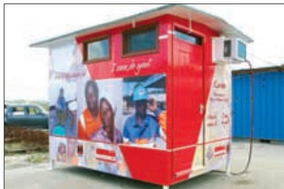
Slik ser den ut, infokiosken som nå blir å se på alle Noremcos anlegg i Tanzania.

med 80 prosent støtte. I tillegg kommer opp mot 90 000 kroner til sykehusbehandling hver måned, penger som Noremco betaler. Blant annet får de ansatte tilbud om gratis behandling av hiv/aids.