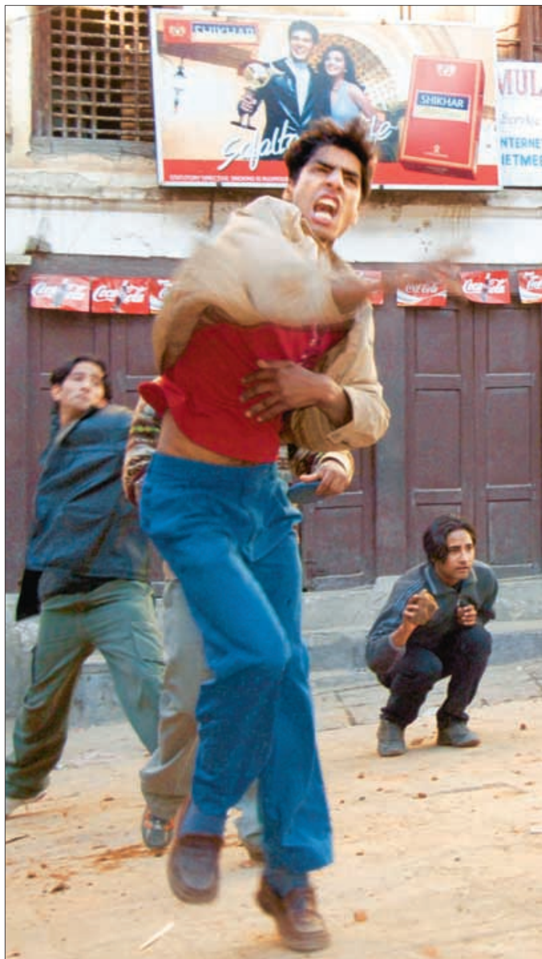
Bistandsaktuelt fotograf var tett på opprøret i Katmandus gater. Her kaster studenter stein mot regimets sikkerhetsstyrker.