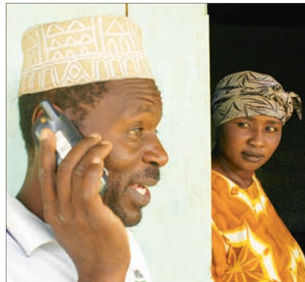
Mens de største byene i Tanzania flyter over av kostbare bredbånds- og mobilløsninger, må de fleste internettbrukere fortsatt henvises til trange nettkafeer og første generasjons mobilnett. De færreste har råd til å ringe med mobilen.

Fordelen med å ligge litt etter i utviklingen er at man av og til kan la andre høste kostbare erfaringer fra å være først i markedet. Nå er det for eksempel slik at millioenbyen Dar es Salaam samt fire andre større byer i Tanzania har trådløse soner for å knytte seg til bredbåndsinternett. Disse sonene dekker ikke bare deler av byen, men faktisk hele byen i en radius av 15 kilometer fra antennemasten, ifølge leverandøren Africa Online.