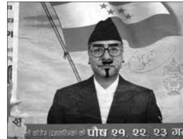
Mange nepalere tviler på de politiske partienes evne til å styre landet. Her er det lederen av Nepali Congress Party, Girija Prasad Koirala, som får gjennomgå.