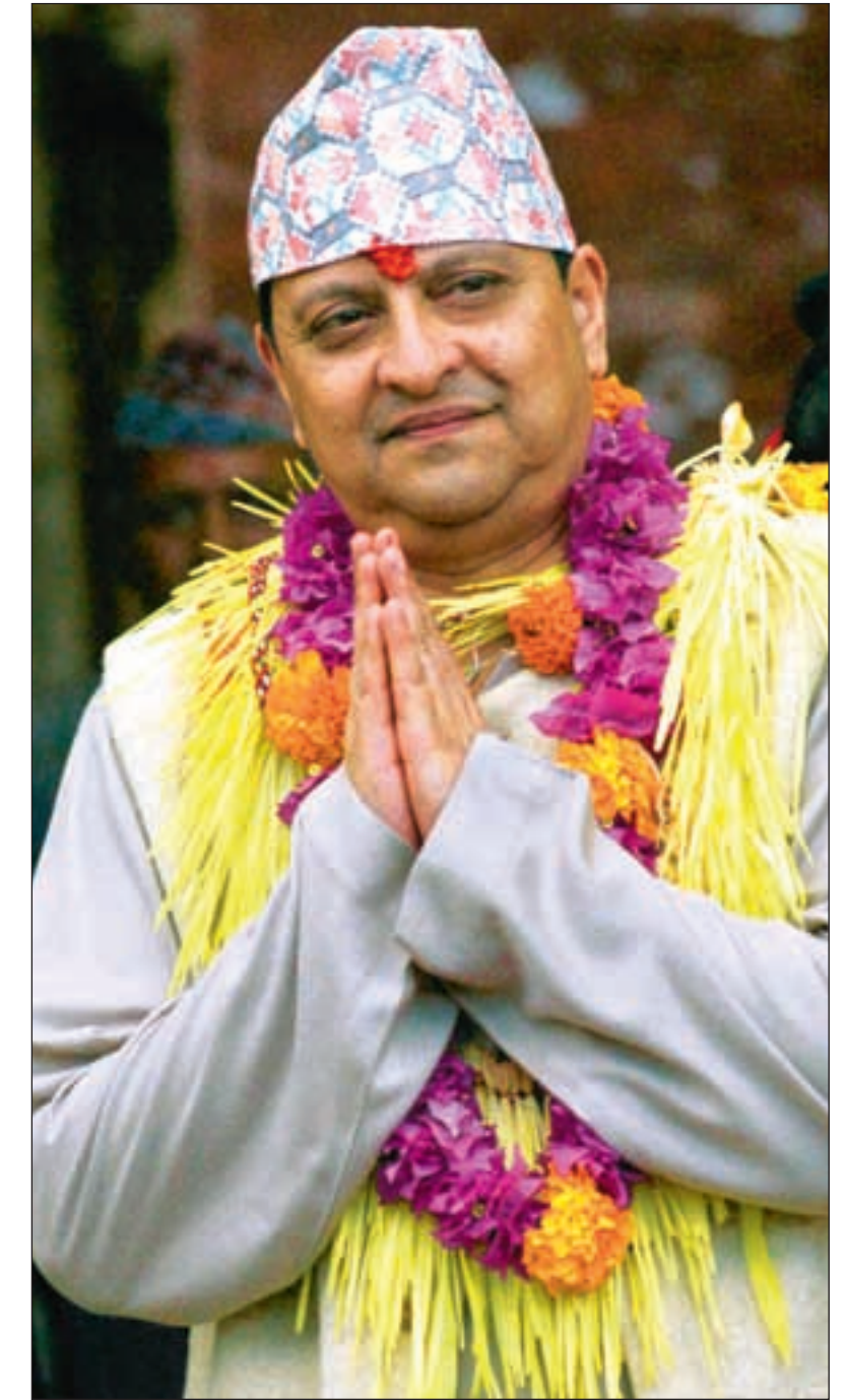
Mens de politiske partiene demonstrerer, reiser kong Gyanendra rundt på «folke-møter» i de østlige deler av landet – godt beskyttet av sine lojale hærstyrker.