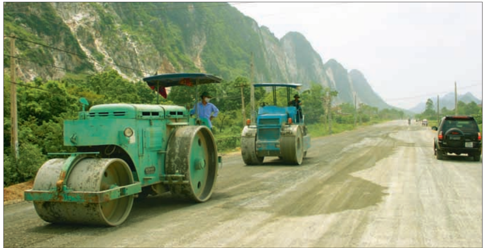
Infrastruktur er helt avgjørende for økonomisk vekst og dermed også for fattigdomsbekjempelse. Bildet er fra arbeidet med den nye Ho Chi Minh-veien i Vietnam, et land hvor både givne og myndighetene satses mye på investeringer i infrastruktur.

Infrastruktur har ikke vært et prioritert innsatsområde for norsk utviklingspolitikk de senere årene. Dette har ikke vært et særsnorsk fenomen, men snarere en internasjonal trend. Konsekvensen av dette er at andelen av internasjonal bistand til infrastruktur har gått ned fra 25 % til 15 % det siste ti-året. Denne nedgangen skyldes ikke bare manglende prioritering, men var også et resultat av troen på at privat sektor i