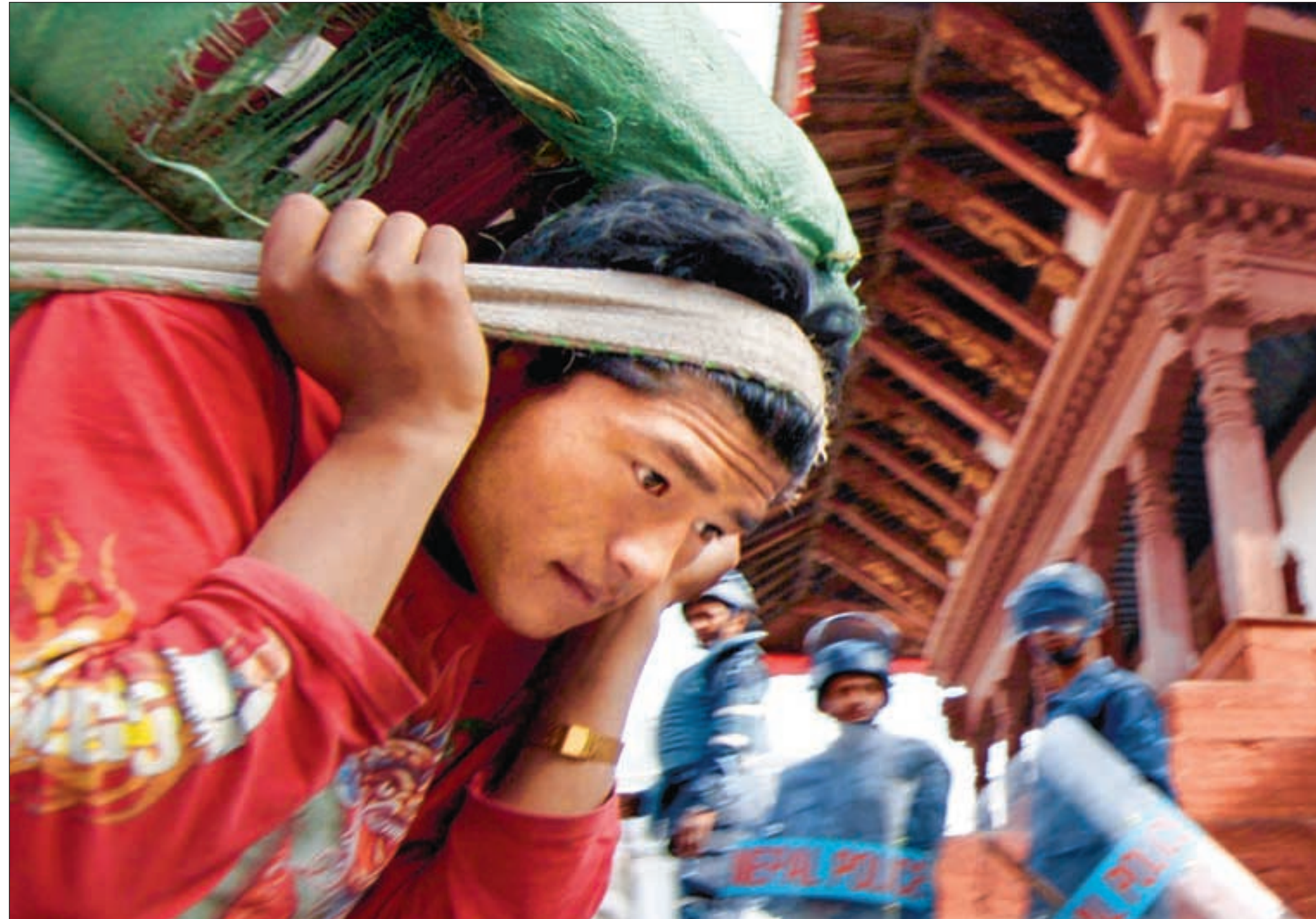
Mens opposisjonen hevder at de kan mobilisere hundretusener i proteststog mot regimet, påstår kongens talsmenn at «den tause majoritet» fortsatt sympatiserer med kong Gyanendra.

KATMANDU (b-a): Frontene hardner til i Nepal foran lokalvalgene kongen og de militære vil avholde i landet 8. februar. De politiske partiene og maoist-geriljaen mobiliserer nå folkemassene for å boikotte «valgfarsen». Men den militærstøttede monarken virker beredt til å ta alle midler i bruk for å holde på makten.