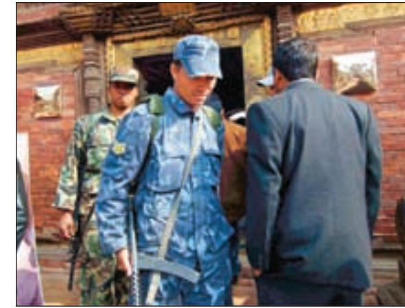
– Jeg tjener 400 kroner måneden og ser ikke familien mer enn to-tre ganger i uka. Det er en drittjobb, sier en av politimennene vi møter. Han gruer seg til bråket som vil komme.