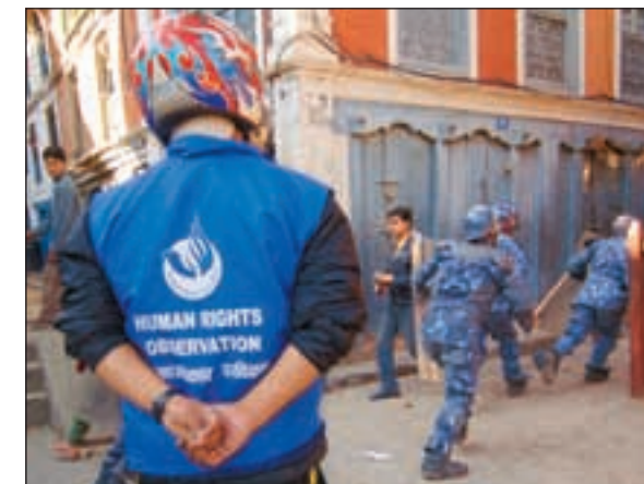
Observatører håper at internasjonale menneskerettighetsobservatører vil legge en demper på partenes lyst til å utøve vold.