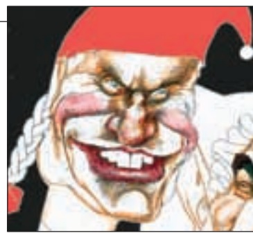
TEGNING: FINN GRAFF