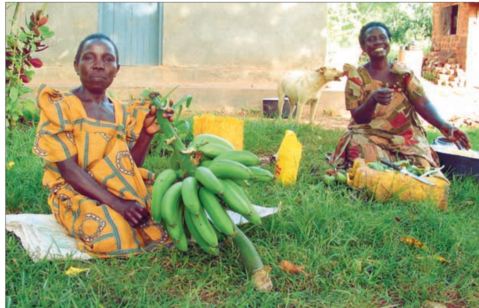
Kooperativer og landbruksutvikling har stått sentralt for bistandsvirksomheten til Selskapet for Norges Vel. Disse ugandiske kvinnene er med i ett av prosjektene.