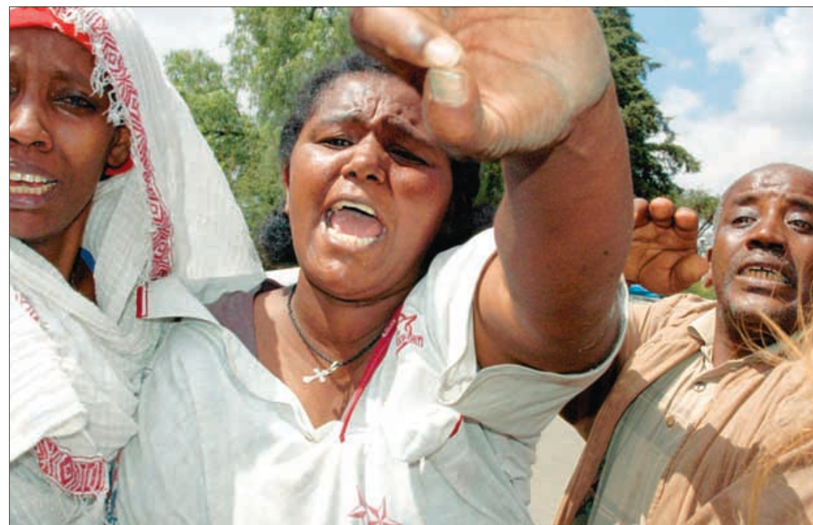
En etiopisk kvinne roper ut sin frustrasjon over politiets voldsbruk 2. november i år. Minst ti ungdommer ble drept under sammenstøtene i hovedstaden denne dagen.