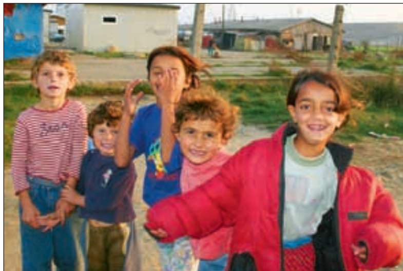
Boligmangel er fortsatt et stort problem i Kosovo. I Plementina utenfor Pristina bor disse sigøynerbarna i en brakkeliggende leir.

Flyktningerådet trekker seg ut. Mangel på tilbakeflytting gjør at