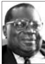
Goodall Gondwe, Malawis finansminister.

Givene har bestemt at IMF skal være politi, men noen av folkene IMF sender til Afrika er for uerfarne for oppgaven.