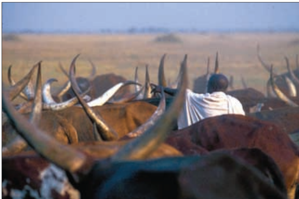
En normal brudepris er fra to til tolv kuer, alt etter brudens status.

Det er også vanlig å sørge for mat til alle de frammøtte i begra-