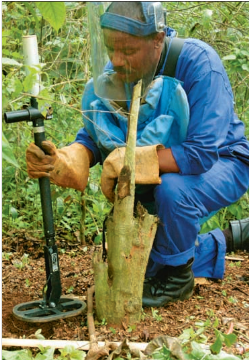
Årlig er det trolig om lag 15-20.000 mineulykker. Denne minerydderen jobber i Angola, ett av de landene der landminer utgjør et stort problem.