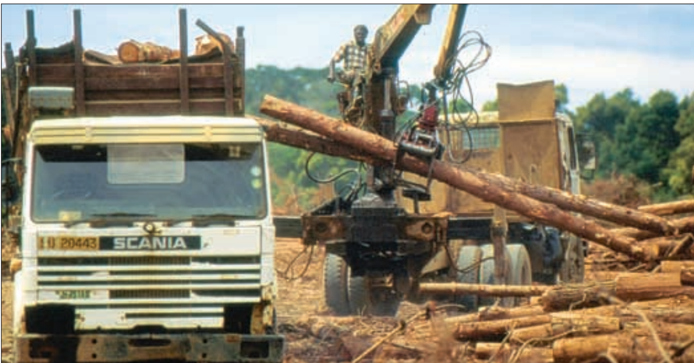
Store arealer med skog i Tanzania blir nå hogd ulovlig ned og eksportert – hovedsakelig til Kina.

Det er på tide at givernes og myndighetene nå hever blikket utover sitt arbeid med fremtidig planlegging og koordinering, og griper skikkelig fatt i denne saken.