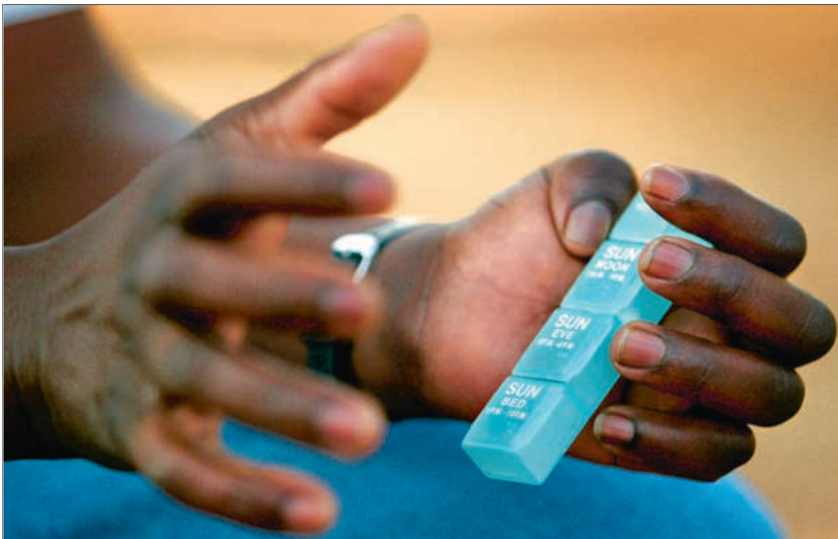
Slik ser de ut, pillebeholderne fra legemiddel-giganten Merck som benyttes under Botswanas gigantiske kampanje for å gi medisin til hiv/aids-pasienter. Foreløpig deler Botswana regningen med bistandsgivere som Bill & Melinda Gates Foundation.