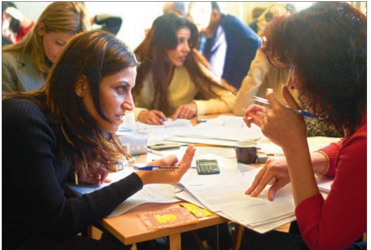
Hektisk regnevirkosomhet for de irakiske kursdeltakerne. Nå skal de se om ideene deres er økonomisk bærekraftige eller ei.

- Tanken med å holde slike kurs, er å koble tiltak i Norge med tiltak ute - et såkalt «tosporet løp», fortel-