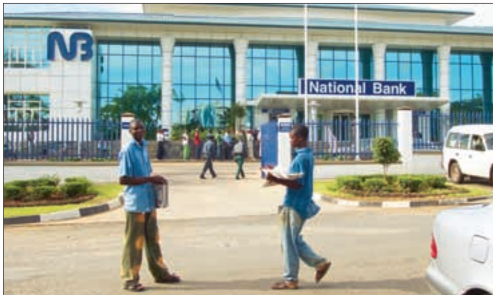
Da givne plutselig stanset budsjettstøtten, måtte Malawi ta opp store lån i private banker.

Han forteller at de to siste IMF-vurderingene av Malawi har vært positive, og fortsetter myndighetene denne utviklingen vil IMF trolig kunne starte utbetalinger i løpet av 2005.