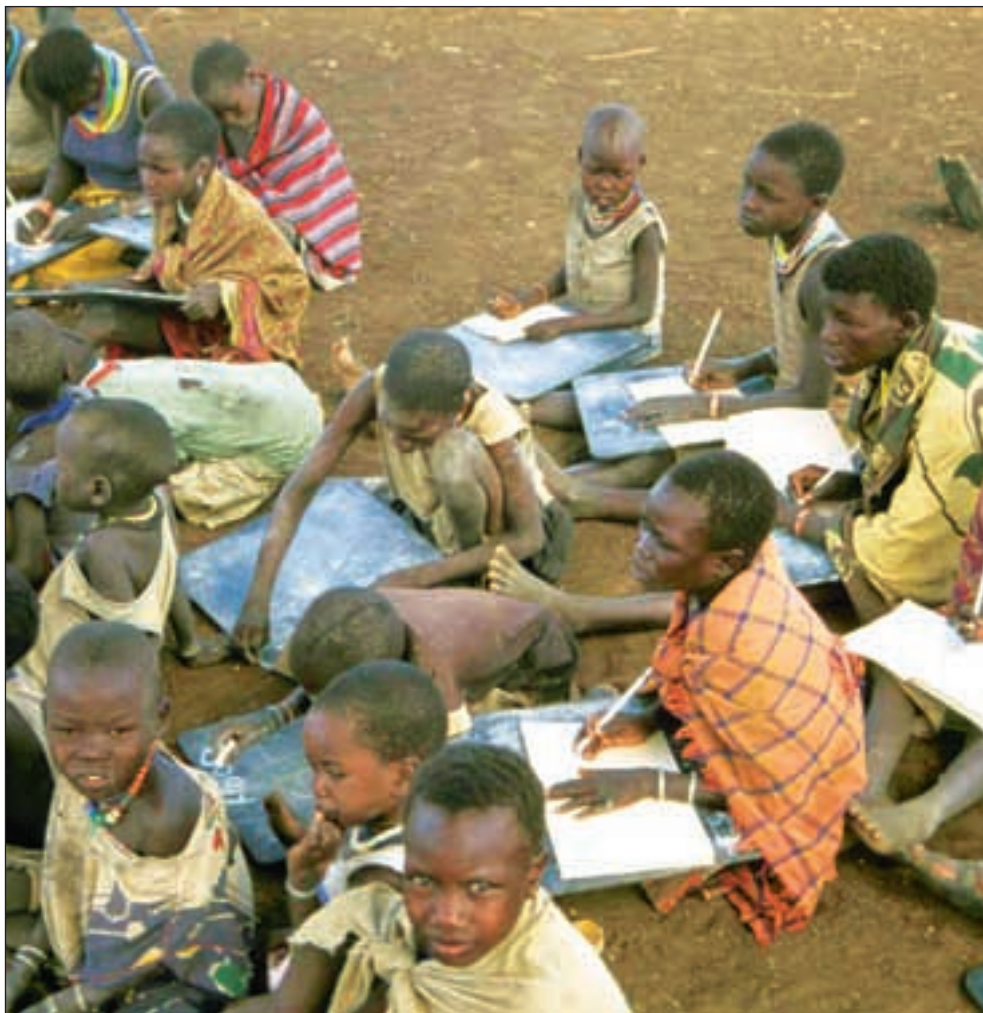
Bistanden fra OECD-landene til de fattigste landene – som her fra Uganda – er halvert på 40 år, viser en rapport fra Oxfam.

Politisering og gjeld. I tillegg til at bistanden er blitt redusert, er det kun 40 prosent av bistandspengene som faktisk går til de fattigste landene. De to største mottakerne av fransk bistand er for eksempel Fransk Polynesia og Ny Caledonia,