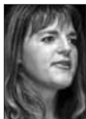
Hilde Frafjord Johnson, utviklingsminister

DAC må rett og slett bli proffere og bedre faglig, slik at de bidrar til å drive givene i riktig retning.