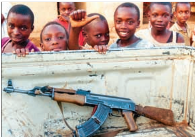
Barna i Makamba har aldri opplevd en verden uten soldater og geværer.

hvor til sammen én million mennesker er på flukt i utlandet eller er internt fordrevne.