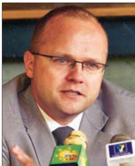
Statssekretær Vidar Helgesen (H) ivrer for fredssamtaler i Uganda.