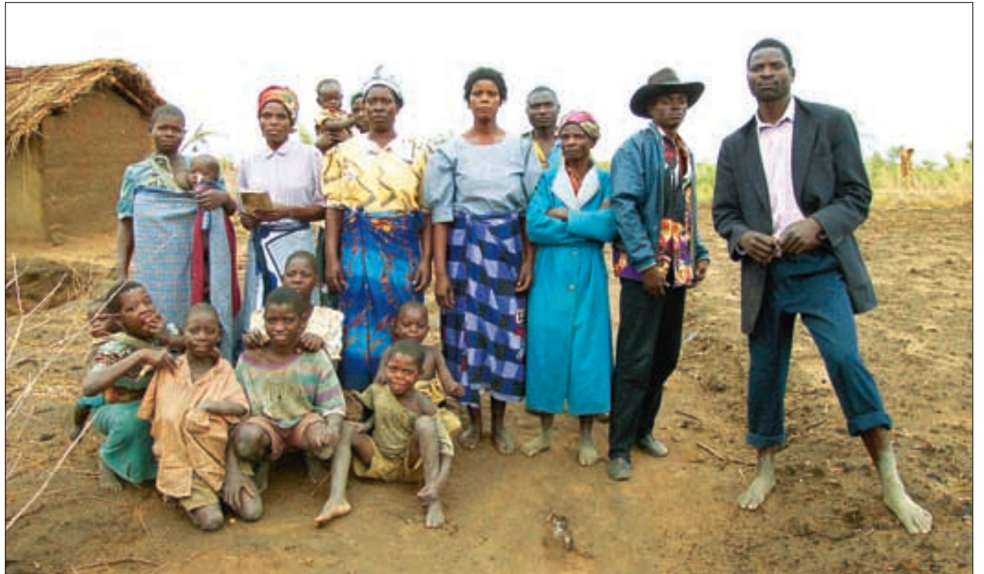
Malawi vil gjerne ha bistand i form av budsjettstøtte, men med betingelser som gjør det mulig å opprettholde et tjenestetilbud til folk flest.

Den malawiske staten har måttet ta opp store innenlandske lån til 30-40 prosents rente. Det har drevet renten i været, og så å si stanset alle investeringer. Betaling av renter på lån står for over 20 prosent av utgiftene i statsbudsjettet. Når driften av statsforvaltningen har fått sitt, blir