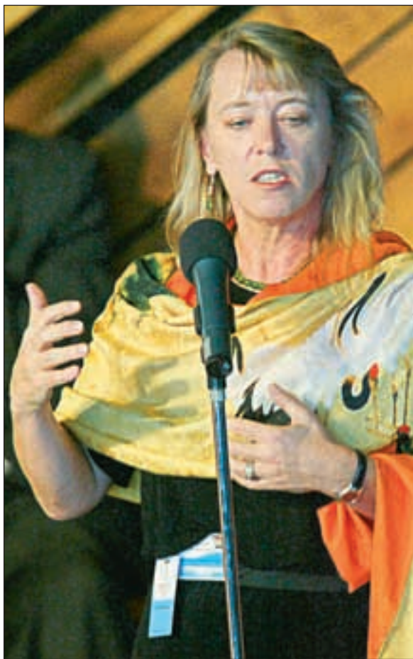
Den internasjonale kampanjen mot landminer er ledet av Jody Williams.

Høsten 1997 var den norske regjeringen vertskap for en stor konferanse i Oslo om forslaget til konvensjon med forbud