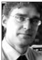
Thomas Baunsgaard, IMF's representant i Malawi.

■ Norge er en pådriver for budsjettstøtte og samordning av internasjonal bistand. Andelen av langsiktig bilateral bistand som går til de såkalte nye bistandsformene budsjettstøtte, subsektor-programmer og sektor-programmer har økt fra 4,5 prosent i 1999 til 16,2 prosent i 2003. Utenriksdepartementet ga i tillegg budsjettstøtte til Det palestinske området. Det vurderes budsjettstøtte også til Zambia og Nicaragua.