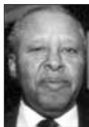
Festus Mogae, president i Botswana.

Realistisk sett blir dette for dyrt for oss. Det er et faktum vi må se i øynene.