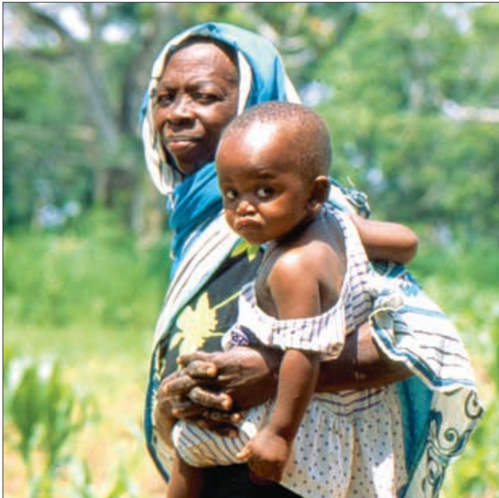
Artikkelforfatterne frykter at fattige kvinner, som denne tanzanianske kvinnen, kan bli tapere når uformell eiendomsrettigheter skal formaliseres.

De Soto-prosessen forutsetter at lokalsamfunns interesser, behov og etterspørsel legges til grunn. Spørsmålet om prosessens faktiske virkninger for kvinner henger tett sammen med spørsmål om deltagelse.