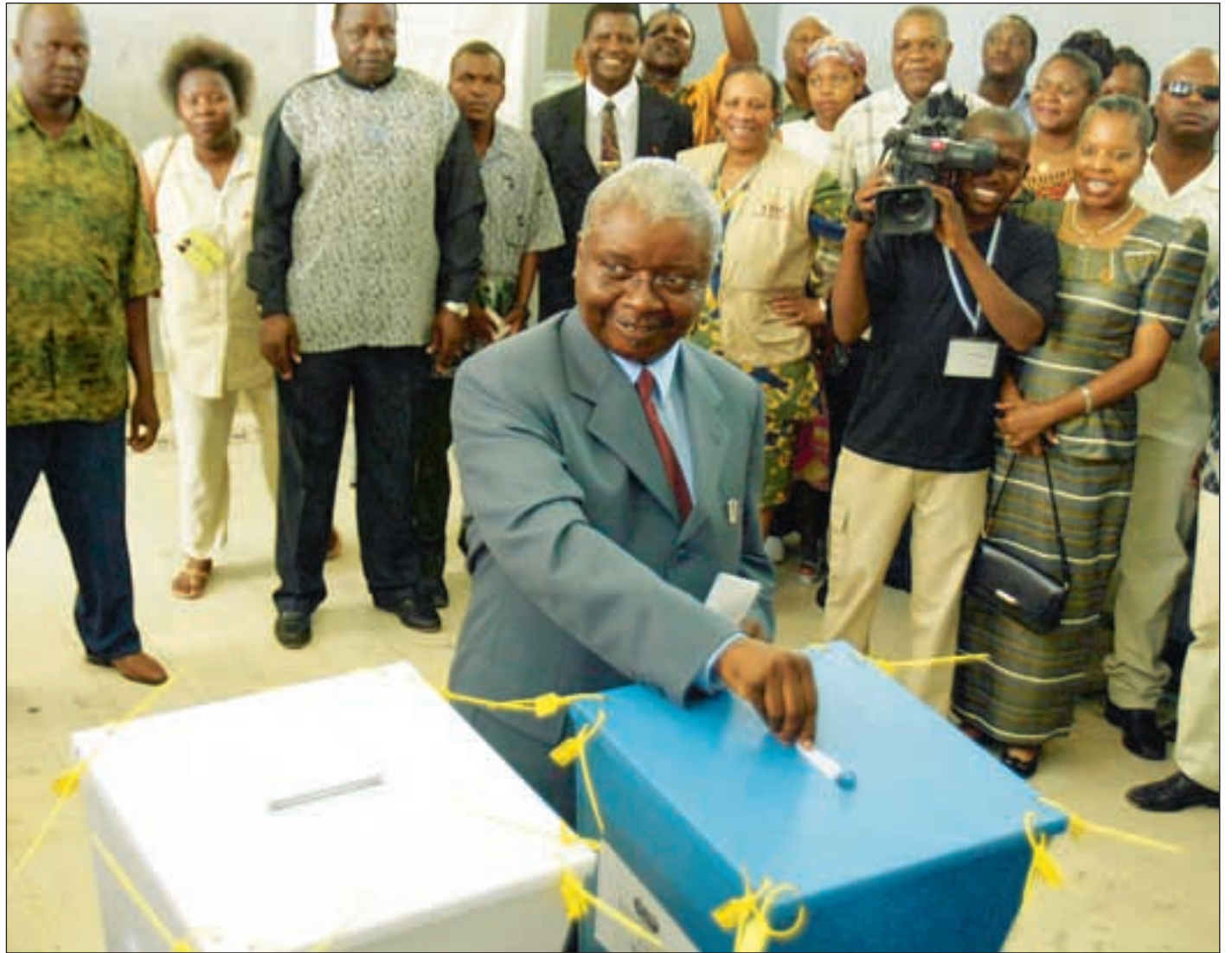
Mosambiks nye president Armando Guebuza fra Frelimo avlegger sin stemme i valget 1. desember.

Velger-betaling. President Joaquim Chissano – som nå går av og overlater presidentstolen til sin partifelle Guebuza – er så bekymret over den