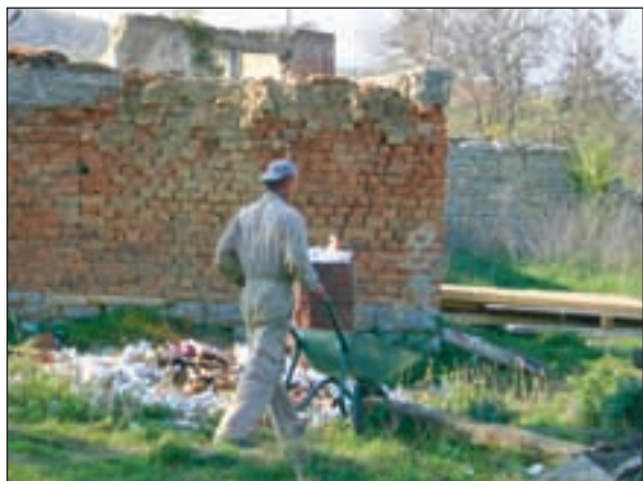
Det er hektisk byggaktivitet i Vidanje. Husene må stå ferdig før vinteren setter inn for fullt.

seg den knappe kilometeren inn til landsbyen Klina.