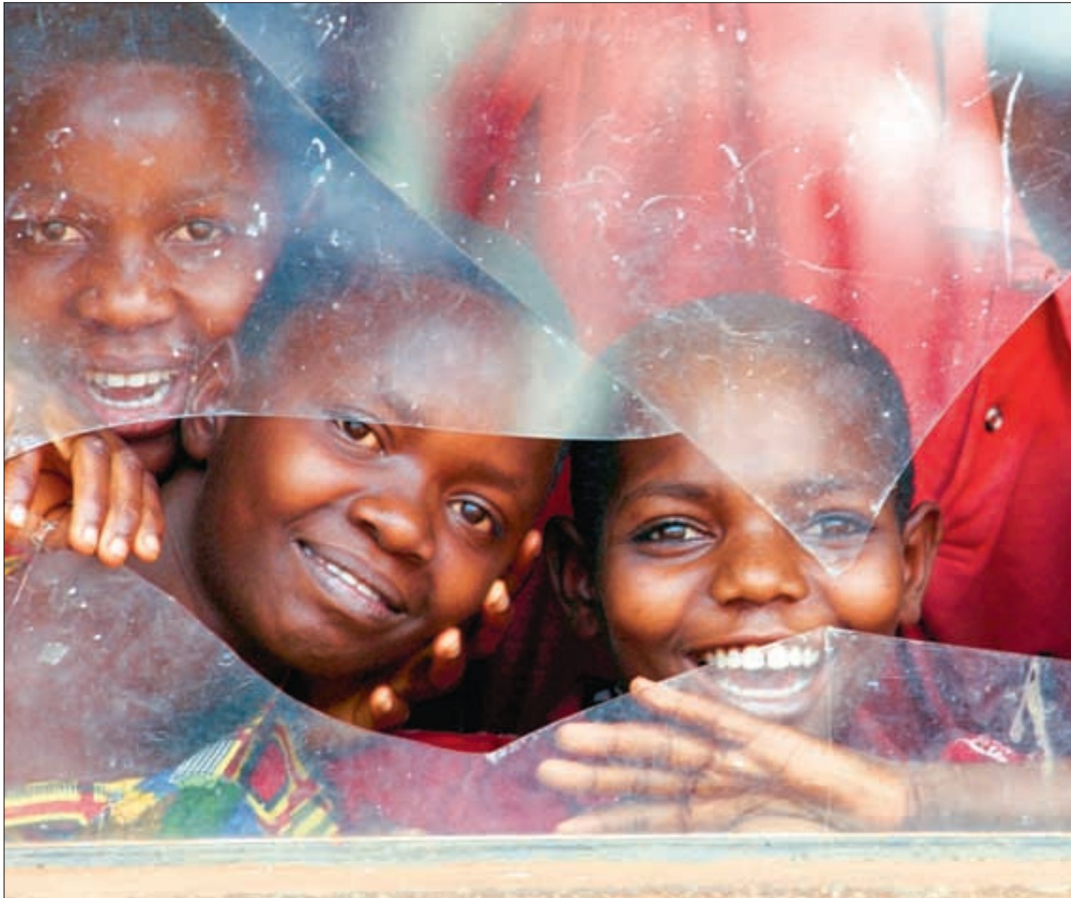
Den norske hjelpeorganisasjonen Flyktingerådet er med på å gi barna i Burundi skoletilbud, som her ved en skole i Nyanza Lac.

ler, sittende på jorda som utgjør gulvet i sitt nye hus på 35 kvadratmeter.