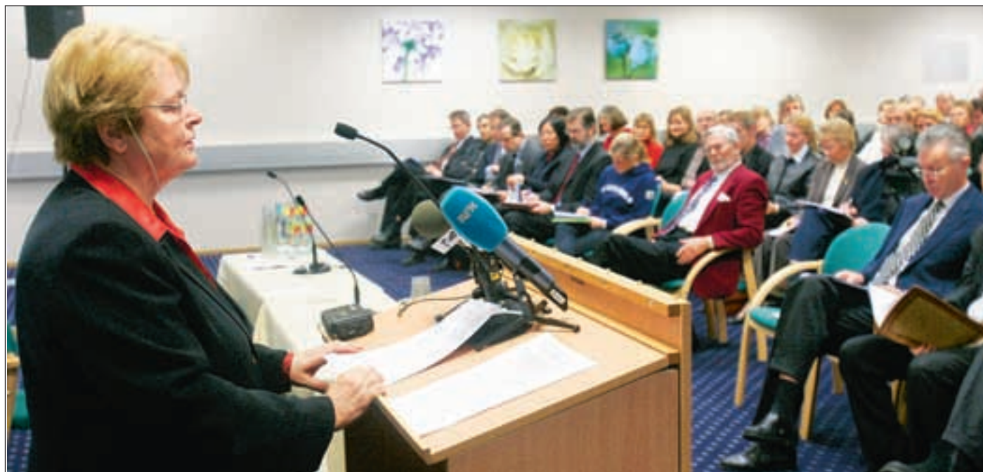
Gro Harlem Brundtland presenterer høynivåpanelets konklusjoner på et seminar på NUPI. Panelet foreslår blant annet en ny FN-kommisjon for fredsbygging.

Noen mener at selv om hiv/aids er en forferdelig sykdom og borgerkrig i Afrika er en humanitær katastrofe, er de ikke trusler mot internasjonal fred og sikkerhet. Andre mener at det som kalles kollektiv sikkerhet, er et system for å beskytte de rike og mektige. Panelet konkluderte med at truslene mot fred og