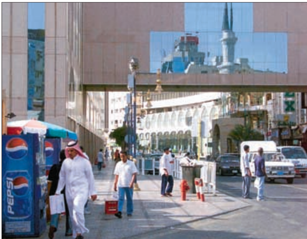
Artikkelforfatteren er bekymret over kapitalflukt i landene sør for Sahara, og viser til hvordan flere økonomier i Midtøsten – som her fra Saudi-Arabia – blomstrer tross store politiske utfordringer.

Kapitalflukten består både av formuer som skaffes lovlig hjemme og overføres lovlig til utlandet; formuer som skaffes lovlig hjemme og overføres illegalt til utlandet; og illegale formuer som overføres illegalt til utlandet. De to siste variantene påtvinger afrikanere gjeld, og svekker vestlige lederes troverdighet i forhold til hvitvasking av penger, godt styresett, innsynsrett for offentligheten, skattedisiplin og en makroøkonomisk politikk som skulle lede til økonomisk vekst.