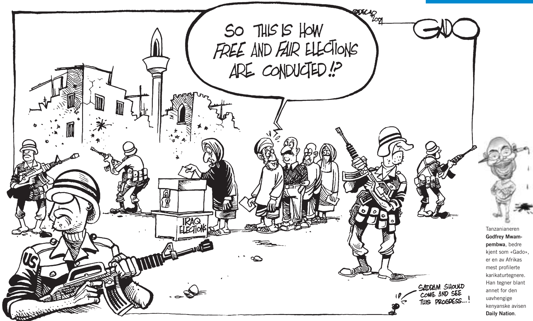
Tanzanianeren Godfrey Mwambwa, bedre kjent som «Gado», er en av Afrikas mest profilerte karikaturtegnere. Han tegner blant annet for den uavhengige kenyanske avisen Daily Nation.