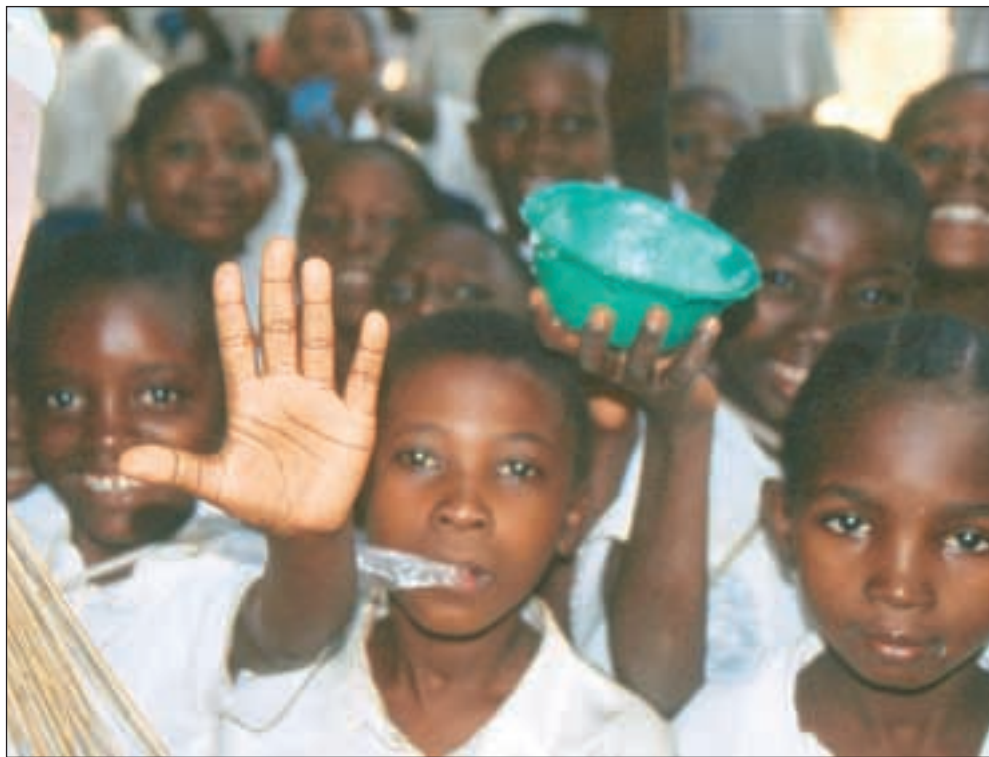
40 år med bistandsprosjekter har ikke fått Tanzania ut av fattigdommen. Nå satser giverne på budsjettstøtte.

Tanzania ønsker å få bistandspengene inn i statsbudsjettet og den ordinære finansforvaltningen framfor gjennom det virvar av strukturer og kanaler som prosjektbistanden har brakt med seg. Landet har en bistandsdialog med rundt 50 givere, som sender over 1000 delega-