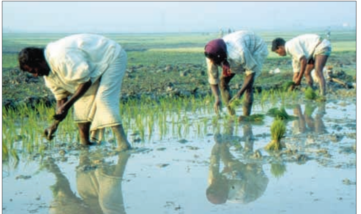
Norge får kritikk for landbrukspolitikken. Kun de aller fattigste landene, som Bangladesh, er unntatt importrestriksjoner.