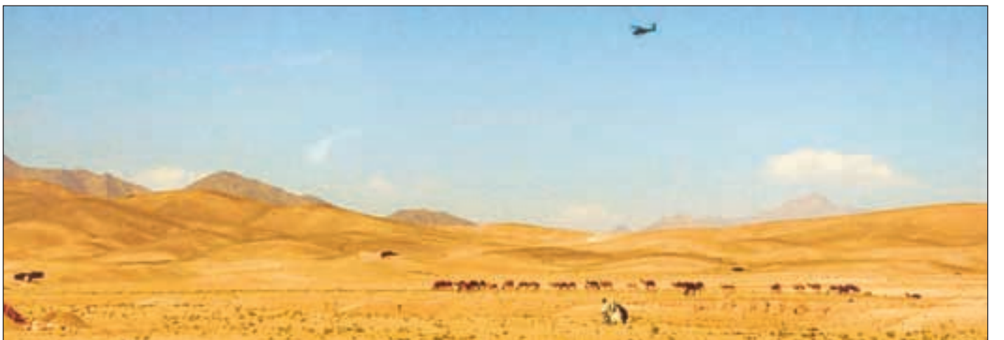
Det amerikanske militærhelikopteret som passerer over en nomadefamilie i Wardak vitner om at freden ennå ikke er helt på plass i Afghanistan.

Eksistensen av en rekke ulike krigsherrer med sine private hærer har vært den afghanske sivilbefolkningens ulykke gjennom mange tiår. Ved hjelp av våpenmakt, penger og etniske argumenter har de ulike