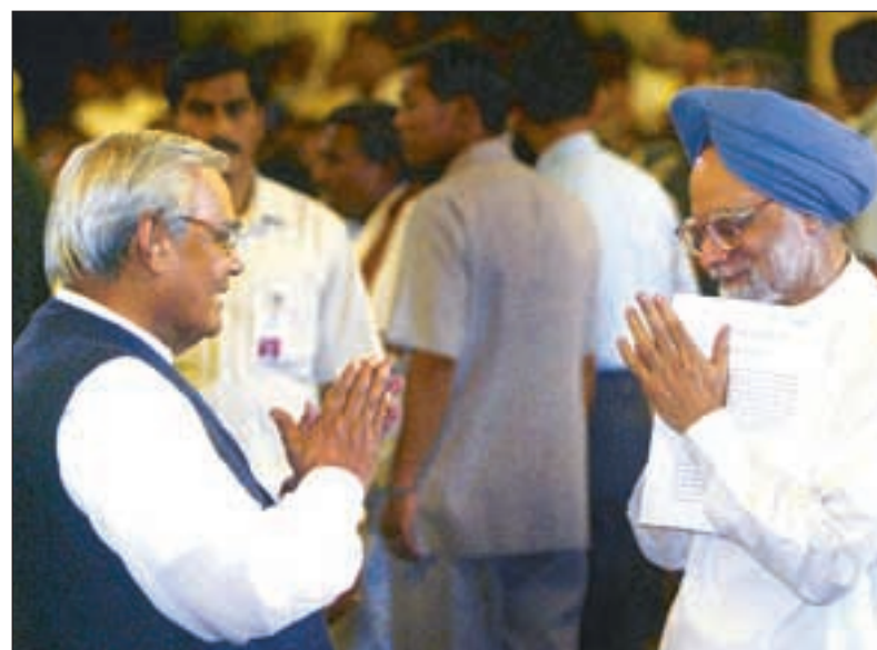
Etter et historisk valg og mye om og men, kunne Manmohan Singh (t.h.) i mai overta som statsminister i India etter Atal Bihari Vajpayee.