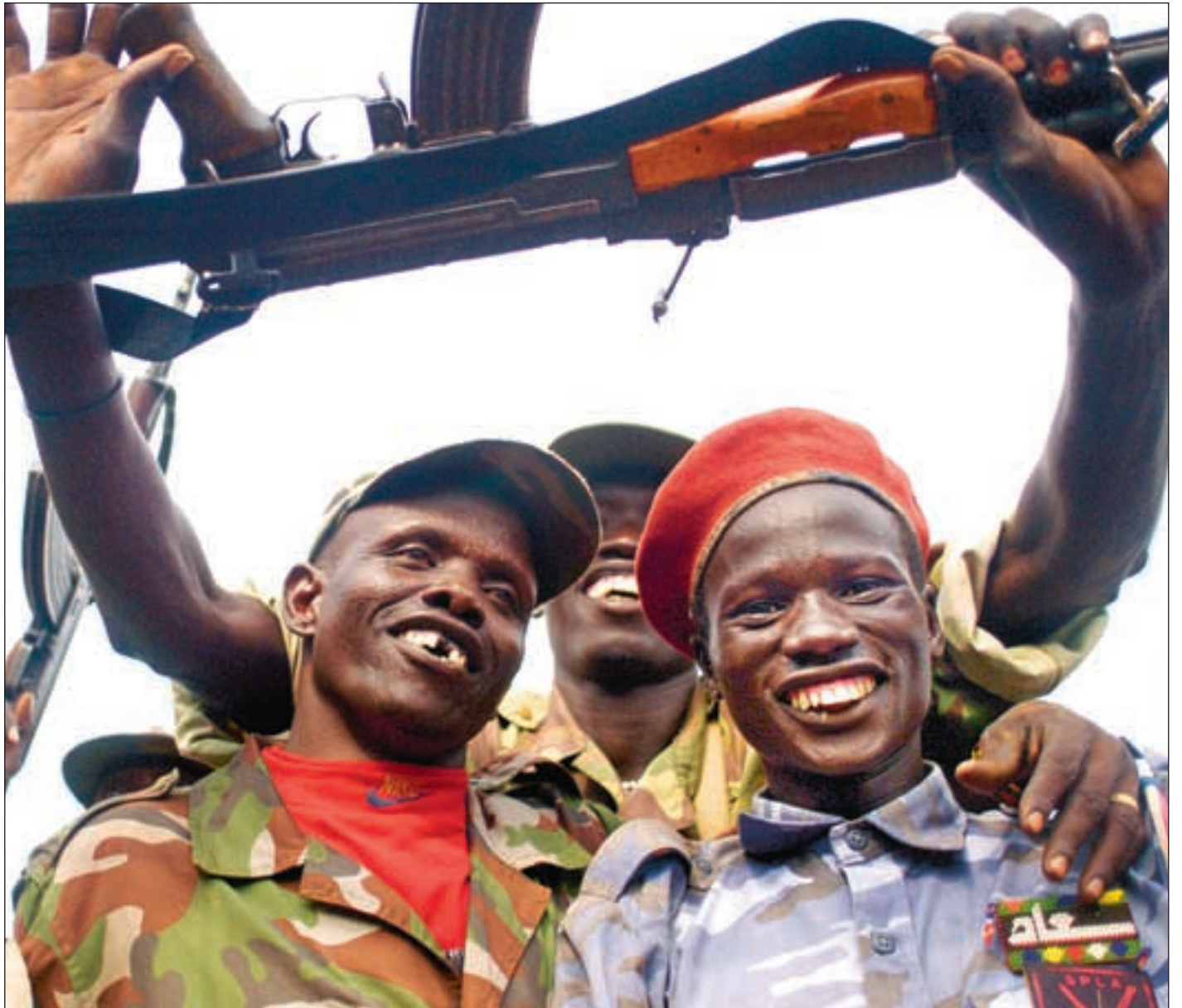
Endelig kan SPLA-soldatene i Sør-Sudan håpe på et liv i fred.

– Da spørsmålene om sikkerhet og ressursfordeling var ferdig forhandlet ble spørsmålene om maktfordeling og de tre særområdene regnet som lette, der hadde begge parter gjort sine posisjoner kjent. Og så viste det seg at den runden skulle bli den vanskeligste. Partene hadde rett og slett undervurdert hverandres posisjo-