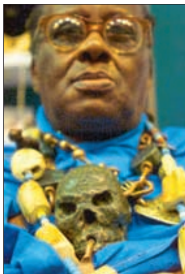
Slik ser en ekte afrikansk healer ut.

– Så lenge de retter seg etter våre standarder, politikk, etikk og juri-