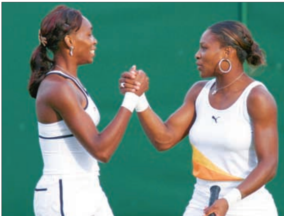
Drømmen for mange unge tanzanianske tennisspillere er å bli profesjonelle som Venus (t.h.) og Serena Williams.