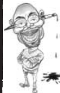
Tanzanianeren Godfrey Mwambwa, bedre kjent som «Gado», er en av Afrikas mest profilerte karikaturtegnere. Han tegner blant annet for den uavhengige kenyanske avisen Daily Nation.