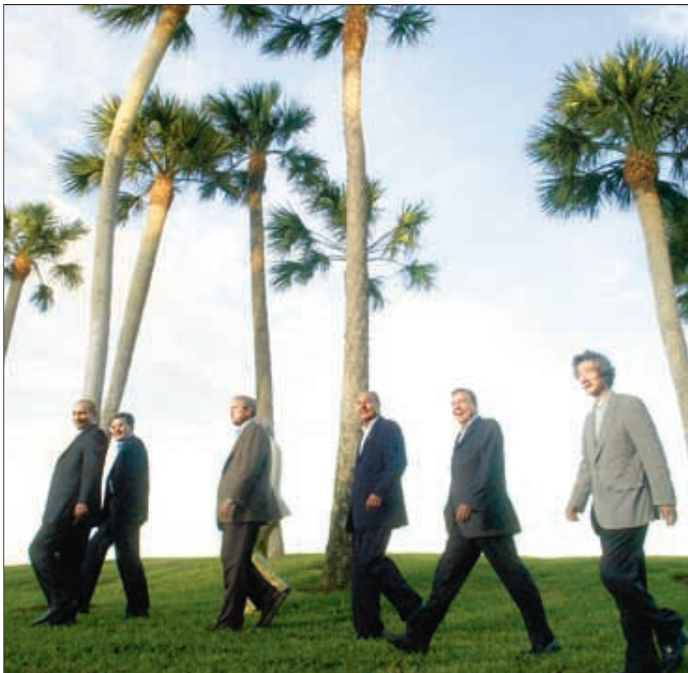
Lederne av G8-landene promenerer på Sea Island, Georgia, USA, 9. juni. Sentralt på toppmøtet står håndteringen av Iraks gjeld. Fra venstre Russlands president Vladimir Putin, president i Europakommisjonen Romani Prodi, USAs president George W. Bush, sittende formann i Det europeiske råd Bertie Ahern (delvis skjult), Frankrikes president Jacques Chirac, Tysklands forbundskansler Gerhard Schröder og Japans statsminister Junichiro Koizumi.

– Norge legger opp til å ettergi rubbel og bit til disse to. Det gir liten