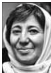
Sima Samar, kvinne- og menneskerettighetsaktivist.

Selv et 50 prosent fritt valg vil være et stort fremskritt i forhold til hva vi har hatt.