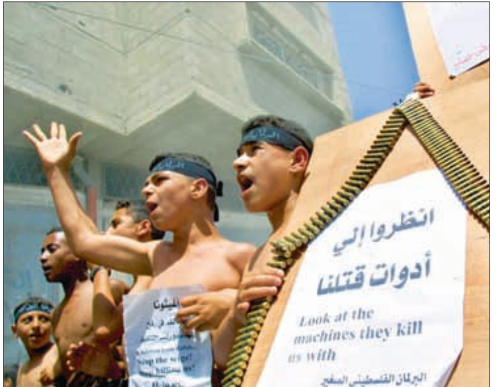
Palestinerne utgjør fortsatt en stor gruppe av verdens flyktninger.