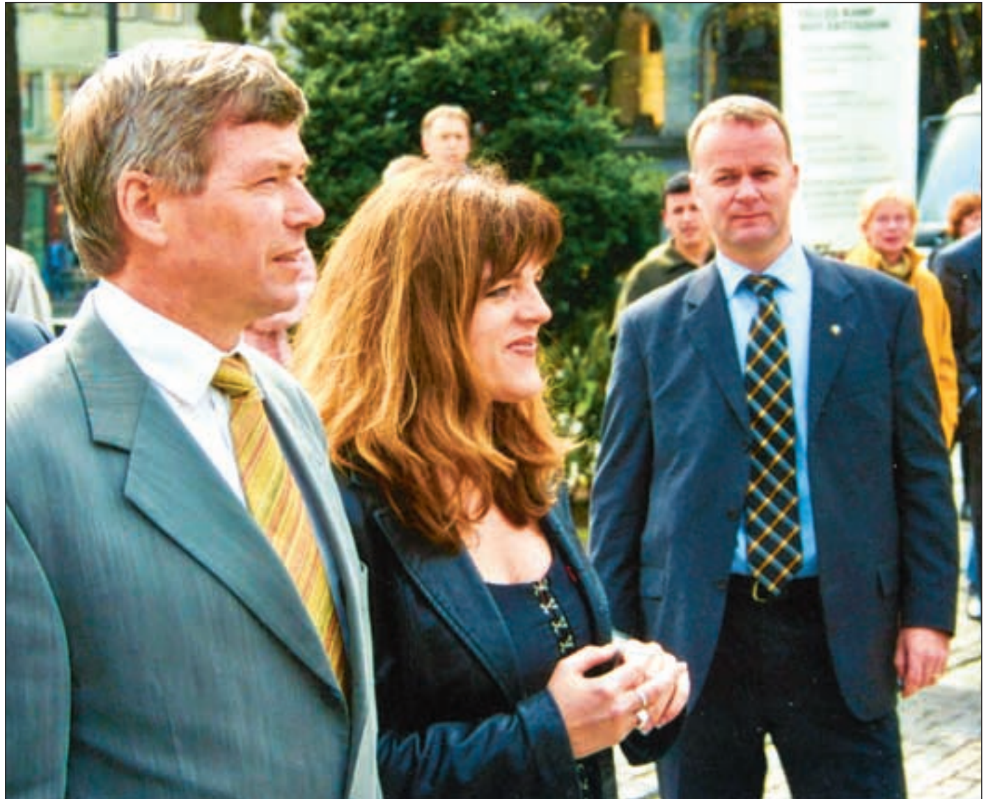
Utviklingsminister Hilde Frafjord Johnson og statsminister Kjell Magne Bondevik frontet lanseringen av regjeringens stortingsmelding «felles kamp mot fattigdom».

Savner overordnet fokus. – Det er positivt at meldingen forsøker å balansere mellom markedstenkning og statlige reguleringer på områder som arbeidstakerrettigheter og miljø. Det er heller ikke problematisk at man vil bruke markedet som strategi. Det jeg savner er noe mer om de overordnede betingelsene som internasjonale avtaler om handel og investeringer. Dette er avtaler som dreier seg vel så mye om næringsutvikling som om handel, og som legger store begrensninger på hva som er mulig å få til. Eksempler er patentregelverket i WTO og bestemmelser knyttet til investeringer i regionale handelsavtaler mellom USA og land i Latin-Amerika. Disse begrenser hva slags miljøkrav landene kan stille. Så lenge man ikke ser på dette globale rammeverket, innebæ-