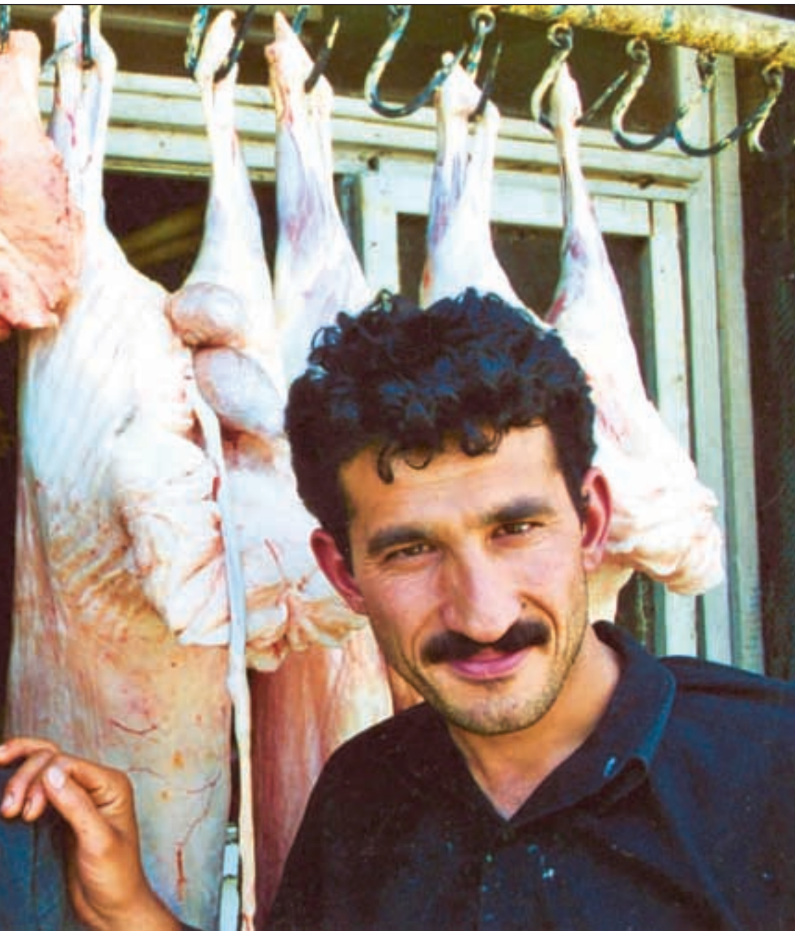
ikke lenger krever at skjegget deres må være lengre enn en knyttneve langt.