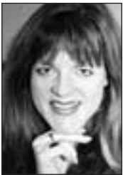
Utviklingsminister Hilde Frafjord Johnson .

– Nei, alle delene er like avgjørende. Det ville blitt en ufullstendig avtale dersom noen av dem hadde manglet. Men det er viktig å være klar over at det fortsatt gjenstår store utfordringer. Hvordan skal våpenhvilen overvåkes, hvordan skal forflytningen av militære styrker kontrolleres? Og hvordan skal kommisjonene som skal følge opp avtalen settes sammen? Forhandlingene om det starter 22. juni, på norsk side regner vi med at de vil ta 2-3 måneder, sier Hilde Frafjord Johnson.