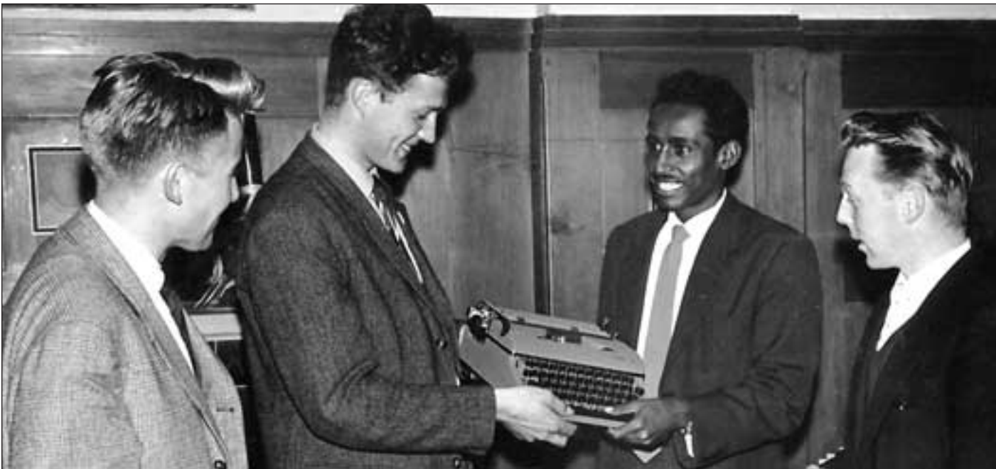
Norsk Studentunion overleverer en skrivemaskin til studentunionen i Etiopia i 1960 - et av de tidligste tilfellene av «utdanningsutveksling».

Som tidligere Norad-student og gjennom mitt arbeid med Norad-stipendiater har jeg alltid vært fascinert av potensialet som ligger i disse masterkursene. Kursene per i dag er gode, men de kan gjøres til program i verdensklasse. Jeg håper at evalueringsgruppa setter fokus på disse mulighetene og kommer med anbefalinger som kan gjøre programmet til noe av det mest spennende i norsk bistandshistorie – og kanskje i norsk universitetshistorie.