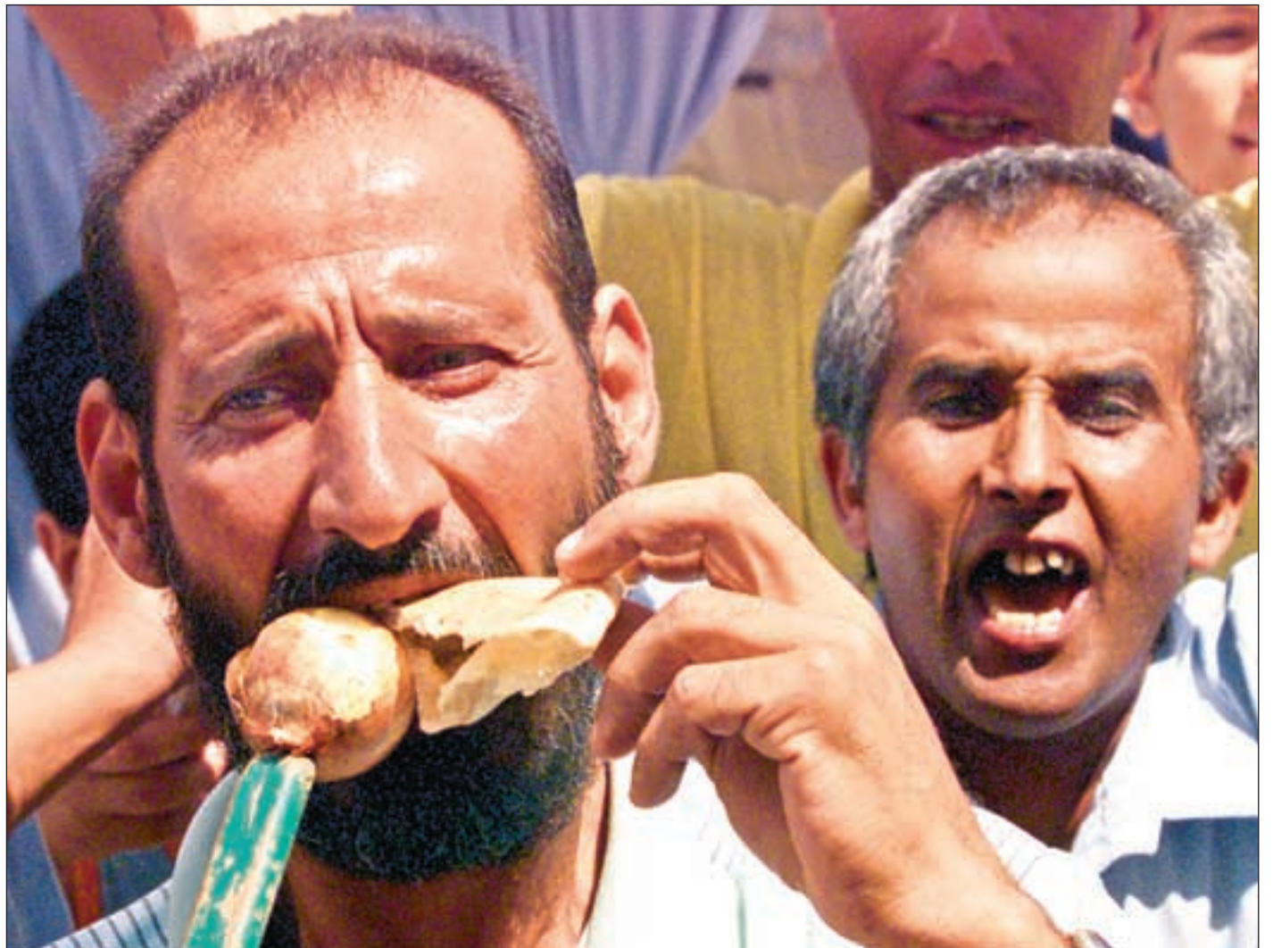
Arbeidsløse palestinske arbeidere gjennomførte sommeren 2002 spontane demonstrasjoner rettet mot både israelske og palestinske myndigheter. Arbeiderne krevde mat og arbeid.

Barghouti mener at den norske støtten per i dag er med på å svekke den palestinske fagbevegelsen, men samtidig er den «indirekte med på å styrke Hamas». Ifølge Barghouti og