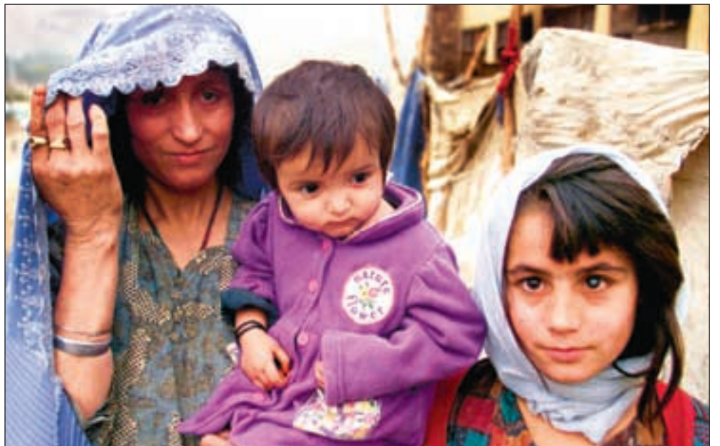
En kvinne og hennes barn har søkt tilflukt i en leir for internt fordrevne i Faizabad i Afghanistan.