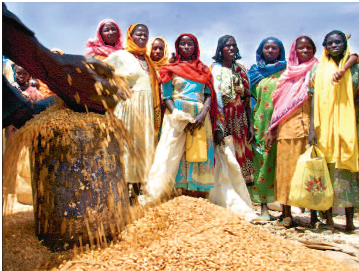
Eritreiske kvinner i kø til FN's matutdeling etter tørken i 2003. Frø og mat deles ofte ut samtidig.