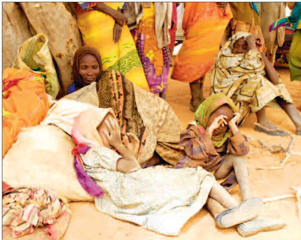
Mens intense fredsforhandlinger pågår i Naivasha fortsetter sudanske flyktninger fra det krigsherjede Darfur-området å strømme inn i nabolandet Tsjad.

NAIVASHA (b-a): Delegationene fra regjeringen i Khartoum og fra frigjøringsbevegelsen SPLM trekker fortsatt intenst i tauene for å sikre mest mulig av sine interesser i en kommende fredsavtale for Sudan.