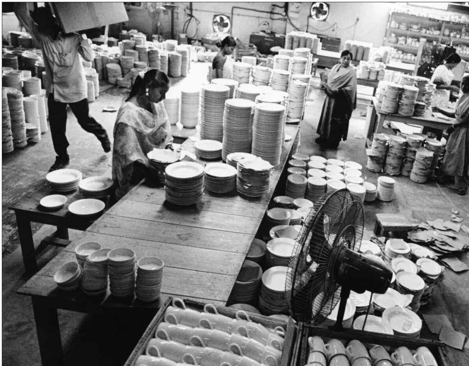
Slik ser det ut i produksjonslokalene der Porsgrund Porselensfabrik får produsert noen av sine fineste benporselensserviser. Lønna er lav, men arbeidsforholdene øvrige.

■ NRKs filming ved fabriken ble gjort av et lokalt fjernsynsteam. Ledelsen ved «Shinepukur» hevder de ikke ble informert om at filmingen skulle inngå i en kritisk dokumentar, men trodde formålet var å skildre fabriken i lys av en eksport-pris de akkurat hadde vunnet.