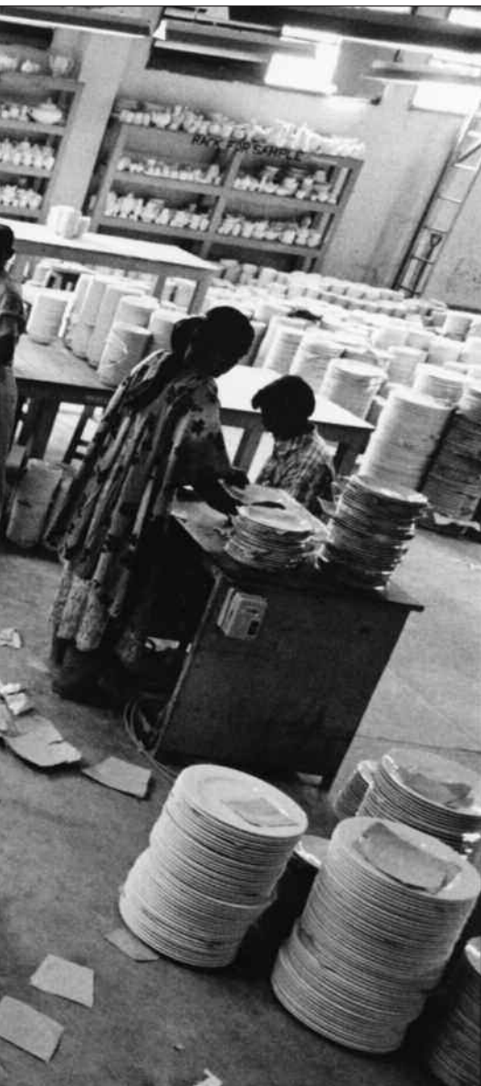
...er neppe særlig annerledes enn i næringslivet for-