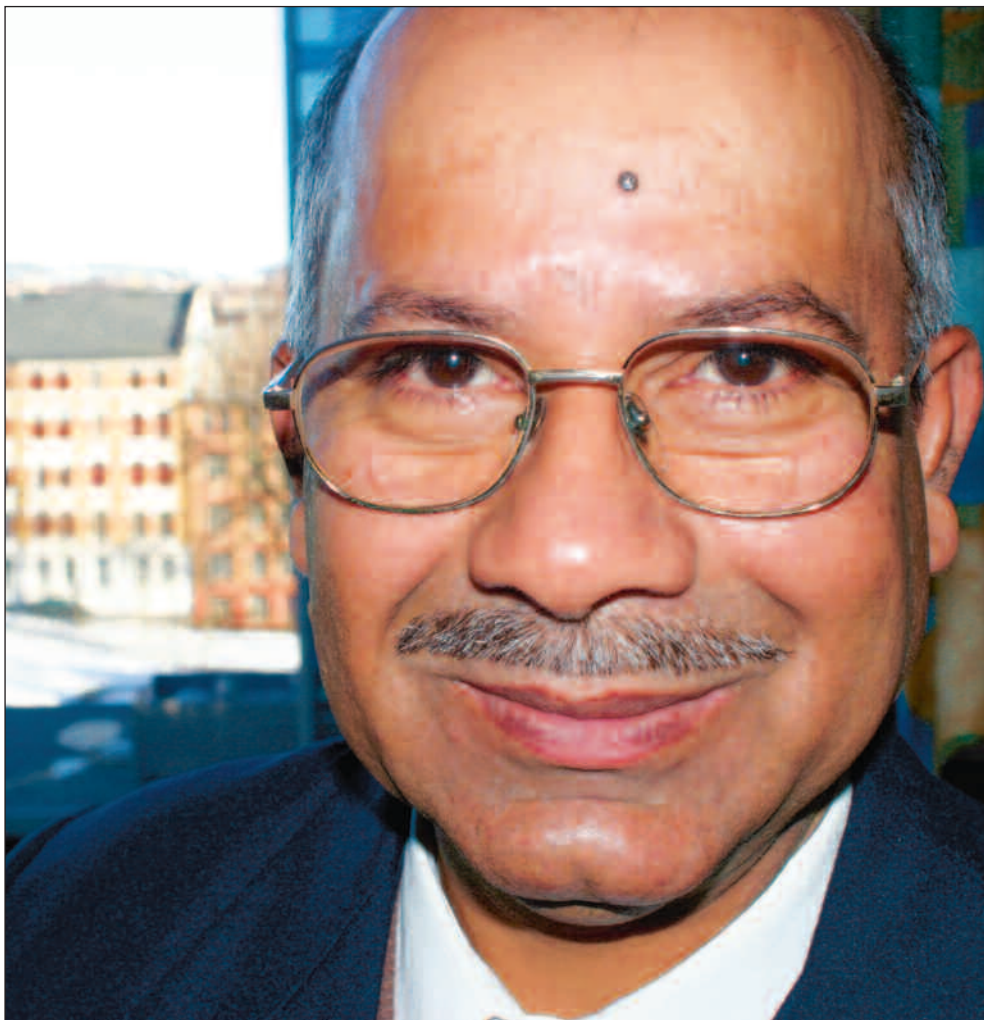
Lederen av Nepals kommunistparti, Madhav Kumar Nepal , var nylig i Norge for å orientere om den kaotiske tilstanden i det asiatiske fjelllandet.

– Vi befinner oss i dag mellom to ytterpunkter. På høyresiden har vi kongen og hans autokratiske føydalstyre. På den andre siden har vi maoistene som vil innføre ettpartistyre. Vi i de politiske partiene ser folkestyre som eneste vei ut; vi kan ikke inngå kompromisser om viktige prinsipper som demokrati, menneskerettigheter og styresett. Vi gjør vårt beste for å bringe de to ytterkantene sammen og få dem til å innse at deres politikk er gått ut på dato, at den tilhører mislykkede regimer. Hvis maoistene er villig til å finne en løsning basert på flerpartistyre, kan vi sette oss ned sammen og diskutere konstitusjonelle løsninger.