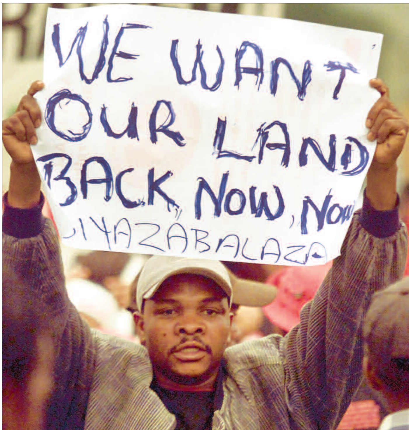
Demonstrasjoner med krav om jord har vært vanlige i årene som har gått siden apartheid ble avviklet.

Flere tusen krav. Makoe trekker fram oppreisningsprogrammet som et eksempel på ANC-regjeringens suksess i å kompensere for fortidas urett. Programmet er en av grunnpi-