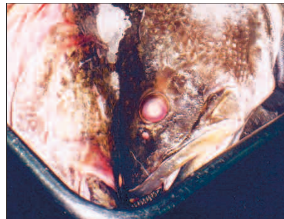
Nile Perch klar til eksport til Europa fra Uganda Fish Packers Ltd. utenfor Kampala. Fisk og fiskeprodukter er den nest viktigste eksportvaren fra Uganda, etter kaffe.