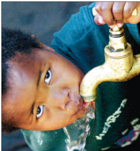
I løpet av de siste ti årene har mer enn syv millioner sørafrikanere fått tilgang til rent vann.

Svart middelklasse. Det er ikke bare gjennom å kjøpe jord på det åpne markedet at den sørafrikanske jordreformen er basert på markedskrefter. Et annet sentralt program i reformen, redistribusjonsprogrammet, er ment å gjøre det mulig for folk å kjøpe eiendom med statlig støtte. Fram til 1998 var dette basert på en støtteordning hvor familier som tjente mindre enn 1500 kroner i måneden kunne søke om opp til 16 000 kroner for å kjøpe land. I 1998 ble dette erstattet av et nytt program, Land Redistribution for Agri-