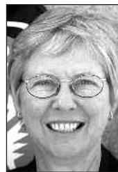
Ambassadør Mette Ravn .