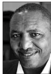
Etiopias informasjonsminister Bereket Simon mener kritikerne av presseloven tar helt feil.