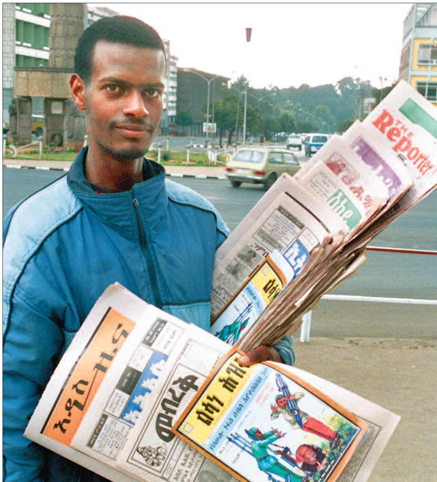
Under den nye presseloven må også avisselgere ha lisens og godkjenning for å selge aviser.

Han mener også at IPI ikke riktig vet hva de snakker om. Begrunnelsen for dette er at presseinstituttet har utarbeidet sine kommentarer på det ministeren kaller «en for-