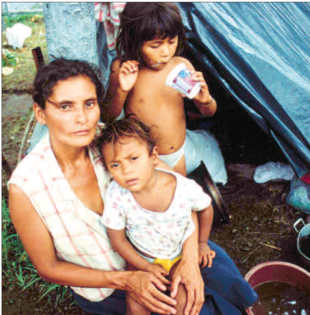
Gjeldslette bidrar til at fattige land, som Nicaragua, kan bruke mer penger til fattigdomsbekjempelse.

Sakker akterut. Rammen for gjeldslette til de 27 landene i disse kategoriene, er på 350 milliarder kroner. Norge har hittil slettet 1,5 milliarder kroner innenfor den norske