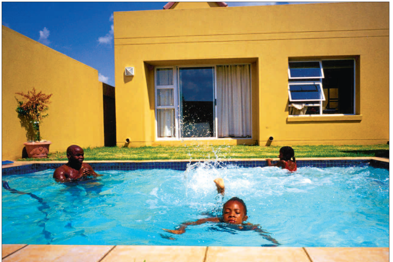
«Black economic empowerment» har bidratt til en voksende svart middelklasse.