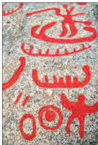
Erfaringene fra Solbergfeltet i Østfold skal overføres til Hunza-dalen i Nord-Pakistan.