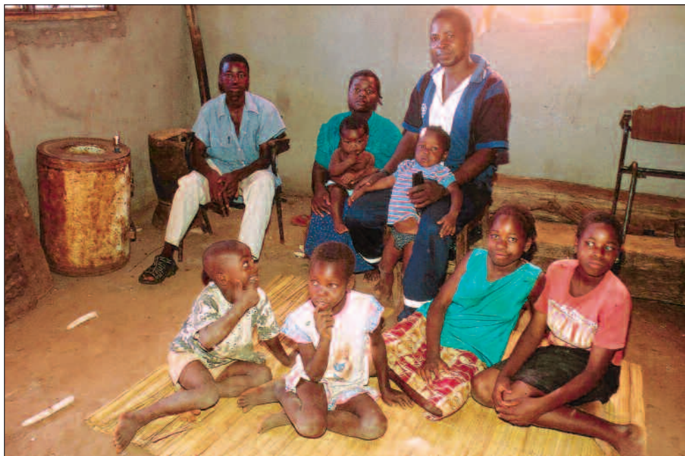
Snaut 2% av husholdningene i Mosambik disponerte egen bil og et tilsvarende antall hadde elektrisk komfyr, mens 4% hadde mobiltelefon.