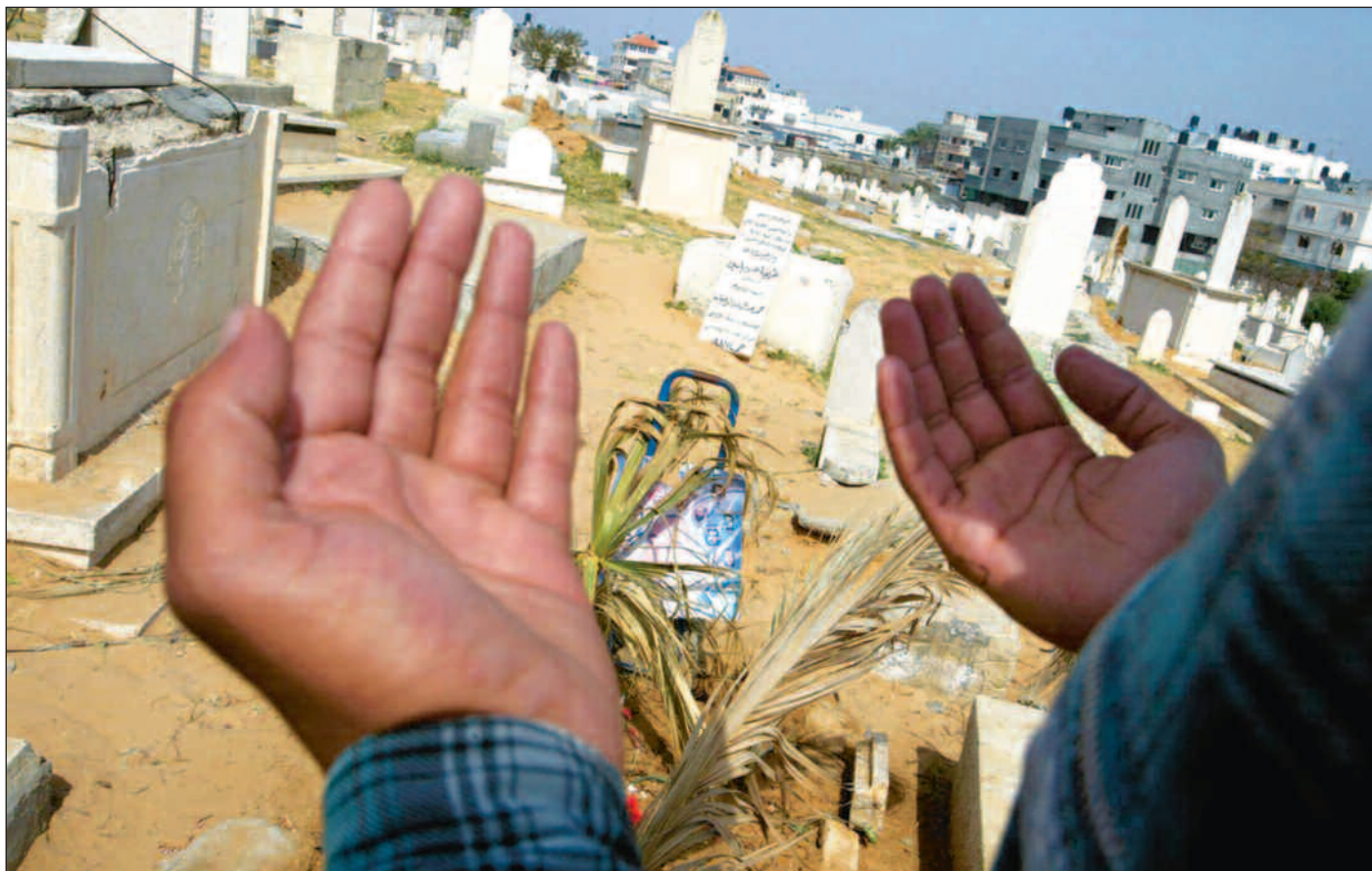
En palestinsk mann ber foran graven til Sheikh Ahmed Yassin, som ble drept av israelske militære 22. mars.

Imidlertid tok ikke Israel erklæringen alvorlig. «Sharon kunne ikke engang forestille seg en palestinsk stat på 22 prosent av landområdet