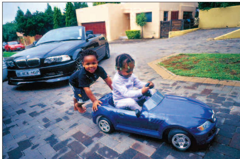
Levestandarden til mange svarte forretningsfolk står ikke tilbake for hva man finner i amerikanske og vesteuropeiske forsteder.