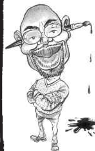
Tanzanierenen Godfrey Mwampembwa, bedre kjent som «Gado», er en av Afrikas mest profilerte karikaturtegnere. Han tegner blant annet for den uavhengige kenyanske avisen Daily Nation.