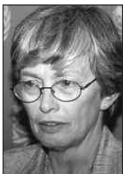
Carol Bellamy, UNICEF-direktør.

– Både Verdensbanken og FN har dokumentert at utdanning av jenter er den investeringen i fattige land som lønner seg mest. Norge dobler nå satsningen på dette for andre året på rad, og vil i 2004 støtte UNICEFs program for jenters utdanning med 275 millioner kroner.