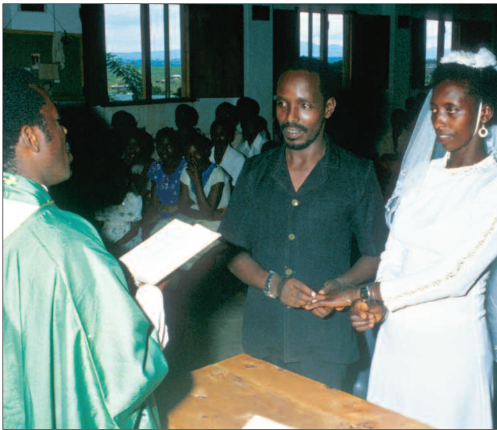
Ekteskap er alltid fulle av utfordringer, uansett hvordan en møtes.

– Vi registrerer ikke gifte eller separerte. Hvis problemer oppstår i ekteskapet, så prøver vi heller å hjelpe dem å løse problemene og opprettholde ekteskapet, sier hun.