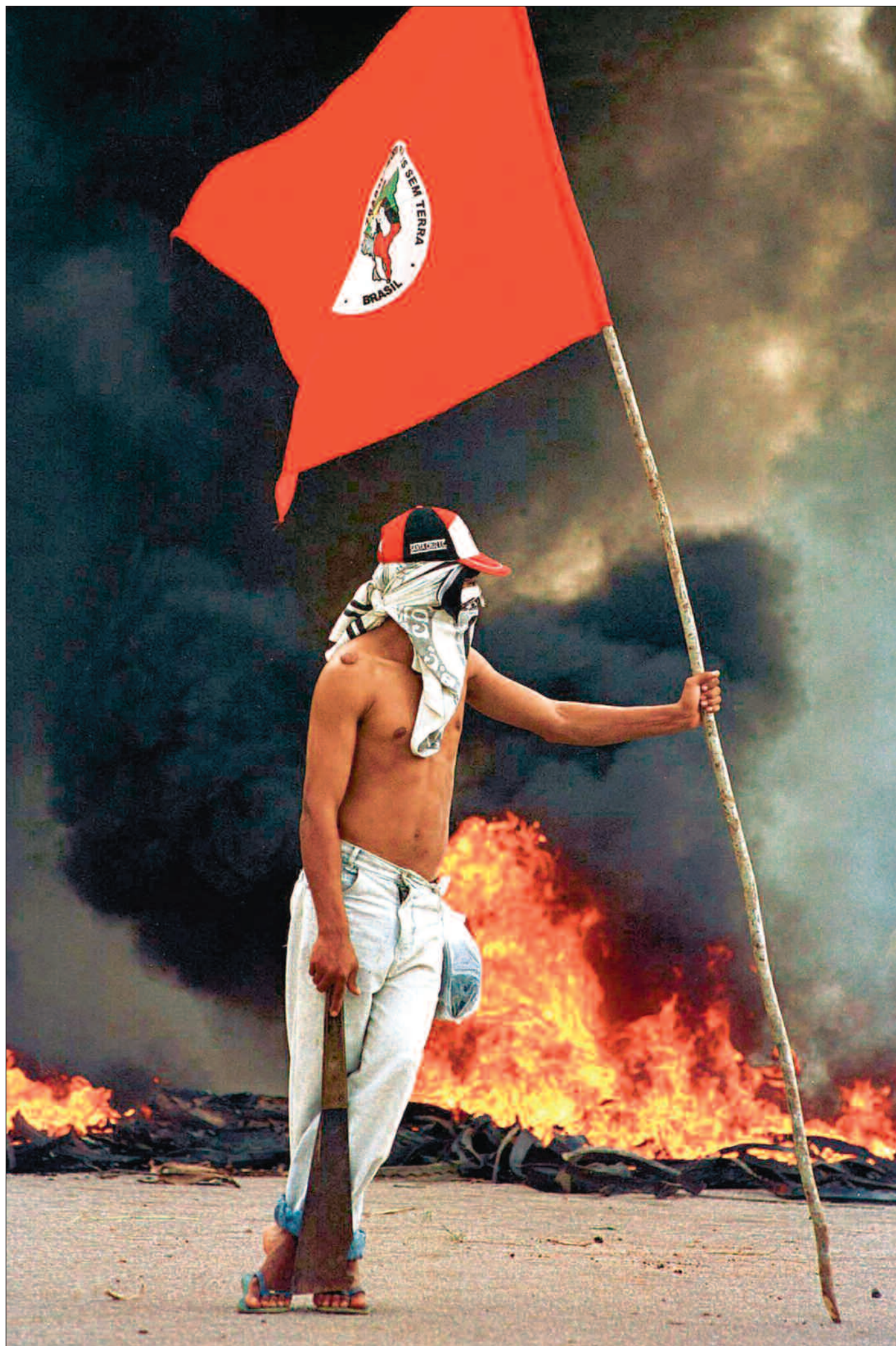
De landløses organisasjon MST har gjennomført en rekke aksjoner for å få regjeringen til å dele opp storgods og dele ut jord til fattige familier.

Historikeren Eric Hobsbawn, som har sett verden i det forrige århundre i et kanskje bedre fugleperspektiv enn noen annen, sier at valget av Lula til president i et av de største landene i den tredje verden, representerer et vannskille i forholdet mellom den fattige og den rike verden. Brasils problem er ikke