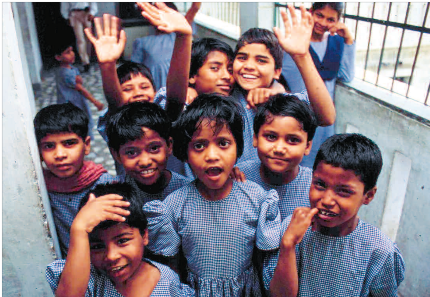
Tross sterk økonomisk vekst sliter India fortsatt med enorme fattigdomsproblemer. Barneorganisasjonen PRAYAS er en av mange «frivillige» organisasjoner som er bekymret over at de norske bistandsmidlene opphører.

Faser ut det aller meste. Bistandsaktuelt skrev i oktober at India har vedtatt å avvikle tosidig stat-til-stat-bistand fra 22 såkalte «små» giverland, inkludert Norge. Motivet skal være en ambisjon om å framstå som en verdensmakt som ikke er avhengig av økonomisk hjelp utenfra. Regjeringen har varslet at støtte fortsatt kan gis til sivilt samfunn, men arbeidet med de nye retningslinjene for hvem som skal kunne få midler, har vært preget av byråkrati, lite