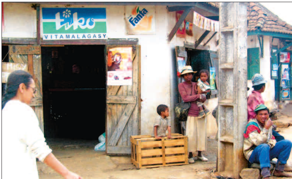
TIKO-konsernets reklameplakater har samme farger som logoen til presidentens parti TIM.