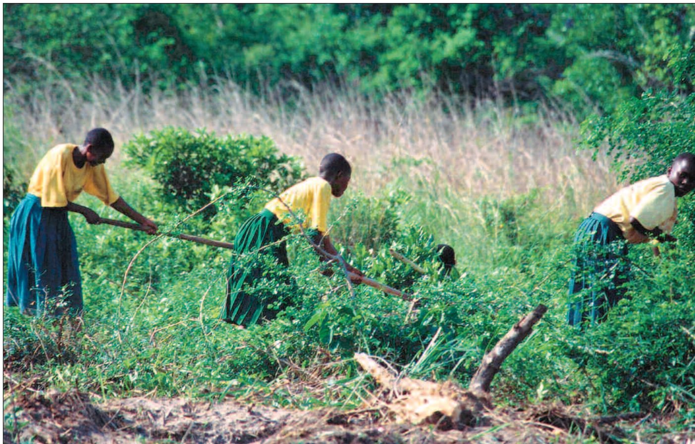
Kronikforfatteren skriver at regjeringen legger opp til å bruke det globale markedet til å selge flere norske produkter. Taperne blir utviklingslandene. (Bildet er fra Tanzania.)