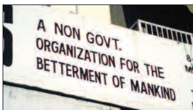
India har to millioner hjelpeorganisasjoner – én for hver landsby. Ikke alle er like hederlige, hevder enkelte. Flere står i fare for å forsvinne, parallelt med at utenlandsk finansiering fases ut.

Saxena er bekymret for at regjeringens nye retningslinjer for hvem som skal få motta støtte, særlig vil gå utover de mindre organisasjonene. En rekke organisasjoner mottar i dag offentlige midler, men Sida-konsulentene mener finansiering fra flere kilder er helt nødvendig for å sikre organisasjonenes uavhengighet og vaktbikkjefunksjon.