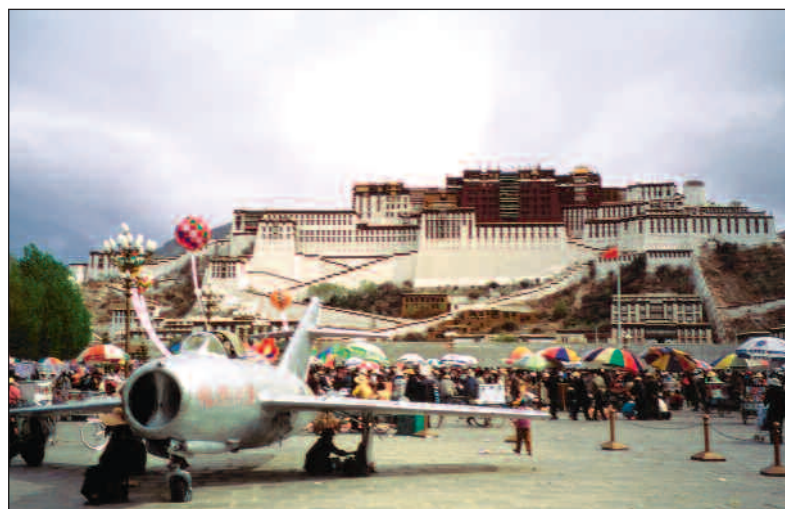
færre høyhus i Lhasa, sier Sinding-Larsen.

– Lhasa har fått et enormt bolig- og utviklingsbehov, siden den endret seg fra å være hovedstad i et teokratisk rike til å bli en del av et stadig mer moderne samfunn. Lhasa ligger dessuten nesten 5000 km fra Beijing, så detaljstyring derfra er nærmest umulig. Vi vil heller si at dette dreier seg om alminnelig grådighet, og at enkeltpersoner og grupper griper de muligheter som finnes til eiendomsspekulasjon og personlig berikelse. Men sammenlignet med for eksempel Oslo er det heldigvis foreløpig langt