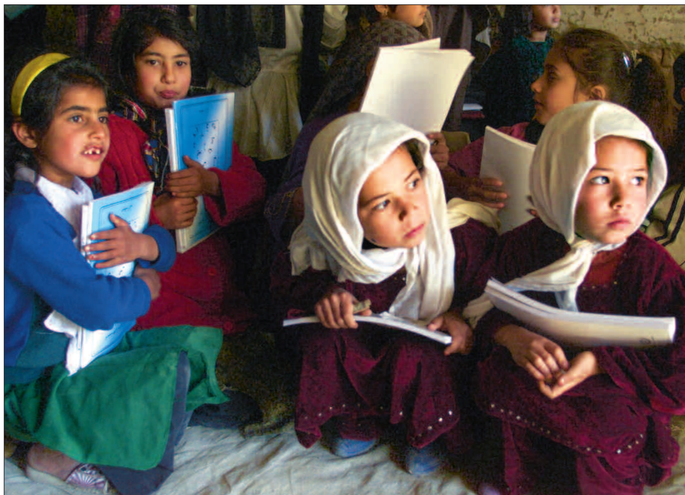
Afghanske skolejenter i Kabul klamrer seg til nye skolebøker. Nå maner UNICEF til økt støtte for å få flere jenter i utviklingsland inn i skolen.

Sammensatt bilde. Men årsakene til at barn, og spesielt jenter, ikke får skolegang er både tallrike og komplekse. UNICEF-rapporten viser til en undersøkelse fra Øst-Asia og Stillehavsøyene i 2001 hvor det fremkom at 43 prosent av barn og unge ikke hadde råd til å gå på skolen. 22 prosent hadde sluttet på skolen for å kunne arbeide,