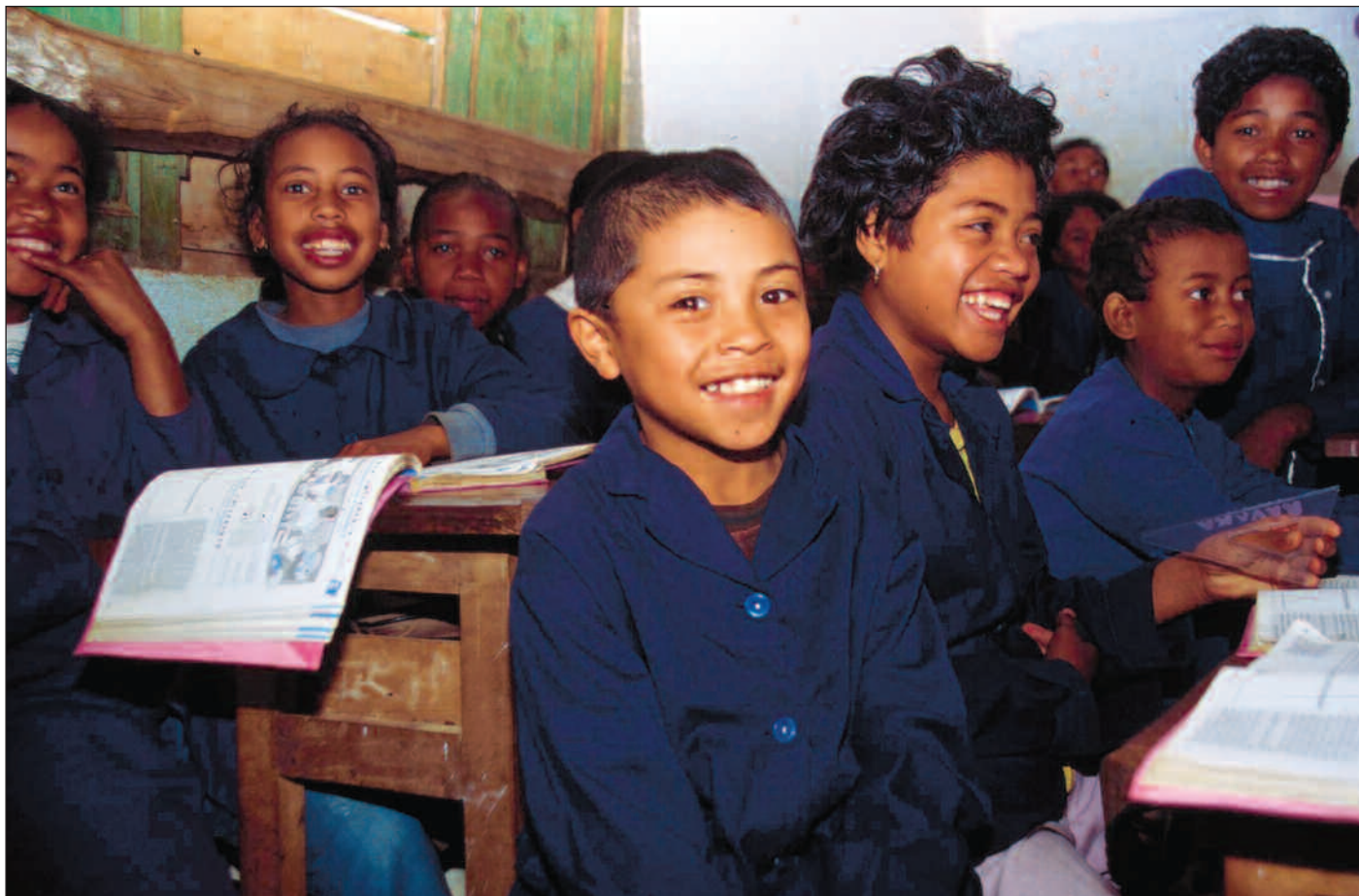
Foreløpig har ikke bred internasjonal fokus på utdanningsstøtte gitt utviklingslandene flere penger å bruke på skoleelevene, som her i Madagaskar.