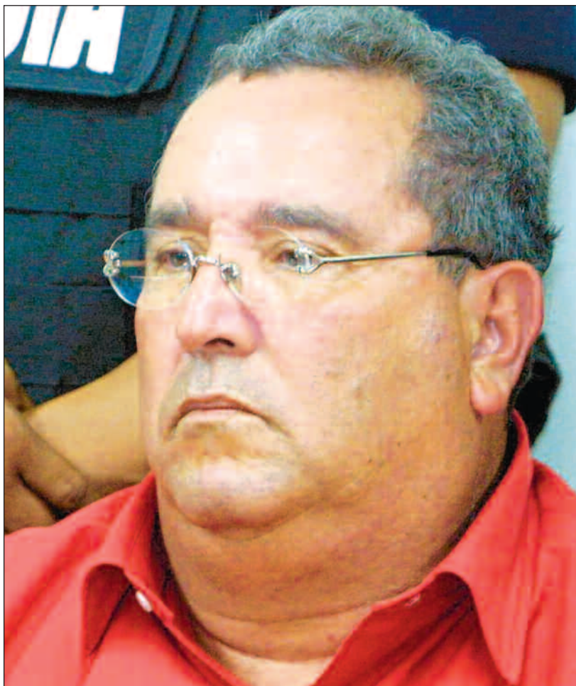
Nicaraguas tidligere president Arnoldo Aleman Lacayo .