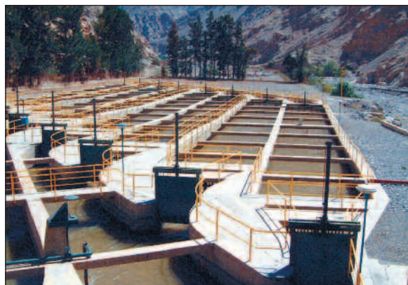
Dette sedimenteringsanlegget renser elvevannet før det tar veien inn i turbinene.