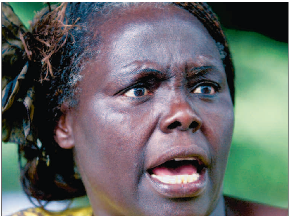
– Mobilisering i det sivile samfunnet var av avgjørende betydning for at opposisjonen klarte å seire over Moi-regimet, sier Wangari Maathai .