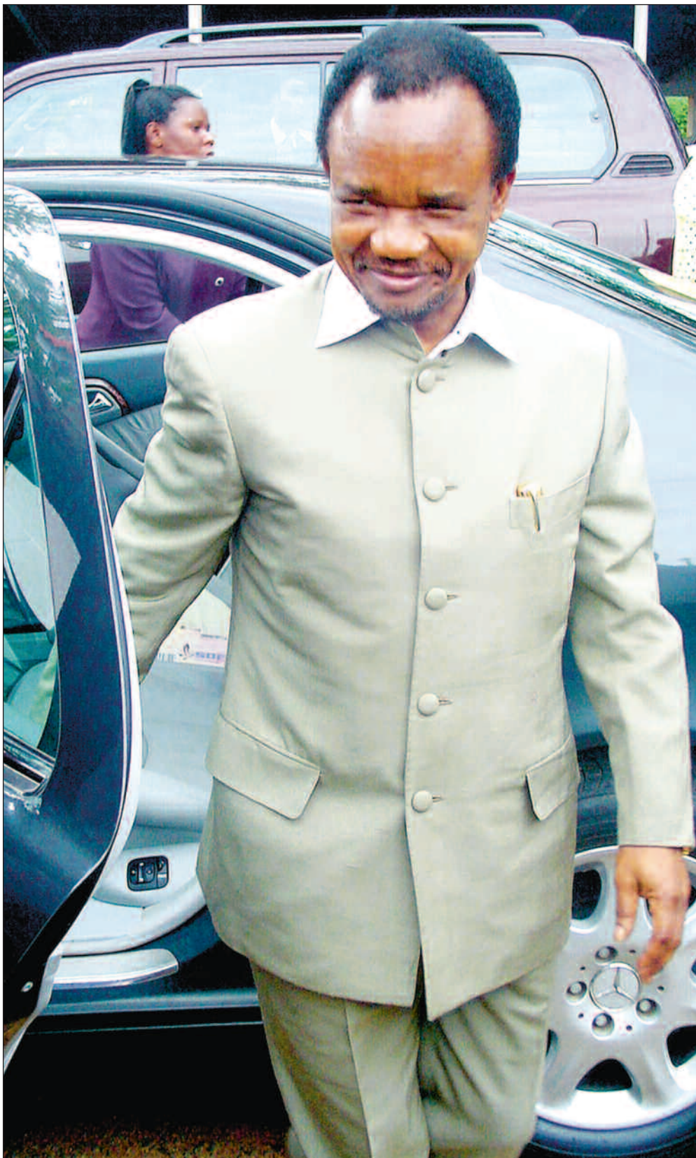
Tidligere president Frederick Chiluba presser fram et forsiktig smil i det han ankommer rettslokalet i Lusaka 9. desember

– Det er vår oppfatning at presidenten har en genuin interesse i å bekjempe korrupsjonen i landet, og han har vist dette gjennom en del grep han har tatt, for eksempel ved å sparke folk med høye stillinger i regjering og forvaltning. Dette er den vanlige oppfatningen blant bistandsgiverne i Zambia og jeg har også inntrykk av at han nyter stor