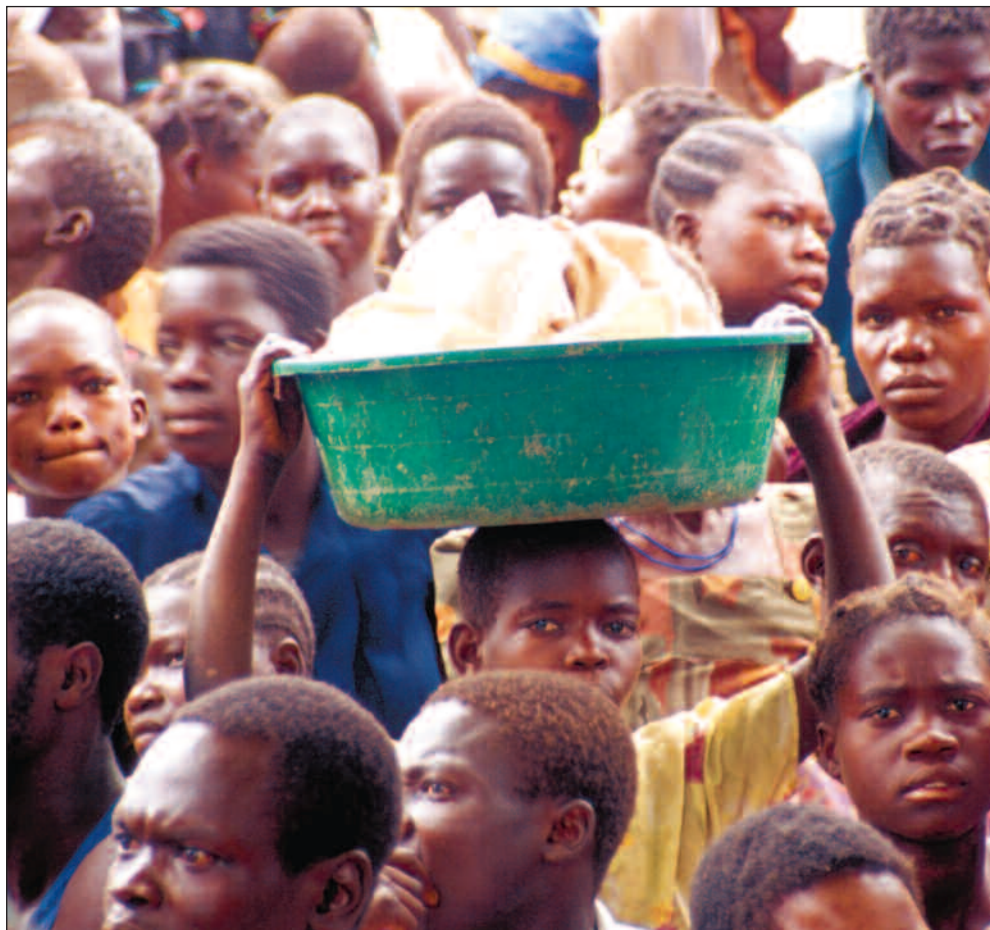
Verdensbanken forventer at Uganda vil betale det dobbelte i gjeldsbetjening i 2004 som i 2002.

Zambias gjeldsbetjening har ikke sunket mer enn den forventes å øke de neste årene. Bare i Malawis tilfelle synker gjeldsbyrden samme