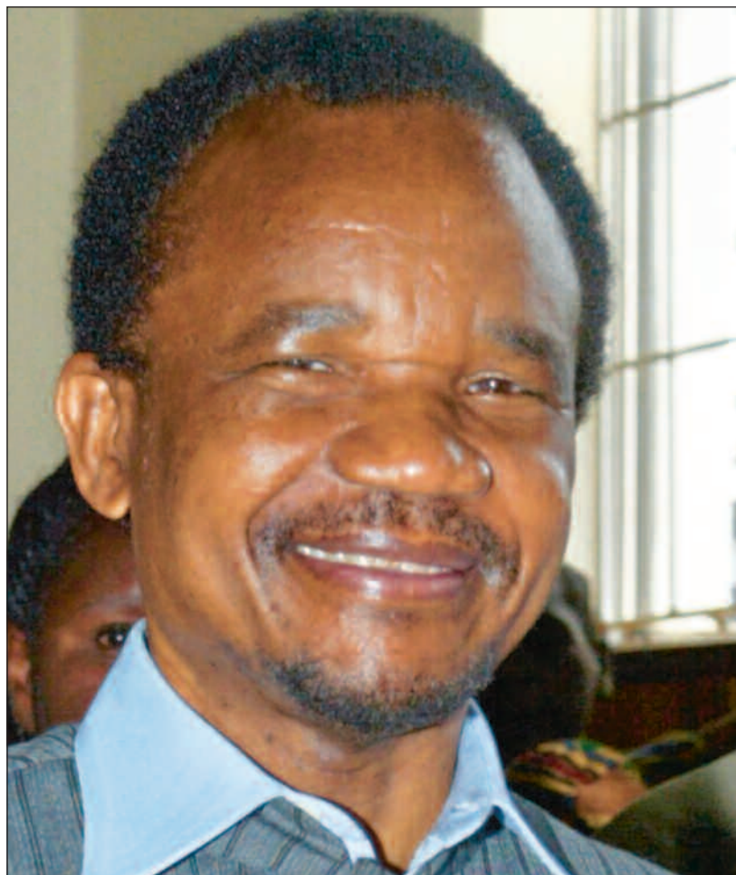
Zambias tidligere president Frederick Chiluba .