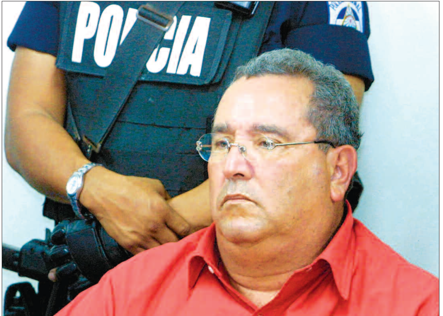
Tidligere president i Nicaragua, Arnoldo Aleman , er dømt til 20 års fengselsstraff for hvitvasking og bedrageri av over 700 millioner kroner.

– Nicaraguas befolkning har fått et nytt land. Når man fanger en stor fisk, gir det landet store forhåpninger for fremtiden. Rom ble ikke bygget på én dag, men vi har satt en ny standard for utviklingen i landet, var president Bolanós reaksjon på dommen.