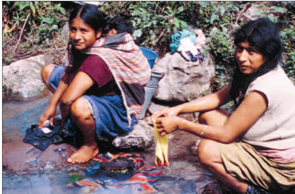
SN Power forsikrer at lokalbefolkningen skal tas med på råd når nye utbygginger skal vurderes.