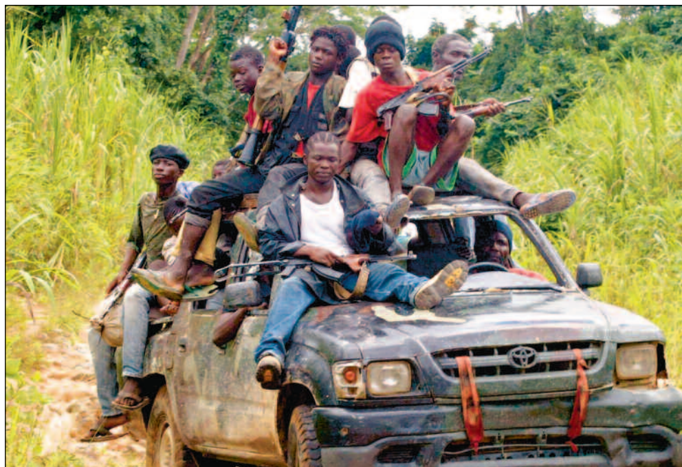
Det vestafrikanske landet Liberia er blant de som har størst problemer med indre uro. Bildet er fra byen Kolahun 6. juni i år.