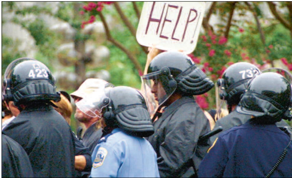
Pengefondet er ofte møtt med protester på grunn av påstått manglende imøtekommenhet overfor utviklingslandenes krav. Bildet er fra demonstrasjonene under IMF's årsmøte i Washington i 2002.

Slik Schreiner ser det, er det først og fremst to hovedoppgaver