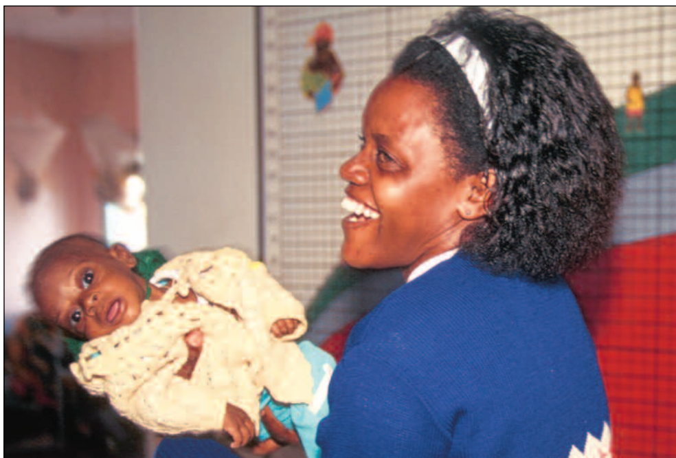
30-40 prosent av spedbarna med hiv-positive mødrer blir født hiv-positive i Zambia. Får gravide og ammande kvinner hiv-medisin, minskar risikoen for smitte frå mor til barn.