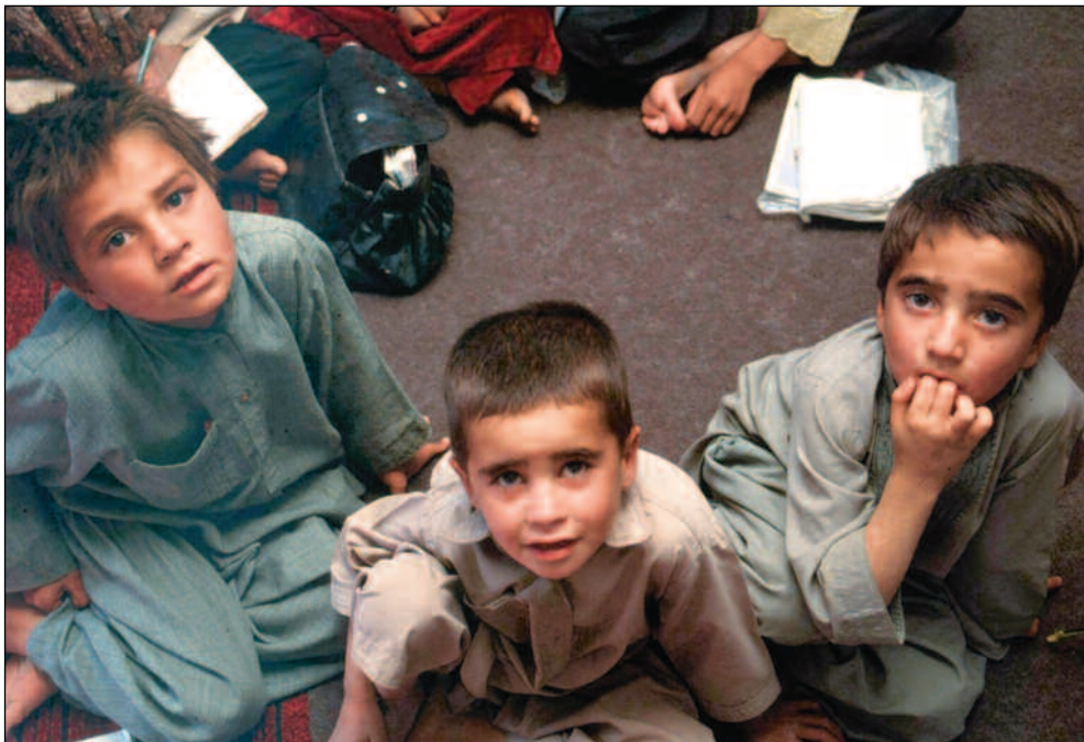
Nesten en halv milliard kroner i norsk bistand havnet i det sønderskutte Afghanistan i fjor. Skolebarna er blant de som nyter godt av bistanden.

vedsamarbeidslandene Bangladesh (132 mill.), Malawi (124 mill.) og Nepal (105 mill.).