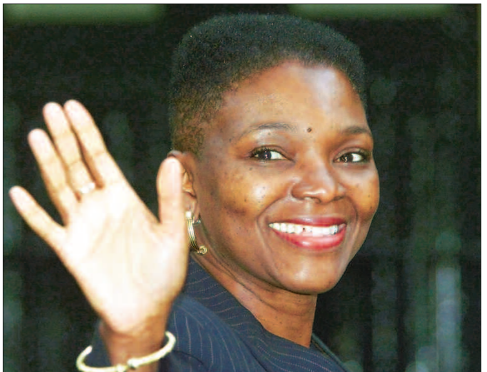
Baroness Valerie Amos har tatt over som utviklingsminister etter Clare Short som var en sterk motstander av Storbritannias krigføring i Irak.