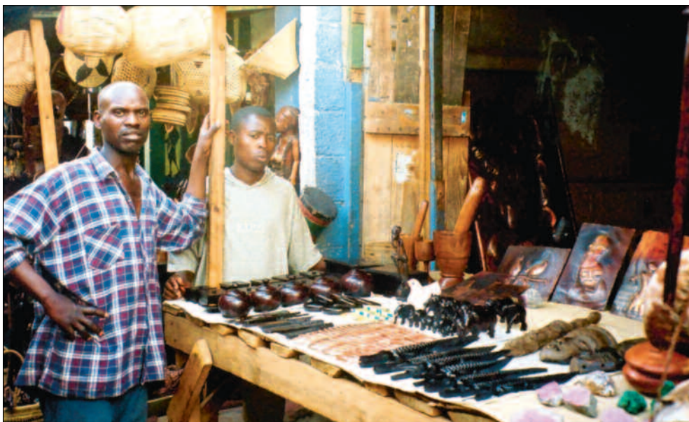
Små næringsdrivende i Zambia, betaler gjerne kommunale avgifter for å få bodplass på lokale markeder, men er ikke nødvendigvis registrert som formell bedrift.