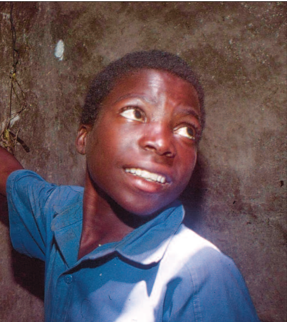
Foreldrelose 15-åringen hengst opp for å pynte i jordhytta.