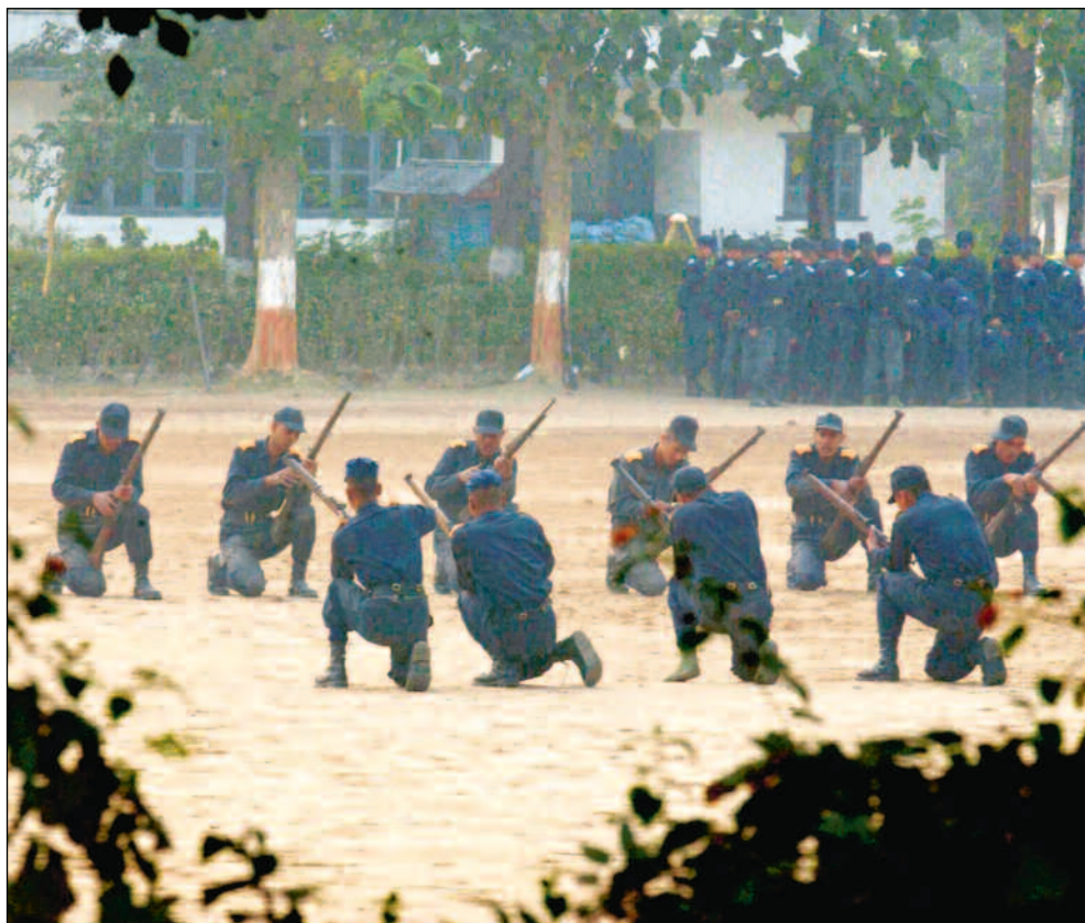
Nepalesisk politi under trening i byen Nepalgunj. Sikkerhetsstyrkene mistenkes for å ha tatt liv av en rekke sivile i sin kamp mot den maoistiske geriljaen.

Det var nesten daglige meldinger om mennesker som har vært utsatt for tortur av hæren, paramilitære politistyrker og politiet. Hæren holder ofte arresterte med bind for øynene og i håndjern i mange dager, uker og til og med måneder. Torturmetodene inkluderte voldtekt, elektriske sjokk, belana (å rulle en tung stokk over fangens lår for å forårsake muskelødelegelser), slag med