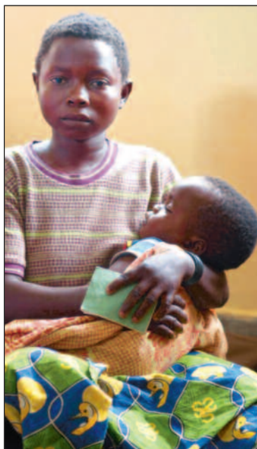
15-årige Nsimenya med sønnen på sykehuset der hun behandles for underernæring og kjønnsykdommer.

– Mannen min har forlatt meg. Han sier at siden jeg hadde sex med mai-mai så kan jeg smitte ham. Vi har fem barn, men de har han tatt fra meg. Hvordan tror du det kjen-