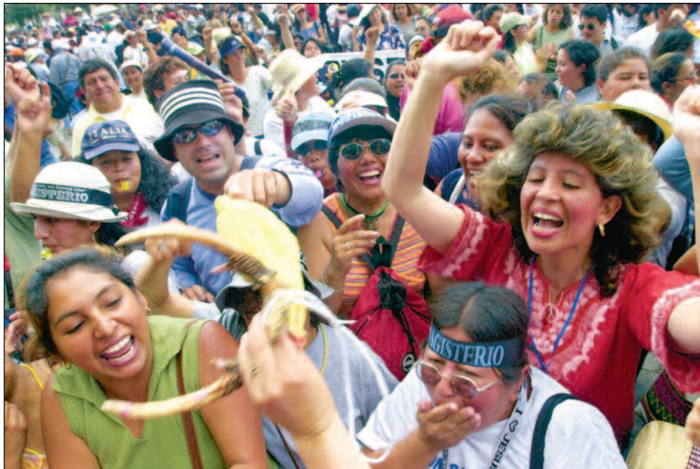
Lærerorganisasjonene er, etter manges mening, den eneste kraft i det sivile samfunnet. Nylig fikk de til en avtale med regjeringen etter 50 dagers streik.