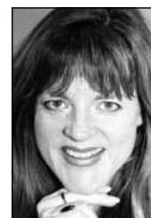
Norges utviklingsminister Hilde Frafjord Johnson.

På tiltakssiden viser hun til at Norge er inne med betydelig støtte på helse- og utdanningssektoren i flere land, i tillegg til at man for eksempel støtter gjennomføring av demokratiske valg og styrking av samfunnets «vaktbikkjefunksjoner» – f.eks. massemedier og aktører i det sivile samfunnet. I tillegg er norsk bistand en viktig støttespiller for styrking og kompetanseoppbygging innenfor justissektoren i flere land.