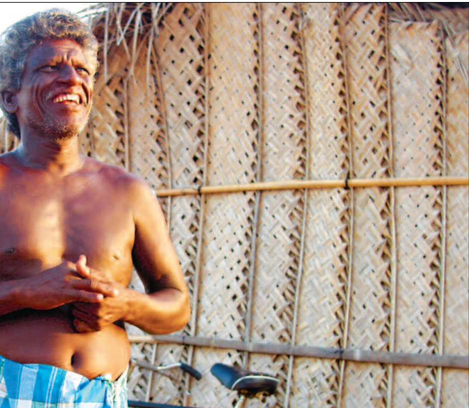
i fiskelandsbyen Kaddaikadu i de LTTE kontrollerte områdene.