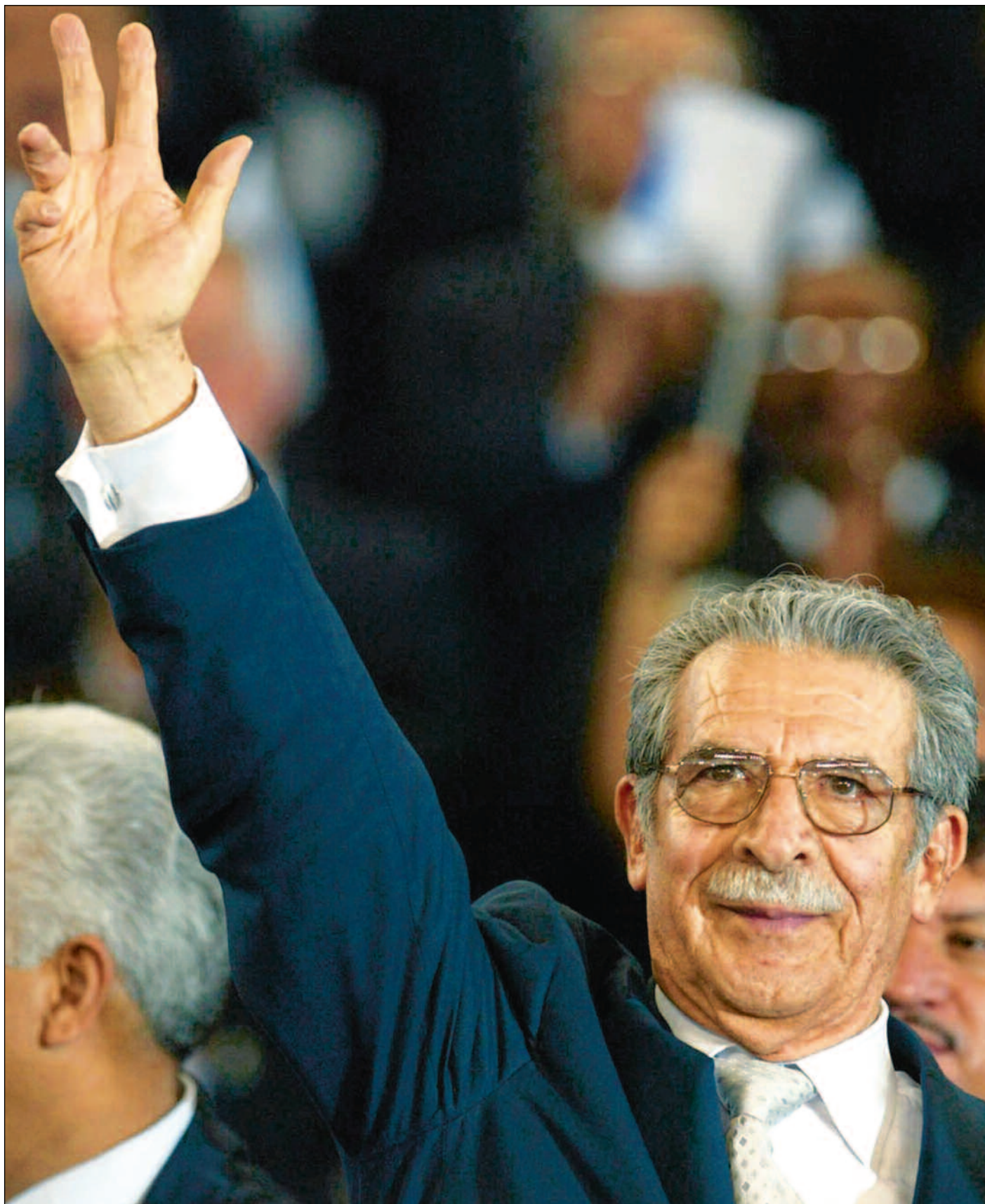
Den 76 år gamle eks-generalen Efraim Rios Montt fortsetter å kaste sin skygge over guatemalansk politikk. Nylig ble han nominert som regjeringspartiets presidentkandidat.

De lette tingene. – Vi har klart de lette tingene, å lage nye lover, skape nye institusjoner og utnevne nye myndighetspersoner, men endringer av grunnleggende holdninger og sosiale relasjoner er ikke skjedd. Vi