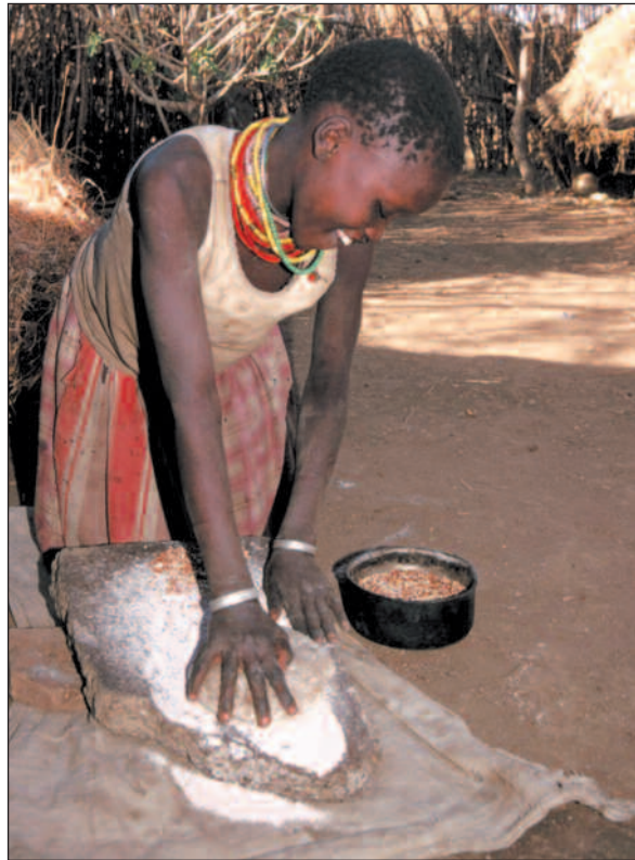
En tur på landsbygda i de fleste afrikanske land sør for Sahara viser store problemer som vanskelig bare kan forklares med kolonitiden, skriver Anders Breidlid.