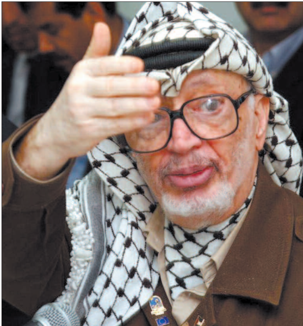
Yasser Arafat har støtt på en av de hittil største utfordringene mot sin maktposisjon.