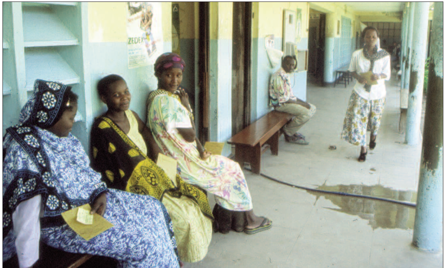
Norske eksperter i internasjonal helse advarer mot svake helsesystemer i utviklingsland, og ber verdenssamfunnet ta ansvar. Bildet er fra et sykehus i Tanzania.

– I Mosambik har man ennå ikke begynt med mor-barn-behandling