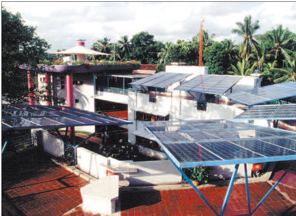
I det nye hovedkvarteret i Colombo er WIF og de tilhørende kommersielle selskapene samlet under samme tak.