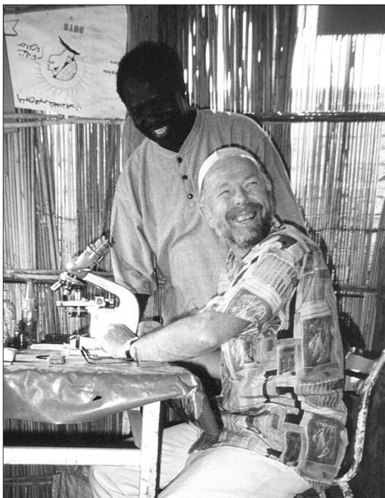
Kjell Spinnangrs kronikk finner du på www.bistandsaktuelt.com