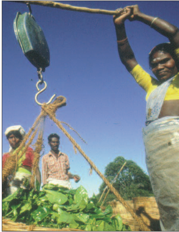
«Det framgår ikke av noen dokumenter hvorvidt miljøhensyn er integrert i distriktsutviklingsprogrammet for Hambantota i Sri Lanka», heter det i Riksrevisjonens kritiske rapport.

Fire områder. Primært mener Riksrevisjonen at det er vanskelig å se om Stortinget får relevant informasjon om hvordan midlene er benyttet og hvilke resultater som er oppnådd. I rapporten skriver Riksrevisjonen at det er grunn til å spørre om NORADs rapportering av miljørettede bistandstiltak er tilfredsstillende lagt opp. Det innebærer at en ikke kan få oversikt over hvor og hvor mye penger som har gått til de fire prioriterte temaområdene, slik som utvikling av bærekraftige produksjonssystemer, vern og bærekraftig bruk av biologisk mangfold, redusert forurensning av jord, luft og vann samt kulturminnevern og forvaltning av naturmiljøets kulturelle verdier. «Direktoratet (NORAD, red.anm.) er i en løpende dialog med departementet om hvordan resultatrapporteringen på de fire te-