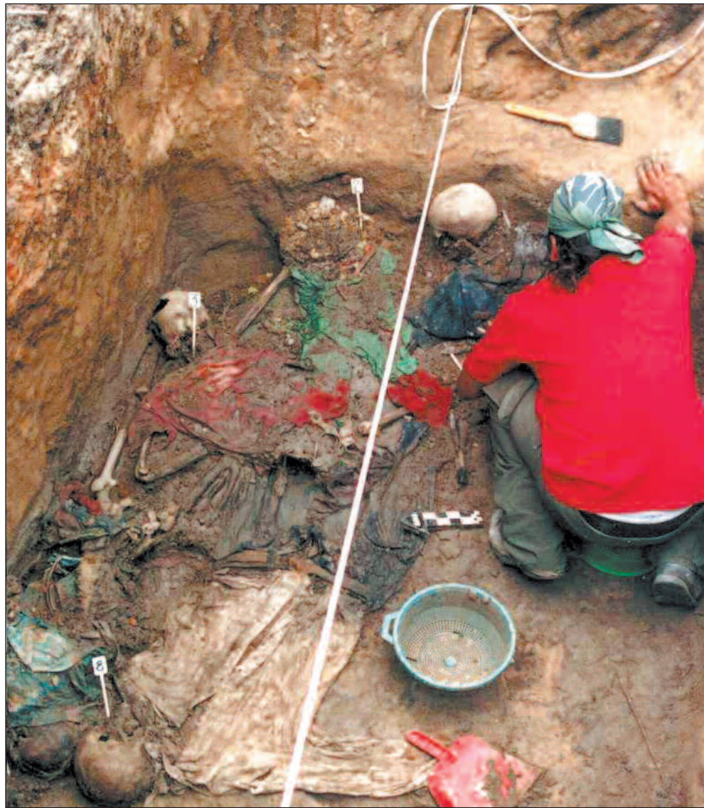
Gjennom gransking av beinrestene påviser ekspertene hvordan mange av innbyggerne i Rabinal ble hensynsløst maltraktet og torturert. Til slutt endte de sine liv i massegraver.

Massakrene. Rabinal er absolutt en kommune som har opplevd det ekstreme av konflikten i Guatemala. Av en befolkning på omlag 30.000, ble anslagsvis 7000 massakrert eller hensynsløst myrdet i tidsrommet 1980-84. En stor del av disse var kvin-