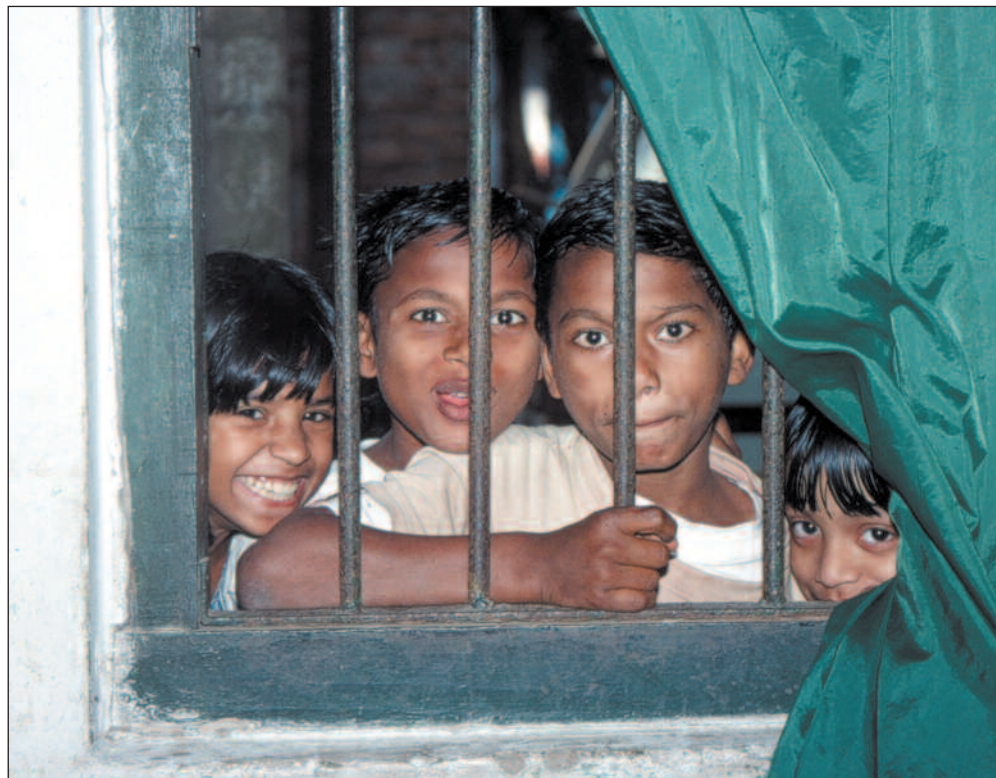
Hvordan sikrer man at svake grupper blir hørt? Hvem kjemper for deres interesser i et fattig land som Bangladesh?