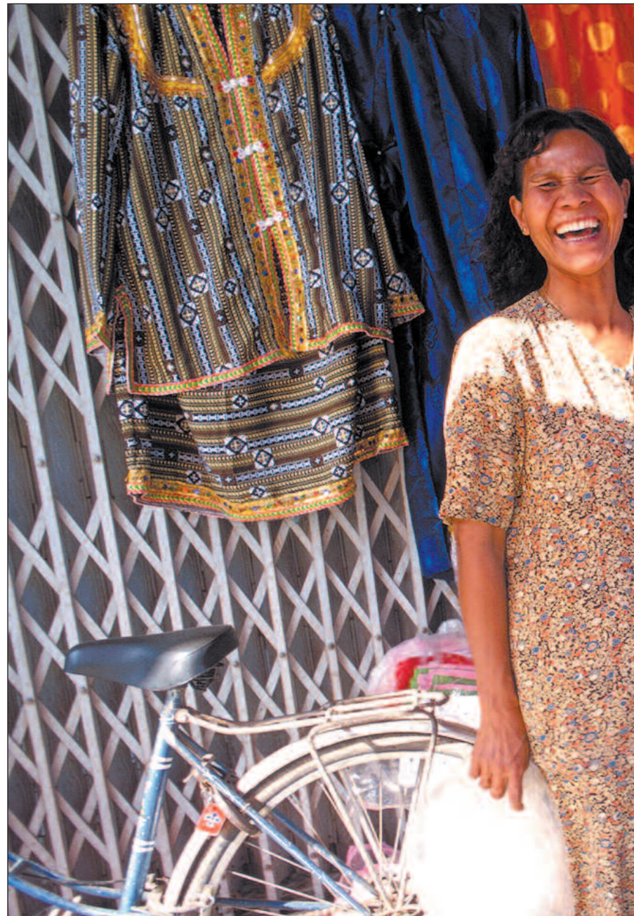
Kommunistlederne tillot på ny innenlandsk handel som førte til at mange startet egen butikk.