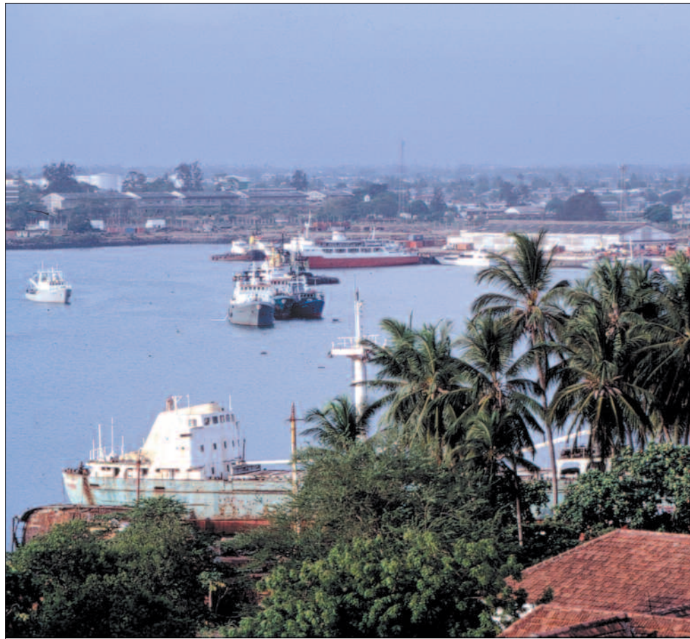
Et knep for å unngå høye tollavgifter er å importere varer via Zanzibar der avgiftene er lavere. Deretter blir varene sendt til fastlandet.

– Det er indikasjoner på at det har oppstått et internt marked for kjøp og salg av attraktive stillinger innad i organisasjonen. Mange ønsker en jobb i for eksempel tollavdelingen hvor det er store muligheter til å motta bestiklinger dersom man