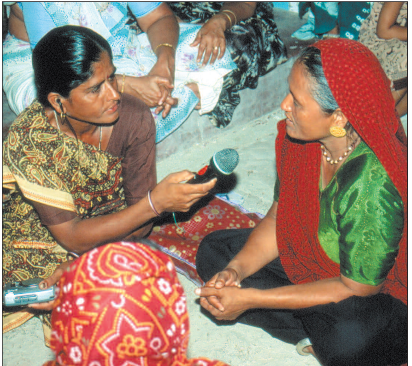
Norske myndigheter ser på utviklingen av frie medier i Sør som et viktig element i etableringen av demokrati og menneskerettigheter. Her er en indisk lokalradio i ferd med å intervju en landsbykvinne i delstaten Gujarat.

Konsulentbyrået mener også at prosjekter som har folkeopplysning som formål må skilles ut, fordi det kan legge føringer på journalistikken. Slike føringer kan bidra til å hindre utviklingen av en kritisk og