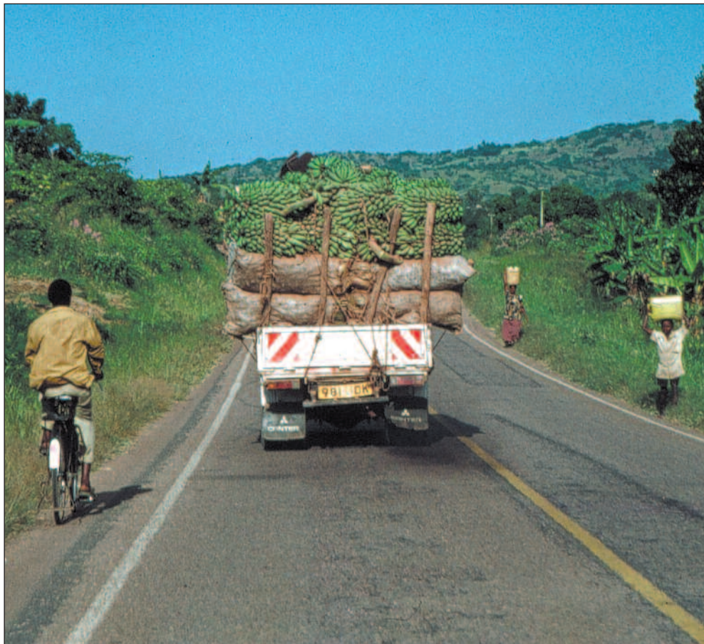
Halvparten av befolkningen i det sørlige Afrika har for lite å spise. I seks av landene har tallet på underernærte økt på 90-tallet, viser den nye FN-rapporten.

Spesielt utsatt. Barn er spesielt utsatt. Selv om gjennomsnittstallene for underernærte barn i utviklingsland totalt sett er redusert det siste tiåret, har utviklingen på dette området i praksis gått bakover i det sørlige Afrika: På grunn av befolknings-