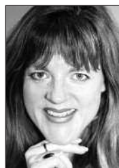
Hilde Frafjord Johnson, utviklingsminister.

” Nedgangen i bistand fra 90-årene vil likevel være snudd dersom disse løftene holdes.