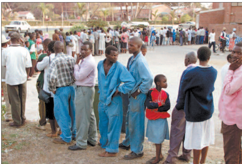
Biletet viser køen utanfor ein supermarknad i Harare i august, kor folk stod opptil seks timar i kø. Likevel makta ikkje alle å få tak i basisvarer som maismjøl, sukker og olje.

Ei stund seinare var eg på parkeringsplassen. Der la eg merke til at venen min som var komen for å hente meg, kjørte ein Mercedes. Han hadde sanneleg hatt framgang det siste året.