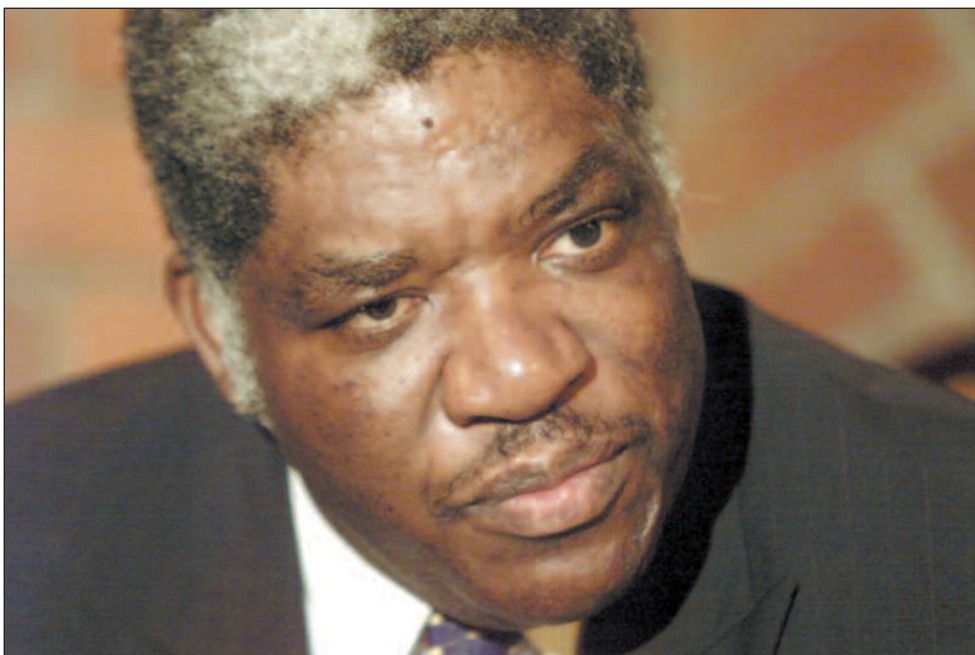
Mwanawasa sier han vil legge vekt på sterk styring gjennom institusjoner som skal kjempe mot korrupsjon, narkotika og brudd på menneskerettighetene.