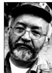
Raúl Reyes, nestkommanderende og talsperson for FARC.

FARC er som en liten regjering, en liten stat som kjemper for å regjere over Colombia, og er ikke avhengige av utenforstående.