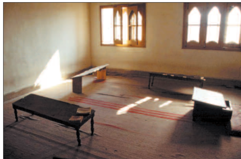
Til slike sparsomt utrustede klasserom sender de fattigste sine sønner – og i noen grad sine døtre.

Utarbeidelse av pensum for disse skolene er tidligere blitt gjort i samarbeid med Departementet for religiøse spørsmål. Det samme departementet vil forøvrig også være ansvarlig for etablering og drift av «mønstermadrassaer» som skal tjene som forbilder for den nye generasjonen madrassaer som regje-