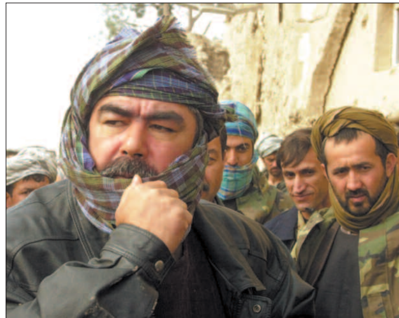
Bistand til Afghanistan kan bidra til å styrke krigsherrer, advarer forskere. Nord-Alliansens general Dostum er en av landets «sterke menn»

Hele rapporten er tilgjengelig på internett: www.cmi.no