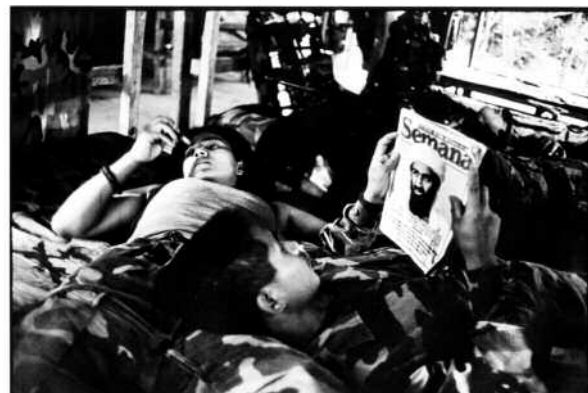
Et kjærestepar i geriljaen holder siesta mens verden leter etter terrorister. Jakten på Osama bin Laden har ført til skjerpede tiltak mot FARC.