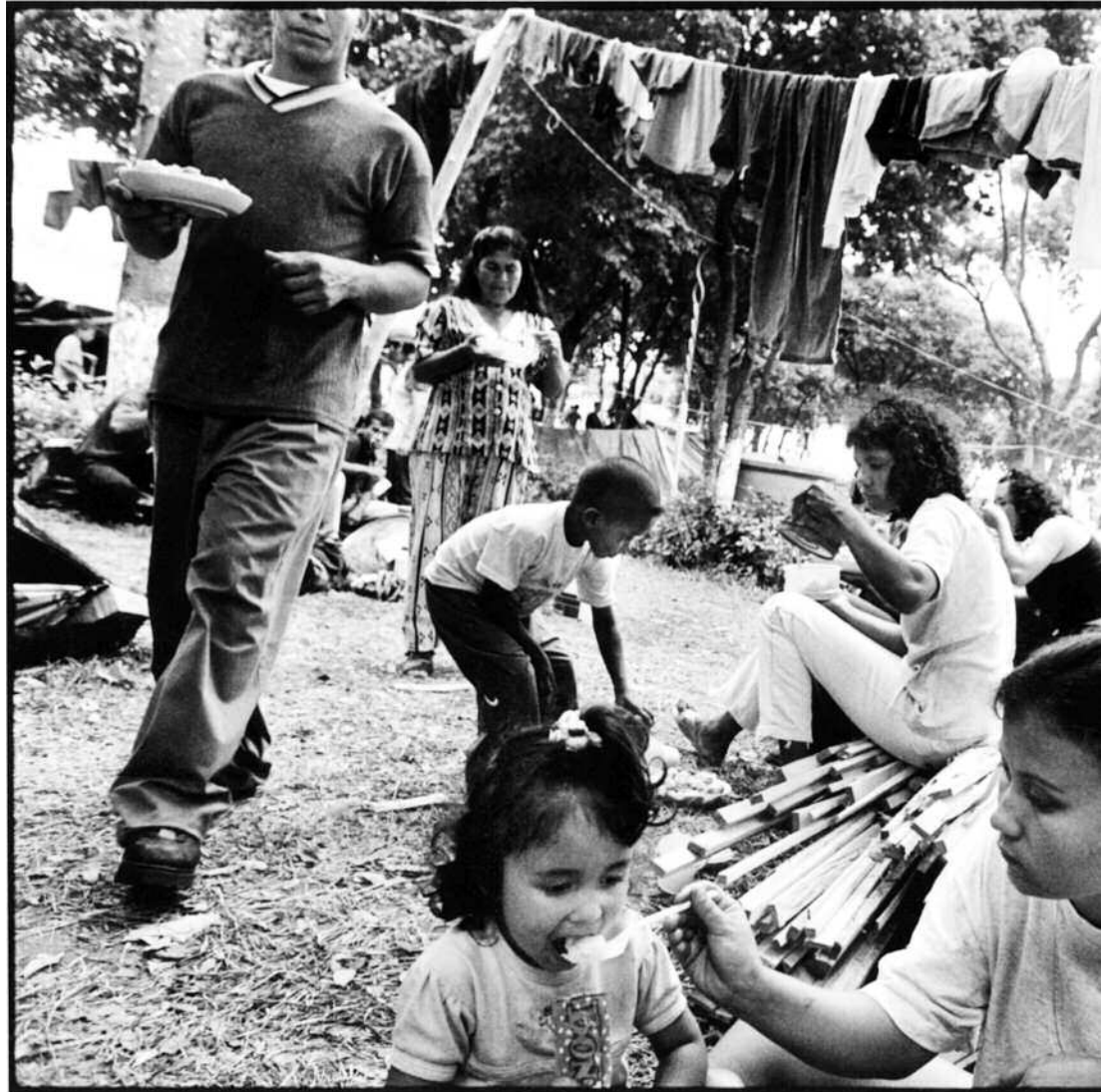
Matforsyningene kommer som hjelp fra byens befolkning. Ris, yuca, stekte bananer og kylling er vanlig mat.