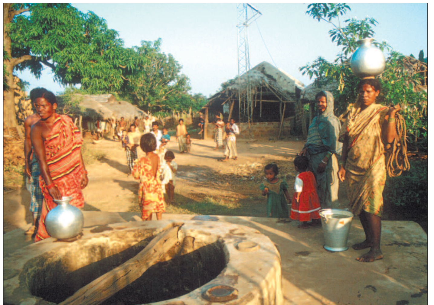
Organisasjonen Swadhinas målgruppe er fattige i den indiske provinsen Orissa, men organisasjonen viser liten vilje til å innføre et godt økonomistyringssystem. Derfor kutter Strømmestiftelsen nå samarbeidet.

– I en del tilfeller har vi initiert givermøter for å dele våre bekymringer eller informere om funn, og vi har fortalt våre partnere at vi diskuterer med andre givere. Samtidig har vi jo understreket at vi ikke er ute etter «å ta rotta på» noen, men at