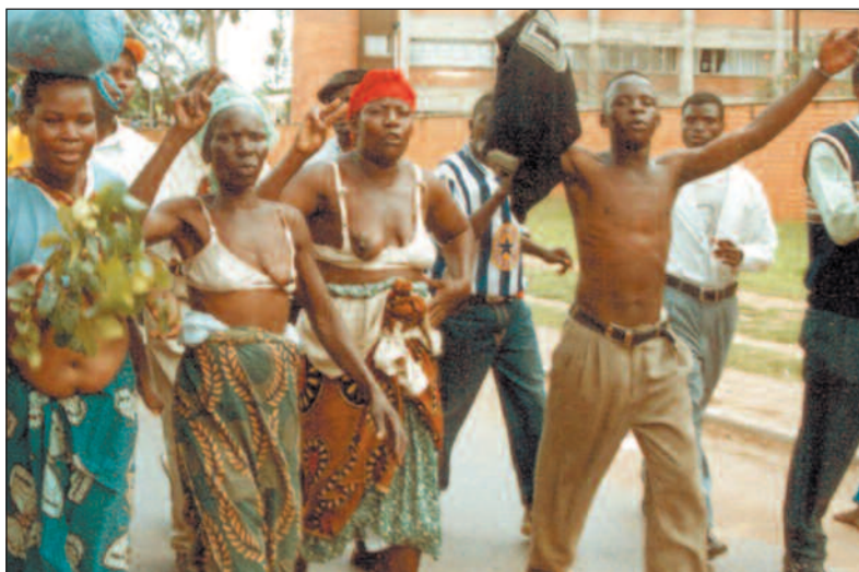
Hundervis av zambiske kvinner blottet brystene under en demonstrasjon 8. januar i år, mens de ropte slagord mot landets nye president.

Se også portrett av Zambias nye president, side 3