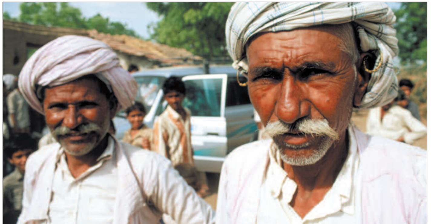
Idealisme og muligheten for reiser til eksotiske steder som India lokker norsk ungdom til læresteder som tilbyr utviklingsstudier.