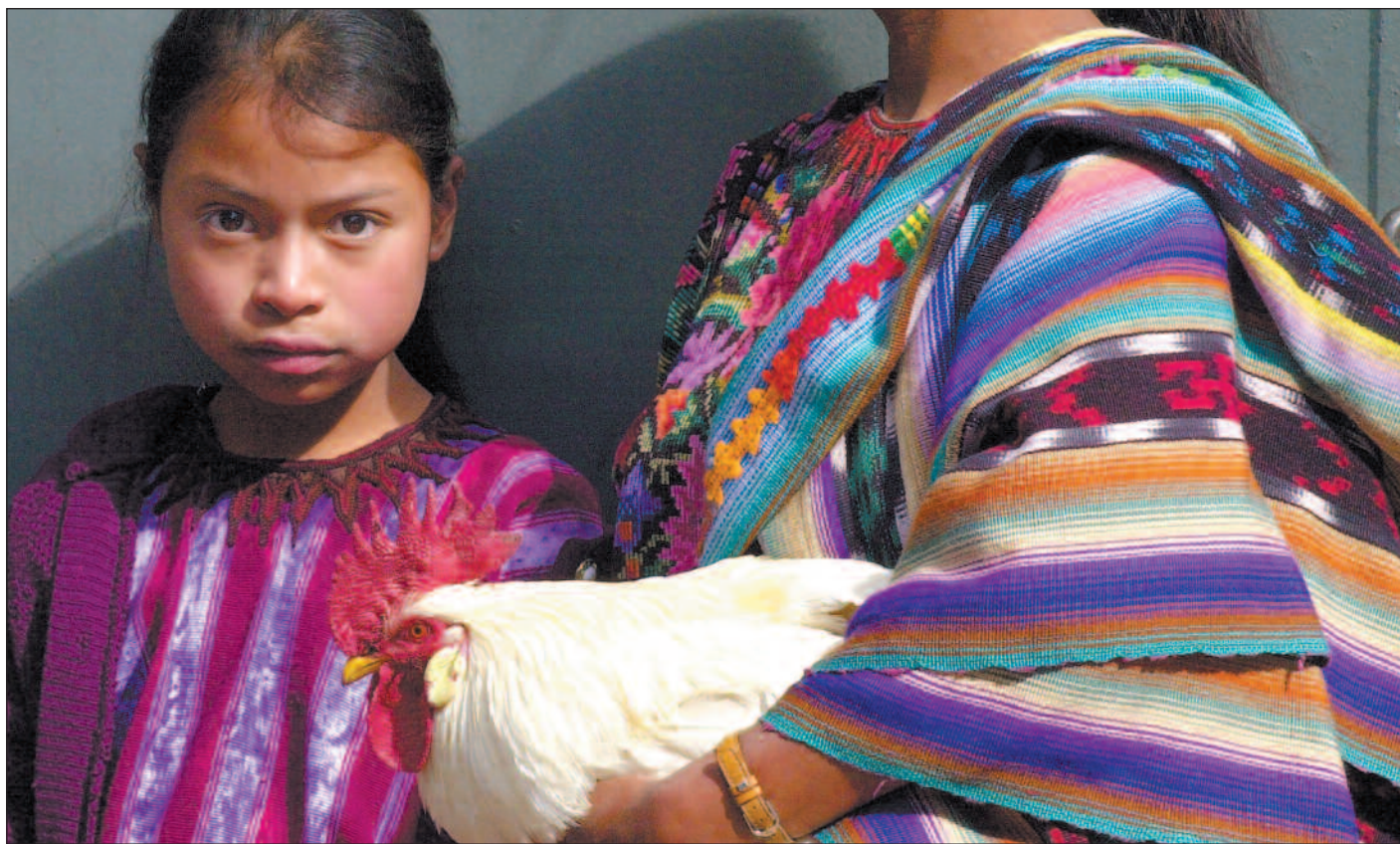
Freden i Guatemala har gjort lite med landets grunnleggende problemer. Kløften mellom fattige og rike har økt, og det store flertallet er fortsatt uten innflytelse.

Militæret er ikke åpent med i politikken, men deres innflytelse er åpenbar. Den militære institusjonen Estado Mayor Presidencial sitter med tett kontroll