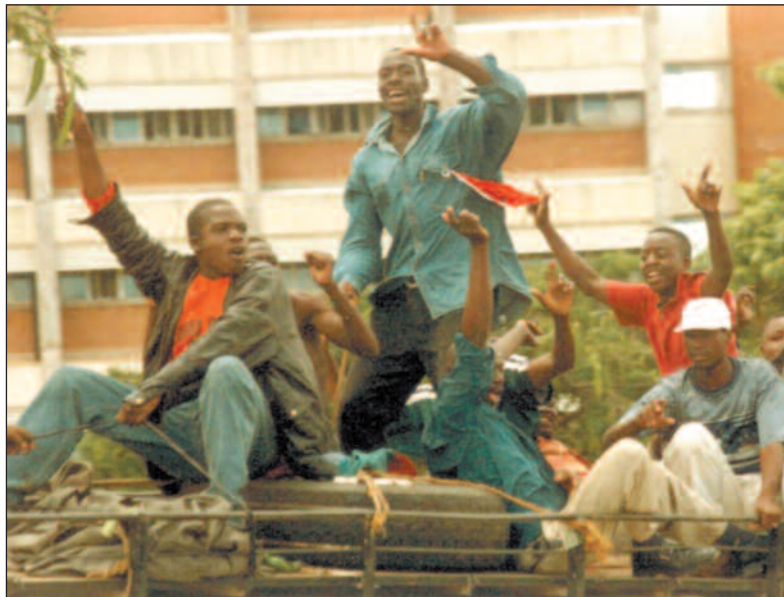
Tilhengere av regjeringpartiet feirer at Levy Mwanawasa ble tatt i ed som president.