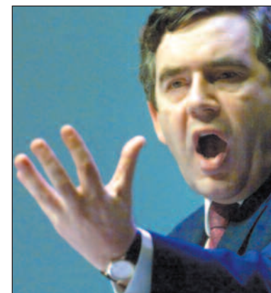
Den britiske finansministeren Gordon Brown ønsker en fordobling av verdens bistand.

Fordoblet bistand innebærer å øke fra nåværende 450 milliarder til 900 milliarder kroner (fra 50 til 100 milliarder dollar) per år.