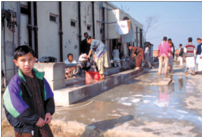
Elevene i madrassaen vasker seg før fredagsbønnen.