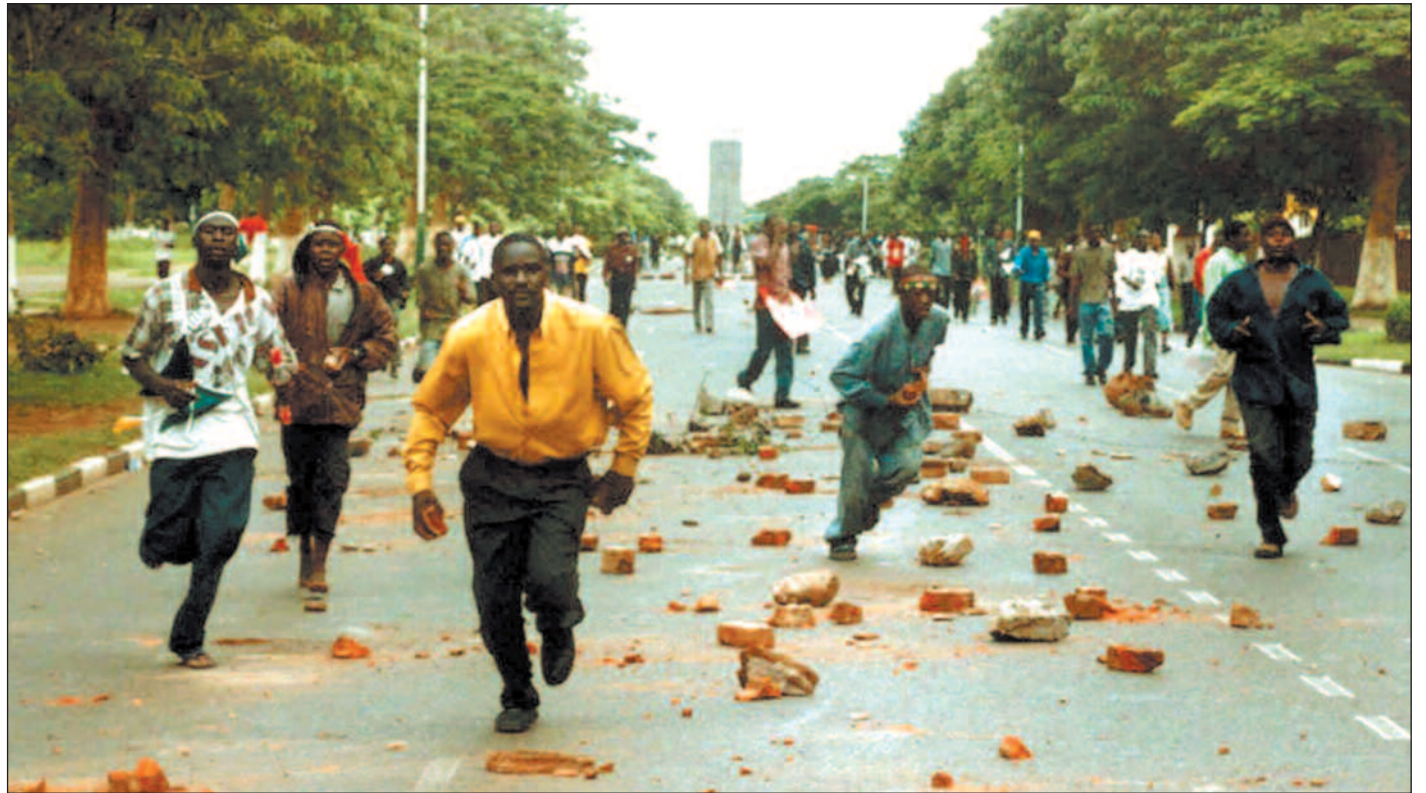
Demonstranter løper gjennom Zambias hovedstad Lusaka 1. januar i år etter å ha protestert mot valgresultatet.

Klaget inn for høyesterett. I alt 11 kandidater stilte til presidentvalget i Zambia 27. desember 2001, hvor det for første gang samtidig også ble avholdt parlamentsvalg og lokalvalg. MMD og deres regjeringskandidat Levy Mwanawasa vant valget med 29 prosent av stemmene, mens opposisjonspartiet United Party for National Development (UPND) med sin presidentkandidat Anderson Mazoka fikk 27 prosent. I en befolkning på i alt ti millioner mennesker var det bare 35.000 stemmer som skilte de to presidentkandidatene. Opposisjonsleder Mazoka har nå bedt landets høyesterett om å erklære valgresultatet for ugyldig.