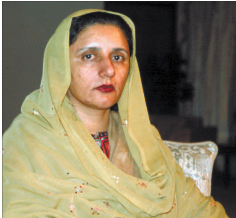
– Mange av skolene våre er i så dårlig forfatning at det er en akutt risiko for at takene skal falle ned, sier Pakistans undervisningsminister Zobaida Jalal til Bistandsaktuelt.

Rekrutterer blant de fattige. I et land hvor over 40% av befolkningen lever under fattigdomsgrensen er det ikke nok å innføre skoleplikt for alle. Mange barn må arbeide for at familiene i det hele tatt skal overleve. For disse familiene er madrassa-