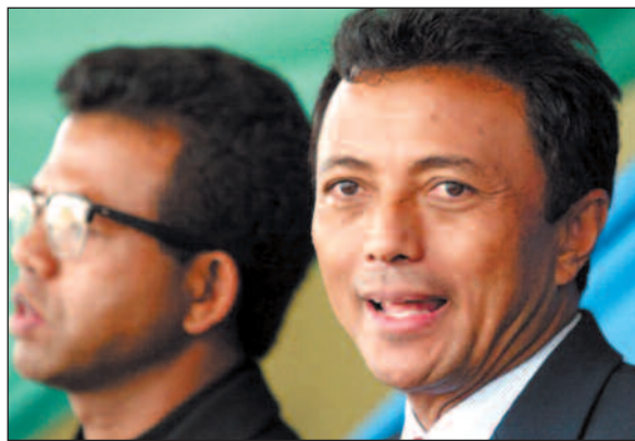
Opposisjonsleder Marc Ravalomanana har proklamert generalstreik over hele Madagaskar fra og med 28. januar.

Det hele begynner og slutter med en kort, men sterk gudstjeneste med skikkelig trøkk. Hundre tusen mennesker deltar på andakt i gata. Det hele er en så sterk demonstrasjon av tro, beslutsomhet, folkelig samhold og håp om forandring at det nesten går kaldt nedover ryggen på meg midt i varmen.