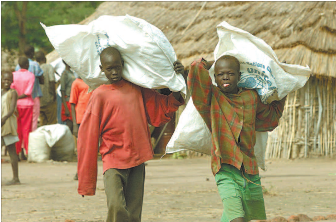
Matvaresituasjonen har vært vanskelig for befolkningen i Sør-Sudan. Norsk Folkehjelp har forsøkt å bidra til økt selvforsyning.

– Viktig å få fram er at det er bare givemyndigheter, som kan endre på dette. De må forstå at det må og