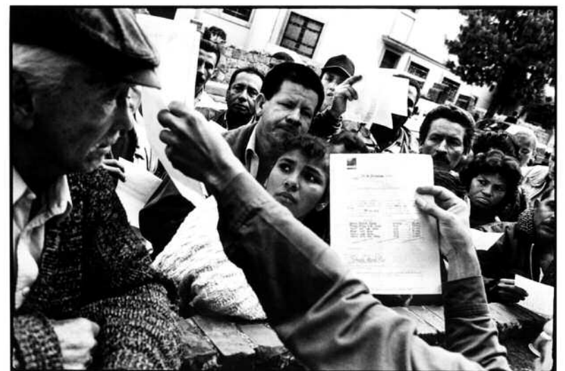
80 mennesker venter på å få registrert seg som «internt fordrevne». Det gir tilgang til utdanning, helsetjenester og offentlig støtte for et halvår.

Internflyktningene forteller om omfattende drap på menn i stridsdyktig alder.