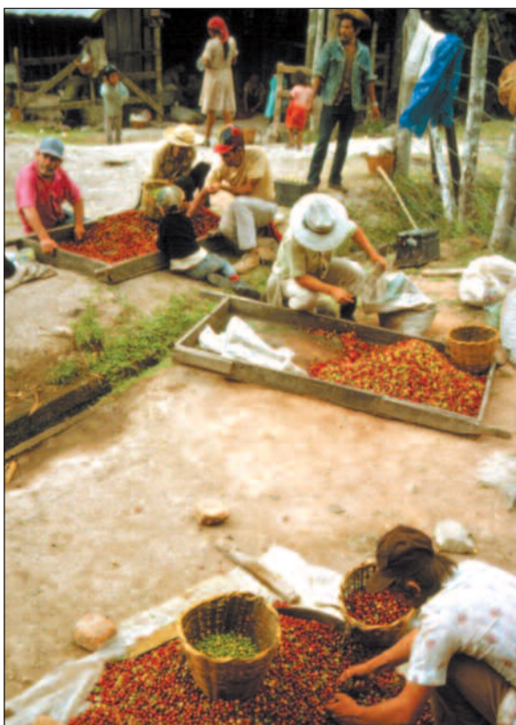
Hvilke land burde vært hovedsamarbeidsland dersom faglige argumenter skulle vært de viktigste?

Men egentlig tror jeg ikke man skal være redd for dette. Jeg har stor tro på almenhetens evne til å fornekke når det er faglig baserte uttalelser, – og når skap-politikerne uttaler seg. I det hele tatt tror jeg den offentlige debatt både ville bli bedre og mer progressiv hvis den ble mer åpen, og basert på faglige innspill.