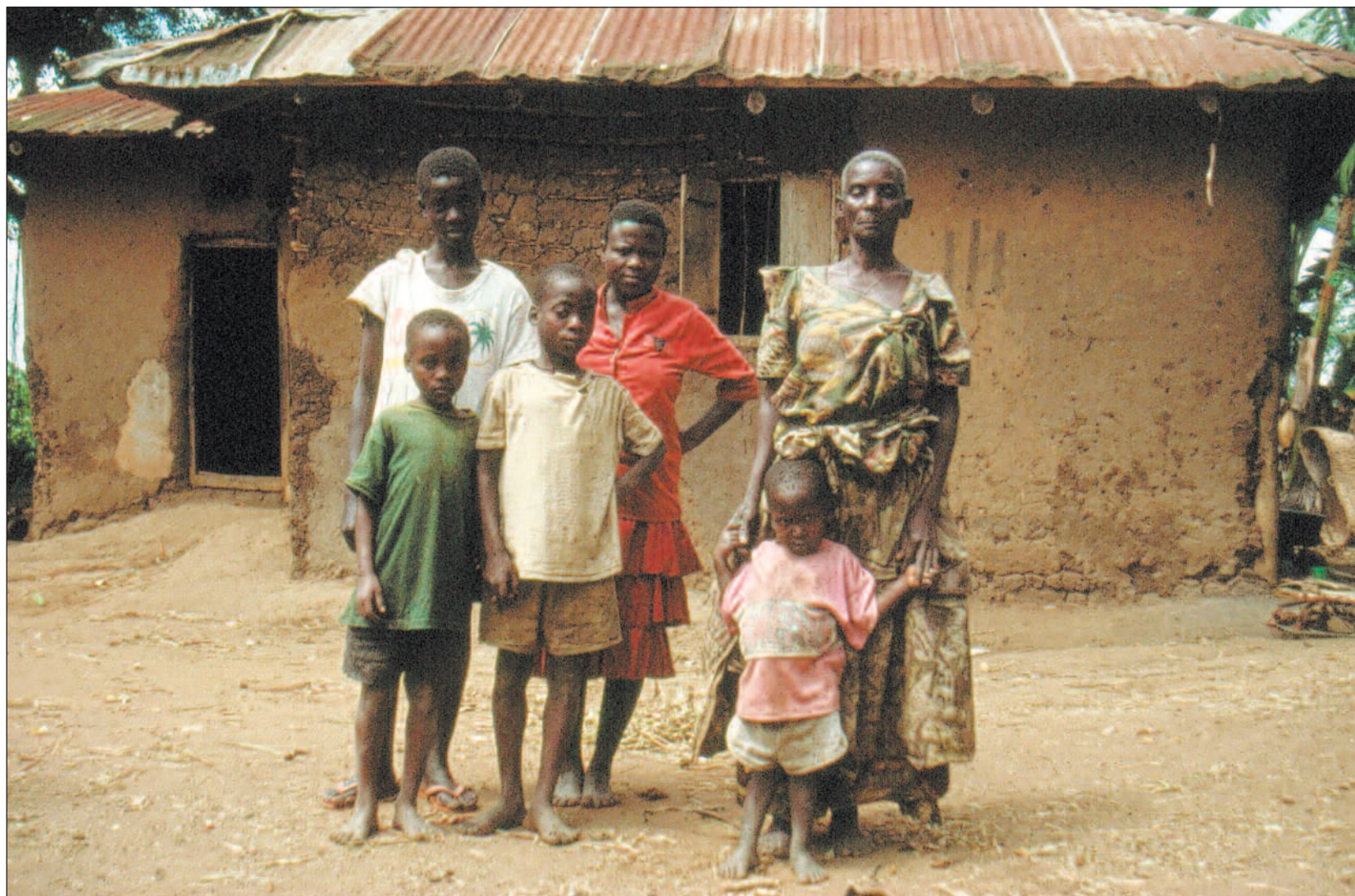
Den tid er forbi da NORAD sendte egne fagfolk ut for å arbeide med landsbygdsutvikling blant fattige mennesker i fattige land.