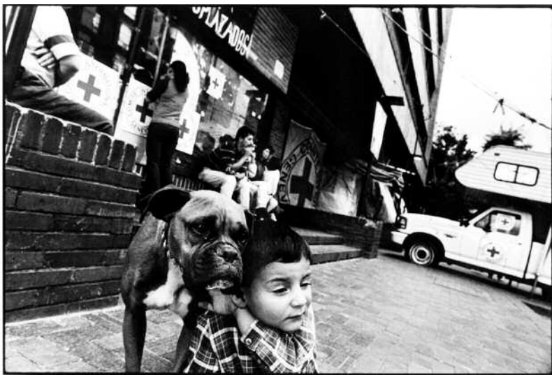
En gutt har fått seg en ekstra lekekamerat. For de 200 barna som okkuperer Røde Kors er lekeplassen en 15 kvadratmeter stor bit av et fortau.

Okkuperer en park. Det er lørdag formiddag i en park i Bucaramanga, lenger nord i landet. 20 telt er slått