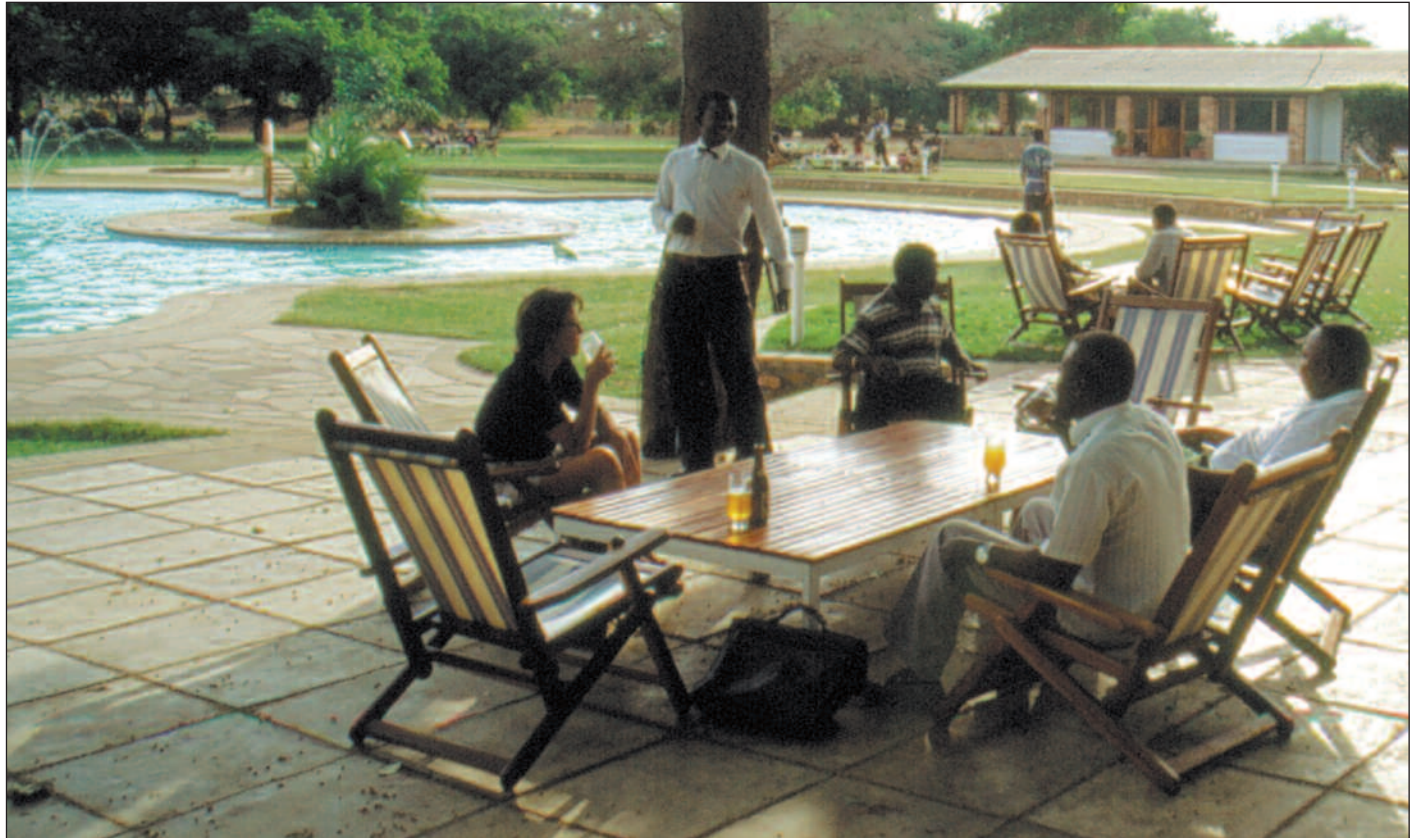
Bistandsgivernes fagfolk står stadig mer fjernt fra bistandens primære målgruppe – de fattigste. De fleste kjenner livet i en «country club» bedre enn livet i en landsby.