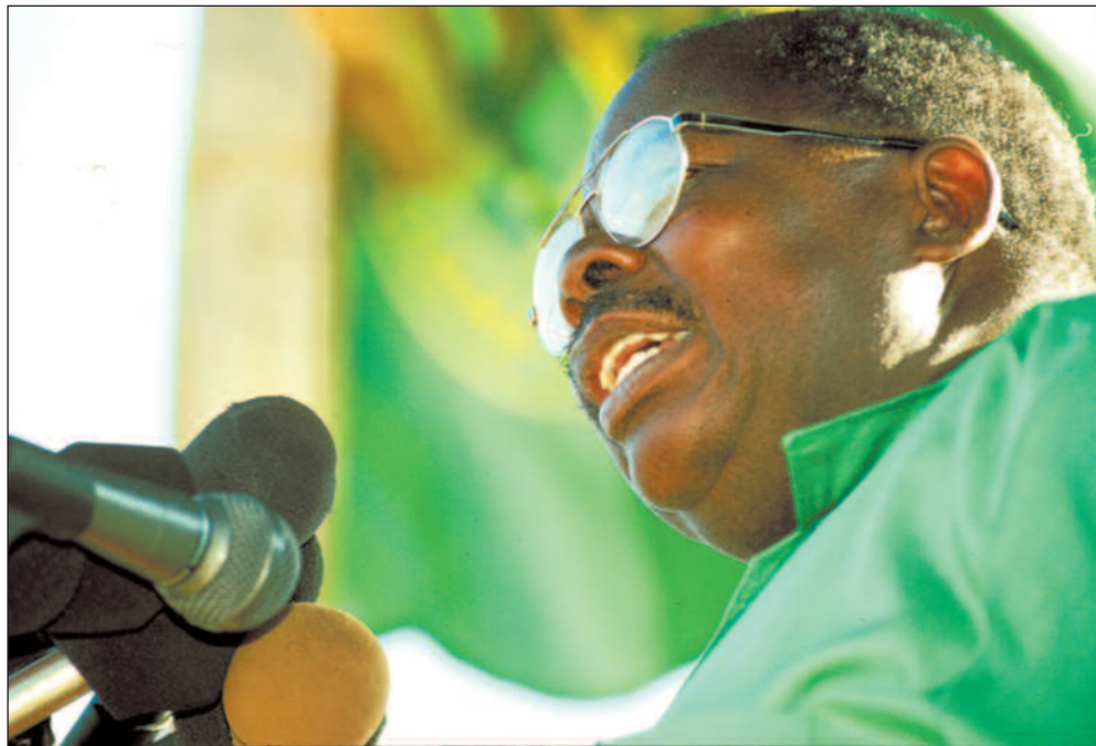
Tanzania har allerede en gjeld på over 60 milliarder kroner. Likevel vil landets president Benjamin Mkapa bruke 360 millioner kroner på et nytt luftforsvarssystem.

- Hvem tjener egentlig på dette kjøpet? Dersom denne saken går