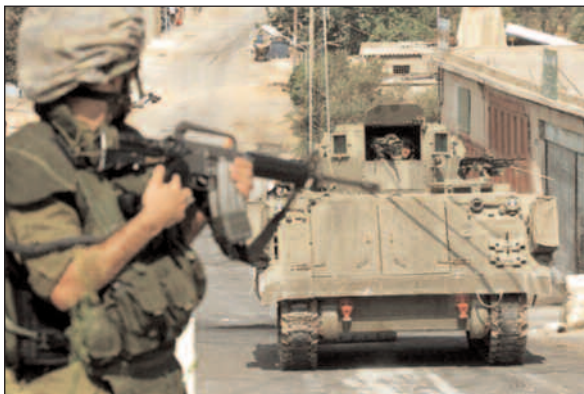
Avkoloniseringsprosessen vil uvegerlig fortsette så lenge okkupasjonen er der, skriver redaktøren i Palestine Report.