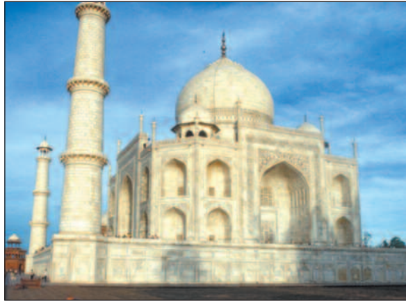
Agra i India, med kjærlighetserklæringen Taj Mahal, var rammen for toppmøtet mellom Pakistan og India om Kashmir.