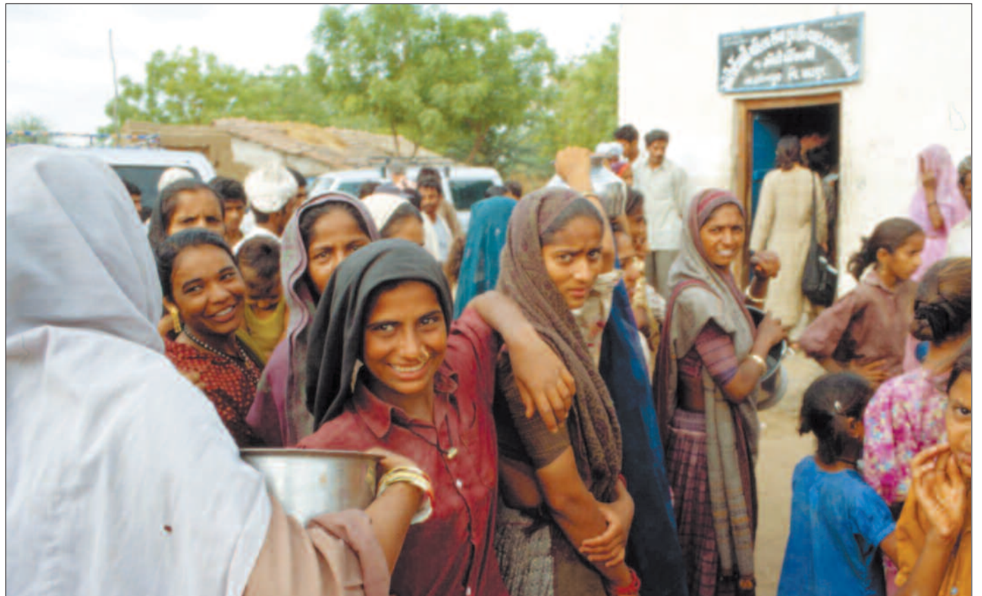
Det er fortsatt kø foran meieri-kooperativet i morgentimene, men nå vet at alle de blir raskt og effektivt ekspedert.

Et universitetsinstitutt i nærmeste storby har laget et spesialtilpasset program som kan tas i bruk av alle de mange melkekooperativene i delstaten, men foreløpig er det bare de mest «framsynte» kooperativene som har tatt den nye tekno-