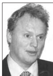
Raymond Johansen, statssekretær i Utenriksdepartementet

Verdenssamfunnets håndtering av konflikten kan knapt sies å få stående karakterer.