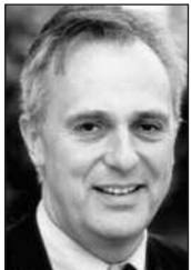
UNDPs leder Mark Malloch Brown.

– Særskilt nyttige. – Disse variantene gir 50 prosent større avkastning, modner 30 til 50 dager tidligere, er vesentlig rikere på protein, viser større motstandsdyktighet