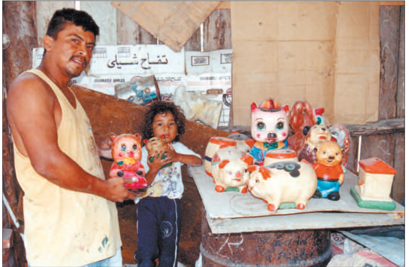
Småsparerne i Misjonsalliansens lånefond har – i hvert fall foreløpig – tapt sparepengene sine.

Han mener at en tilbakebetaling har med regjeringens troverdighet overfor mange giverland å gjøre.