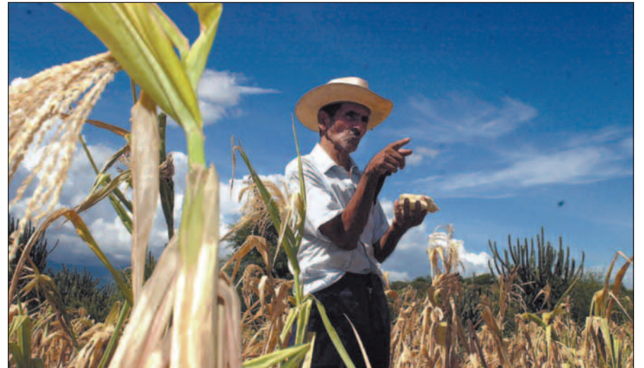
Tross økonomisk vekst har fattigdom og sosial ulikhet økt dramatisk i en rekke land i Mellom- og Sør-Amerika.

tross for en til dels kraftig vekst det siste tiåret. I rapporten «Is Growth Enough?» hevder IDB at en av årsakene er liberaliseringen av finansmarkedene, og mener at fattigdomsreduksjon bare vil skje dersom utviklingsstrategiene har en sosial profil.