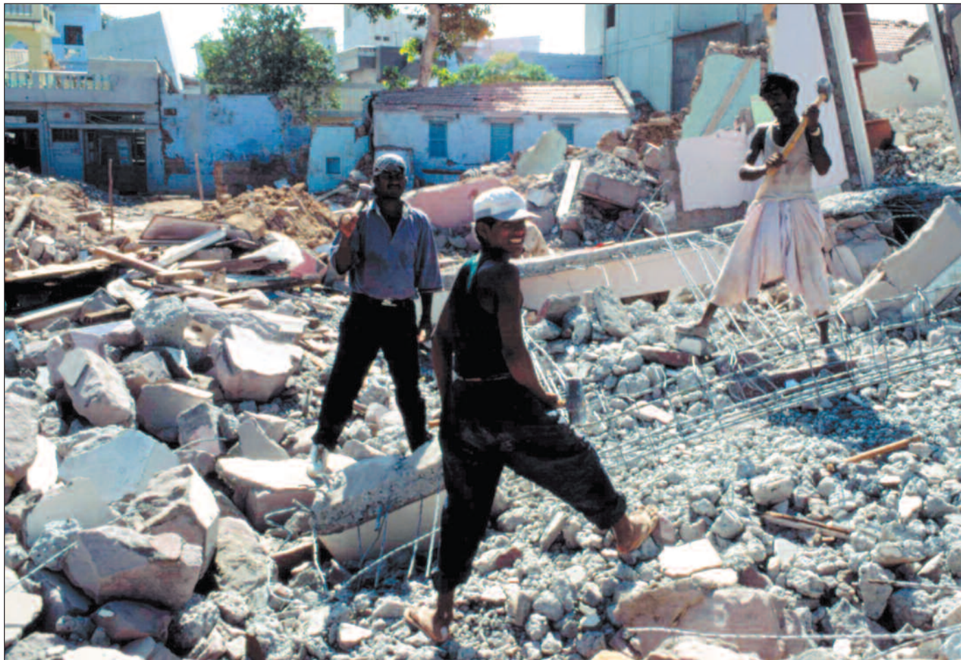
Det er de fattigste – mennesker uten forsikring og penger i banken – som alltid rammes hardest ved naturkatastrofer. Jordskjelvet som rystet Gujarat i India i januar var intet unntak.