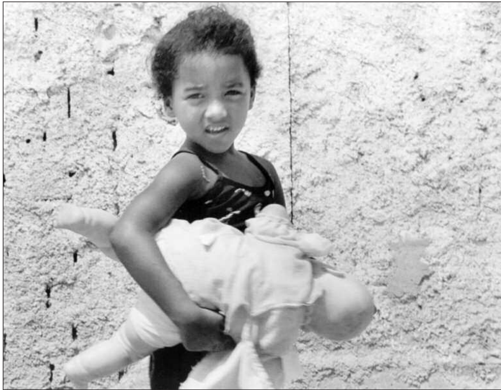
Kirkens Nødhjelps arbeid blant fattige i Brasil «ødelegger en MUL-statistikk», men arbeidet er like fullt fattigdomsorientert, understreker artikkelforfatteren.

Det er veldokumentert at organisasjoner i det sivile samfunn får utnyttet sitt potensial bedre dersom staten i disse landene fungerer rimelig tilfredsstillende. De fleste av mellominntektslandene har en grunnleggende økonomisk og organisatorisk infrastruktur som oppfyller dette. Alt arbeid ved norske organisasjoner i mellominntektsland må skje som organisasjonssamarbeid med nasjonale organisasjoner. Programmene må implementeres av nasjonale organisasjoner i det sivile samfunn. Unntakene til dette kan være der politiske restriksjoner gjør det nødvendig for den utenlandske organisasjonen å implementere med lokale regjeringer fordi et uavhengig sivilt samfunn ikke finnes. Men de av oss som gjør dette, særlig i autoritære land i Asia (for