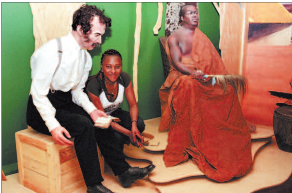
Artikkelforfatteren på besøk hos legen og misjonæren David Livingstone og en afrikansk vantro i det skotske Blantyre.

Jeg er selv en ivrig og glad kristen. Hver søndag går jeg i den enkle kirken i Baptistmenigheten jeg tilhører. Jeg tar på meg fine klær og møter fram tidlig på morgenen. Mange har kommet før meg og den unge, hvite presten virker alltid opp-