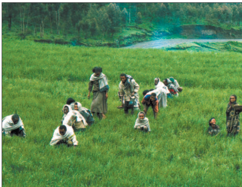
Kan bioteknologi føre til at færre landarbeidere blir syke av sprøytemidler?