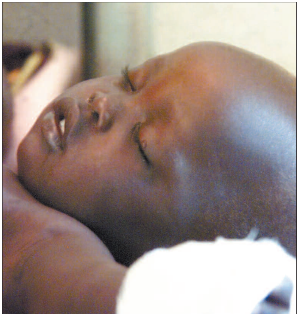
Borgerkrigen i Sudan rammer millioner av uskyldige sivile. Denne to år gamle gutten ligger bevisstløs på sykehus etter et bombeangrep.