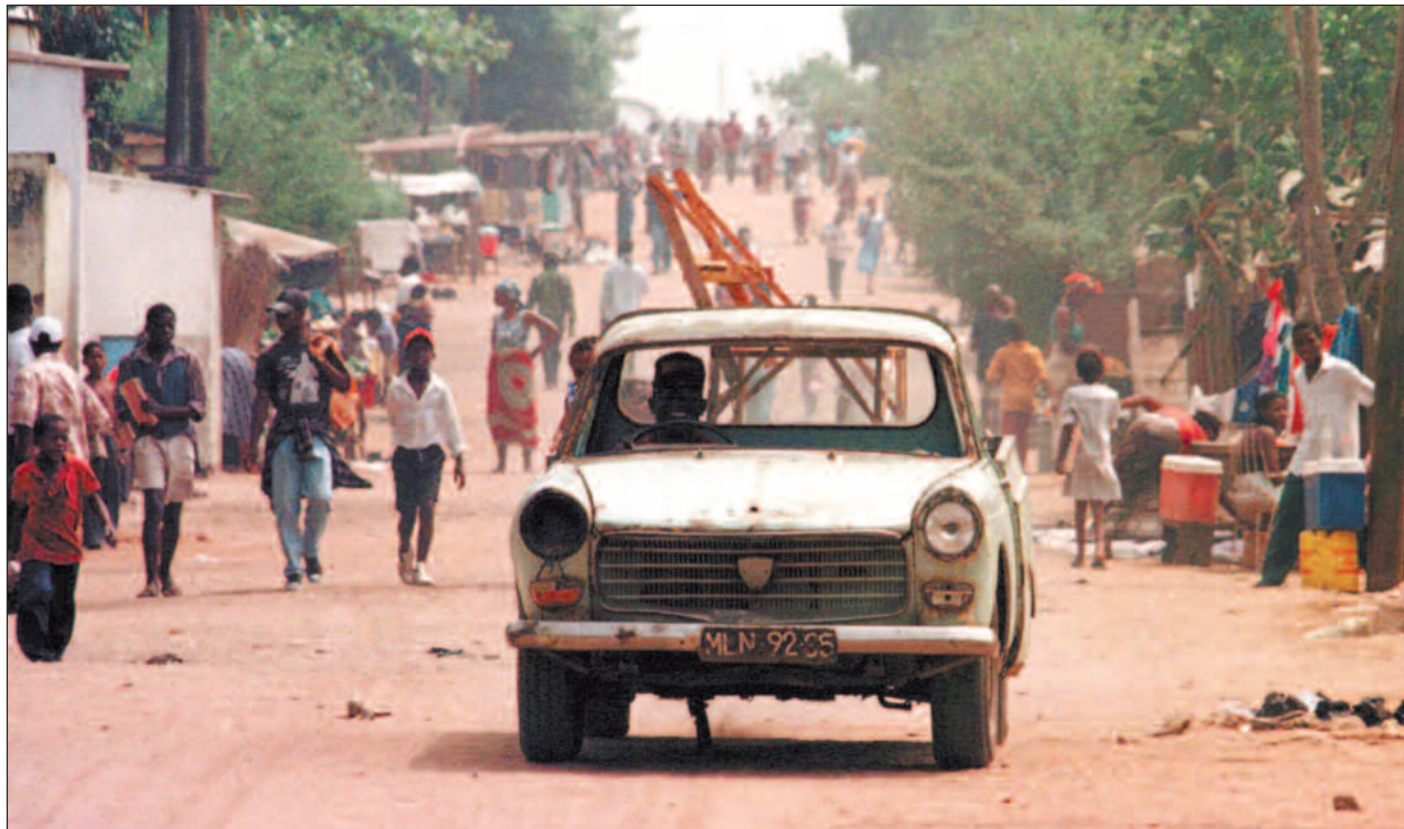
Myndighetene i fattige Mosambik må bruke flere hundre millioner kroner fra et allerede skrapet statsbudsjett på å dekke enorme underskudd i banksektoren. Styreformannen i Banco Austral ble myrdet etter at han avslørte nye underskudd.