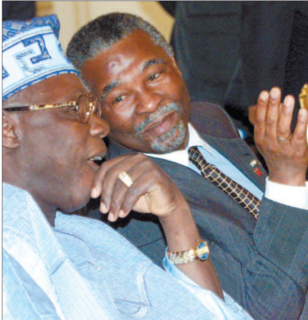
Sør-Afrikas president Thabo Mbeki (til høyre) fikk salgshjelp fra Nigerias leder Olusegun Obasanjo ved lanseringen av millenniumsplanen i Genova.

Nytt partnerskap. MAP, som gjerne blir kalt en Marshall-plan for Afrika, er en sammenslåing av en plan utformet av Mbeki, samt presidentene