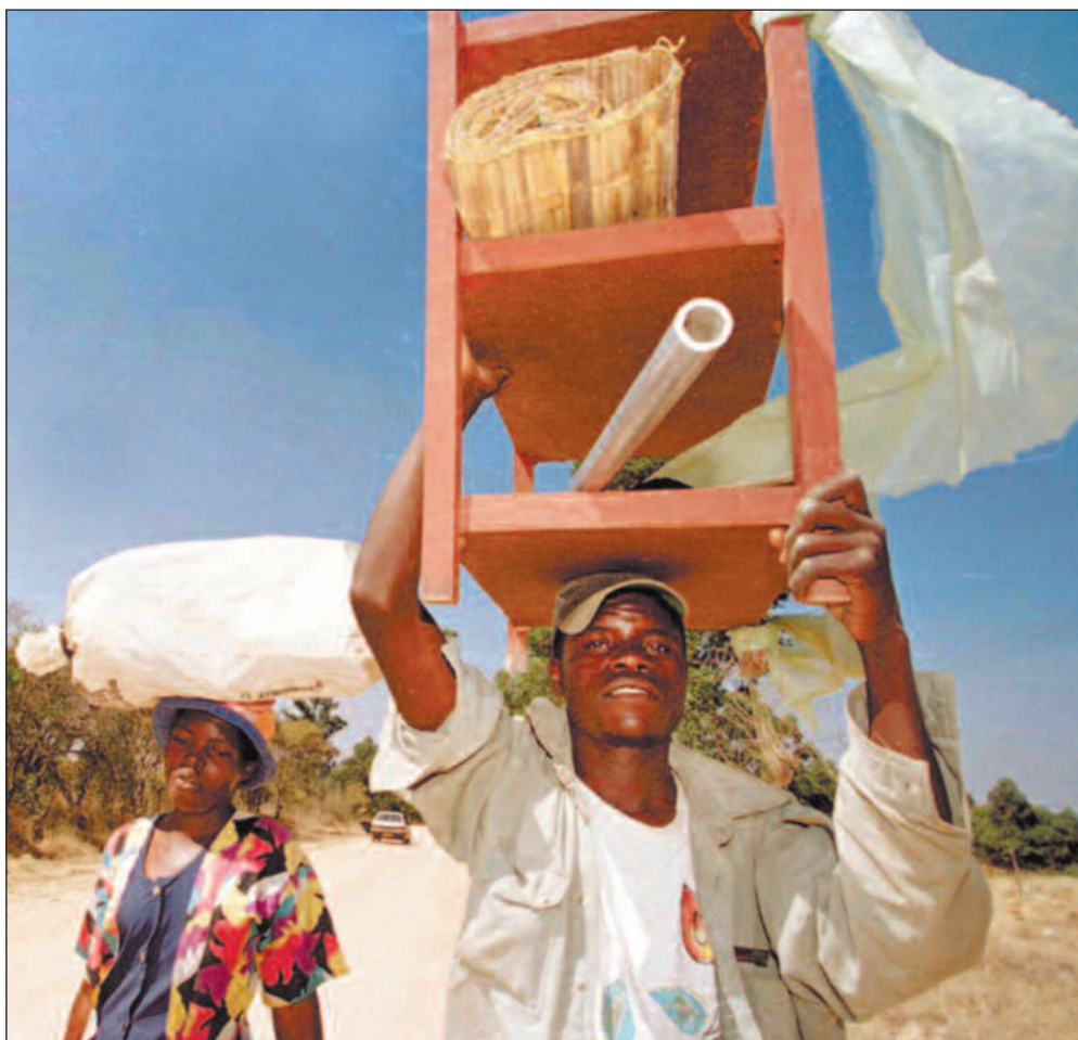
«Krigsveteranene» trapper opp sine aksjoner. Her ser vi landarbeidere ta med seg sine eiendeler og rømme fra en farm i øst-Mashonaland 24. august i år.