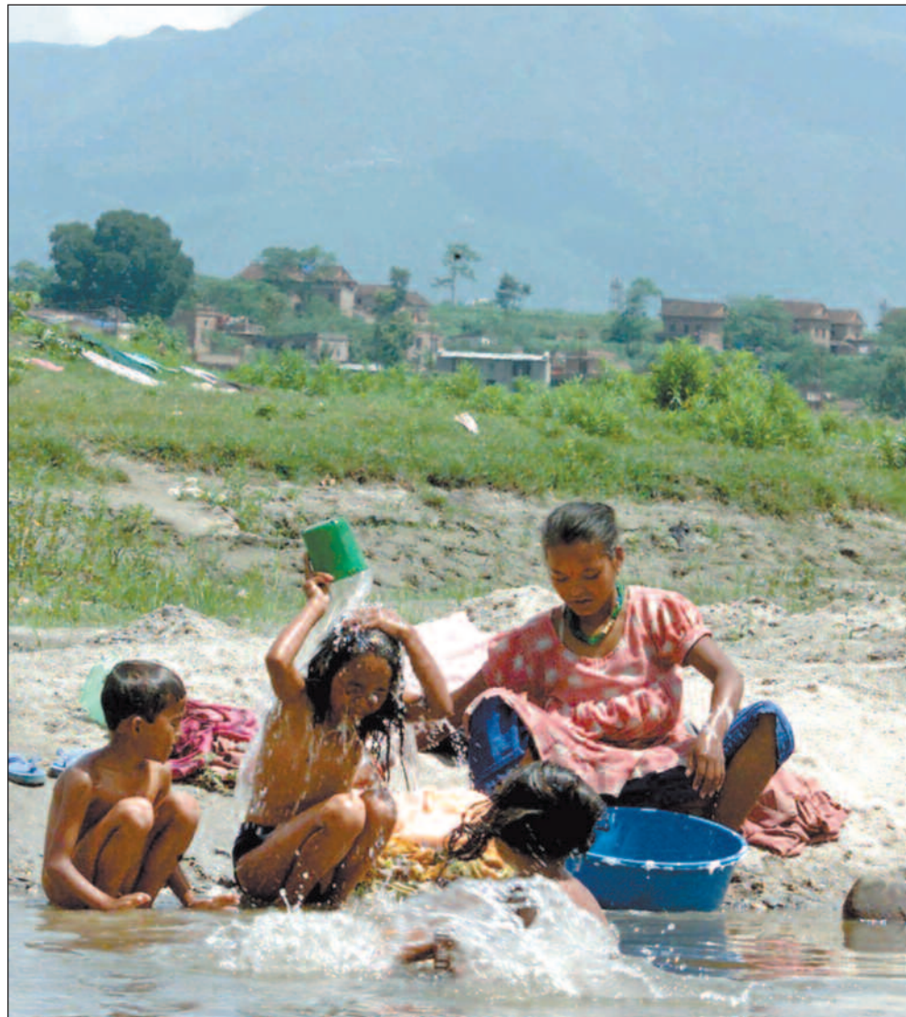
Nepalske landsbyboere tar seg et bad i en elv rett utenfor Katmandu. Forurenset vann har i en årrekke vært et alvorlig problem for folk i området.

Melamchi Water Supply Project fryktet at andre støttespillere skulle følge verdensbankens eksempel. Og i slutten av mars bestemte Verdensbanken seg for å stå utenfor MWSP,