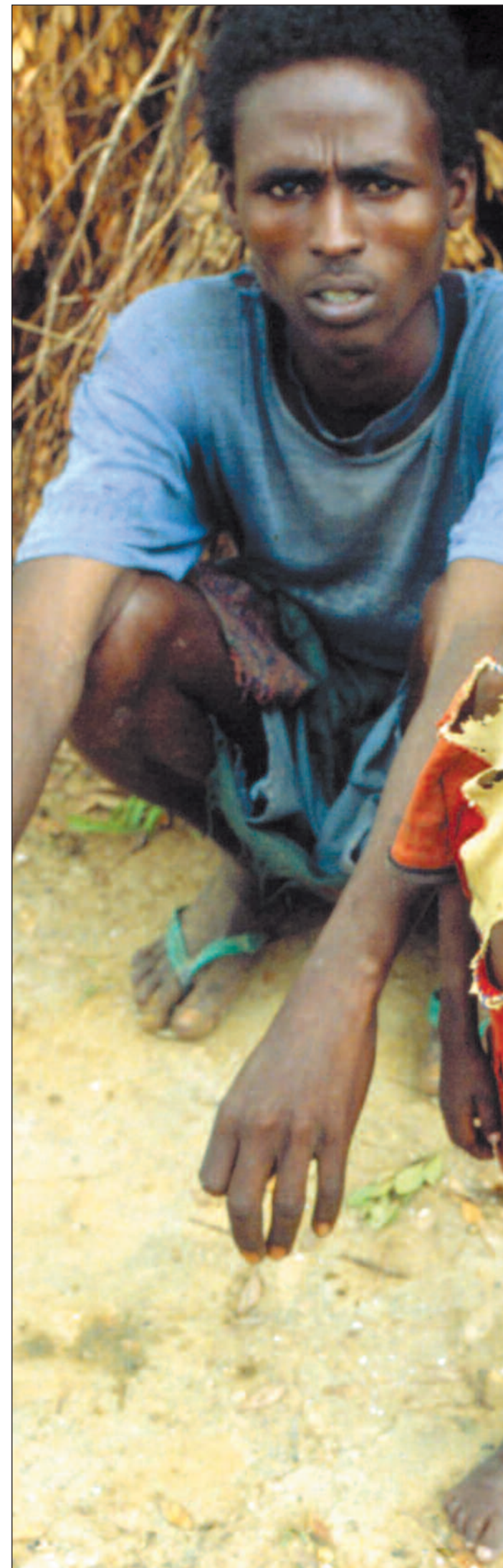
Kan bioteknologi gi Afrikas barn ernæring og bedre helse?

UNDP nevner problemene knyttet til slike produkter i bisetninger, for i ettertid å kunne si «det sa vi jo». – Vi ønsker at føre-var-prinsippet må ligge til grunn, og at man ikke skal ta i