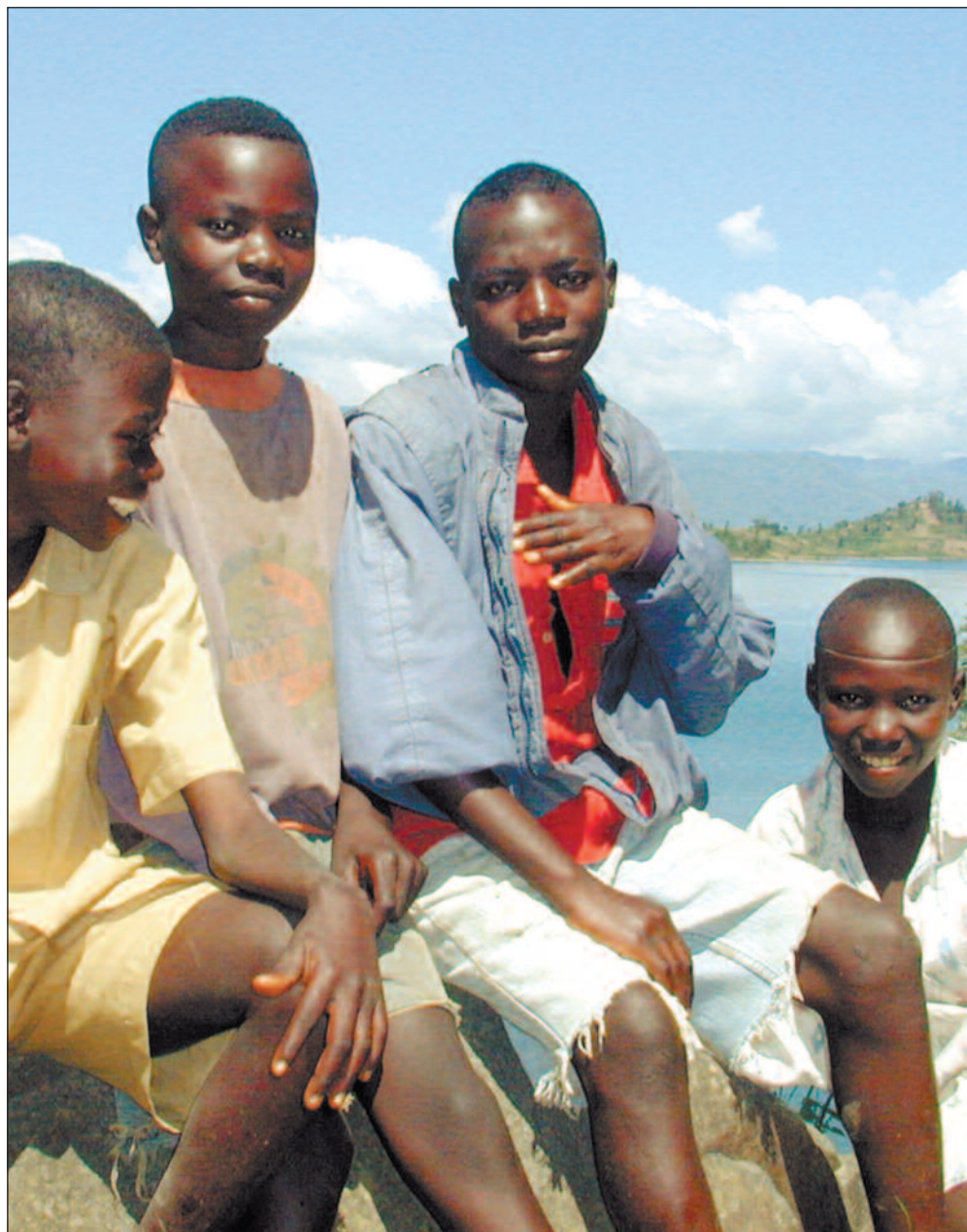
Regjeringen i Rwanda har bestemt seg for å gjøre sin plan for fattigdomsbekjempelse (PRSP) til en pakt mellom seg og folket, skriver artikkelforfatteren.