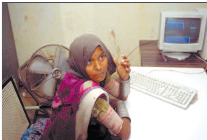
En av landsbyens unge kvinner får opplæring i bruken av pc'en.