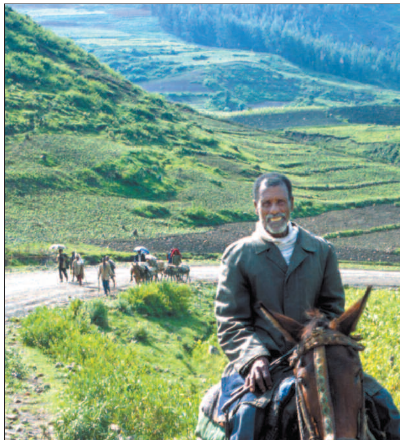
Kan bioteknologi gi større avlinger for Etiopias bønder?