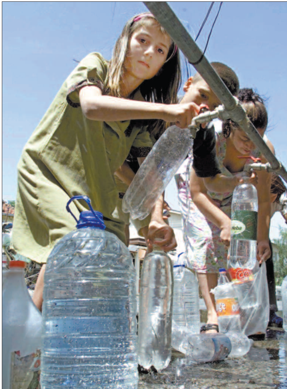
I en rekke land sørger UNICEF for å gi barn rent vann. Korrupsjonssaken skal ha kostet organisasjonen 30 millioner kroner i økte utgifter til vannforsyningsleveranser.

Ifølge UNICEFs regler skal anbud hentes inn fra minst tre leverandører, før man avgjør hvem som skal få kontrakten. Ved en rekke tilfeller skal 53-åringen, ifølge tiltalen, ha