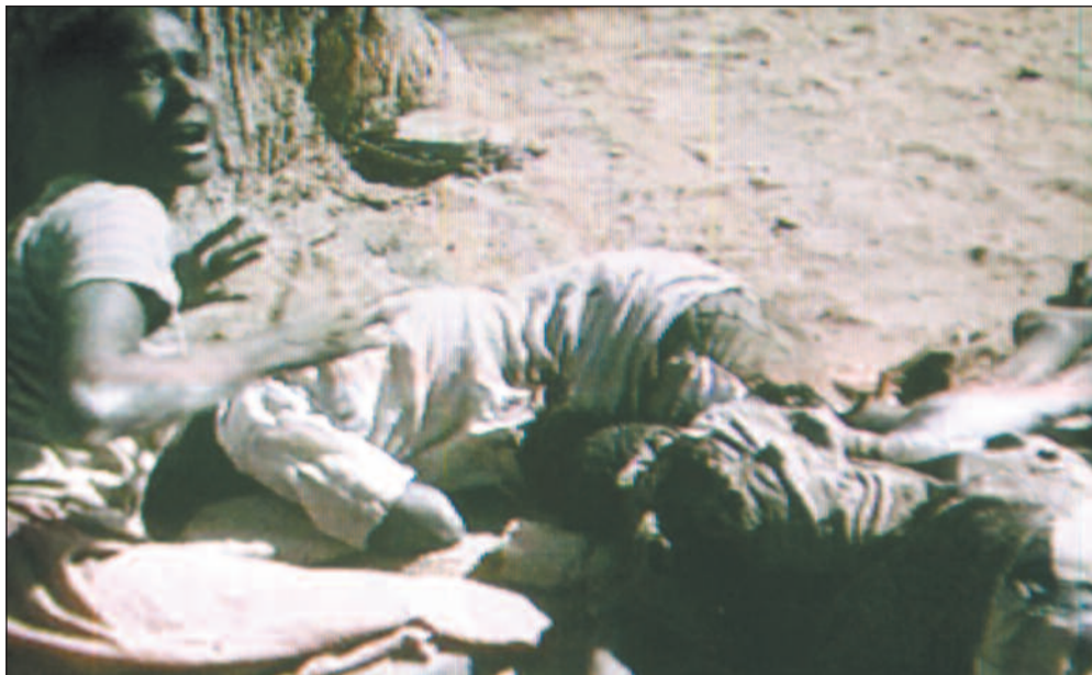
I februar i fjor slapp sudanske bombefly bomber over den lille landsbyen Kaouda i Sør-Sudan. To skolebarn ble drept i angrepet.

RAPPORTEN HAR vakt oppsikt i vårt naboland siden tidligere statsminister Carl Bildt innehar et styreverv i det svenske oljeselskapet Lundin Oil, et av de selskapene som kritiseres for sin medvirkning i oljevirkomheten i Sudan.