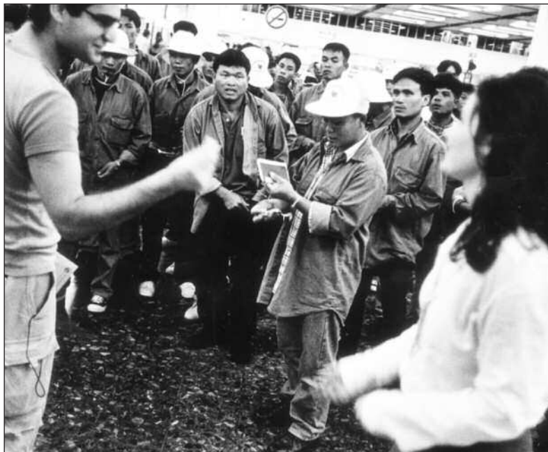
På Ben Gurion-flyplassen står thailandske gjestearbeidere i hundretall. De tar over jobbene til palestinerne.

opp med roten, som om israelerne vil kvitte seg med palestinerne ved å ta fra dem livsgrunnlaget.