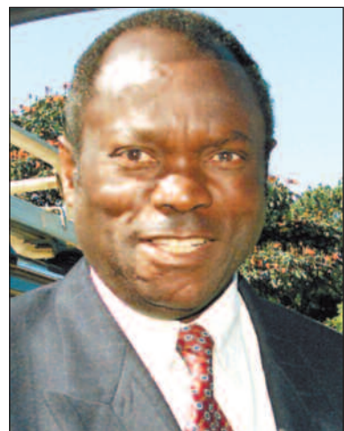
Tidligere visepresident Christon Tembo er blitt sparket ut av Chilubas parti fordi han ikke støtter forslaget om grunnlovsendring.

Visepresident Christon Tembo fikk beskjed om at politiet ikke kunne garantere sikkerheten hans hvis han gikk på møtet i sitt eget parti.