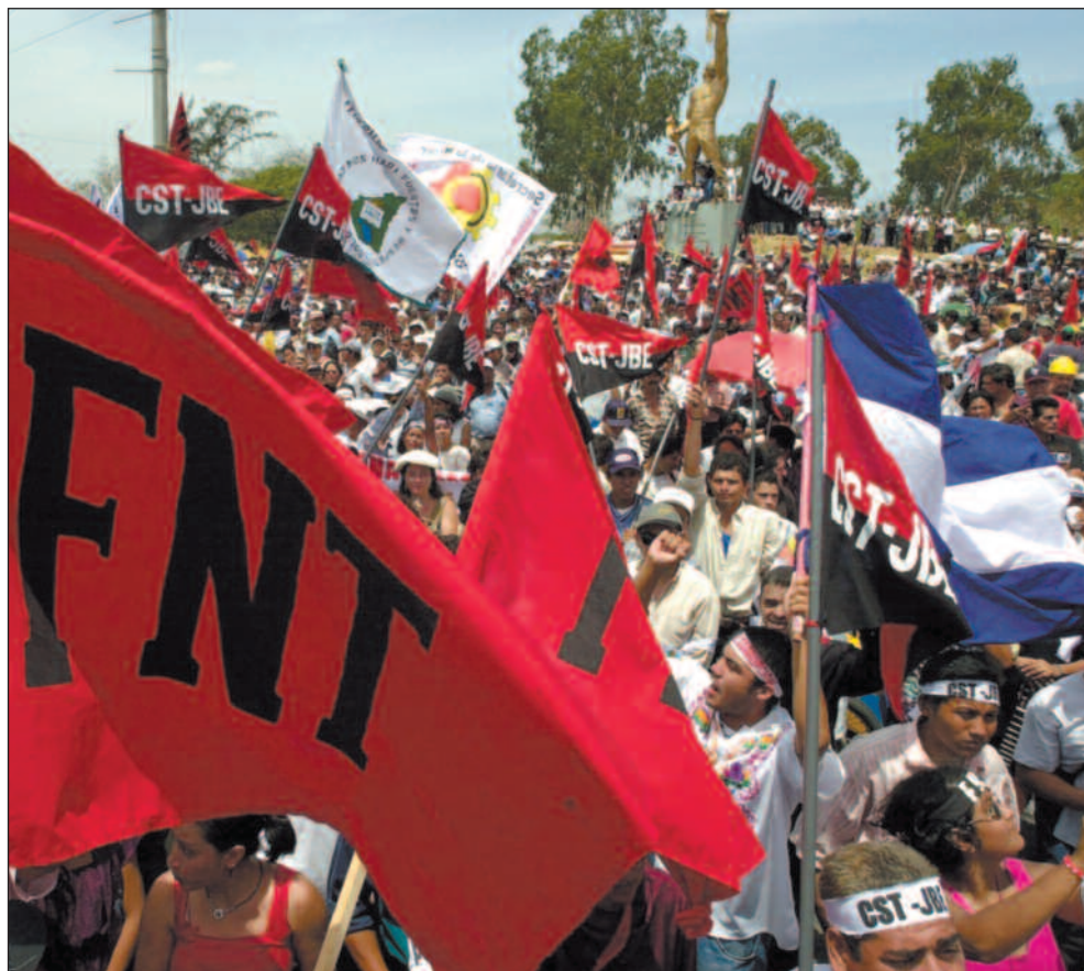
1. mai demonstrerte tusenvis av arbeidere i Nicaragua, der de krevde mer arbeid og mindre korrupsjon.

– Dersom man ikke aksepterer dette og tar risikoen, kan man like gjerne legge ned bistanden, mener Fjeldstad.