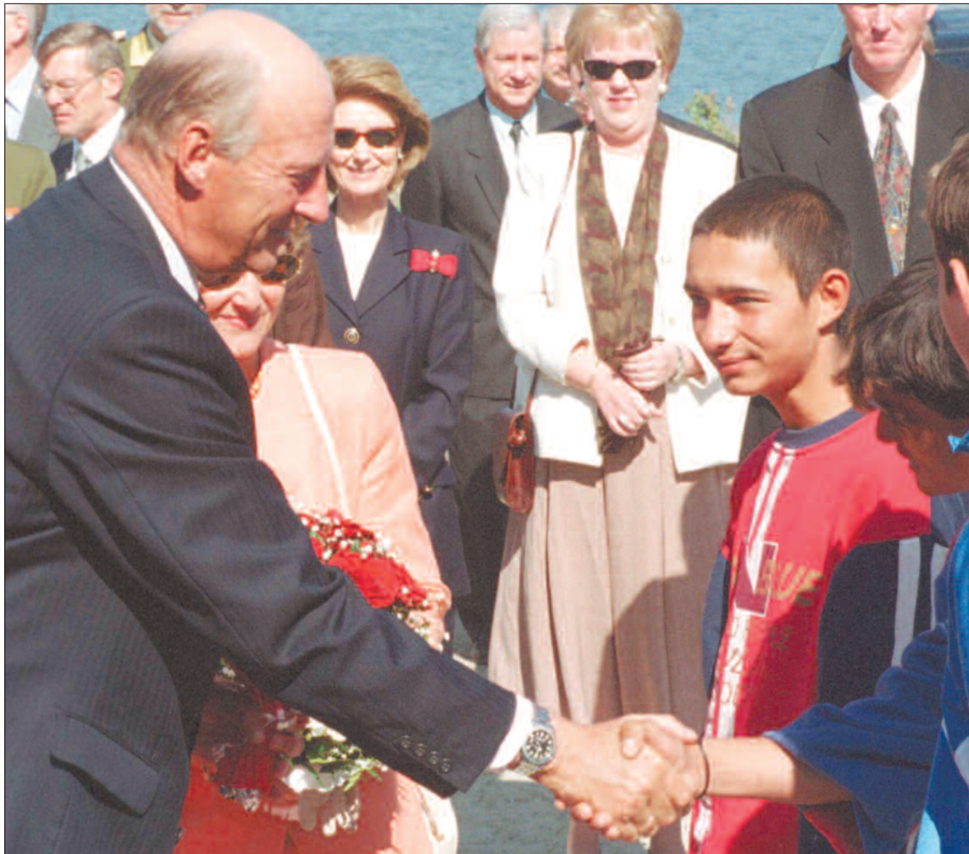
Kong Harald åpnet et rehabiliteringssenter for gatebarn i Romania høsten 1999. Lions club i Bergen har ansvaret for byggingen, mens Norsk Nødhjelp står for driften. Etter store byggeforsinkelser ble alle godkjennelser gitt rett før påske, og i dag bor det cirka 40 gutter på senteret.

- De første tre månedene i år, viser et lite overskudd, og det betyr at