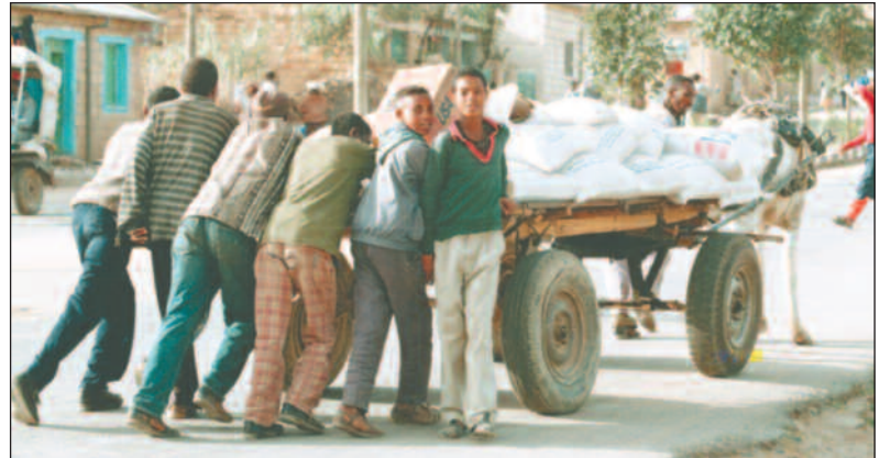
Flyktningene i Adigrat er helt avhengig av ukentlige matforsyninger fra FNs World Food Programme og USAID.

Lite bistand. - 25, er svaret når jeg spør den lokale UNICEF-lederen om hvor mange flyktninger som bor i