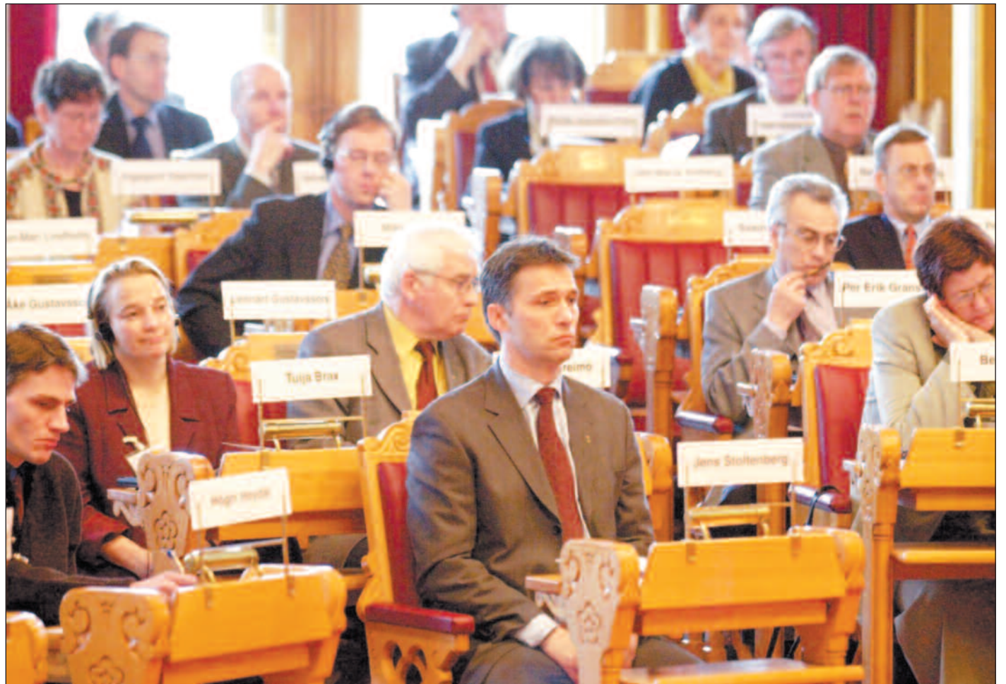
Til høsten åpnes det for at stortingspolitikere kan bevilge penger til sine egne partiers bistandsprosjekter.