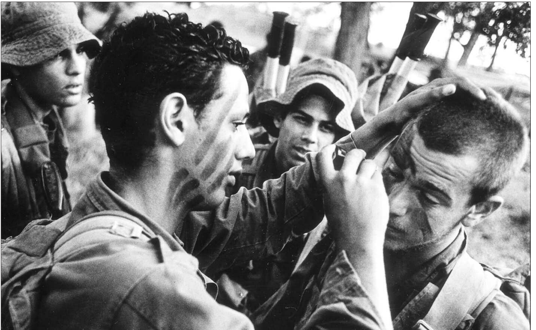
Israelske soldater, jøder fra det tidligere Sovjet, maler nattkamuflesje i ansiktene på hverandre. Mørket senker seg over vaktposten nær Be'er Sheva.