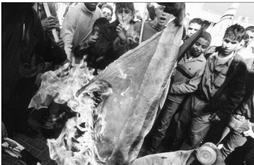
Gaza: Når vil palestinerne ikke lenger ønske å brenne det israelske flagget?