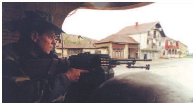
En serbisk politimann holder vakt i Lucane i Sør-Serbia.

Morten A. Strøksnes er journalist i avisen Morgenbladet og har flere opphold bak seg på Balkan.