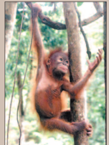
Miljøvernere i Indonesia er redde for at skogen forsvinner.

De lokale talentene som omfattes av programmet får tilbud om opplæring i regnskap, ledelse og forretningsdrift. Dessuten skal de tidligere ha mottatt og tilbakebetalt minst tre mikrofinanslån for å komme i betraktning.