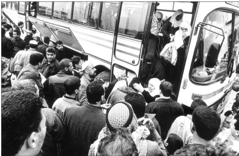
Foreldre til døde palestinske ungdommer, «martyrene», kommer tilbake fra pilgrimsreisen til Mekka.

De har i flere år samarbeidet om oppdrag i ulike deler av verden.