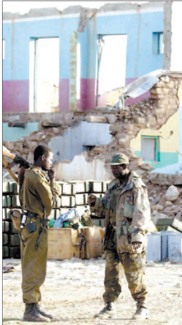
Etiopiske soldater kan konstatere at lite er tilbake etter eritreernes herjinger i byen Zalambessa i mai i fjor.

ADIGRAT (b-a): Krigen mellom Eritrea og Etiopia kostet enorme summer – i våpen, menneskelige lidelser og ødelagt infrastruktur. Verst gikk det ut over befolkningen i grenseområdene.