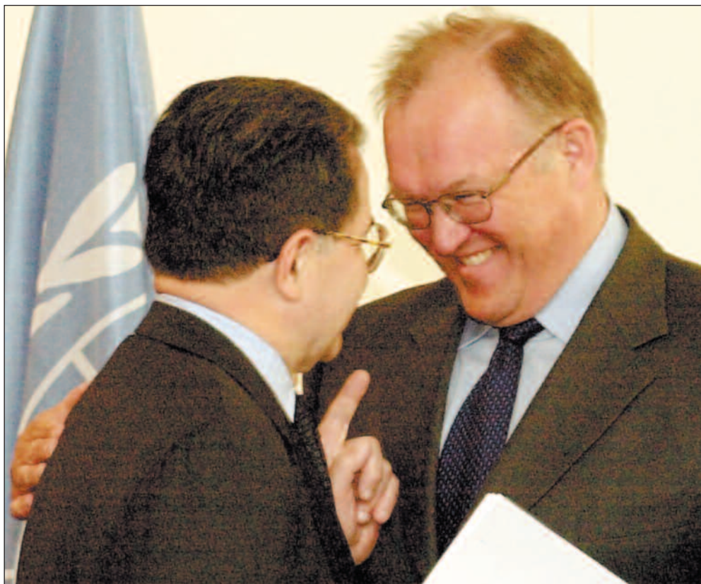
EU-kommisjonens president Romano Prodi og Sveriges statsminister Göran Persson fant tid til en liten passiar på FNs 3. konferanse om MUL-landene.

Korrupsjon. Et annet velkjent tema i det internasjonale utviklingsdebat-