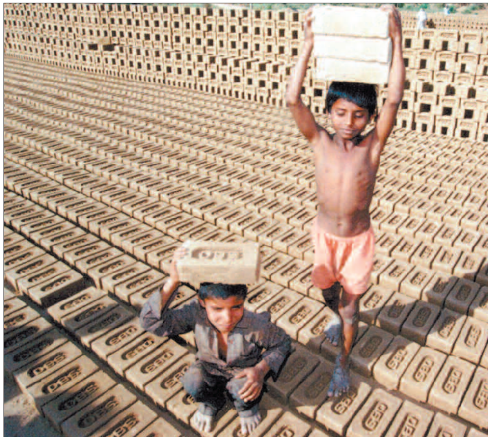
I India, verdens mest folkerike demokrati, er fattigdom og barnearbeid fortsatt utbredt. Men hvor stor innflytelse har landet på avgjørelser som tas i Verdensbanken og IMF?

Ingen er mot at man praktiserer åpenhet og bestreber seg på «legitimitet», hva som nå måtte menes med det i denne sammenheng. Men er hensyn til legitimitet og åpenhet i forhold til de utestengte avgjørende kriterier for hva et demokrati