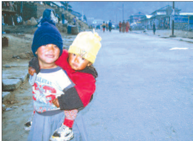
Nepals barn er blant de mest underernærte i hele Sør-Asia. Nesten en av tre får heller ikke gå på skole.