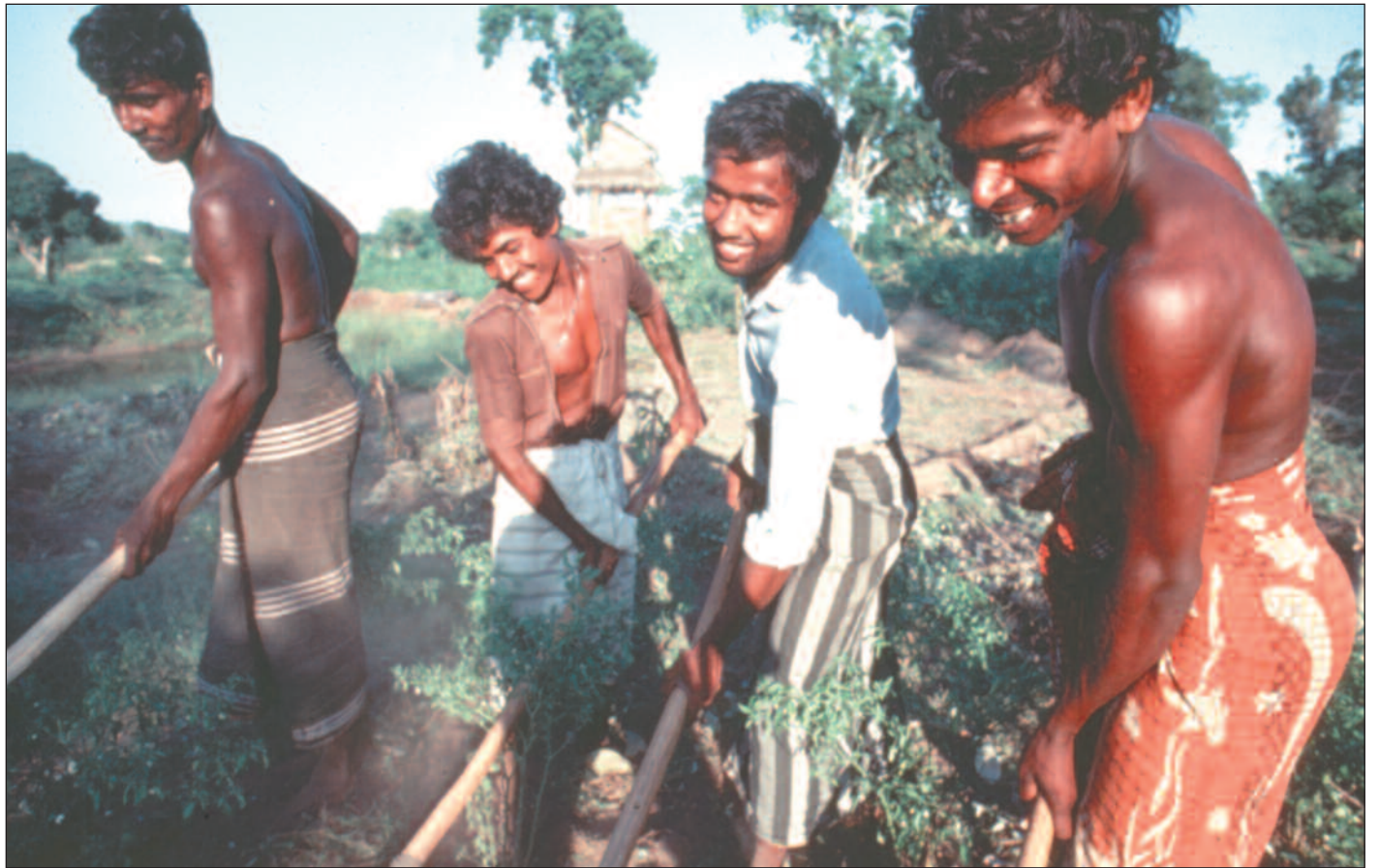
Det er vanskelig å påvise god utviklingseffekt av små, spredte bistandsprosjekter, mener myndighetene. Her et jordbruksprosjekt på Sri Lanka.

■ Innenfor den langsiktige bilaterale bistanden er hovedregelen i dag at NORAD finansierer 80 prosent av organisasjonenes prosjekter og programmer. Ved støtte til nødhjelpsoperasjoner dekker Utenriksdepartementet 100 prosent.