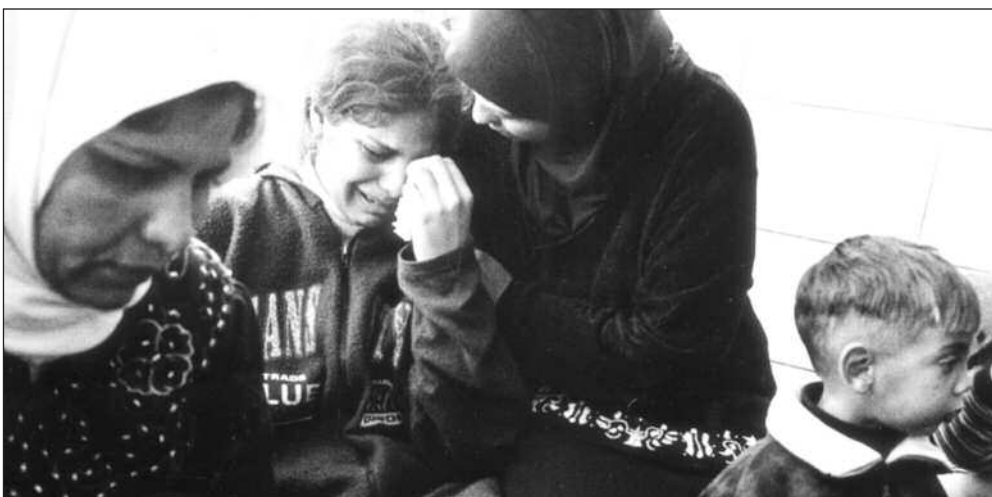
Ramallah, Vestbredden: Mor og datter gråter over sin 11 år gamle sønn og bror som ble skutt gjennom vinduet mens han lekte på rommet sitt.

Forklaringen er at israelerne vil ha en 300 meters sikkerhetssone på hver side av veiene som brukes av de sivile, jødiske bosetterne, men det ligger noe mer i det, noe symbolsk: det er noe endelig over å rive trær