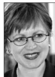
Utviklingsminister Anne Kristin Sydnes

Man kan jo se for seg et samarbeid mellom flere norske partier, som går sammen om å utveksle erfaringer med politikere i andre land.