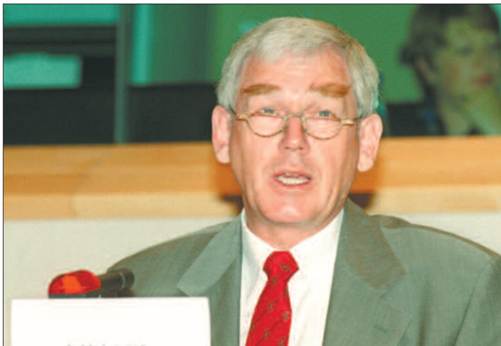
Poul Nielson, EUs bistandskommisær, har fått fortgang i EUs bistandsbyråkrati.