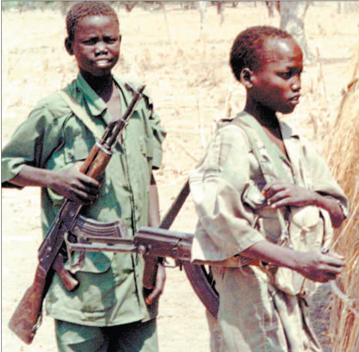
Barnesoldater fra opprørshæren SPLA holder vakt over militære utposter i Sør-Sudan. SPLA-styrkene forsøker å overta kontrollen over oljefeltene i sør.

– Oljen sikrer Khartoum-regimets krigsutgifter, sier Sudan-ekspert