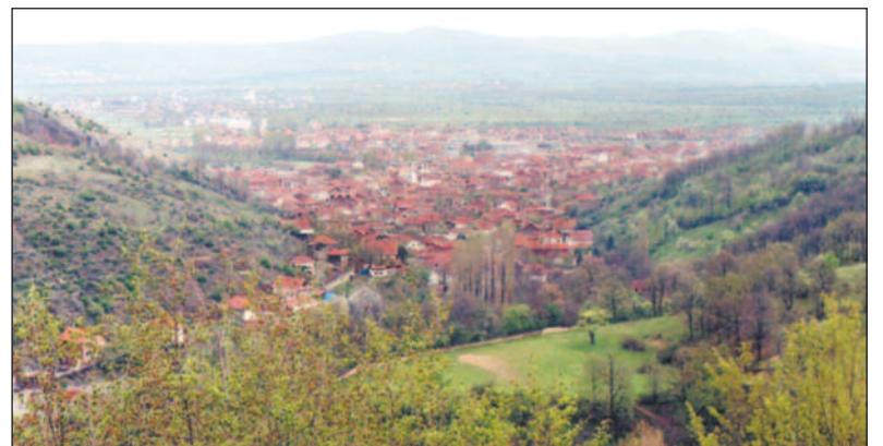
3. april innledet Norge sin bistand til Sør-Serbia. Presovo, den albanske «hovedstaden» i Sør-Serbia, er blant de byer som nyter godt av bistanden fra det norske Utenriksdepartementet.

Paradoksalt nok anser albanske nasjonalister det ikke som en fordel at Milosevic er bak lås og slå i Beograd.