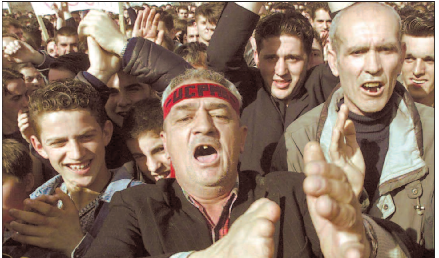
En etnisk albaner – med UCPMBs pannebånd – applauderer under en protest mot jugoslaviske sikkerhetsstyrker i byen Presovo.

USAs nyttige verktøy. UCK i Kosovo anses som kilden til urolighetene i Sør-Serbia og Makedonia, og KFOR-styrkene har ikke greid å avvæpne UCK eller å hindre geriljaens bevegelser over grensene til nabolandene. Ikke nok med det; mange journalister og etterretningseksperter hevder at USA i starten ikke bare overså UCPMBs oppbygning, men at amerikanske eksperter gav geriljaen