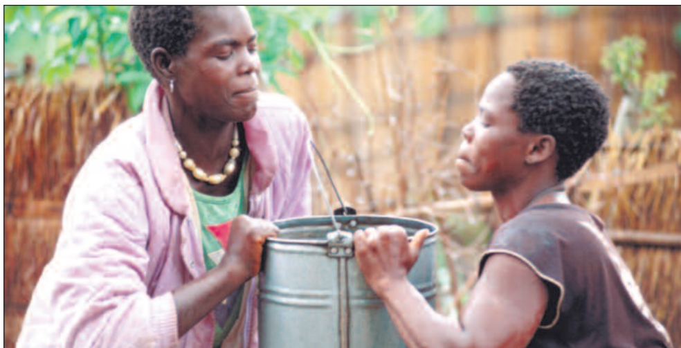
Det er naturlig for afrikanere å hjelpe hverandre, men det er flere trusler mot de tette sosiale nettverkene.

Temaet for min sak forrige gang var en sammenlikning av livet mitt i Blantyre i Malawi og en stor europeisk by, der jeg nylig bodde og studerte. Mitt poeng var å få fram de kvaliteter jeg hadde i livet mitt i Blantyre, som jeg mistet da jeg flyttet til Europa og havnet nederst på alle rangstiger, sammen med andre utlendinger fra utviklingsland. Mens jeg hjemme i Afrika kunne la lysten bestemme om jeg ville ha ett eller to egg til frokost og kjøtt eller fisk til middag, har jeg i Europa måttet presse både frokost, lunsj og middag ut av en pakke cornflakes.