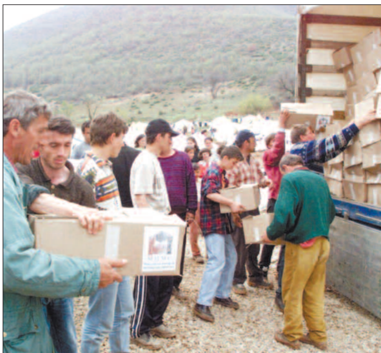
Mye penger gikk til nødhjelp da Kosovokonflikten eksploderte. Krigen i det tidligere Jugoslavia har brakt Serbia og Montenegro til topps i bistandsstatistikken.

For Somalia har for eksempel 134 millioner kroner av totalt 177 millioner gått til flyktningmottak i Norge, via Kommunal- og regionaldepartementet. Tilsvarende tall for Irak er 91 og 123 millioner.