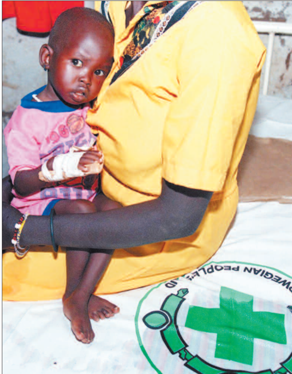
Norsk Folkehjelp driver flere sykehus i Sør-Sudan, i nært samarbeid med SPLA-geriljaen som kjemper for selvstyre. I fjor ga organisasjonens satsing i landet et minus i regnskapet på 3,5 millioner kroner.

Det er et godt spørsmål. I en slik situasjon er det kontantstrømmen som rammes. Overføringene fra NORAD og UD er størst i første halvår, og i mellomtiden håper vi å få løst noen av problemene. Men det er spesielt fjerde kvartal som kan bli særlig problematisk i så måte.