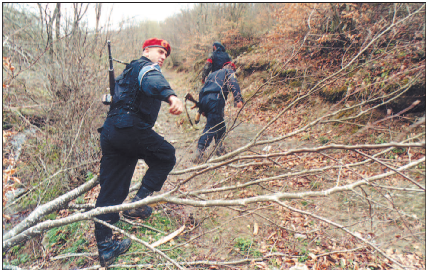
I løpet av de siste 18 månedene har UCPMB-soldatene befestet seg i sikkerhetssonen, blant annet ved å bygge opp våpenlagre og etablere stillinger.