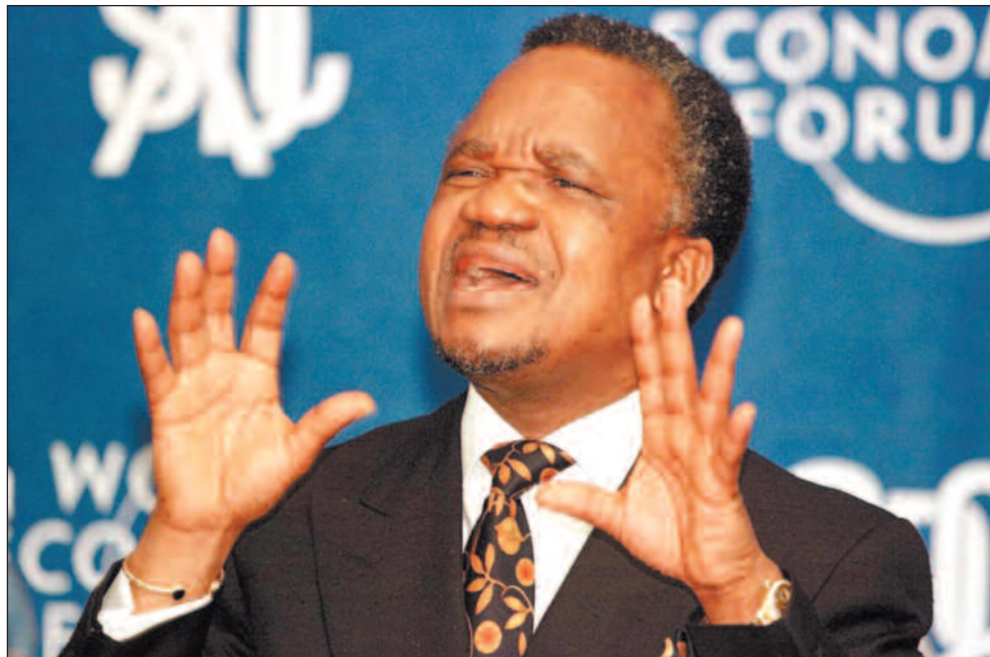
Er Zambias president Frederick Chiluba oppriktig når han sier han vil gå av?