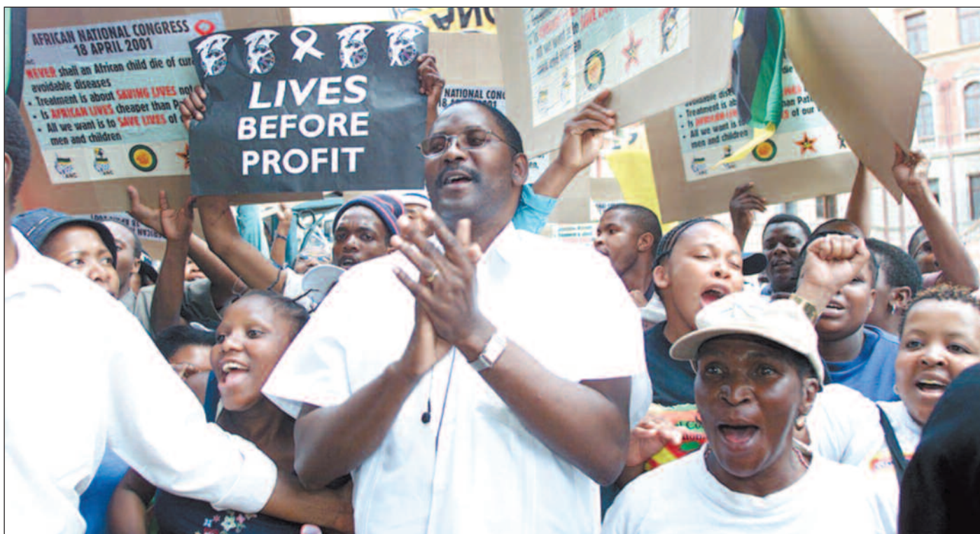
Rasende demonstranter foran Høyesterett i Pretoria sier sin mening til den internasjonale legemiddelindustrien. Den 18. april i år trakk legemiddelselskapene søksmålet mot Sør-Afrika.

I Vesten har den gode tilgjengeligheten på medisiner bidratt til å holde aidstilfellene på et lavt nivå. De fleste hivpositive europeere får medisiner gratis gjennom nasjonale helsemyndigheters velferdstiltak. I Afrika, der verdens fattigste men-