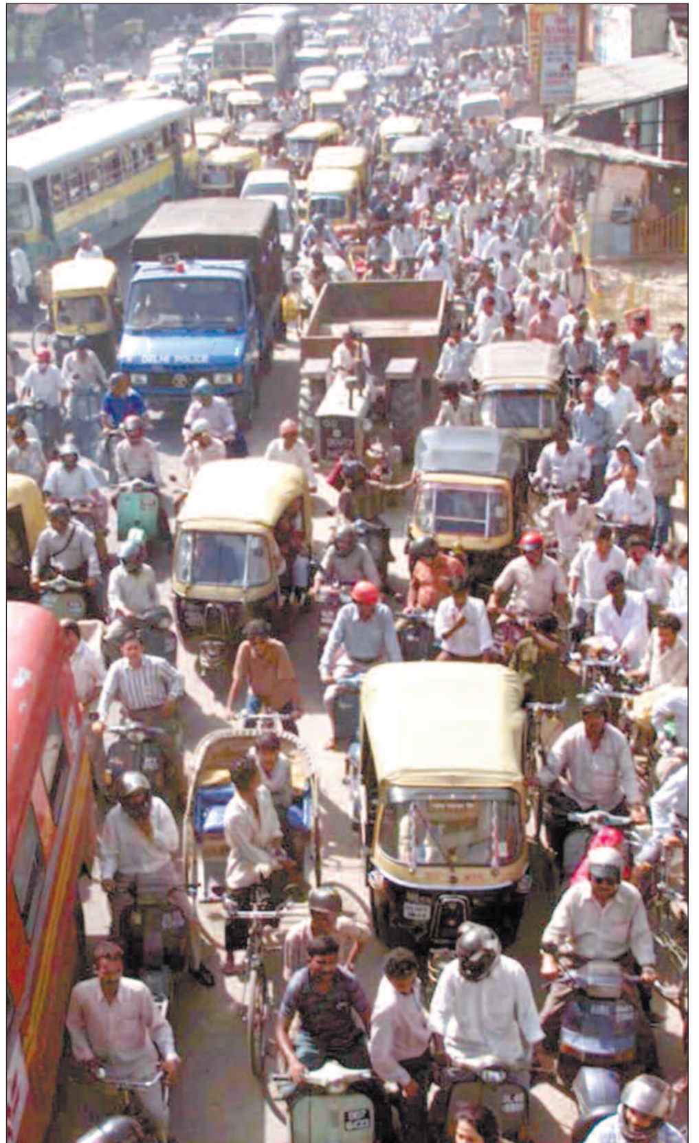
I 1995-99 gikk 40 prosent av bevilgningene til prosjekter i Asia.

– Ja, og det vil vi vurdere grundig. Integrering er det viktigste, men det kan likevel være lurt å opprettholde en særbevilgning som kan flagge miljøprofilen ekstra.