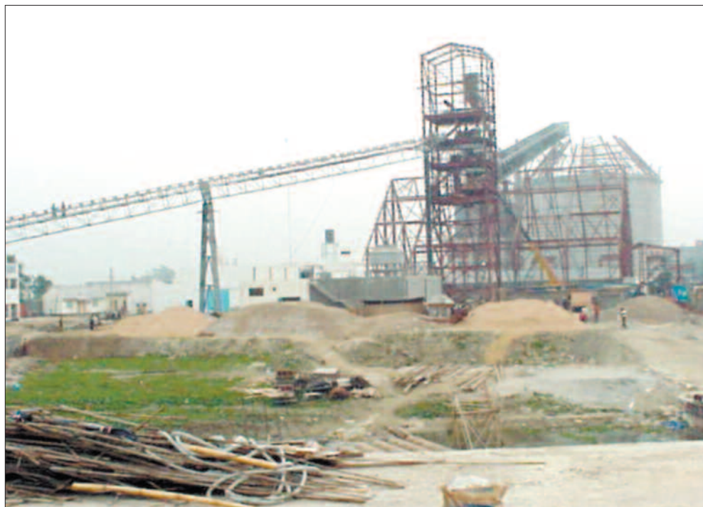
Like utenfor Dhaka i Bangladesh investerer Norfund i en sementfabrikk, som skal være ferdig til sommeren. Her er klinkersiloen under bygging, og bak den vil sementmølla og pakkeriet være.

– Ikke på det tekniske, faglige området. Det er Scancem som har