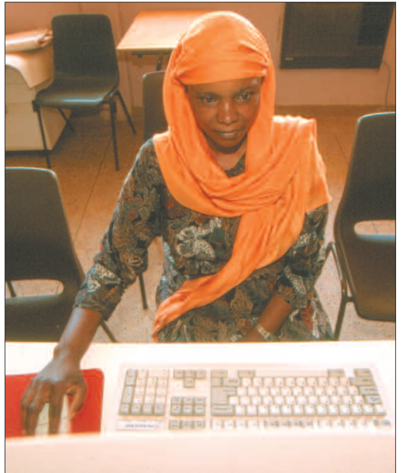
Bistandsbransjen har et enormt potensial i forhold til å utvikle nye og mer innovative arbeidsmåter, mener artikkelforfatteren.

Norske bistandsaktører har kompensert for manglende sosiokulturell innsikt ved å utvikle unødige sinnrike rutiner, systemer, planer, osv.