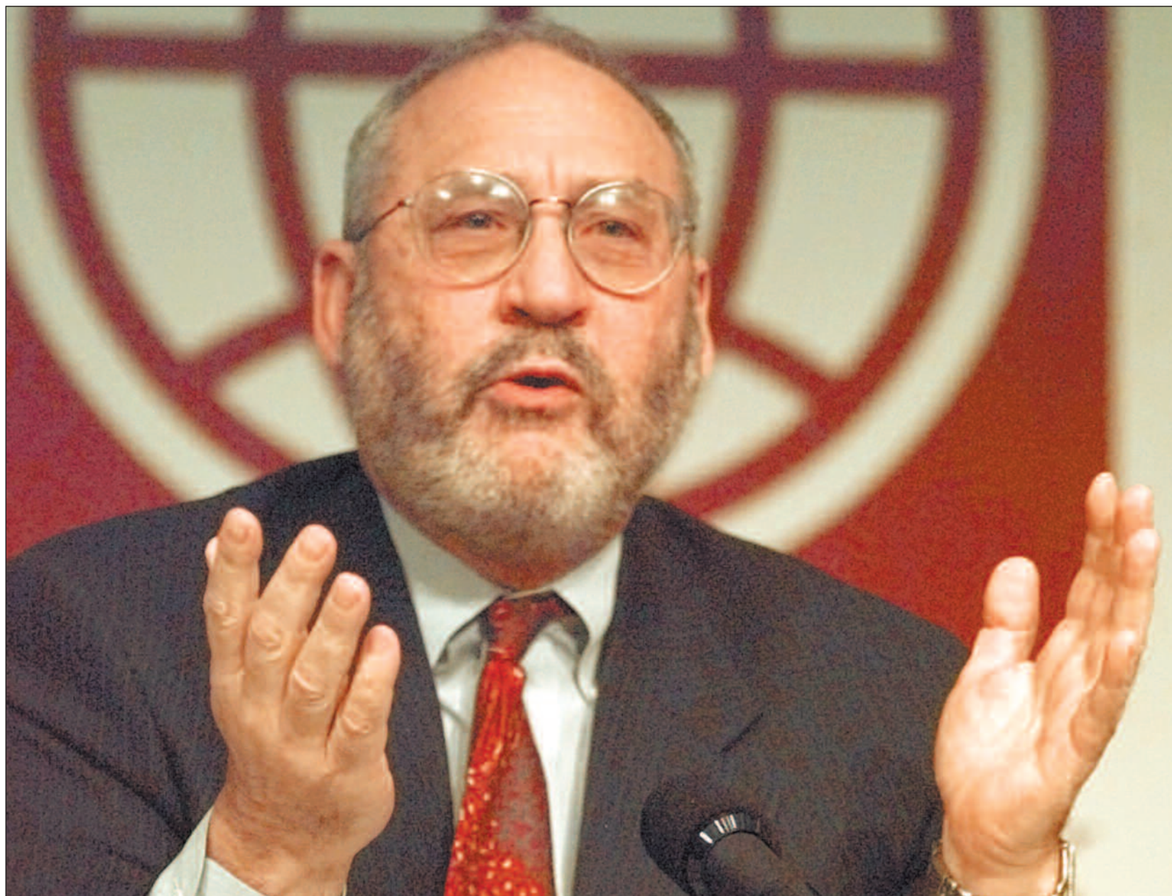
Eks-sjeføkonom i Verdensbanken Joseph Stiglitz frykter at mange fattige land ikke tør å si hva de egentlig mener om «gale diagnoser» og «feil medisin».