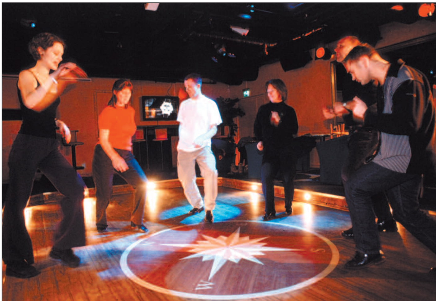
Aker Brygge er åstedet når danseglade osloborgere skal «danse inn» penger til havskilpadder og latriner i Mellom-Amerika.

– Vi har gode kontakter gjennom tidligere solidaritetsarbeid som vi ønsker å benytte oss av. Vi valgte en organisasjon som heter CESTA, fordi den støtter lokale initiativ til økolo-