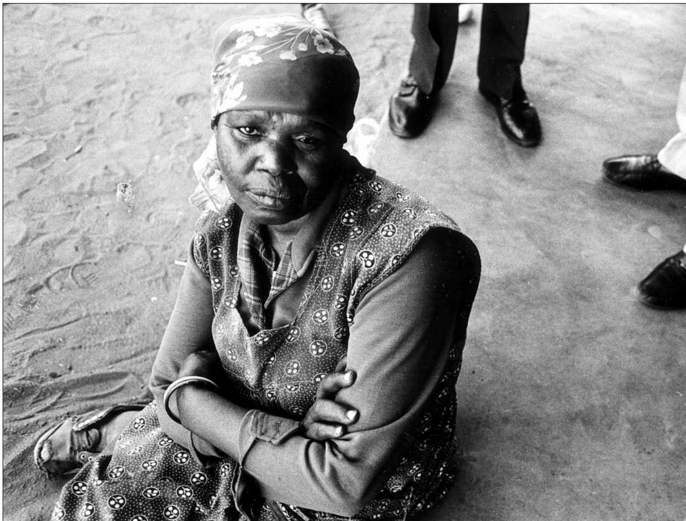
Verdsbanken sin nye fattigdomsstudie legg sterk vekt på individuell oppleving av fattigdom. Likevel legg ikkje Banken menneskerettane til grunn for sine strategiar for fattigdomsreduksjon. Dette er ein viktig veikskap ved studien, meiner artikkelforfattaren.