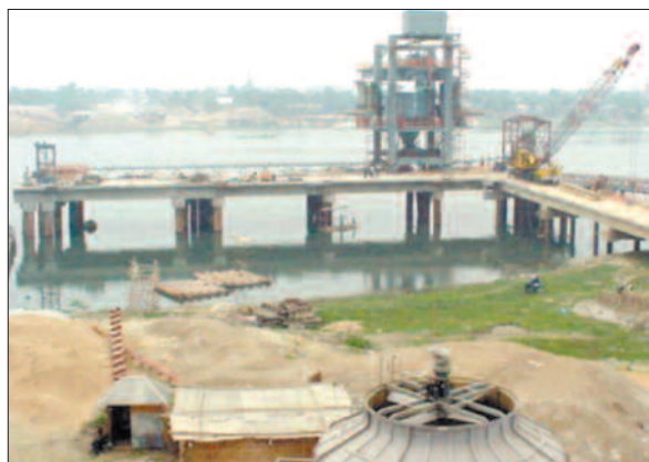
Bildet viser kaianlegget som bygges som en del av sementfabrikken utenfor Dhaka. Til kaianlegget vil det komme båter som frakter klinker fra Chittagong, og båter som frakter sement fra fabrikk til Dhakamarkedet.