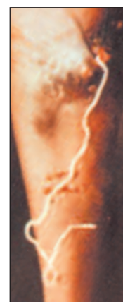
Det kan se grotesk ut – og volder store smerter – når en guineaorm er på vei ut av kroppen.