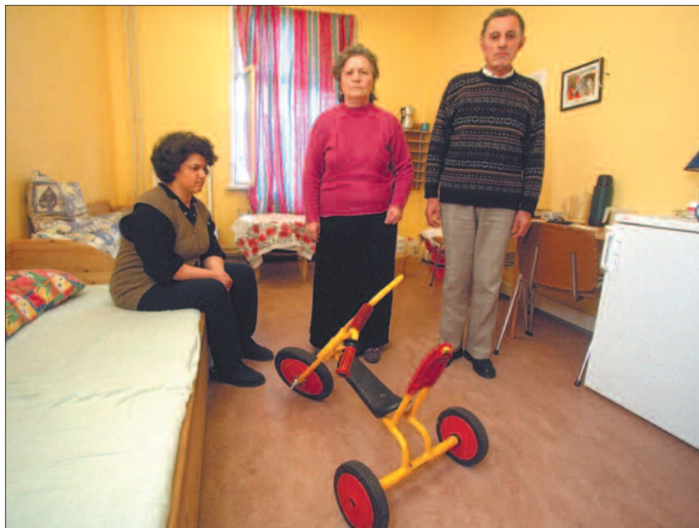
De europeiske giverlandene er uenige om mottak av flyktninger i eget land skal regnes som utviklingshjelp. På grunn av strømmen av flyktninger fra Kosovo i 1999 gikk en større andel av blant annet Norges totale utviklingshjelp til flyktingmottak i Norge.

Forskerne bak rapporten forkastet disse to alternativene, og mener det tredje, der noen spesifiserte utgifter inkluderes, er det beste.