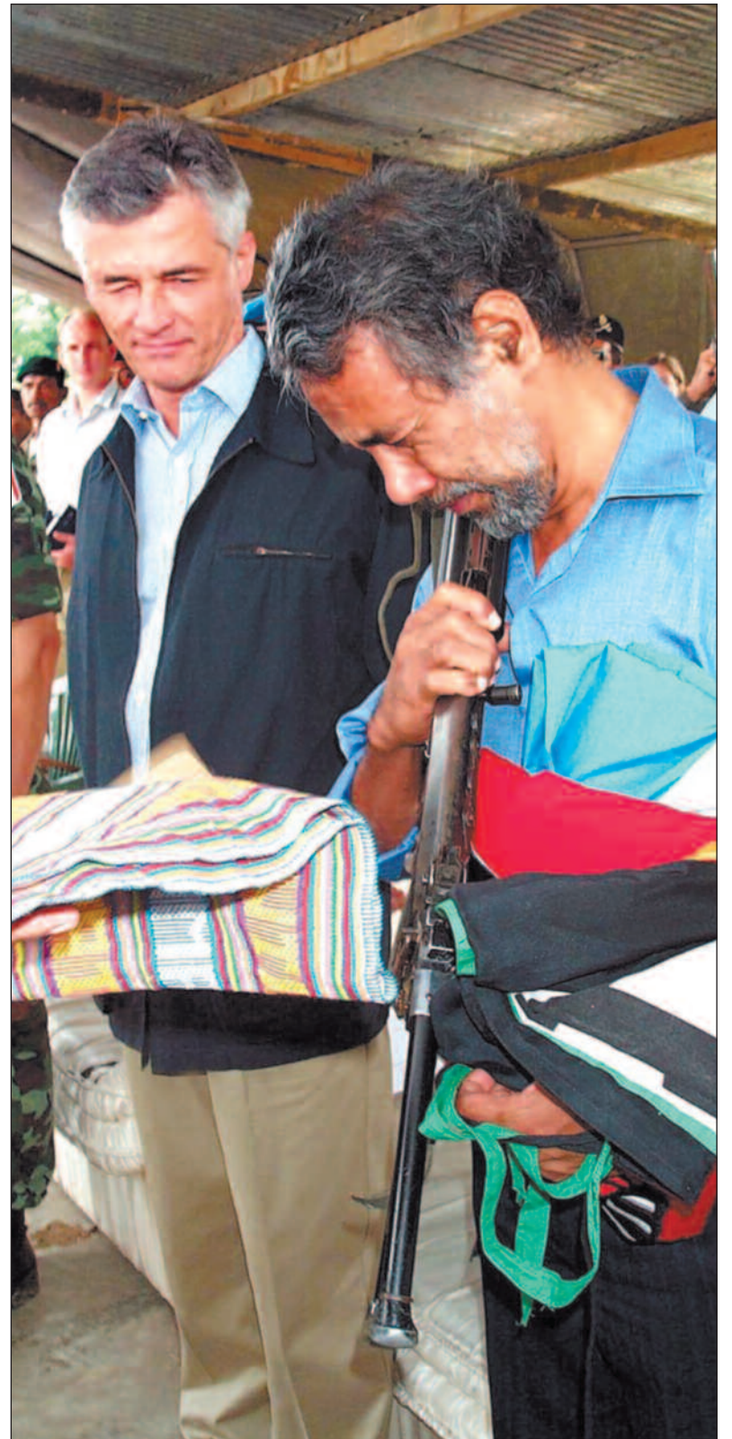
Falintils kommandant Xanana Gusmao gråter under en seremoni i Øst-Timor 1. februar i år, der frigjøringshæren erklæres som Øst-Timors nye offisielle hær.

Sergio Vieira de Mello, leder for UNTAET – FN-administrasjonen på Øst-Timor.