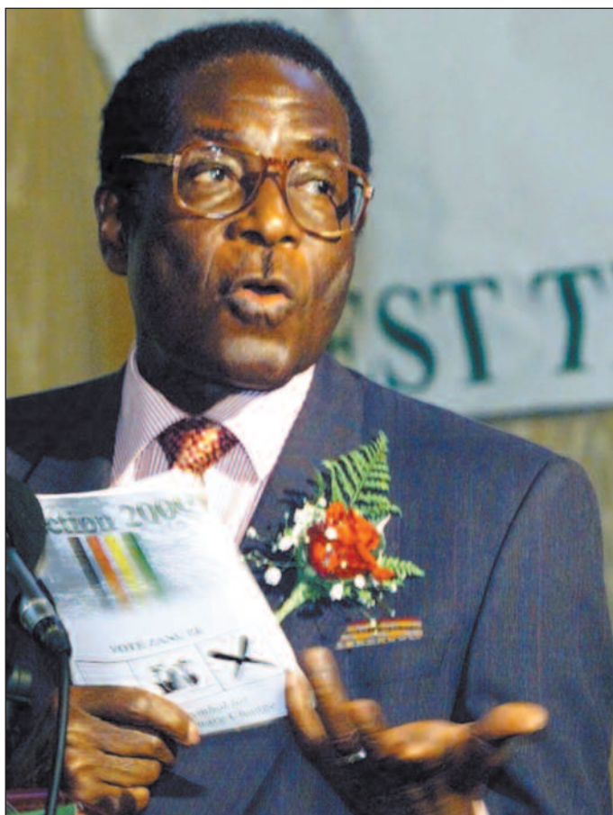
76-årige Robert Mugabe tvholder på makten i Zimbabwe.