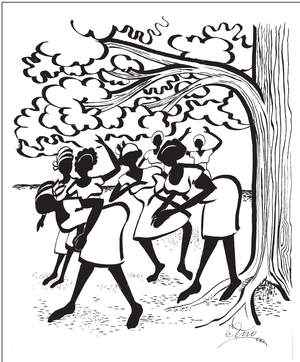
«Kvinnene fortsatte sin sang og dans, uanfektet av mirakelet som kjølte ned den brennhete og knusktørre leirjorden»

Selv når regnet slo over oss som en foss fortsatte de.