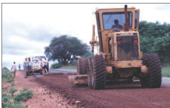
Fagpersoner i utviklingslandene vil oftest velge vestlig teknologi framfor lokale småbønder med hakker og spader.