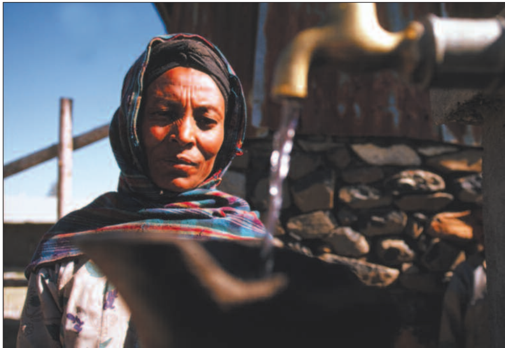
Helsen til flere hundre millioner mennesker verden over er truet av forurenset drikkevann. De aller fattigst er som oftest mest utsatt.

Store tall. Ikke nok med at grunnvannsressursene pumpes opp altfor raskt i mange land. De livsviktige vannkildene forurenses av plantevernmidler og en serie andre kjemikalier. Dette har pågått i flere tiår, og DDT-rester, nitrat og tungmetaller har spredt seg over store områ-