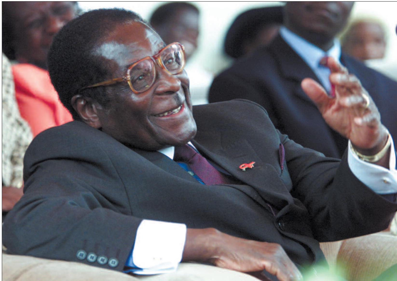
Robert Mugabe styrer videre, men er tydelig desperat. Ingen vet om han vil lykkes med å holde seg ved makten.