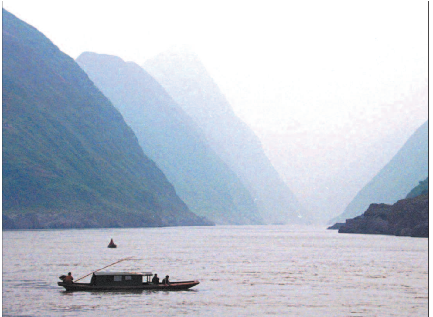
Store infrastrukturprosjekter krever ofte betydelige inngrep i naturen. Damprosjektet «Tre kløfter» på den vakre Yangtze-elva, som Verdensbanken trakk seg ut av i 1997, er et eksempel på det.

Finnene står på. Verken Norge, Sverige eller Danmark har den mektige stormakten i øst blant sine «ti på topp-bistandsland». Finland derimot har Kina på annenplass med om lag 136 millioner kroner i 1998. At Kina kommer så høyt opp på den