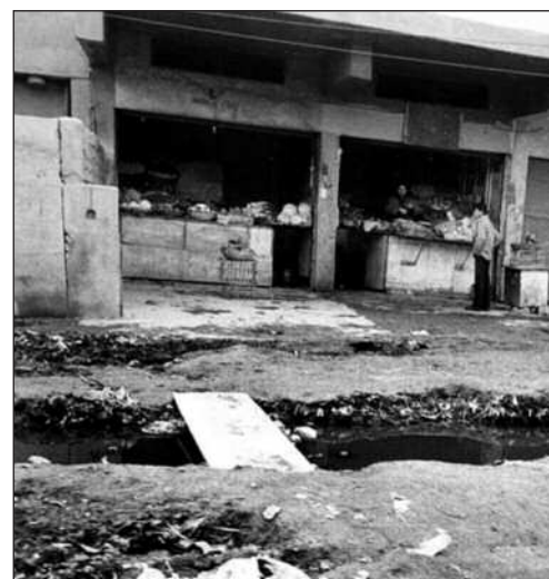
I bydelen Kamalya i Bagdad er kloakksystemet brukt av Care International.

På høyde med Europa. Mesteparten av Iraks infrastruktur ble skapt av oljepenger på 70-tallet. En storstilt utbygging med den beste teknologien og den beste arbeidskraften fra Europa, førte til at landet hadde hygieniske og sanitære forhold på høyde med mange europeiske land. Det var før Gulfkrigen brøt ut. Sanksjonene hindrer imidlertid landet i å