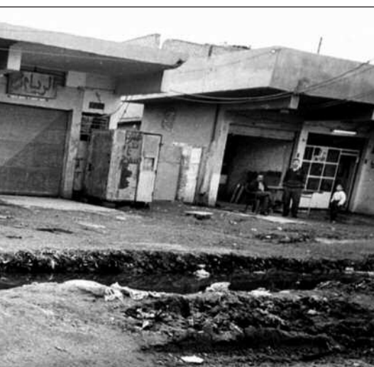
Alt sammen. Rehabiliteringen av kloakkrørene gjøres av

har skiftet karakter. Det eskalerende sammenbruddet i infrastrukturen, inkludert helsevesen og strømleveranser, kan utløse en mye større humanitær katastrofe enn matmangelen førte til de første årene av sanksjonene.