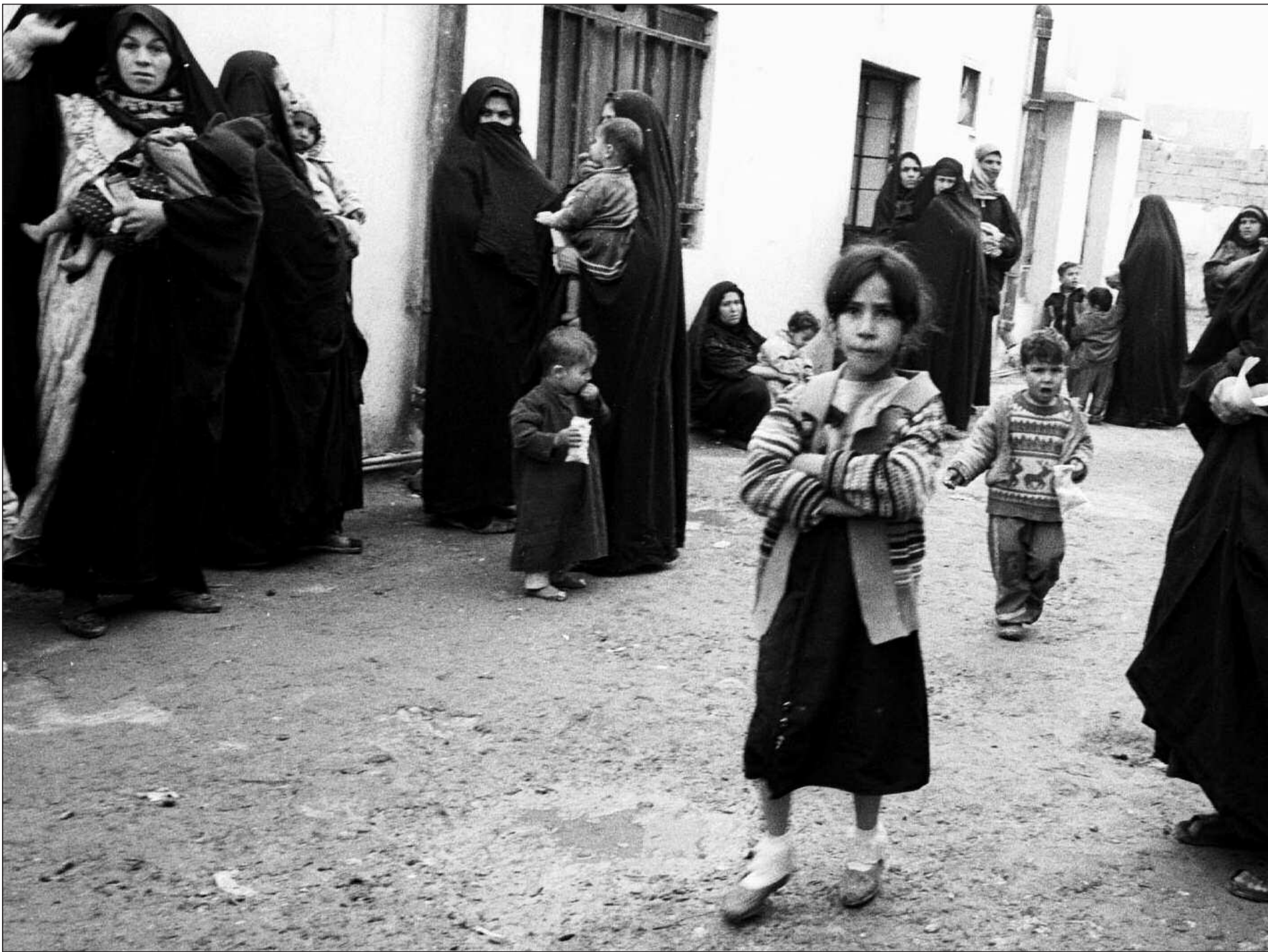
Helsesentrene merker følgene av krise og befolkningsvekst: antallet pasienter er fordoblet og fattigdomssykdommene brer seg.