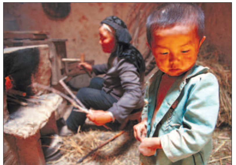
Fattigdommen er fortsatt stor i deler av den kinesiske landsbygda, men bistanden er i liten grad rettet inn mot bondebefolkningen.

Miljøtiltak og næringslivssamarbeid har stått sentralt i norsk bistand til Kina de siste årene.