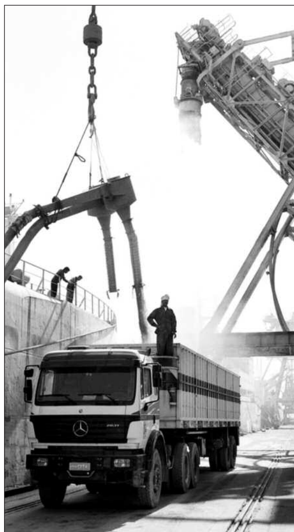
Avhengigheten av maten som kommer inn til havnen i Bagdad er stor. 70 prosent av maten som konsumeres i Irak påstås å komme fra utlandet.

havet. Irak er så stort at myndighetene ikke kan forvente at vi kan løse alle problemene, sier sjef for ICRCs kontor i Irak, Beat Schweizer.