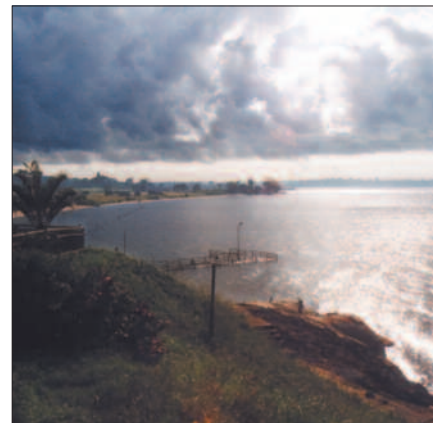
Omlag 25 prosent av den totale fangst av ferskvannsfisk i Afrika kommer fra Victoriasjøen.

• Det er klare indikasjoner på at det drives overfiske av bestanden i innsjøen og den gjennomsnittlige størrelse på fisken er blitt stadig mindre med årene.