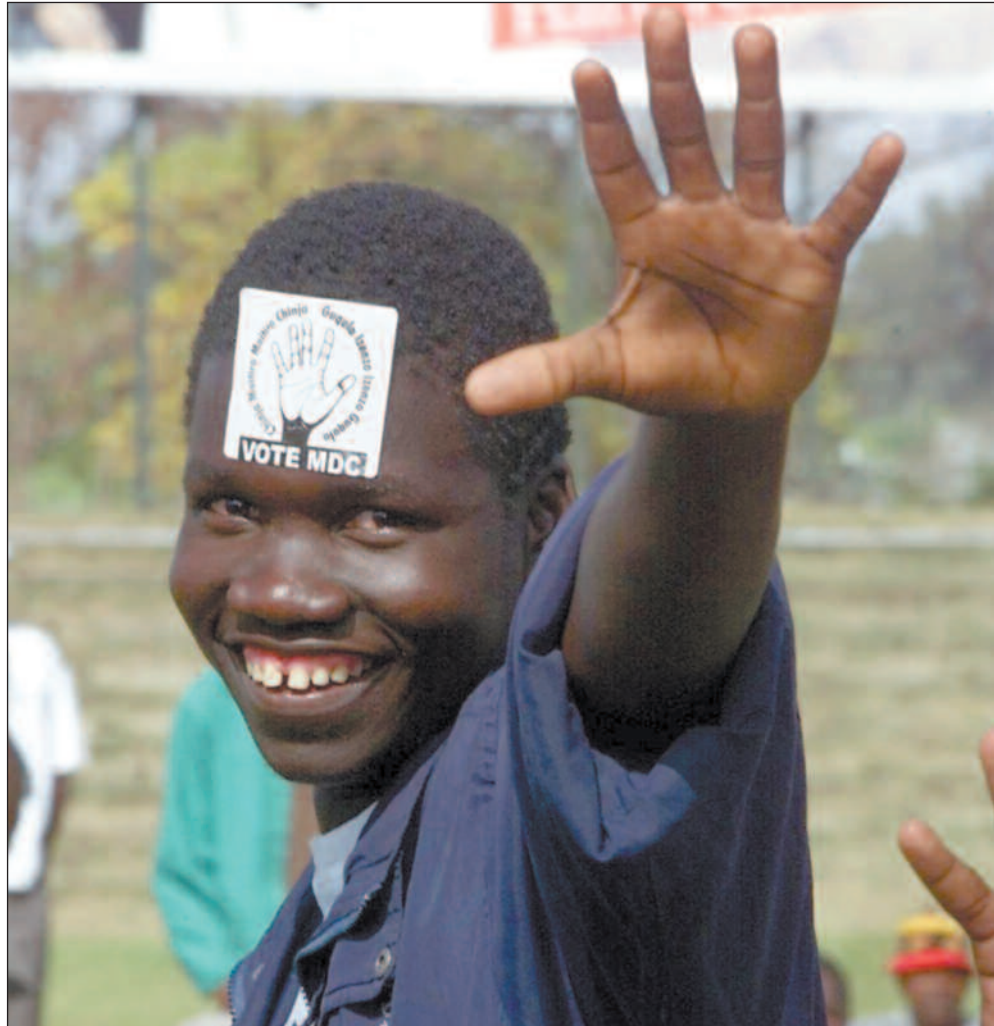
En MDC-tilhenger vinker til fotografen under et opposisjonsmøte på Mucheke stadion i Masvingo sør for Harare 7. mai i år.