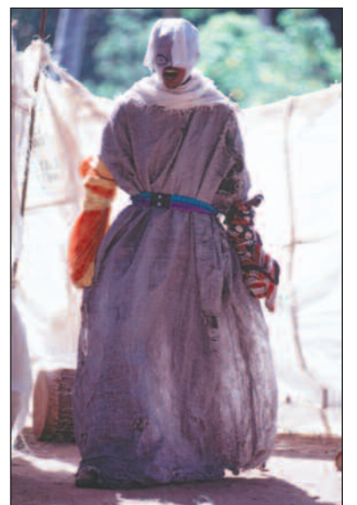
Døden er truende tilstede, for anledningen utkledd i sekkestrie av plast.

Teatergruppene har også et budskap som ungdom kjenner seg igjen i. Rollene i det virkelige liv blir ofte forsterket, for eksempel mann mot kvinne eller gammel mot ung. Sympatien ligger hos de unge, som er sårbare og nysgjerrige. De gamle menn kan bare sitte igjen med sine snusfornuftige fordommer. Nå er det ungdommen som skal reddes.