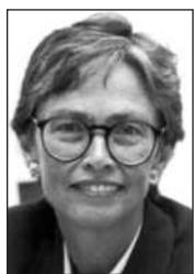
Med GAVI håper vi å skape en ny giv rundt internasjonalt vaksinasjonsarbeid, sier UNICEF-leder Carol Bellamy.

Styret bestemmer. - Jeg ser ingen prinsipielle problemer med å motta penger fra private donorer som Gates Foundation. Poenget er hvem som bestemmer hva som skal gjøres.