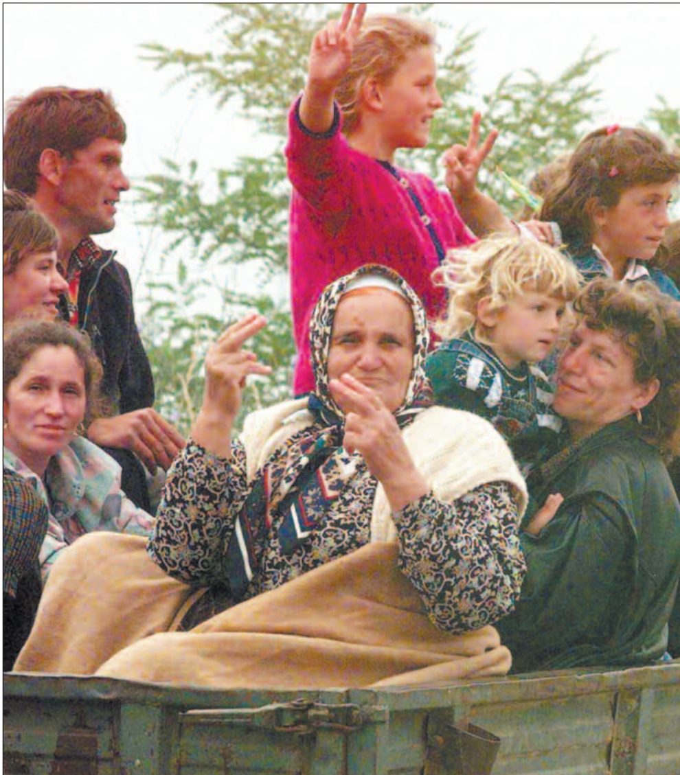
Først betalt vestlige alnd bombene, så gjenoppbyggingen.

Mest til UNHCR. Fordeler man forbruket på organisasjoner er det FNs