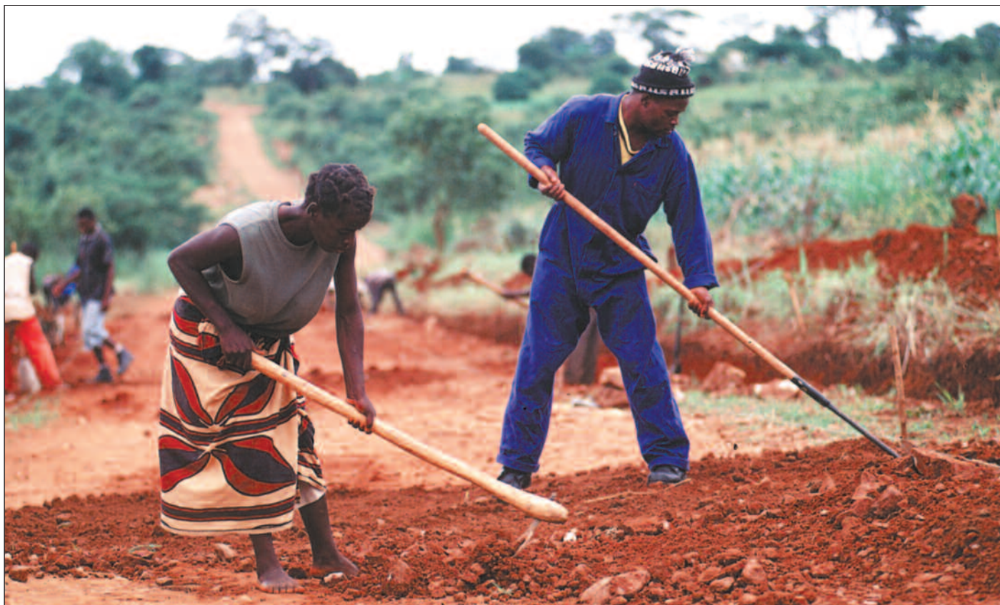
Veibygging og veivedlikehold er velegnet for bruk av arbeidsintensive metoder, mener eksperter i Den internasjonale arbeidsorganisasjonen ILO.

– Andre positive effekter er at kjøp av lokale varer og tjenester ligger omtrent dobbelt så høyt ved