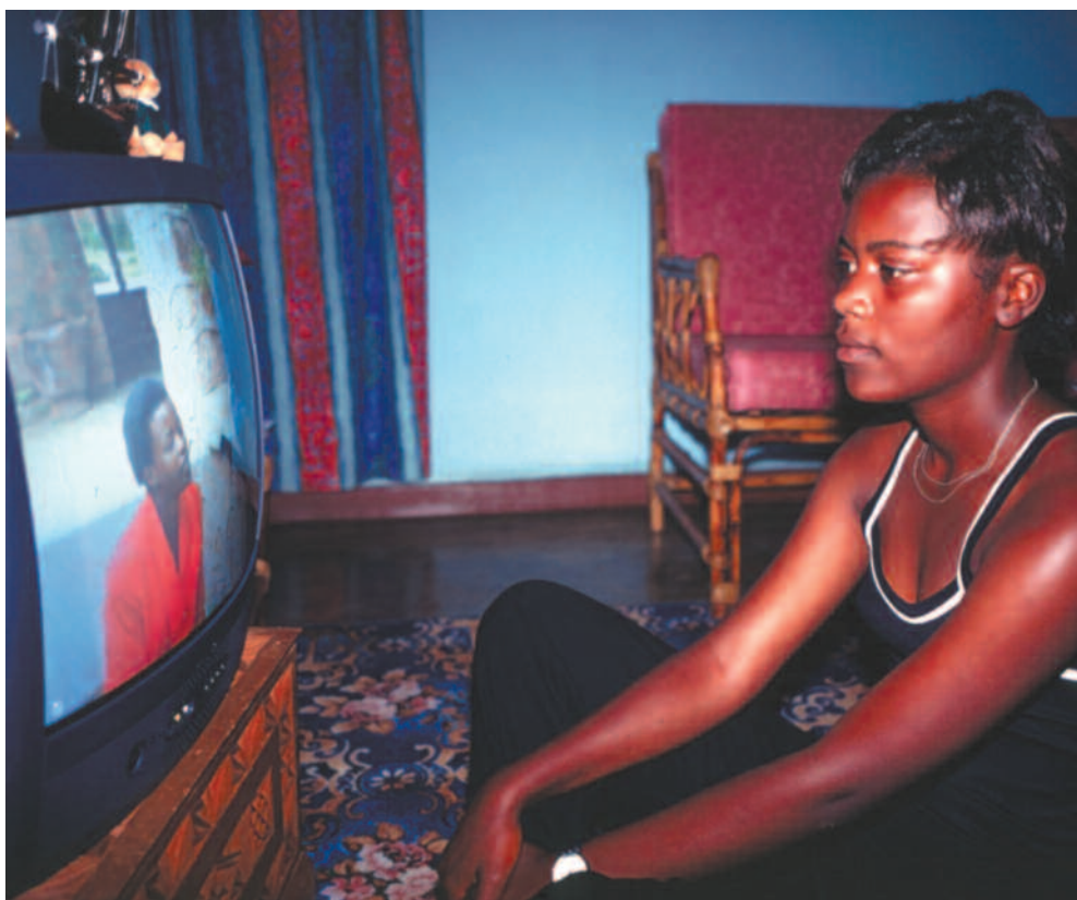
TV Malawi har vært på lufta i ett år. Malawi var ett av de siste land i verden som fikk nasjonalt fjernsyn.

De blir annerledes når de er på fjernsyn, litt alvorlige og selvhøytidelige. De nyter å være i rampelyset,