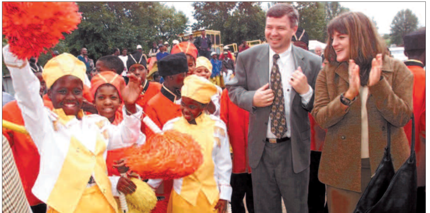
Det er vanskelig å tenke seg at en relasjon som er bygd på en så asymmetrisk ressursflyt, ikke skulle være preget av en betydelig ulikhet i makt, skriver artikkelforfatteren. Bildet er fra tidligere statsminister Kjell Magne Bondeviks besøk i Sør-Afrika i februar i år.

Institusjoner som fungerer etter moderne byråkratiske og demokratiske prinsipper, blir en forutsetning for at NORAD fullt ut skal kunne iverksette sin strategi og leve opp til sine bistandspolitiske idealer. Ved å vektlegge institusjonsbygging