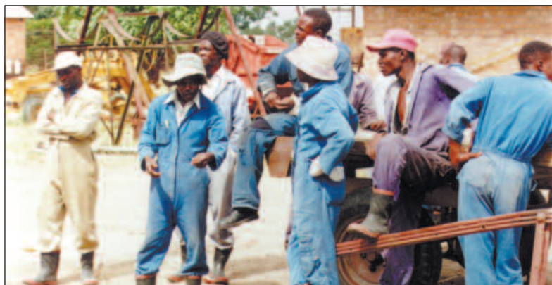
Fra okkupasjonen av Retreat Farm utenfor Harare.

gissel for en utvikling de fleste innbyggerne i landet føler seg ille berørt av.