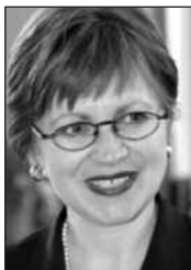
Anne Kristin Sydnes, utviklingsminister.

– I den sammenheng vil det være viktig om det blir gjennomført valg på en fri og demokratisk måte, men vi frykter at det ikke vil skje, utdypet Sydnes til Bistandsaktuelt. Den norske regjeringen har tatt et initiativ overfor FN for å bringe jordreformprosessen i gang etter valget.