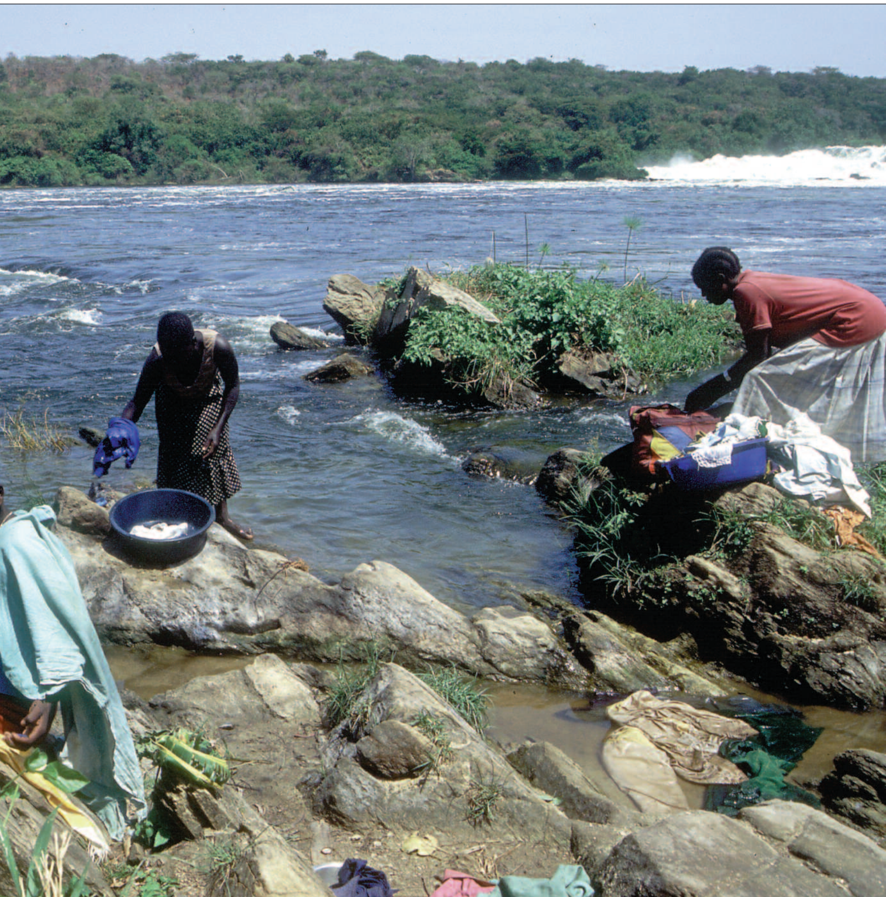
Tenåringsjentene som vasker tøyet sitt i Nilen, er litt usikre på om de kan fortsette å bruke vaskeplassen sin etter utbyggingen. Vannstanden vil synke akkurat her, men bare 100 meter lenger nede i elva skal vannet slippes ut igjen.