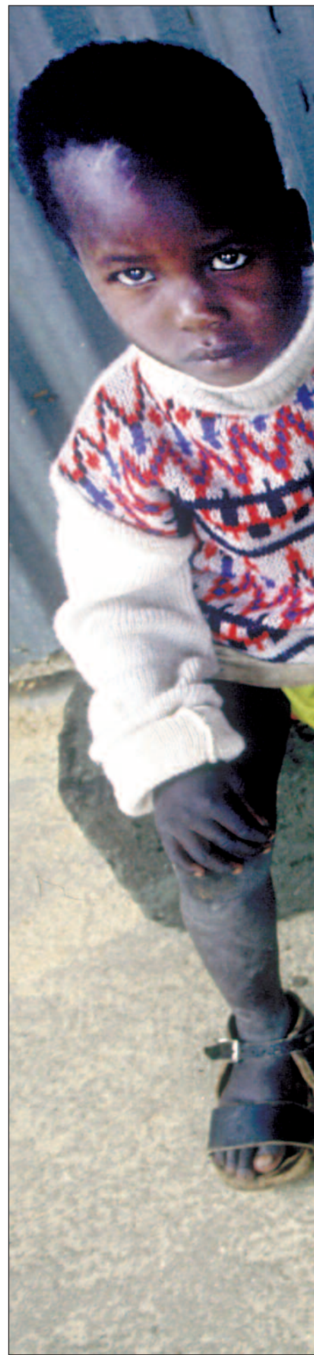
Støtten til ulike helsetiltak i Tanzania er bygget

– For å få en riktig fordeling av de ulike givene på de ulike sektorene, må givene vise stor grad av fleksibilitet, og være villig til å innrette seg etter mottakerens ønsker og behov. Men det er motstand blant givene mot å ta tak i slike problemstillinger. Man velger å følge prioriteringene i sitt eget land heller enn