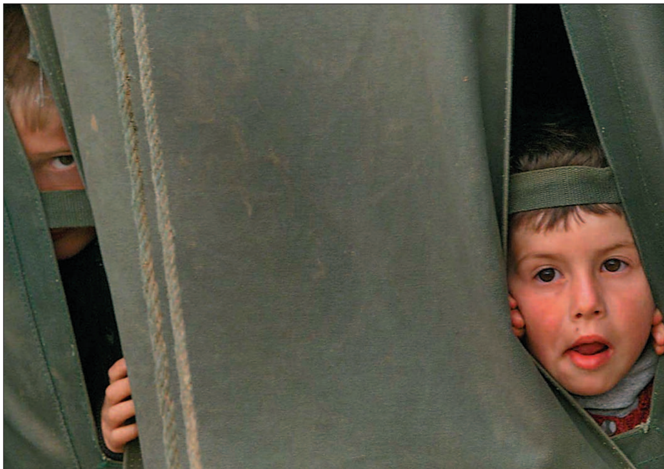
Hjelpeorganisasjonene slåss om å forvalte bistanden til ofrene for flykningetragedien på Balkan.

Hjelpeorganisasjonene slåss om penger til nødhjelp