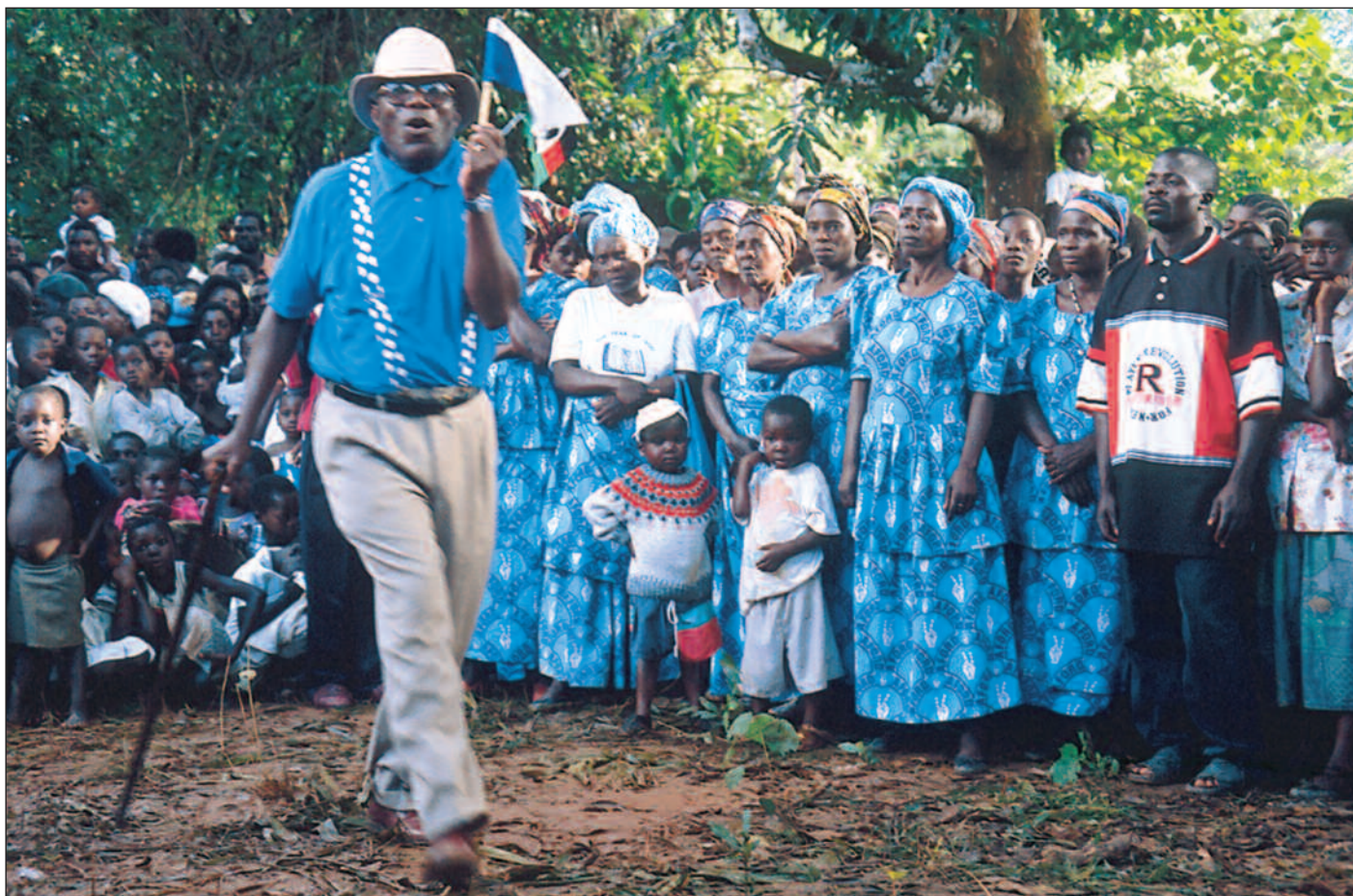
Med flagg i hånd framfører partileder Chakufwa Chihana sitt budskap. I bakgrunnen hvilende dansere kledd i AFORDs farger.

Slitsom valgkamp. Valgkampen startet midt i mars, og har for det meste vært rolig. I hovedsak har den bestått av møter av denne typen. Tilhørerskarene varierer fra noen titalls i de mest griségrende strøk, til