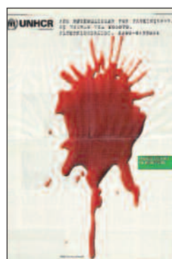
Faksimile fra annonse i Aftenposten 5. mai 1999.

– Det er UNHCR (FNs høykommissær for flyktninger, red.anm.) som her kjører en europeisk kampanje, finansiert av Benetton. Vi ble så spurt om å stille vår giverkonto til disposisjon, og svarte ja – tross at vi visste at Benetton var omstridt. I denne saken overlot vi til UNHCR å kvalitetssikre. Dessuten ville det være rart om UNHCR sa ja, og vi sa nei, særlig av hensyn til den målgruppen man her samlet inn penger til – flyktningene som nå lider i Kosovo.