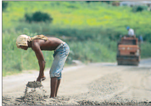
«Mottakeransvar» innebærer blant annet bistand til formål som mottakerne selv har valgt ut. Ofte skorter det på praktisk oppfølging, skriver artikkelforfatteren som kritiserer norsk overstyring.

ANSPORET AV VERDENSbanken har den politiske bistandsledelsen i Norge gjort kampen mot korrupsjon til en ny merkesak. Korrupsjon er ille, og det gis mye av den i Tanzania, selv om det aller meste er «nødkorrupsjon», og selv om jeg ikke uten videre kjøper påstanden fra «Transparency International» om at landet er det fjerde verste i verden i så måte. Når Bistandsaktuelt fortal-