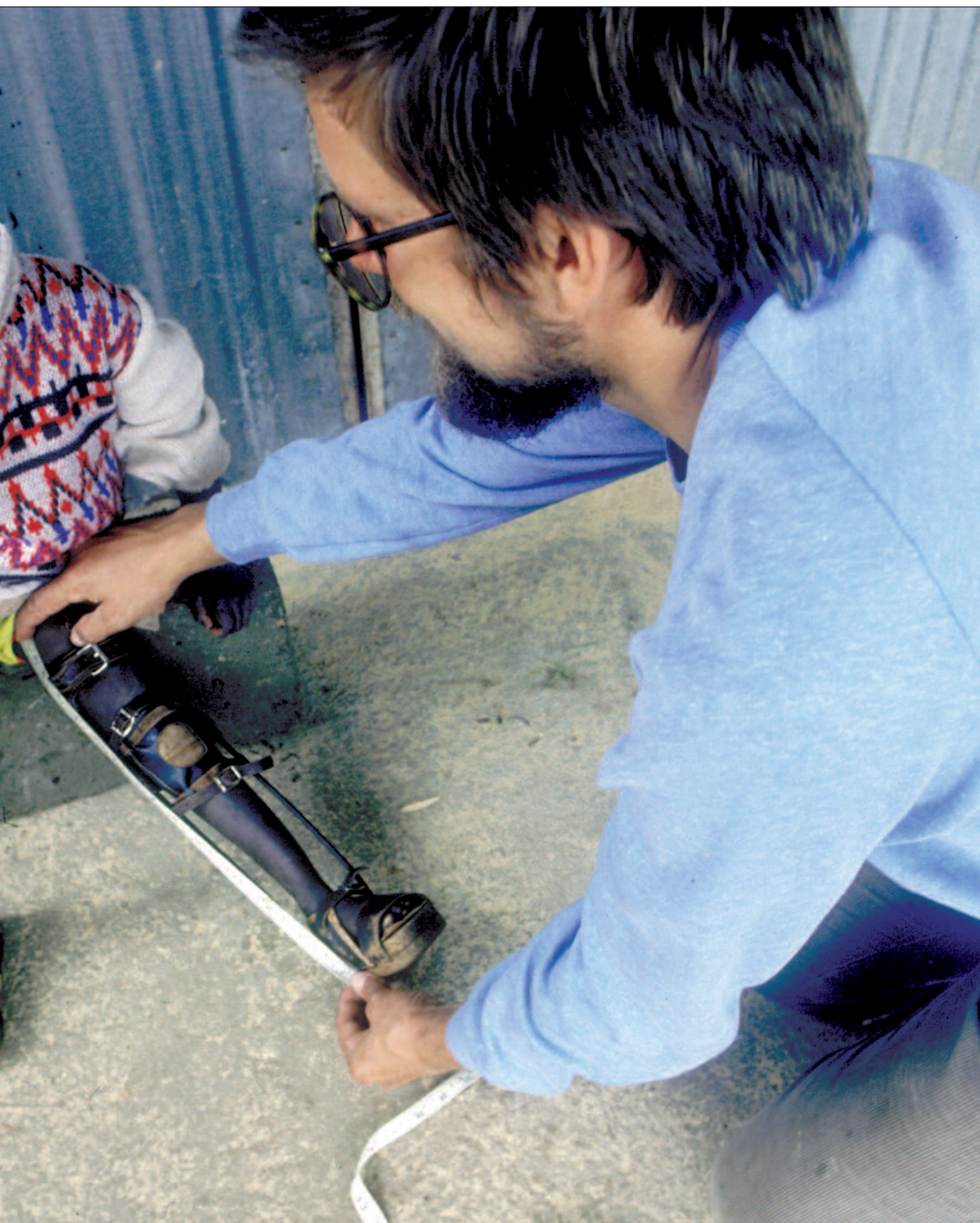
...t ned de siste årene. Men fortsatt må det ryddes kraftig opp i bistanden, mener ECON.