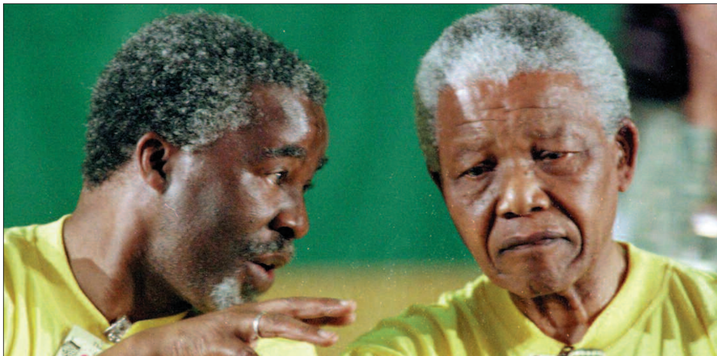
Den praktiske utformingen av sørafrikansk politikk er for lengst overtatt av Mandelas etterfølger, Thabo Mbeki, skriver forfatteren.