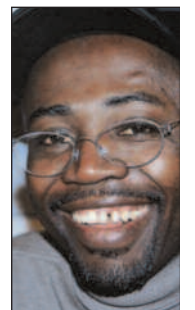
Tanzanierenen Godfrey Mwampembwa , bedre kjent som «Gado», er en av Afrikas mest profilerte karikaturtegnere. Han tegner blant annet for den uavhengige kenyanske avisen Daily Nation .