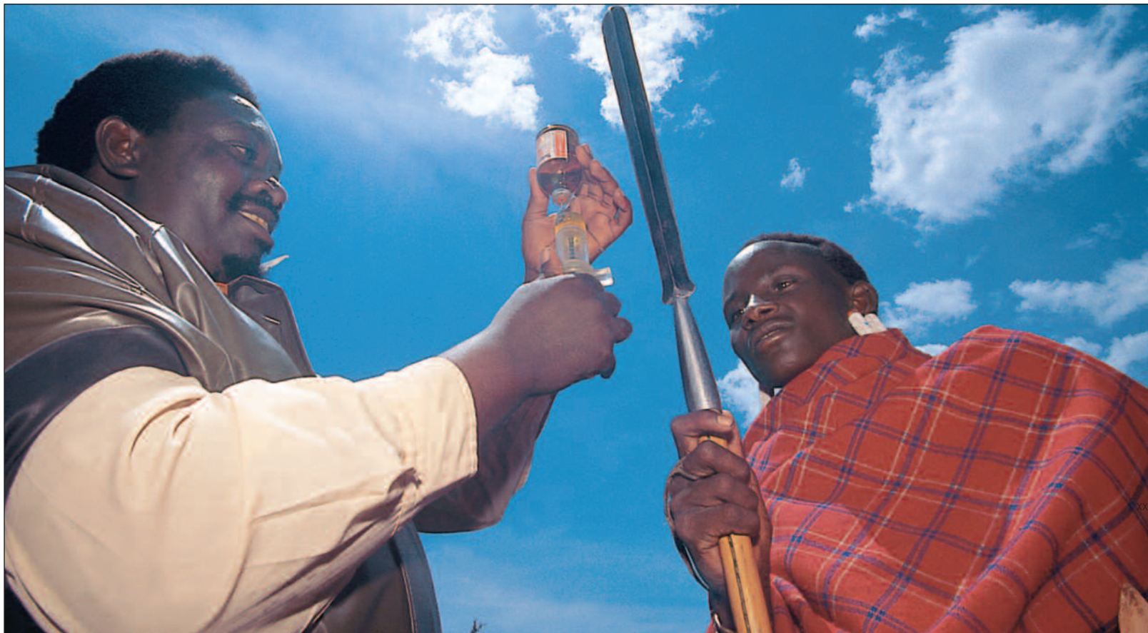
Vaksinasjon av masaienes kveg er et av de cirka 300 tiltakene Norge har støttet i Tanzania i perioden 1994-97.