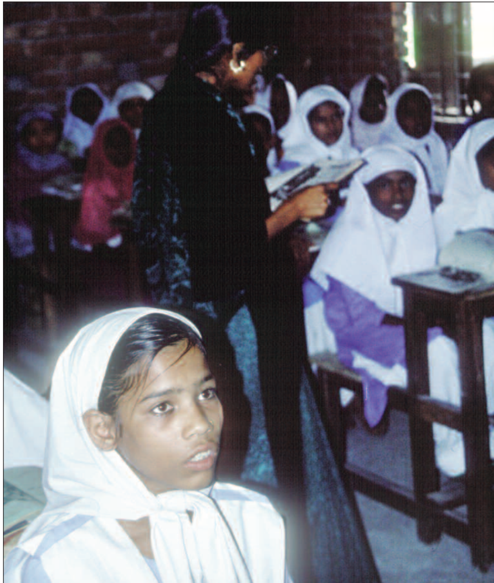
I dag kommer ca 92 prosent av ungene i Bangladesh til skolen hver dag, og fortsatt øker antallet.

– Mange av elevene er trøtte når de kommer på skolen. Enten de hjelper sine foreldre på markene eller