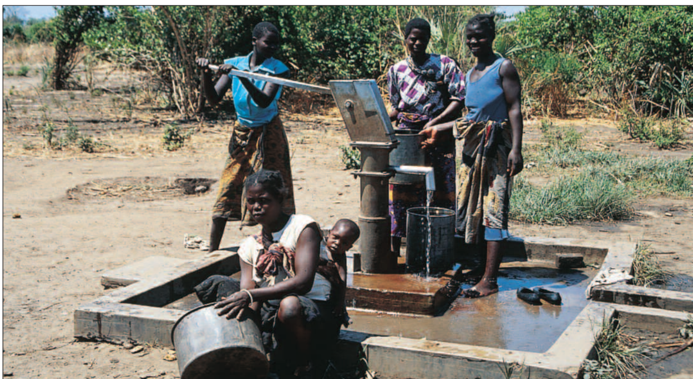
Verdensbanken har satt i gang en rekke reformprogrammer uten å skjule til hva dette innebærer for de fattigste, hevder forskere fra CMI.