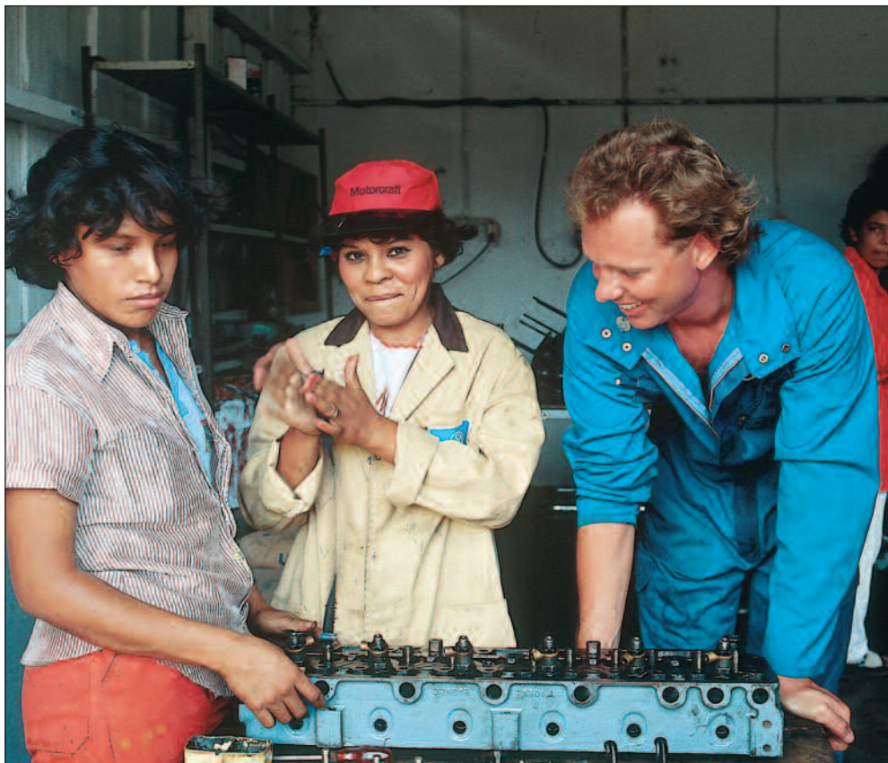
Norsk fredskorpsdeltaker i Nicaragua.

I 1987 fagorganiserte fredskorpsdeltakere seg i NTL og startet lønnskamp. To år seinere var den første