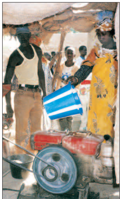
Kvinnene i Kirchamba har investert i en mølle og slipper å bearbeide risen manuelt. Maskinen sparer dem for mange timers arbeid.