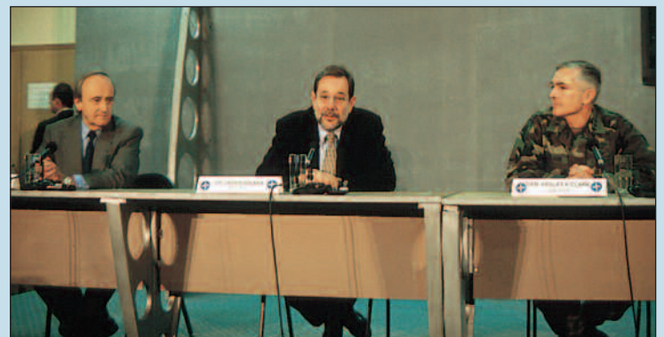
«Kongene» av Bosnia-Hercegovina. Fra venstre Den internasjonale samfunns fremste representant i Bosnia Carlos Westendorp, NATO-sjef Javier Solana og NATOs militære nøkkelperson general Wesley Clark.

Dagens arbeidsløshet beregnes til 64 prosent og utgjør 900 000 mennesker.