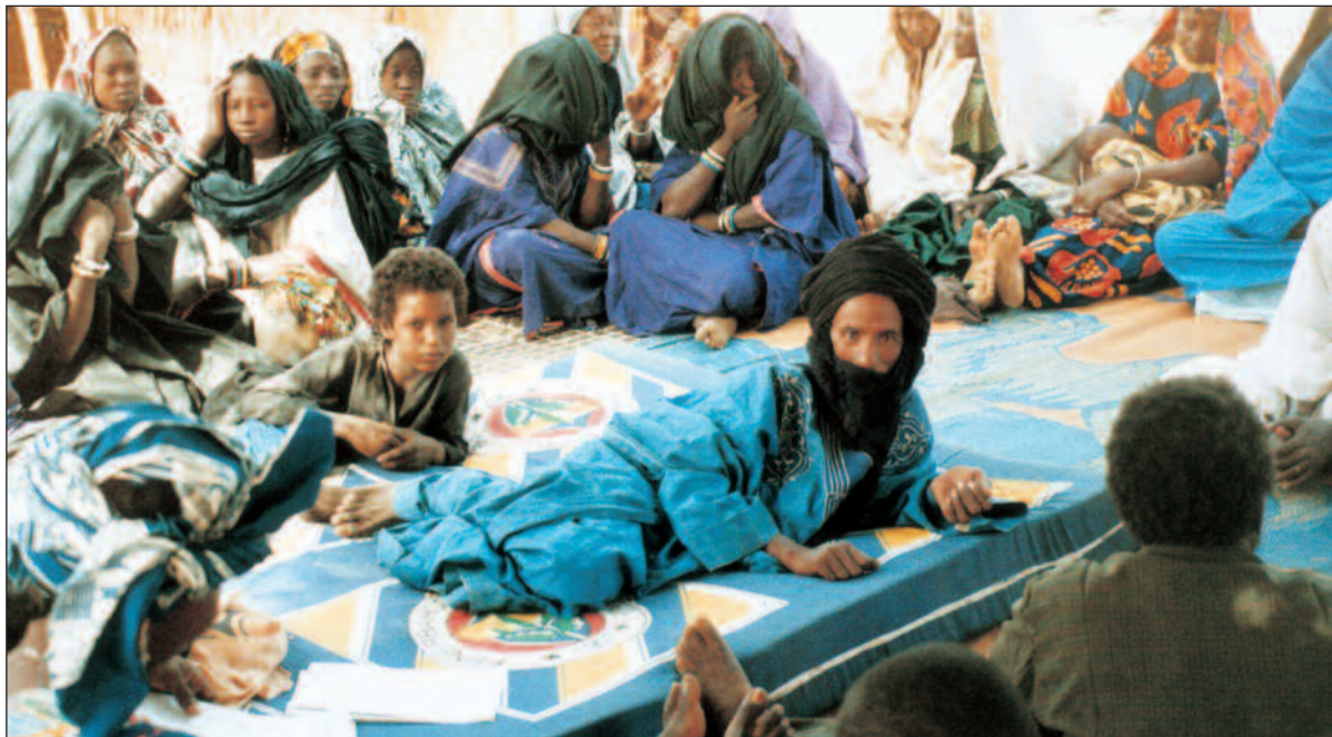
Under et skyggefullt tre sitter landsbyboerne i Kadagou diskuterer nye ord som demokrati, lokalvalg og kommuner.

KN valgte å bli i Gourma under borgerkrigen, mens de andre bistandsorganisasjonene evakuerte området. Avgjørelsen om å arbeide videre i landet var i begynnelsen omstridt. KN-personalet ble utsatt for store påkjenninger. Ved to anledninger, i 1992 og -95, ble tilsammen