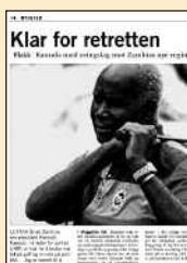
Klar for retretten

Flak: Kaunda med støtte fra Zambias nye president.