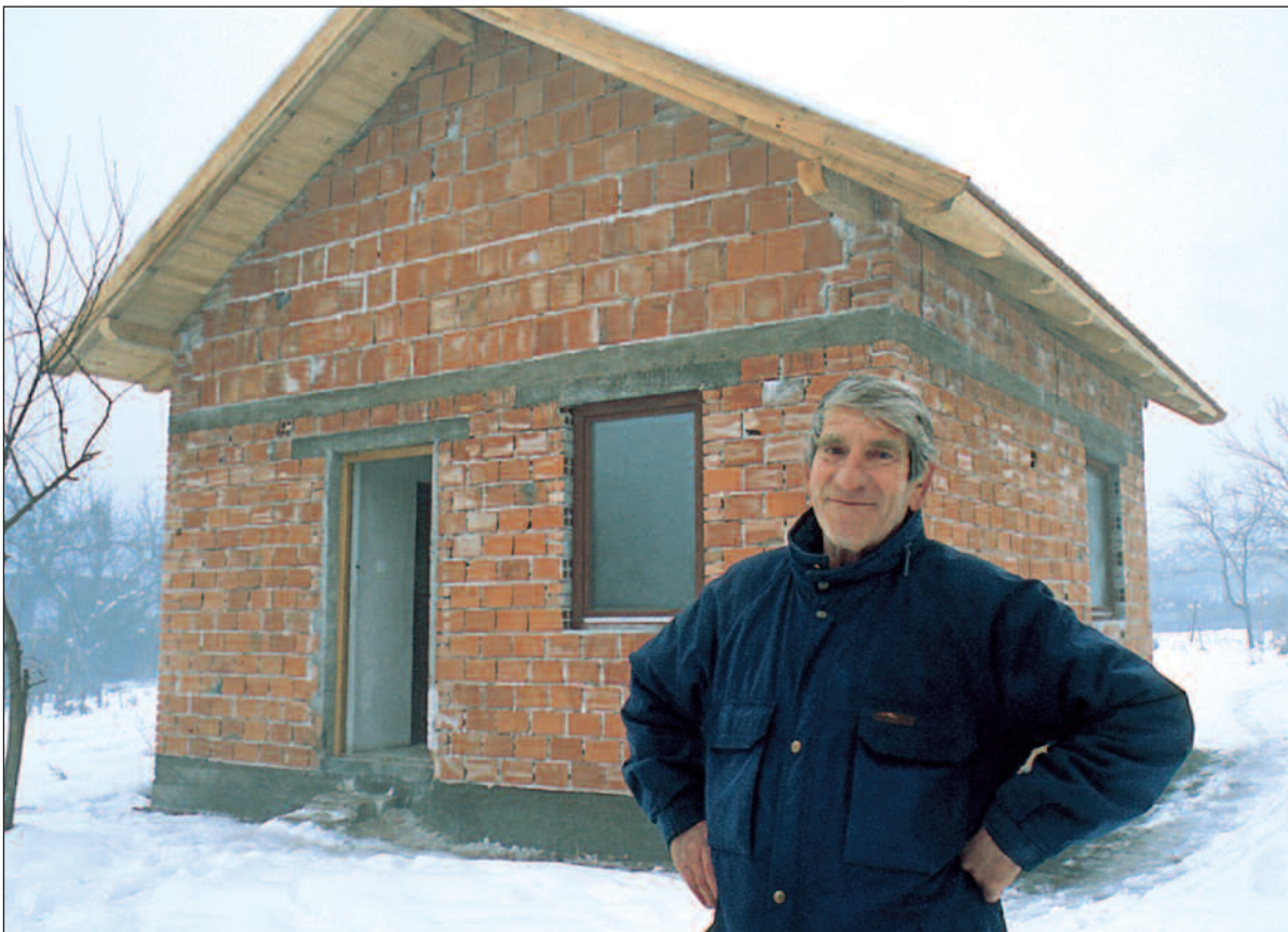
Et hus bygd av Flyktningerådet for en tilbakevendt eldre muslim ved serbisk-kontrollerte Prijedor.

Det siste store møtet i denne serien - Peace Implementation Council i Madrid 15.-16. desember 1998 -