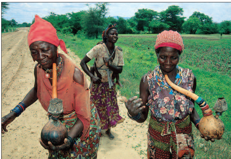
Det er ikke marihuana som blir røkt i disse pottene, men en blanding av tobakk og pulveriserte frø, fremholder tongane.