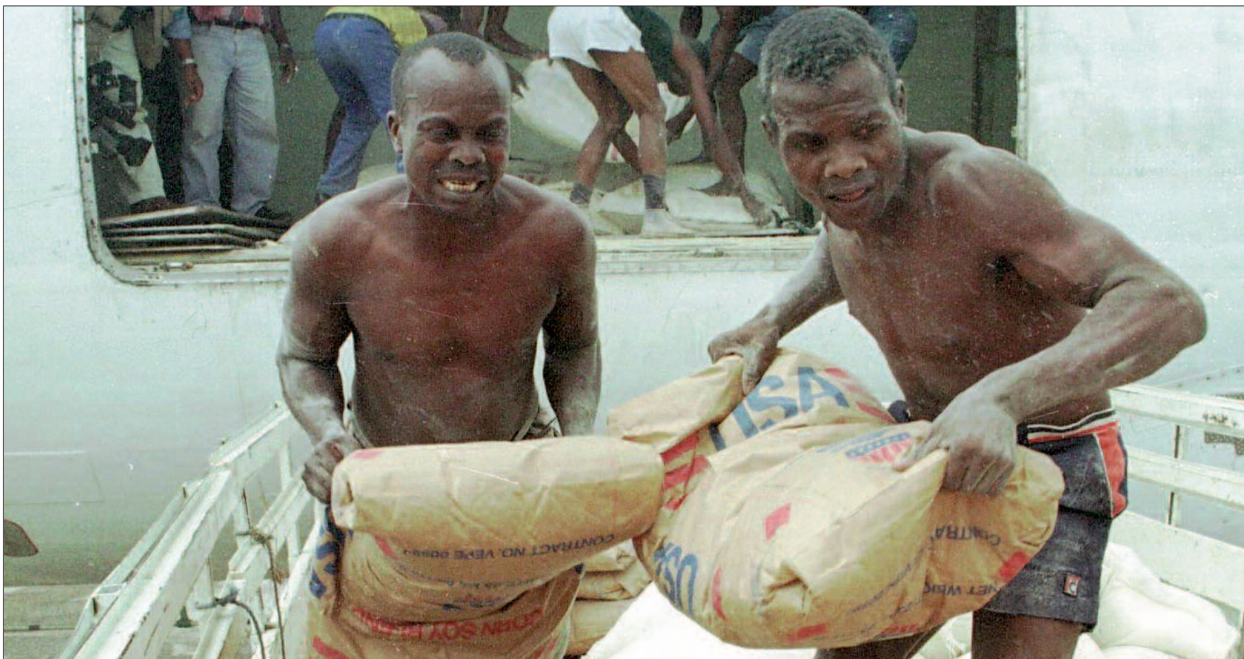
Angolanske arbeidere laster hjelpeforsyninger fra FN-organisasjonen World Food Program.