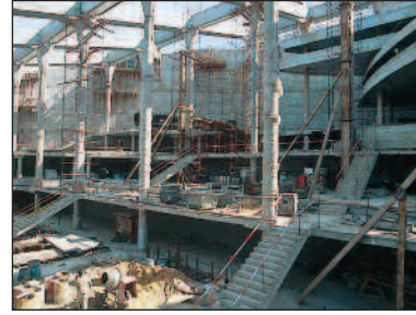
Det er dimensjoner over Alexandrias nye praktbygg.