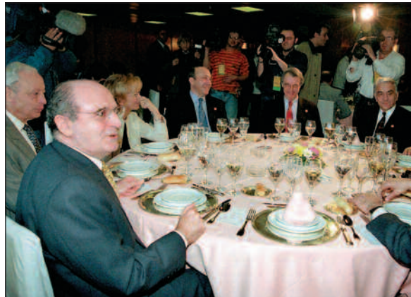
Giverland i diskusjon om Bosnias framtid i Madrid, desember 1998.