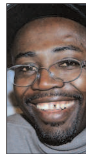
Tanzanianeren Godfrey Mwampembwa, bedre kjent som «Gado», er en av Afrikas mest profilerte karikaturtegnere. Han tegner blant annet for den uavhengige kenyanske avisen Daily Nation.