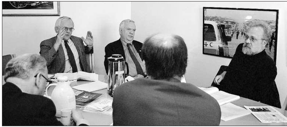
Hjelpeorganisasjonene må også se på seg selv. Patriarkalske organisasjoner signaliserer ikke likestilling, skriver artikkelforfatteren.

enighet om at likestilling mellom kjønnene er et bidrag til og en forutsetning for bærekraftig utvikling. Dette ser også de fleste norske bistandsarbeidere helt klart. Problemet er å vite hvordan en i praksis bidrar til likestilling. De land vi har bistandssamarbeid med har ofte kvinneundertrykkende tradisjoner. Det er stor enighet om at kvinnene skal med i såvel planlegging som gjennomføring av prosjekter, men i praksis er det vanskelig. Kvinner har ofte nok med å sørge for mat til seg selv og familien og lite tid til å diskutere demokrati og deltagelse. De er heller ikke vant til å tenke på seg selv og på egne behov og vil ofte ha vanskelig for å uttrykke hva slags endringer de ønsker. I hvert fall hvis det er snakk om behov utover det som vil lette den daglige børa.