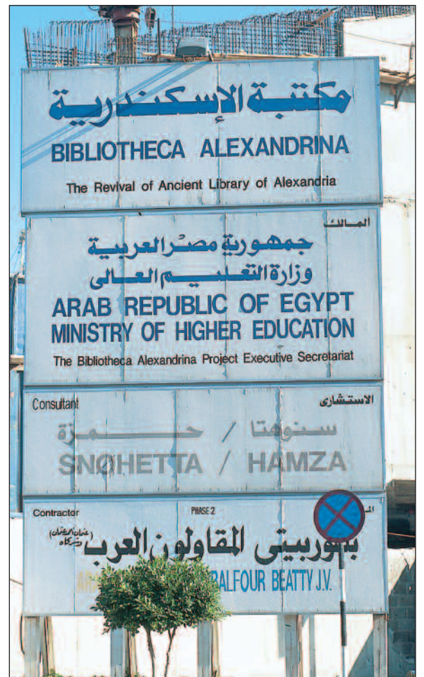
Snøhetta er en godt synlig aktør i Alexandria-prosjektet.