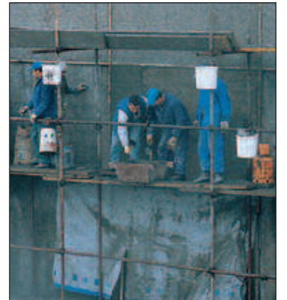
Et sportsanlegg fra Sarajevo-OL i 1984 gjenoppbygges etter krigsskadene.

Mer enn 200 utenlandske organisasjoner deltar i gjenoppbyggingen, og bare i Sarajevo skal det være 12 000 ansatte hos disse.