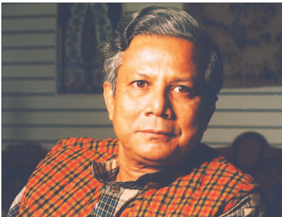
«Faktisk blir hele 98 prosent av våre lån tilbakebetalt, fordi de fattige vet at dette er den eneste muligheten de har til å bryte ut av fattigdommen», skriver Mohammad Yunus i denne artikkelen.

– Det kommer an på. Noen ganger krever de 10 prosent i uka. Jeg har en nabo som betaler 10 prosent dagen.