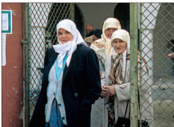
De første muslimer kommer tilbake til Vest-Mostar 11. desember 1998, nesten på dagen tre år etter Dayton.

- Vi vil gjerne motta bistand til å bygge hus, men for øvrig kan vi klare oss selv. Vi kan selv ordne valgene. Også SFOR kan reise hjem, det er vår mening.